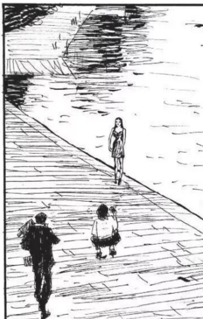
Modella sulla Darsena, 2017.