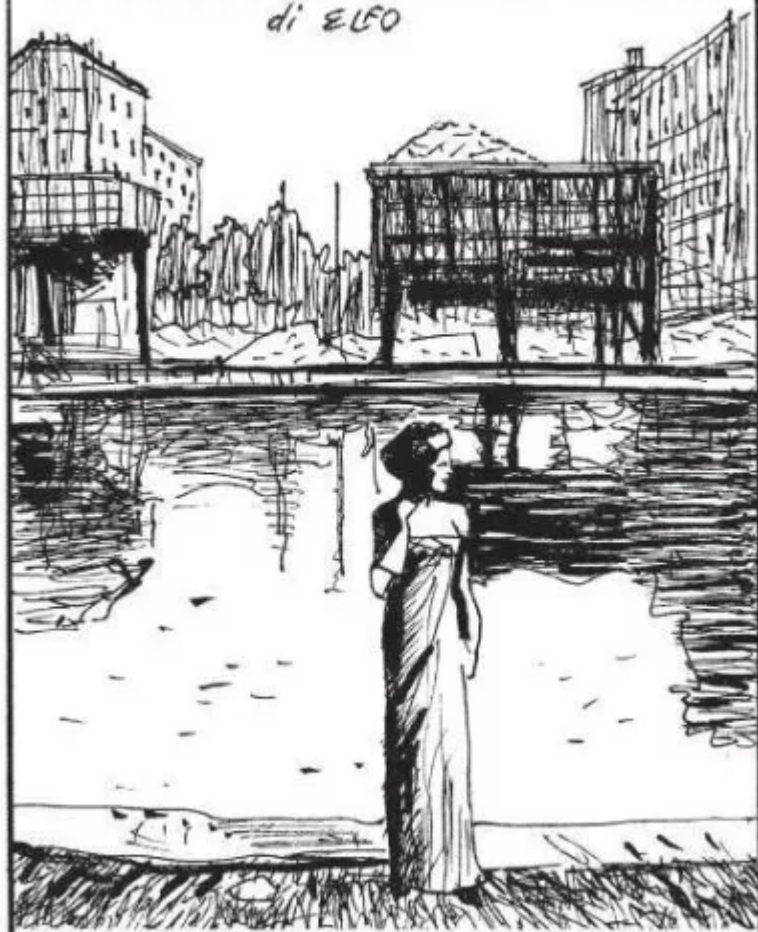
Milano. Da una foto di Ugo Mulas. Modella sulla Darsena, 1958.