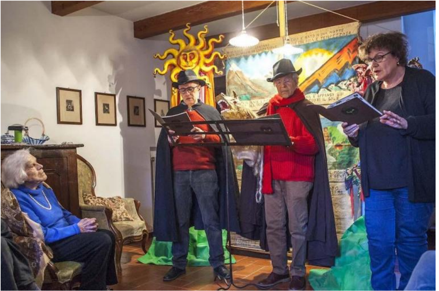
Auguri di Capodanno sull'Alto Appennino Reggiano, ph. Maurizio Conca.

viaggio della Vita. Cos'altro piano piano si fiorisce, si va da una parte o dall'altra, si capisce chi si è.