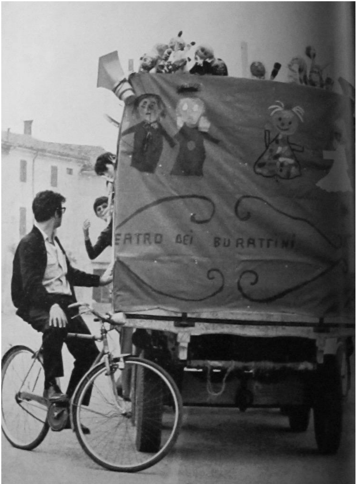
â??Quattordici azioni per quattordici giorni a Sissâ?•