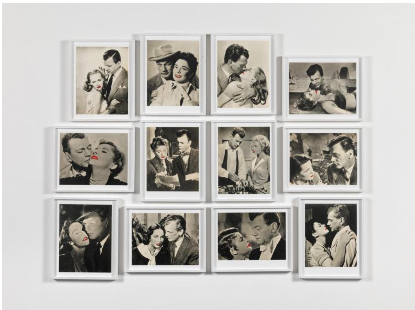
Joachim Schmid, Estrelas amadas , 2013, dettaglio, courtesy of P420.

SB, MZ: Nel suo articolo “The Electronic Photographer Is Coming” (1985) analizzava l’impatto di scrittura e reti informatiche sulla produzione, sulla distribuzione e sul significato stesso delle fotografie in relazione alla “distruzione del reale”. Quale crede sarà l’evoluzione della fotografia alla luce dell’altissimo livello di condivisione di immagini in rete da parte dell’ homo photographicus ?