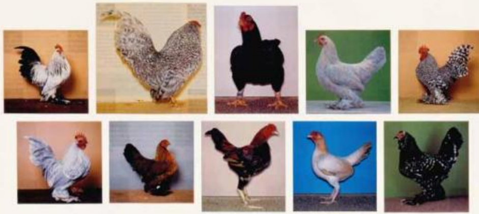
Joachim Schmid, Archiv 606 , 1994, courtesy of the artist.

SB, MZ: La sua fotografia Ã come un testo composto da numerose citazioni senza autore, ma in questa sorta di â?copia e incollaâ?• Lei classifica, organizza. In un certo senso la sua fotografia Ã pensabile non secondo uno stile, ma dettata da una o piÃ¹ logiche. Si potrebbe affermare che la catalogazione Ã uno stile? O che Lei crei delle sotto-categorie o derivazioni da generi o categorie di soggetti â?ben consolidatiâ?• Come articola questa scrittura per immagini, soprattutto quando lavora con immagini della rete, in cui la casualitÃ dellâ?incontro Ã meno imprevedibile rispetto alla fotografia analogica?