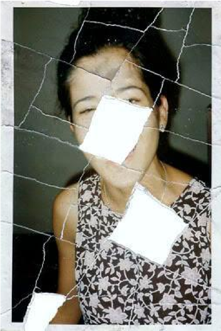
Joachim Schmid, Bilder von der Strasse n°629, Berlino, novembre 1999, courtesy of P420.

di questi modelli vengono ora incorporati nel software e nell'hardware. Gli utenti della videocamera non hanno più bisogno di alcuna conoscenza, nemmeno la minima parte per imitare ciò che hanno visto prima. Di conseguenza avremo più immagini che assomigliano ad altre immagini e sarà più difficile fare fotografie "cattive". La maggior parte dei consumatori è probabilmente contenta di questo. Finalmente è vero, la macchina fotografica fa le foto, non la persona dietro la macchina. Ora siamo tutti fotografi, ma i fotografi non servono più.