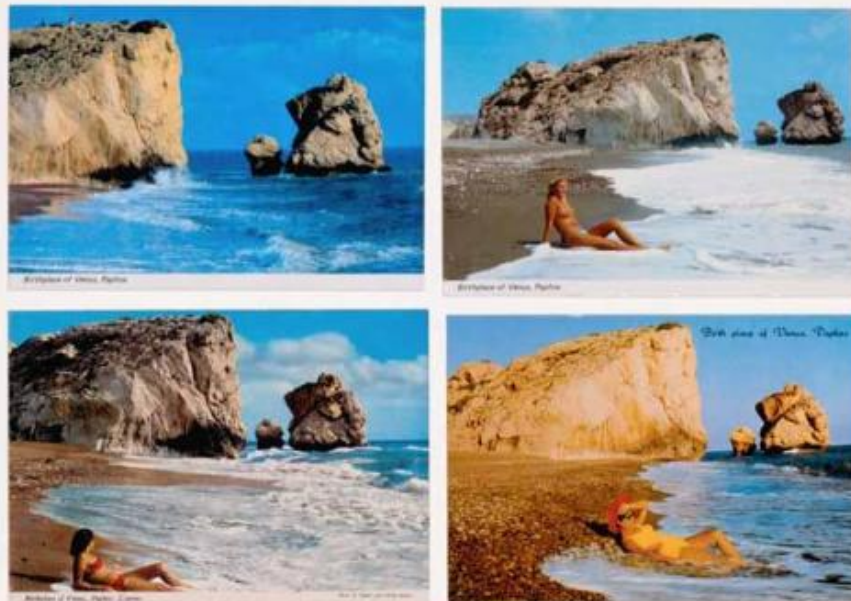
Joachim Schmid , Archiv 1, 1986, courtesy of the artist.

Cosa direi oggi? Temo che non abbia importanza. Il che non significa che non mi verrÃ in mente qualcosa anche domani.