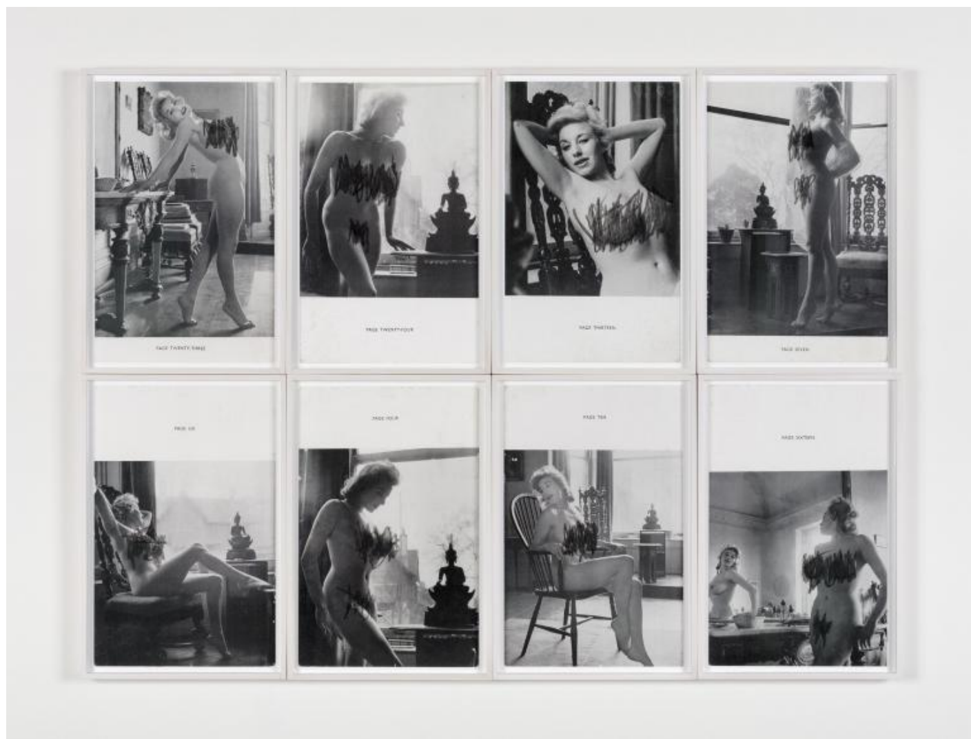
Joachim Schmid, The Artist's Model, 2016

Sara Benaglia, Mauro Zanchi: Nel 1989 Lei ha dichiarato «Nessuna nuova fotografia finché non siano state utilizzate quelle già esistenti!». Questa «ottica ecologica» in un contesto in cui la proliferazione di immagini è iper-accelerata come ha cambiato il suo modo di pensare la fotografia, anche dei grandi autori? Perché qualche anno più tardi ha affermato «Per favore non smettete di fotografare»? E che cosa direbbe oggi?