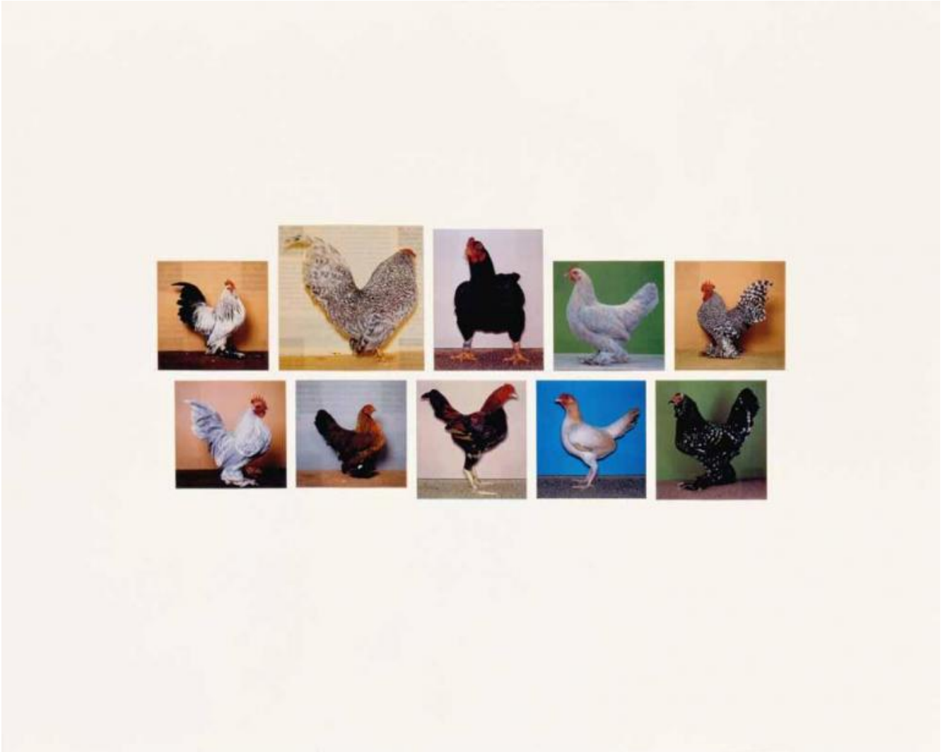
Joachim Schmid, Archiv 606, 1994, courtesy of the artist.

state fatte "nello stile di", ma trovare equivalenti che in realtà erano state fatte nello stesso luogo o che avevano qualche altra somiglianza si è rivelato molto più difficile del previsto. Quindi il libro che ne è risultato è tanto un rifacimento del libro storico quanto un documento del mio fallimento.