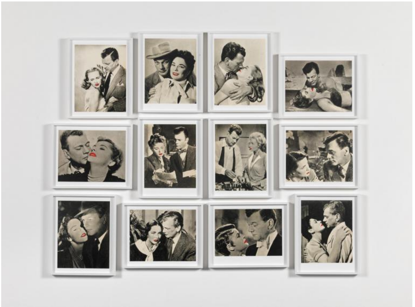
Joachim Schmid, Estrelas amadas , 2013, dettaglio, courtesy of P420.

SB, MZ: Nel suo articolo "The Electronic Photographer Is Coming" (1985) analizzava l'impatto di scrittura e reti informatiche sulla produzione, sulla distribuzione e sul significato stesso delle fotografie in relazione alla "distruzione del reale". Quale crede sarà l'evoluzione della fotografia alla luce dell'altissimo livello di condivisione di immagini in rete da parte dell' homo photographicus ?