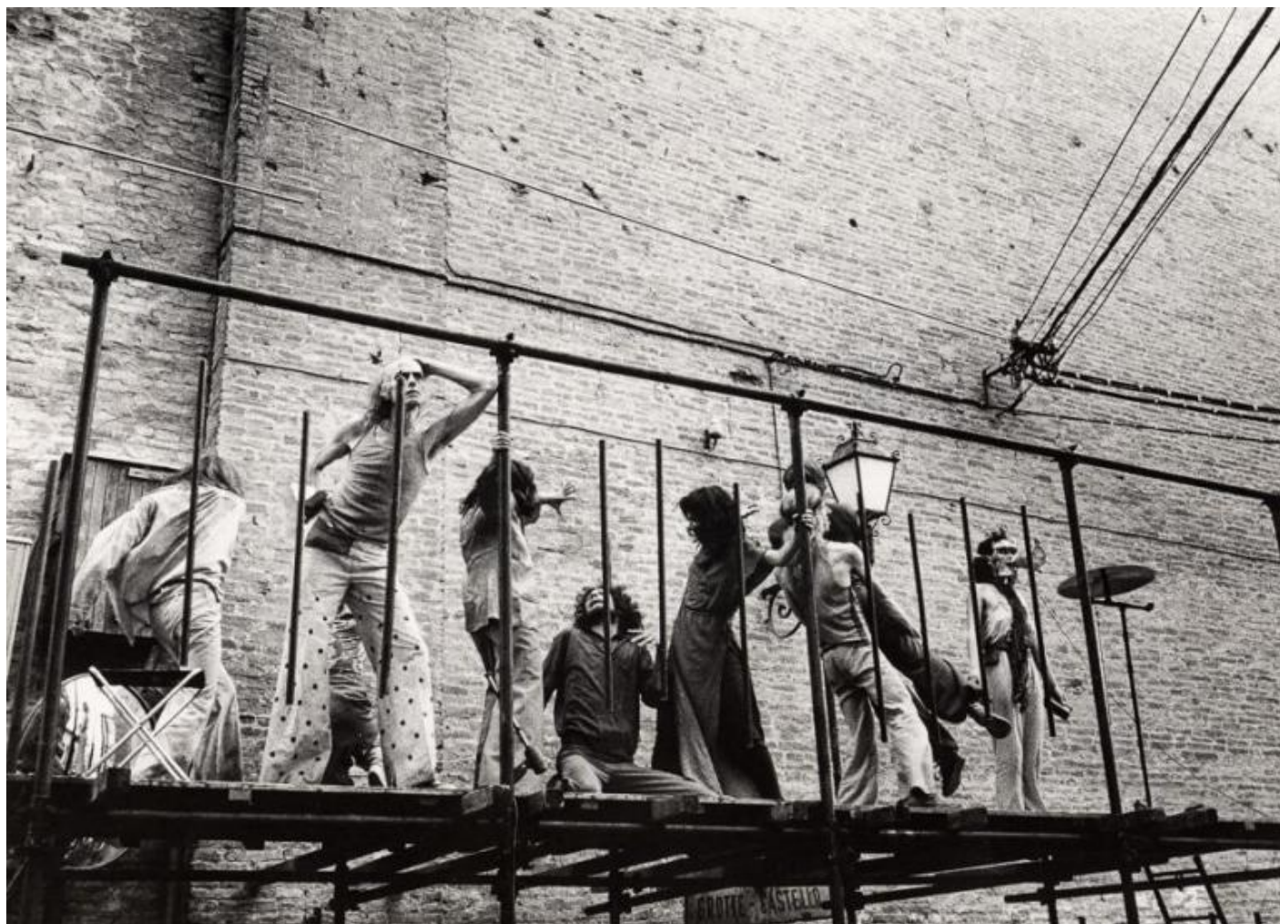
1980 - Il Living Theatre allo Sferisterio.