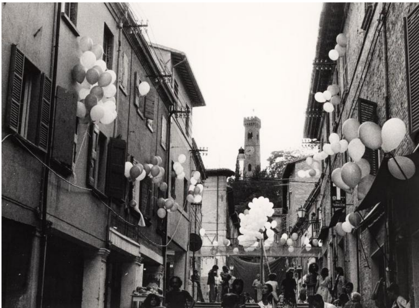
1978 – Il teatro in verticale, dall’archivio del Festival.