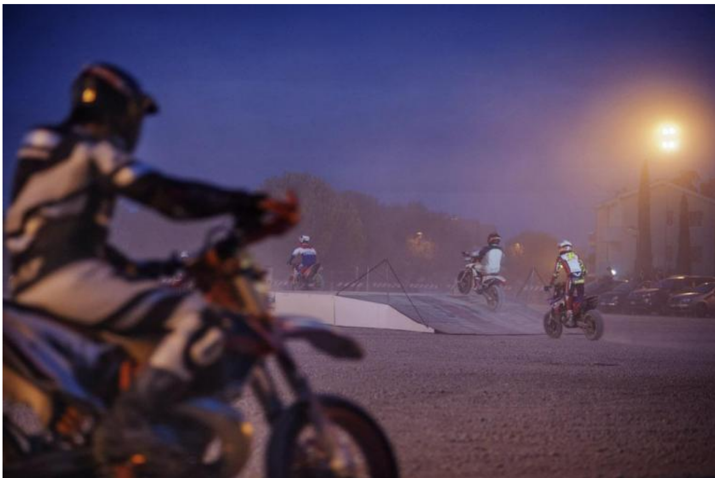
2020 – Zapruder, Anubi III.

Intanto, un po' più tardi, nel 2021, arriverà anche un libro sui cinquanta anni del Festival. Curato da Roberta Ferraresi, che scrive la parte storica, anche questo nasce dall'esame dell'archivio e si sviluppa seguendo l'alternarsi delle direzioni artistiche. Sarà articolato, anch'esso, come una polifonia di voci. Ci anticipa la curatrice: "Ogni capitolo su una direzione artistica sarà accompagnato da molte immagini (foto e documenti faranno circa a metà col testo); sarà contrappuntato da box di citazioni, soprattutto non teatrali, sul periodo preso in esame per rendere conto del contesto politico, sociale, culturale; sarà intervallato da materiali di altra natura: testi critici a firma altrui, 'tavole sinottiche', info-grafiche su temi trasversali come il fundraising, la grafica ecc., tabelle generali con, per esempio, i numeri delle presenze degli spettatori e i budget, testimonianze sul Festival da parte di operatori ecc. ecc.».