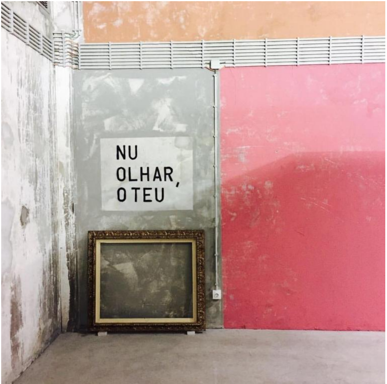
Catedral, Centro de Arte de São João da Madeira, 2016.

Non gli sono mancati i riconoscimenti. Alla Biennale di Venezia del 1984 Barrias rappresenta il Portogallo con "Nottiario". Alla Triennale di Milano del 2014 presenta "Ombra delle cose future", tema "teologico" paolino laicamente tradotto in un'arca che raccoglie e salva gli oggetti del paesaggio mediterraneo.