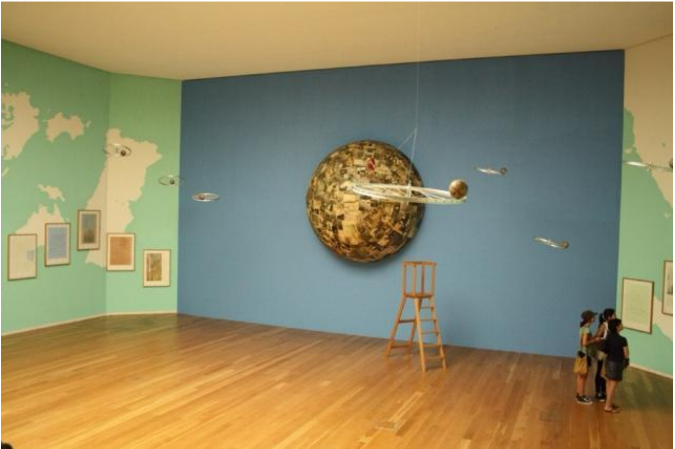
In itinere, Sala dos Mapas, Fundação de Serralves, Porto, 2011.