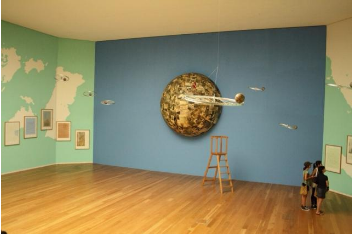
In itinere, Sala dos Mapas, Fundação de Serralves, Porto, 2011.

L'opera di Barrias è dichiaratamente letteraria, a volte scritta su pareti, più spesso pensata per simboli. Il tema dei passaggi è ispirato dal Walter Benjamin dei "Passages di Parigi", le architetture commerciali-creature di sogno della collettività che qui sono tradotte in labirinti e percorsi. Nella mostra di Serralves un percorso di frontiera, la Camera Chiara, conduce all'Apertura. È un tema benjaminiano, come dimostra il testo di Barrias che accompagnava quella mostra: "Avanti viaggiatore, osserva, guarda le rovine che ti accerchiano. Senti nelle tue ali la tempesta che ti spinge inesorabilmente verso il futuro?... Apri le tue ali e avanza, viaggiatore! Tu non potrai più tornare. Tu non potrai evitare la grande tempesta che soffia dal paradiso".