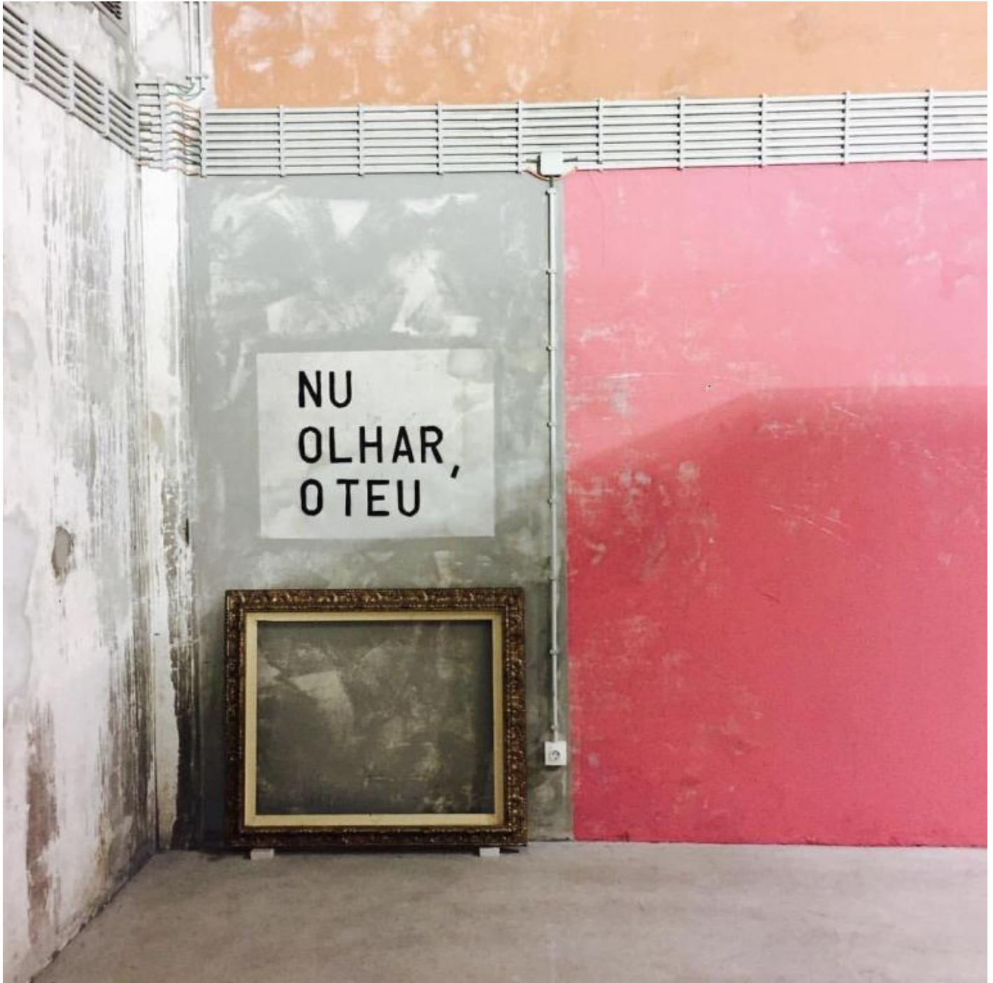
Catedral, Centro de Arte de São João da Madeira, 2016.

Non gli sono mancati i riconoscimenti. Alla Biennale di Venezia del 1984 Barrias rappresenta il Portogallo con “Nottiario”. Alla Triennale di Milano del 2014 presenta “Ombra delle cose future”, tema “teologico” paolino laicamente tradotto in un’arca che raccoglie e salva gli oggetti del paesaggio mediterraneo.