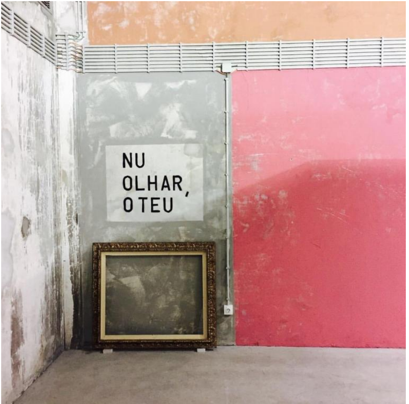
Catedral, Centro de Arte de São João da Madeira, 2016.

Non gli sono mancati i riconoscimenti. Alla Biennale di Venezia del 1984 Barrias rappresenta il Portogallo con "Nottiario". Alla Triennale di Milano del 2014 presenta "Ombra delle cose future", tema teologico paolino laicamente tradotto in un'arca che raccoglie e salva gli oggetti del paesaggio mediterraneo.