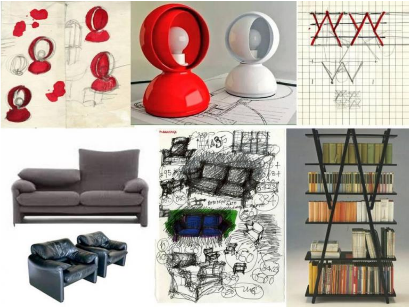
Vico Magistretti, schizzi per lampada Eclisse; lampada Eclisse (Artemide, 1965, Compasso d'Oro 1967); schizzo per libreria Nuvola Rossa, libreria Nuvola Rossa (Cassina, 1977); Poltrone e divano Maralunga (Cassina, 1973, Compasso d'oro 1979); schizzo di progetto per divano e poltrona Maralunga.

Di pezzi di design ne ha progettati moltissimi e tanti sono divenuti dei must, fin dal suo primo, del 1959-1960, la famosa sedia Carimate (prodotta da Cassina), concepita come arredo del Golf club che egli aveva da poco realizzato nella ridente località brianzola (con Guido Veneziani). Seguirono poi la lampada Eclisse (Artemide, 1965, Compasso d'Oro 1967), la sedia Selene (Artemide, 1969), la sedia Golem (Poggi, 1969), il divano Maralunga (Cassina, 1973, Compasso d'oro 1979), la lampada Atollo (Oluce, 1977, Compasso d'oro 1979), la libreria Nuvola Rossa , (Cassina, 1977), la sedia Pan (1980, Rosenthal Studio Line), il tavolo Vidun (De Padova, 1986), la sedia Silver (De Padova, 1988) ed altri, il cui elenco sarebbe davvero troppo lungo (per una conoscenza della sua intera produzione, sia architettonica che di design, si rimanda al sito della Fondazione).