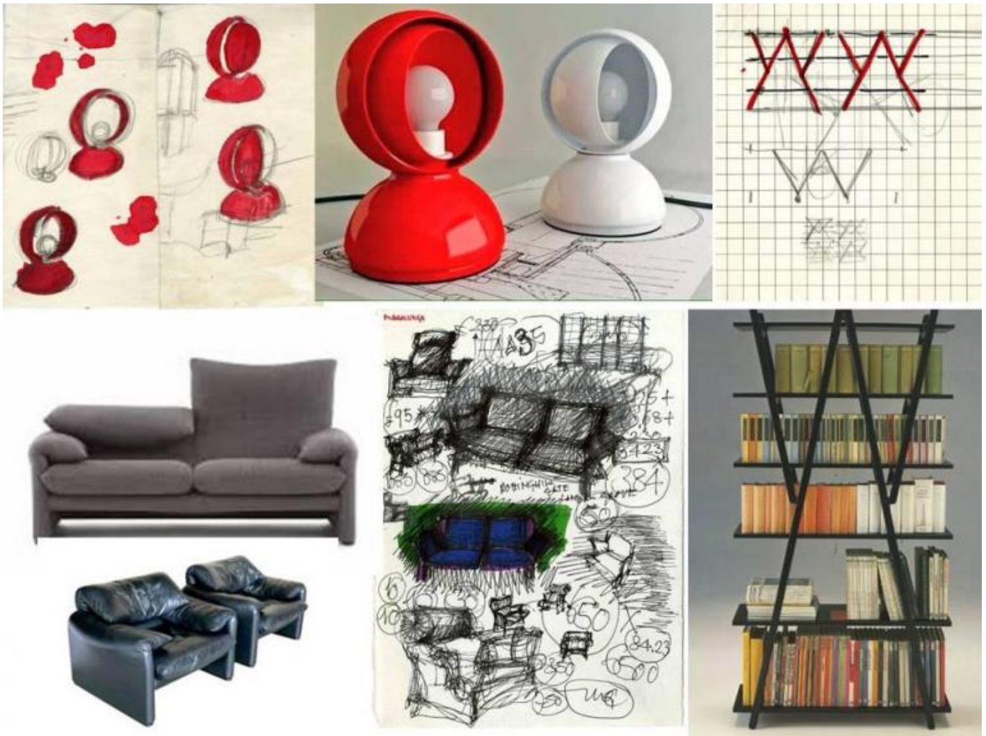
Vico Magistretti, schizzi per lampada Eclisse; lampada Eclisse (Artemide, 1965, Compasso d'Oro 1967); schizzo per libreria Nuvola Rossa, libreria Nuvola Rossa (Cassina, 1977); Poltrone e divano Maralunga (Cassina, 1973, Compasso d'oro 1979); schizzo di progetto per divano e poltrona Maralunga.