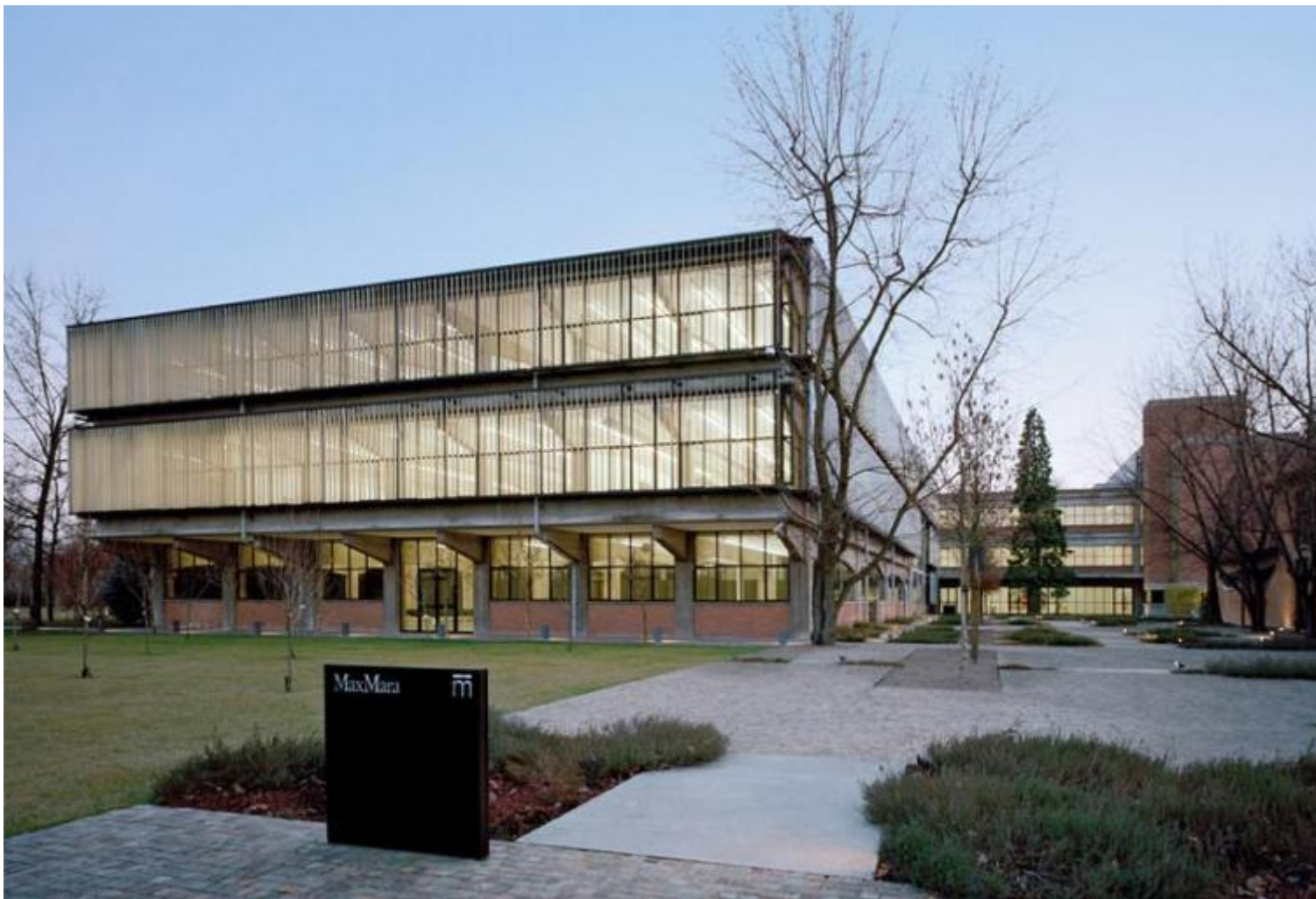
Collezione Maramotti, Reggio Emilia