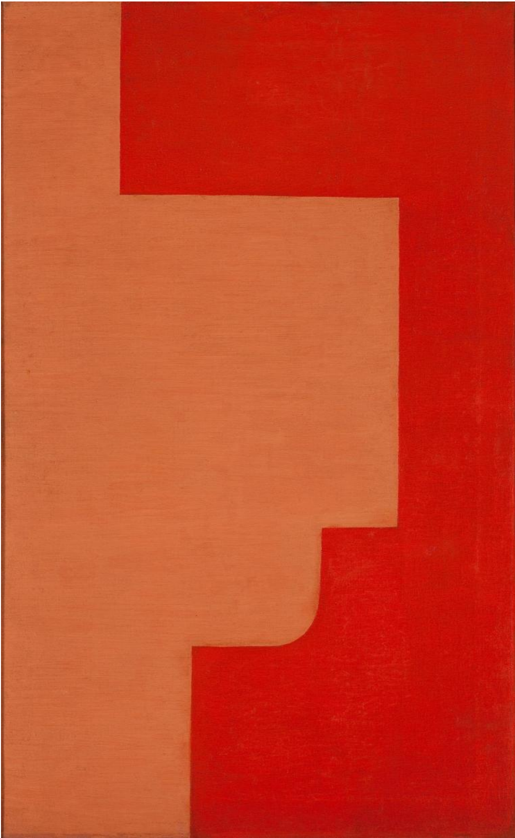
Władysław Strzemiński, Composizione architettonica 6b , 1928

Le pitture di Strzemiński, così come le coeve costruzioni geometriche tridimensionali di Kobra, cercano in effetti di risolvere la contraddizione tra il rivoluzionamento modernista-astratto del mondo delle forme e il loro effetto concreto nella vicenda storica e politica, un tema costantemente dibattuto nei circoli