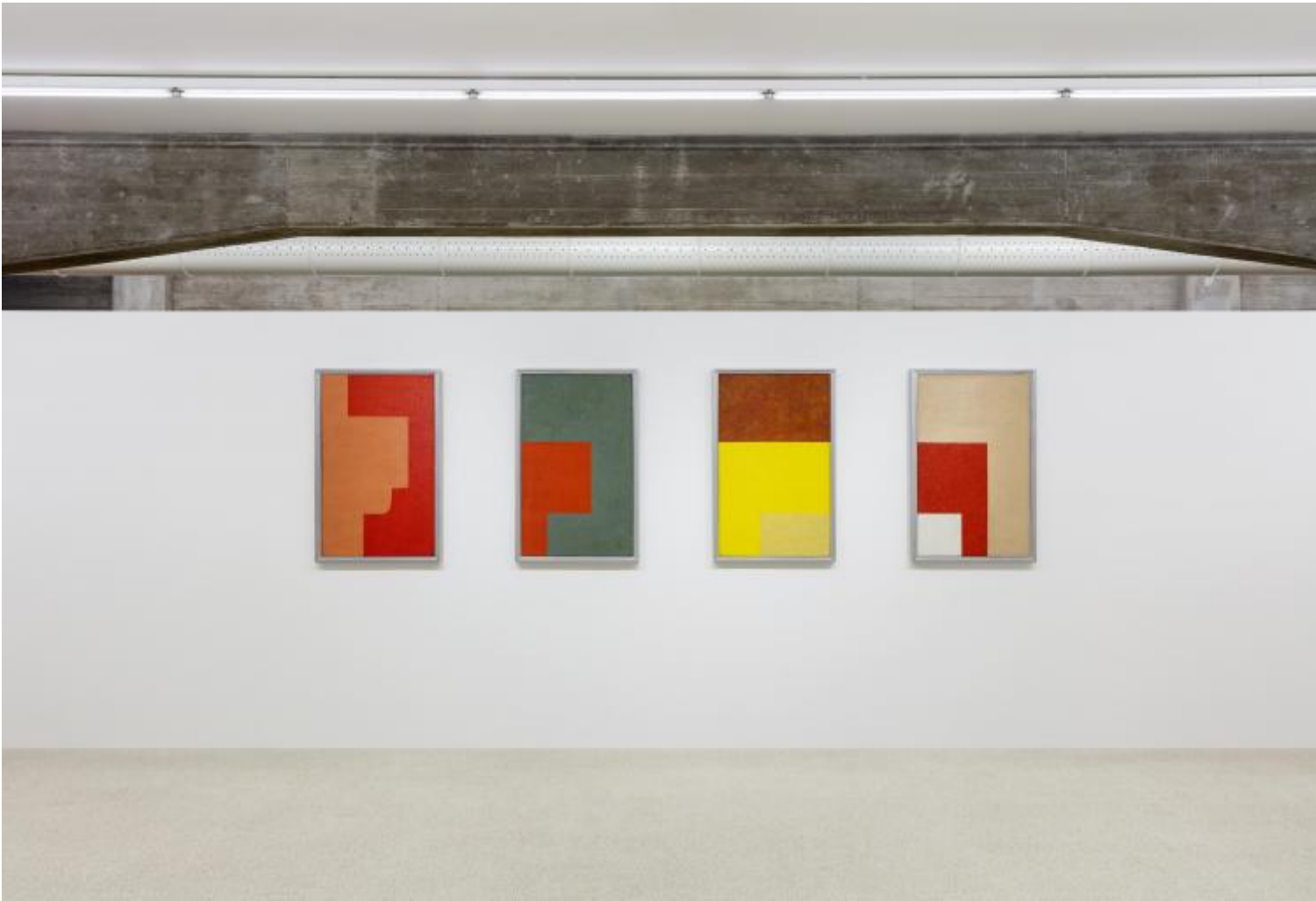
Władysław Strzemiński, Composizioni architettoniche , 1928-29

Quello portato avanti da Strzemiński era in effetti un particolare tipo di "utopia reale" che non ambiva a stabilire un sistema sociale ideale, ma a sviluppare nuovi modelli di esperienza traducibili in nuove forme di coscienza collettiva, capaci a loro volta di modificare l'ordine stabilito. Nessun modello o linguaggio formale era dunque considerato definitivo, perché sempre legato e circoscritto a condizioni storiche determinate. L'utopia perseguita dai due artisti ed è questo il motivo di una perdurante fascinazione che può risuonare anche nella nostra epoca equivaleva in effetti a un invito permanente a superare il limite di ciò che è già immaginabile, a forzarne l'apparente omogeneità, a sollevare un angolo del velo che nasconde un altro tempo e un'altra, futura forma di vita.