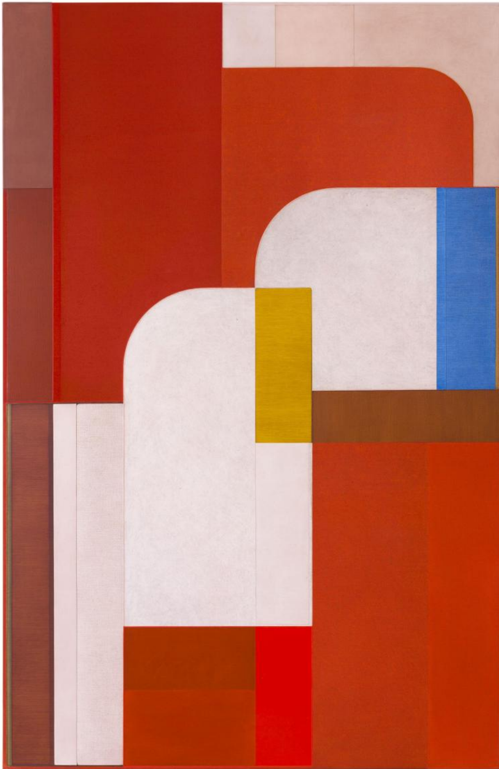
Svenja Deininger, Senza titolo, 2020

Un buon esempio dell'operazione realizzata da Deininger, nata a Vienna nel 1974, è la grande tela che apre la mostra, Senza titolo (2020), la cui superficie rettangolare riprende sia la proporzione allungata dei quadri di Strzemiński sia soprattutto il gioco di sagome incastrate le une nelle altre secondo rigorosi andamenti ortogonali e curvilinei tipico delle sue composizioni astratte. I piani colorati sono dipinti con differenti texture in toni che vanno dal rosa pallido al rosso acceso, e due inserti contrastanti (giallo e azzurro) moltiplicano e complicano le sobrie soluzioni del pittore polacco, dando all'opera