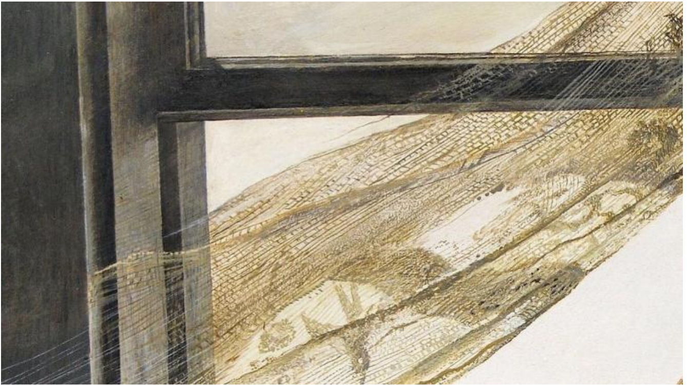
Opera di Andrew Wyeth.

L'immagine del "tempo ultimo" evoca anche, inevitabilmente, un'eco del linguaggio religioso, così come si è sviluppato nei secoli in Occidente. Il "tempo ultimo" - il tempo escatologico, delle "cose ultime" - era una sorta di prospettiva cosmica e definitiva alla quale era necessario tendere, per porre riparo alla precarietà del tempo vissuto sulla terra. Quando lo scorrere del tempo cronologico si sarebbe concluso, saremmo entrati nel "mondo che verrà", in un "altro regno", nella "pienezza dei tempi", in un trionfo di luce e di gloria. Presupponendo, certo, che "le cose di prima sarebbero passate". Oggi evidentemente questo immaginario non fa più presa sulle nostre menti e sulle nostre coscienze, neppure - mi permetto di dire - su quelle dei credenti. La nostra percezione del tempo si è raccorciata. È come se fiutassimo un pericolo, come se sentissimo il brivido che percorre questa nostra terra senza più prospettive per il futuro, senza avvertire quel senso di proroga indefinita che le religioni ci promettevano. In questo ci sollecitano anche le ipotesi scientifiche che forse per la prima volta prospettano una sorta di autodistruzione del pianeta. È per questo, credo, che anche il tempo ultimo delle nostre vite si colora oggi di tonalità diverse.