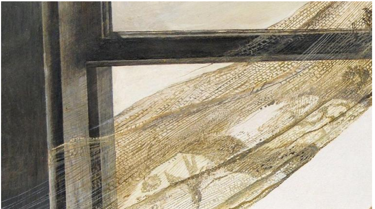
Opera di Andrew Wyeth.

L  immagine del   tempo ultimo  evoca anche, inevitabilmente, un  eco del linguaggio religioso, cos  come si   sviluppato nei secoli in Occidente. Il   tempo ultimo    il tempo escatologico, delle