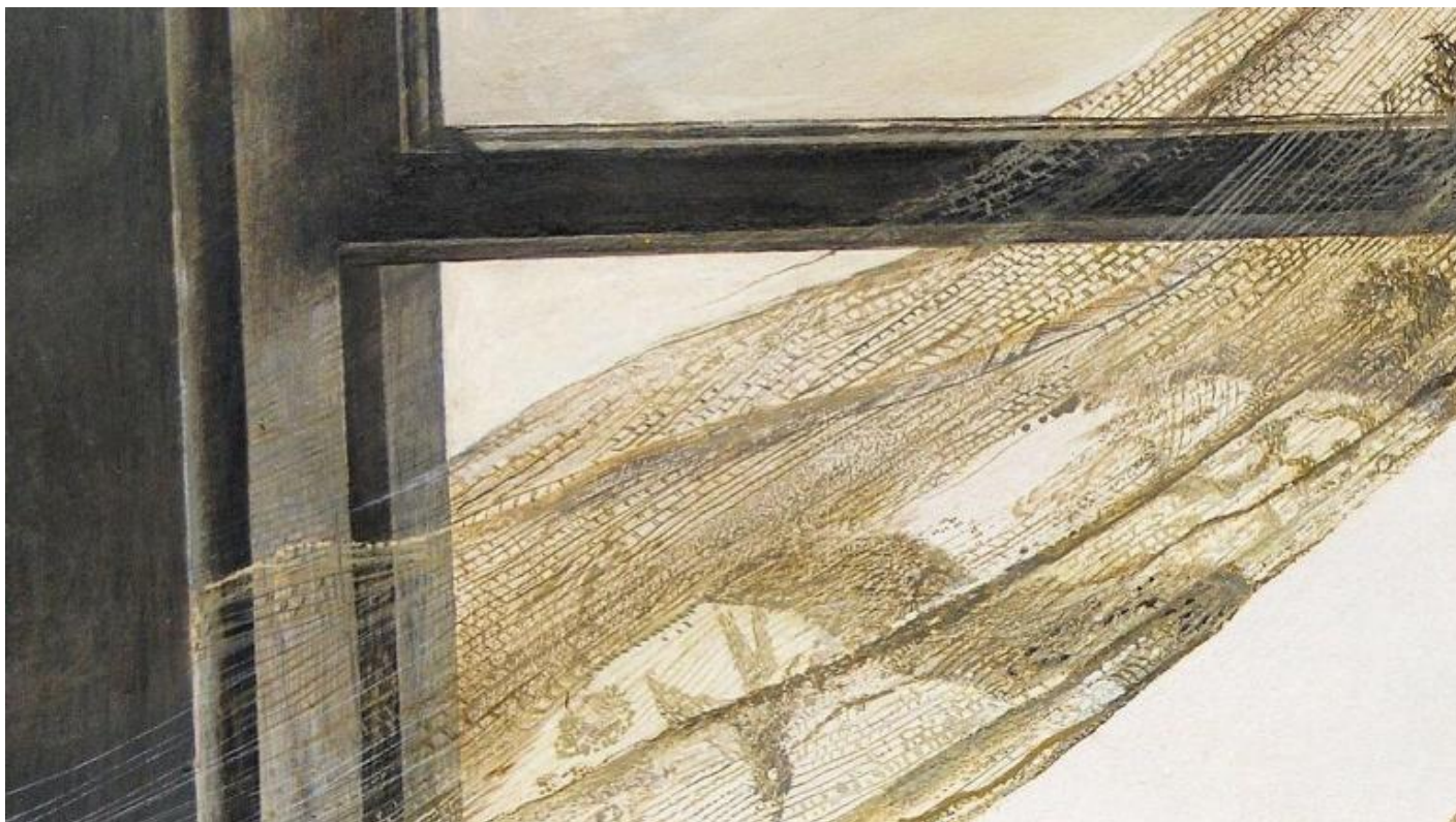
Opera di Andrew Wyeth.

L  immagine del   tempo ultimo  evoca anche, inevitabilmente, un  eco del linguaggio religioso, cos  come si   sviluppato nei secoli in Occidente. Il   tempo ultimo    il tempo escatologico, delle