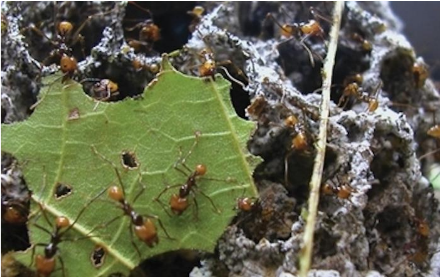
Formiche e funghi