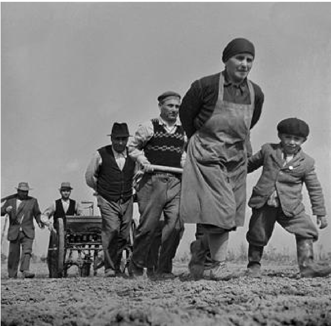
F. Horvat, Polesine, 1950.

A proposito di questa ossessione del controllo, ricordo che ad Atene mi disse che secondo lui la differenza piÃ¹ grande tra le nostre foto di moda era che io cercavo l'azzardo, appunto, mentre a lui interessava soprattutto il controllo dell'immagine.