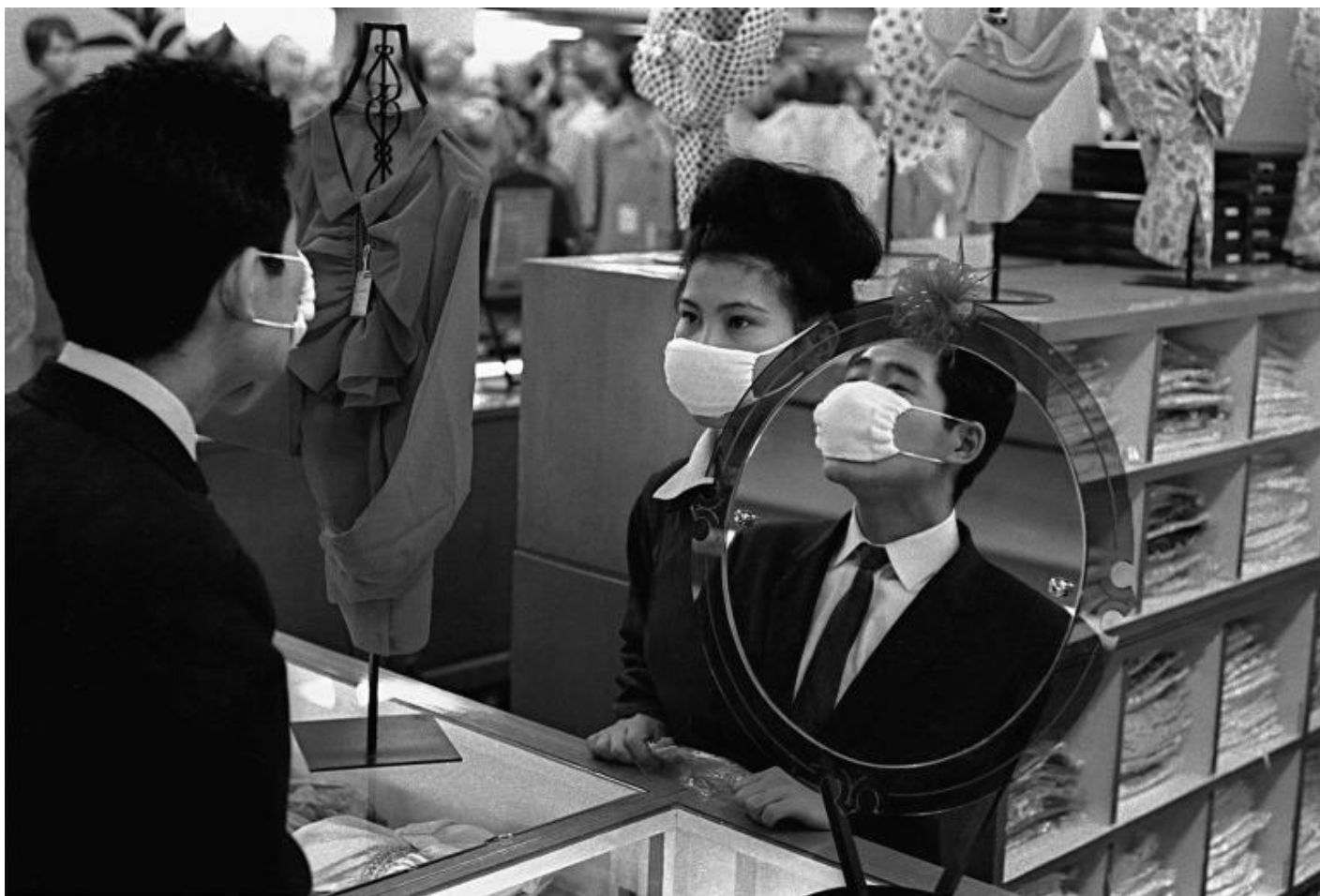
F. Horvat, Incontro sterile, Tokyo, 1963.

Horvat ha incominciato da fotogiornalista, da fotoreporter, spinto da Cartier Bresson, che lo convinse ad abbandonare la Rolleicord e il formato quadrato a favore della Leica, con la quale per anni ha girato il mondo pubblicando le sue immagini in alcune delle pi 1 prestigiose riviste del tempo. 2 persino stato, per un certo periodo, associato a Magnum, anche se non 2 mai diventato membro effettivo. Forse perch 2 non 2 mai stato, non si 2 mai sentito, un fotogiornalista. Nonostante l'eccellenza dei risultati, molti dei quali memorabili.