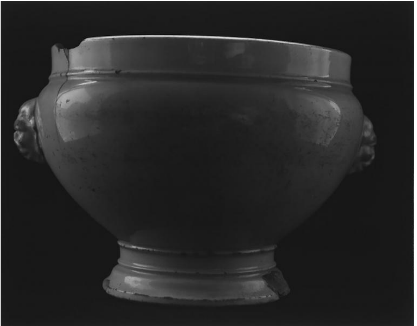
Franco Vimercati, Senza titolo (Zuppiera), 1991 gelatin silver print 17.7 x 22.5 Ed. 6 + 3 AP

La risposta forse sta in un terzo elemento, la serialità. Marco Scotini, il curatore della mostra in corso alla galleria di Raffaella Cortese a Milano, nel saggio introduttivo al catalogo riporta un appunto a penna di Vimercati dell'agosto 1991: «il vero contenuto del mio lavoro è la ripetizione. La ripetizione ostinata, cattiva o assente, malinconica o violenta, ma solo e sempre ripetizione. In ogni caso, il non voler dare spettacolo, il non essere accomodante, grazioso, ragionevole. Il non voler proporre quesiti intelligenti, raffinati esercizi di stile. Cerco di essere il più semplice possibile proprio perché la protesta sia il più efficace possibile. Deve essere secca e penetrante come un chiodo senza dispersione di nessun genere».