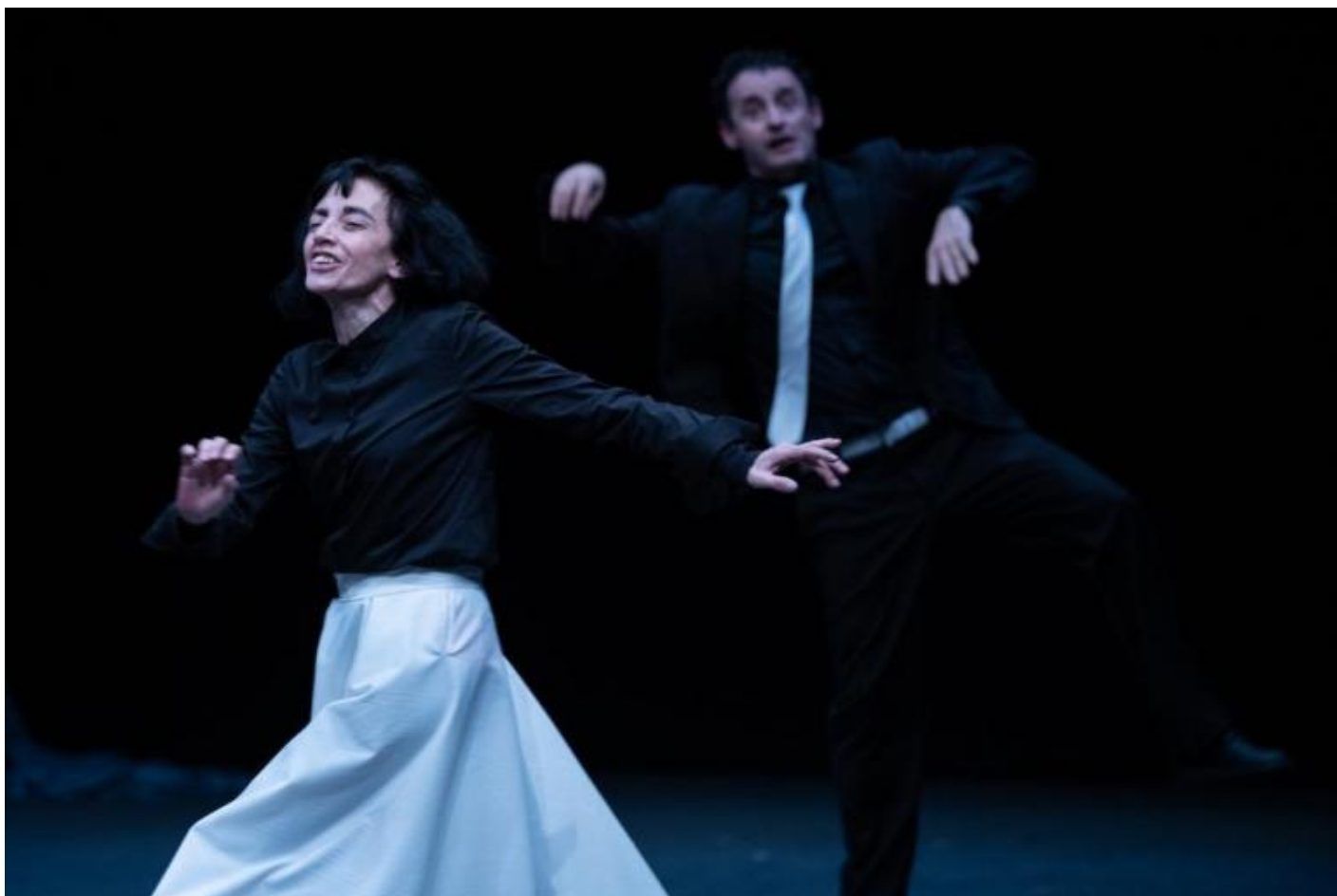
Ottantanove, di Frosini/Timpano, ph. Ilaria Scarpa.

Di questa assenza fate spettacolo? O le fate il funerale? O, ancora, le date “degn” sepoltura?