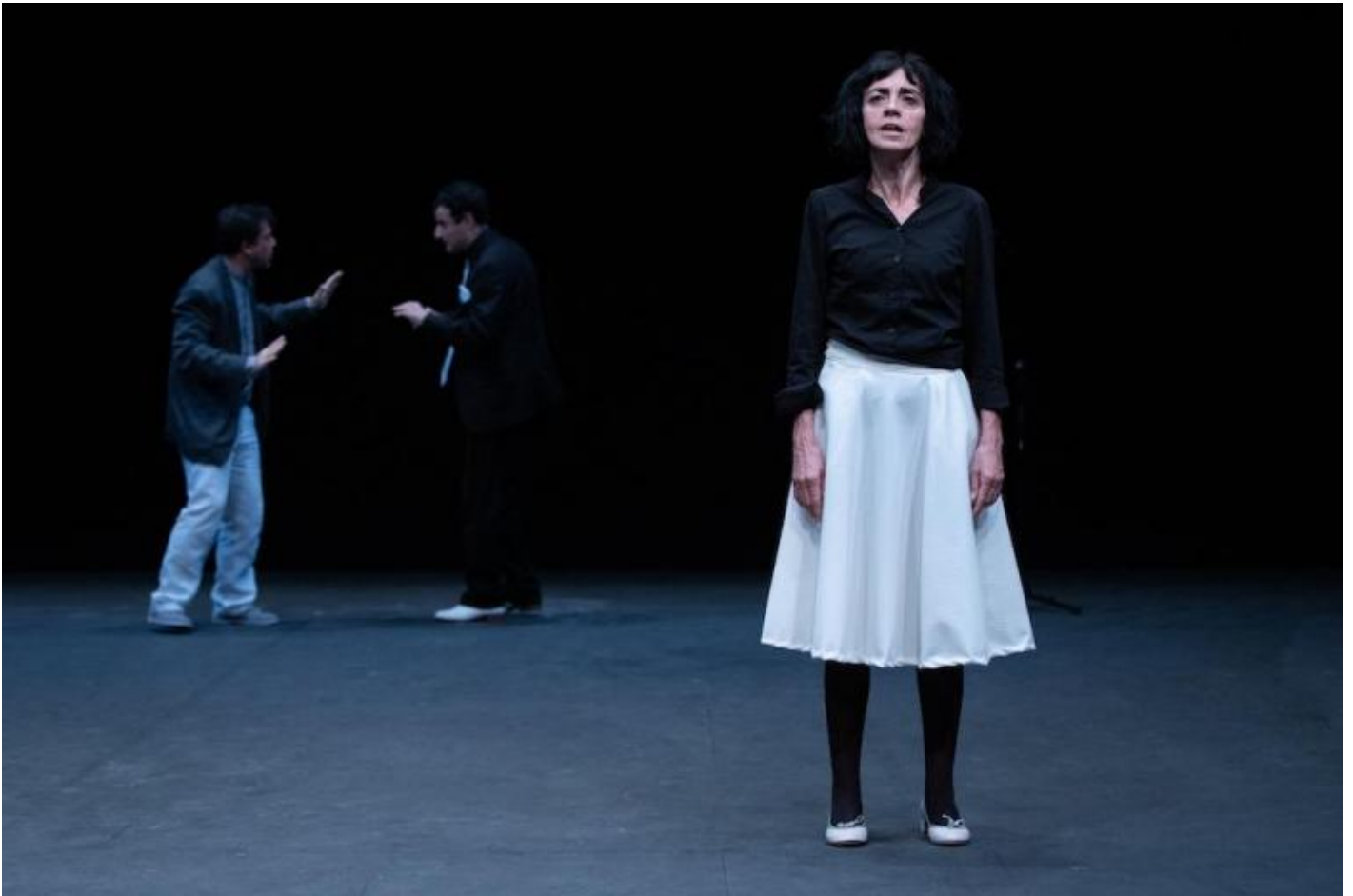
Ottantanove, di Frosini/Timpano, ph. Ilaria Scarpa.

Frosini: Man mano che scrivevamo gli abbiamo fatto leggere il testo, ci ha seguito in particolare nella residenza che abbiamo fatto a Parigi, all'Istituto Italiano di Cultura, dove abbiamo scritto molte parti importanti del testo e dove abbiamo fatto una prima lettura di brani a gennaio 2019.