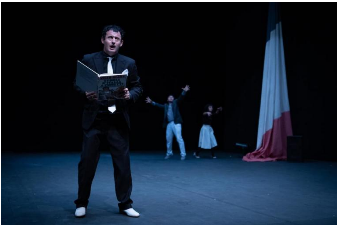
Ottantanove, di Frosini/Timpano.

La Rivoluzione Francese è stata, per certi aspetti, una rivoluzione mancata. La vostra, appunto, è rimandata. Questo vi farà sentire ancora di più lo spirito del 1789 e, chissà, di ogni rivoluzione? Paradossalmente, non “sentirete” lo spettacolo ancora di più?