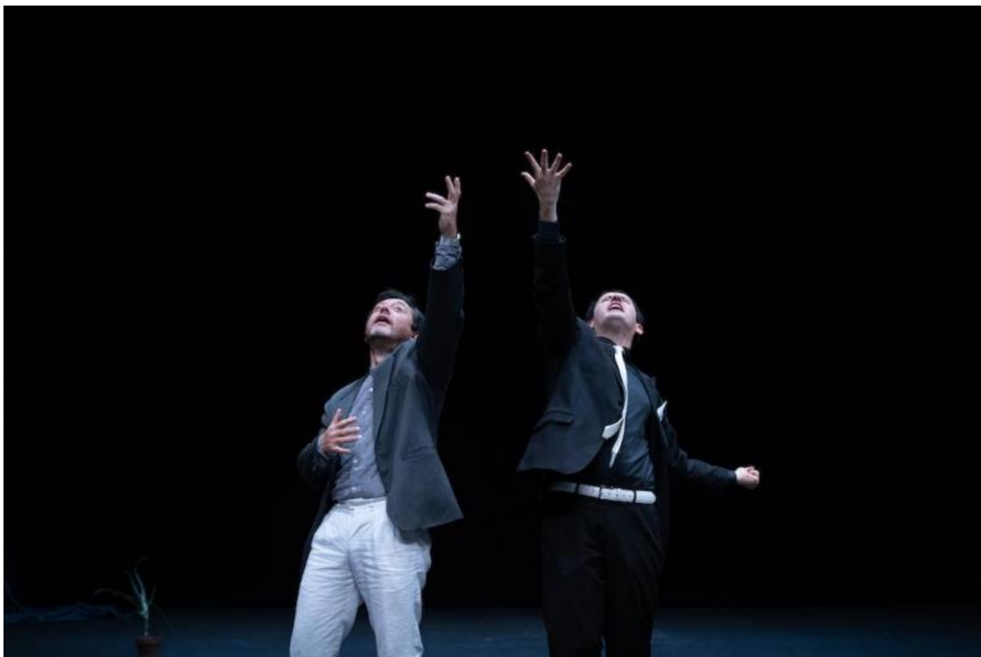
Ottantanove, di Frosini/Timpano, ph. Ilaria Scarpa.

I materiali biografici personali di cui parlava Daniele sono, per così dire, “veri” oppure ricostruiti ad arte? C’è, forse, anche il Coronavirus?