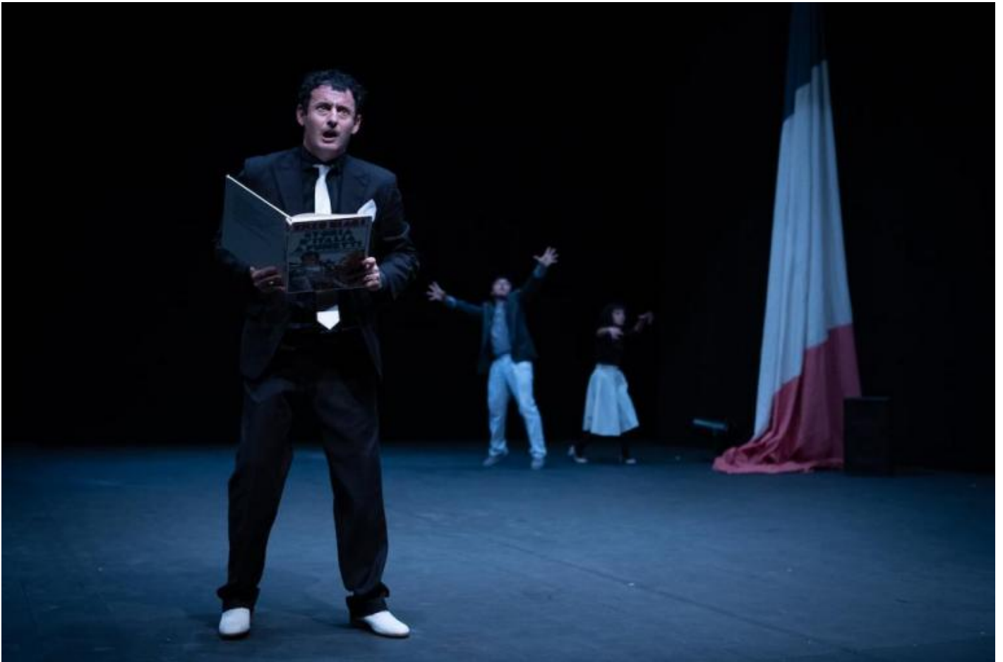
Ottantanove, di Frosini/Timpano, ph. Ilaria Scarpa.

La Rivoluzione Francese Ã¨ stata, per certi aspetti, una rivoluzione mancata. La vostra, appunto, Ã¨ rimandata. Questo vi farÃ sentire ancora di piÃ¹ lo spirito del 1789 e, chissÃ , di ogni rivoluzione? Paradossalmente, non Ã¨ sentirete lo spettacolo ancora di piÃ¹?