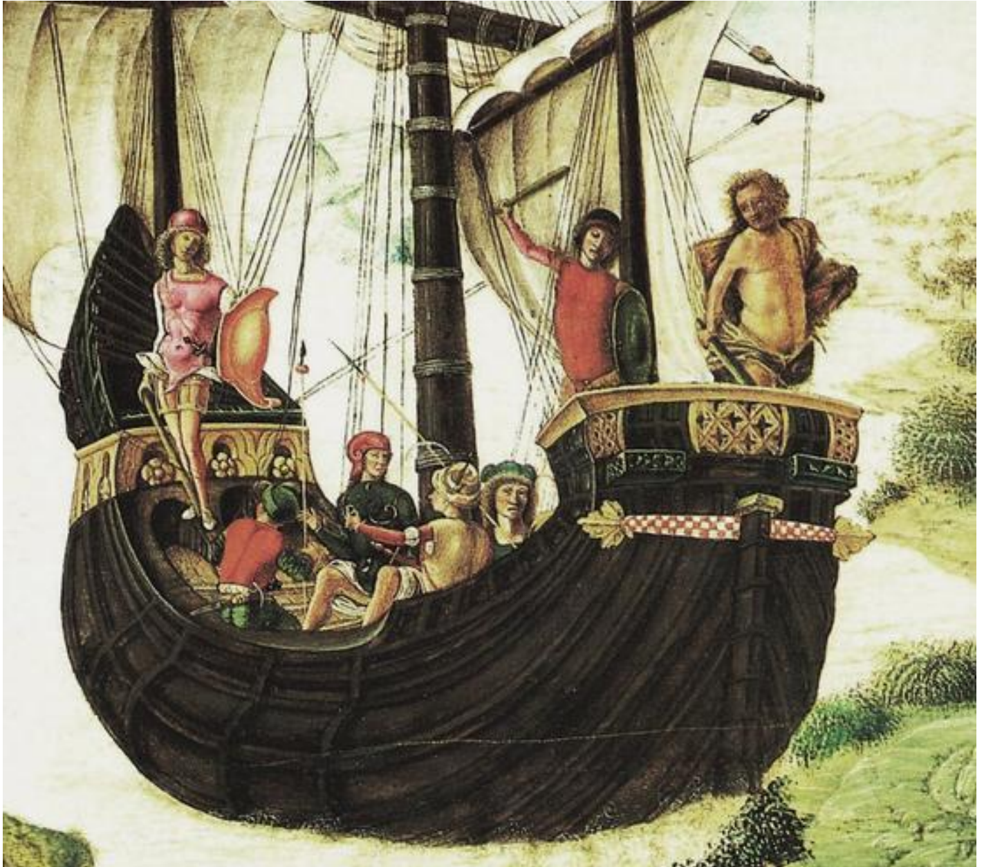
Lorenzo Costa, La spedizione degli Argonauti, 1485, dettaglio, Museo Civici Eremitani, Padova.

E ciò che si vede dipinto è una scena drammatica e insieme incantata. Una nave apparentemente grandissima, per quanto scarsamente popolata tenendo conto che gli Argonauti erano cinquanta, si sta allontanando da riva sospinta da venti favorevoli. Il mare è calmo, nessuna avvisaglia di pericolo o di tempesta, come nelle marine bibliche o olandesi sovraccariche di insegnamento religioso o allegorico, o in Turner, sovraccarico di niente altro che non sia gloriosa pittura.