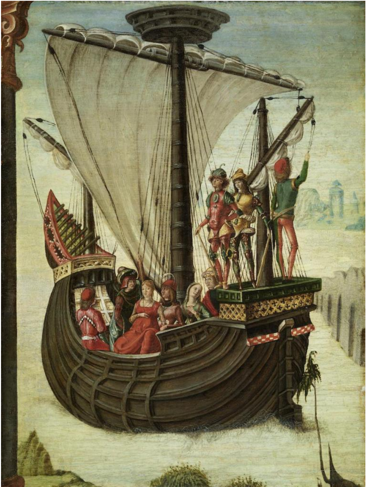
Lorenzo Costa (Attr. deâ?? Roberti), Gli argonauti lasciano la Colchide , Museo Thyssen-Bornemisza Madrid.