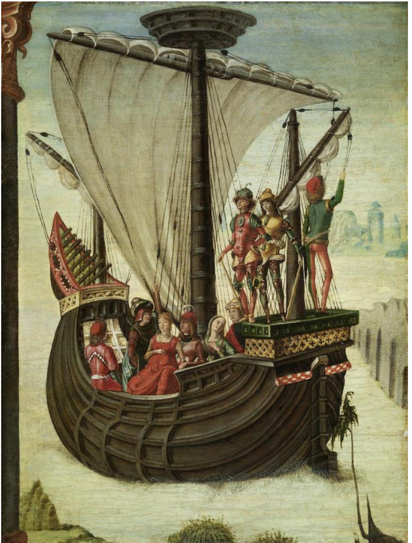
Lorenzo Costa (Attr. deâ?? Roberti), Gli argonauti lasciano la Colchide, Museo Thyssen-Bornemisza Madrid.