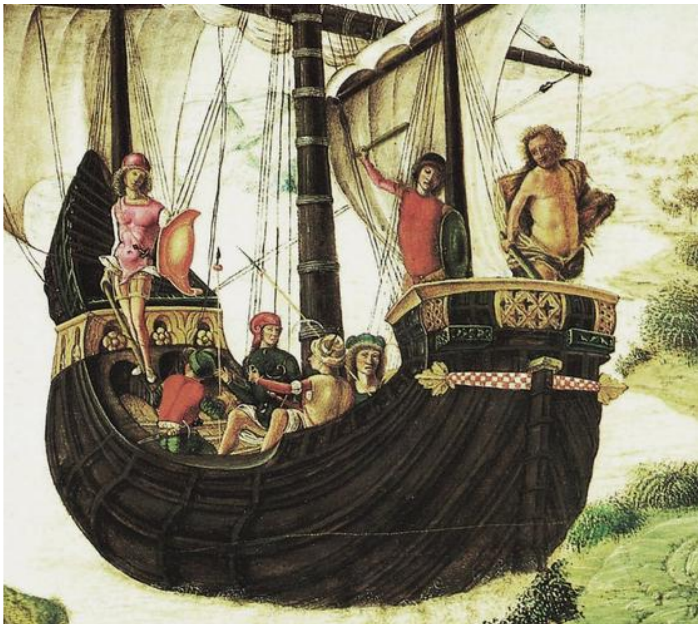
Lorenzo Costa, La spedizione degli Argonauti, 1485, dettaglio, Museo Civici Eremitani, Padova.

E ciò che si vede dipinto è una scena drammatica e insieme incantata. Una nave apparentemente grandissima, per quanto scarsamente popolata tenendo conto che gli Argonauti erano cinquanta, si sta allontanando da riva sospinta da venti favorevoli. Il mare è calmo, nessuna avvisaglia di pericolo o di tempesta, come nelle marine bibliche o olandesi sovraccariche di insegnamento religioso o allegorico, o in Turner, sovraccarico di nient'altro che non sia gloriosa pittura.