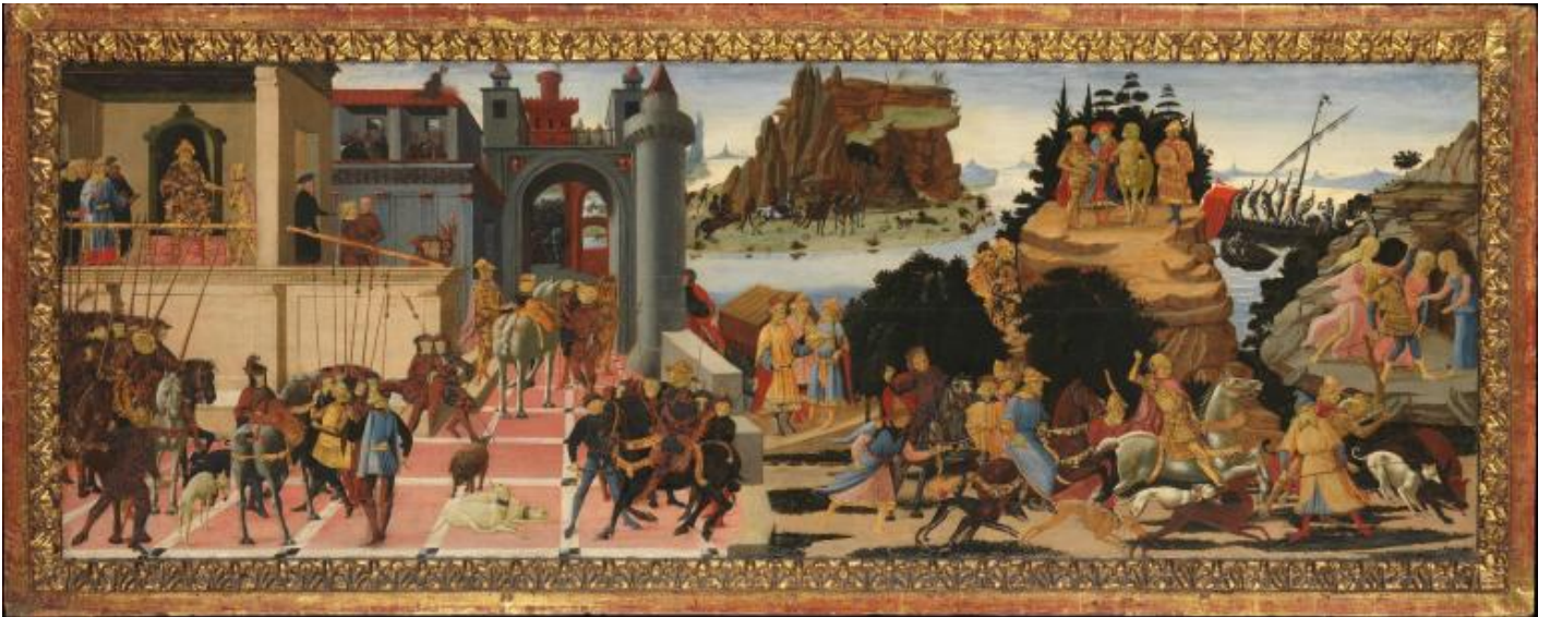
Jacopo del Sellaio, Scene da storie Argonauti, 1465, Metropolitan Museum, New York.