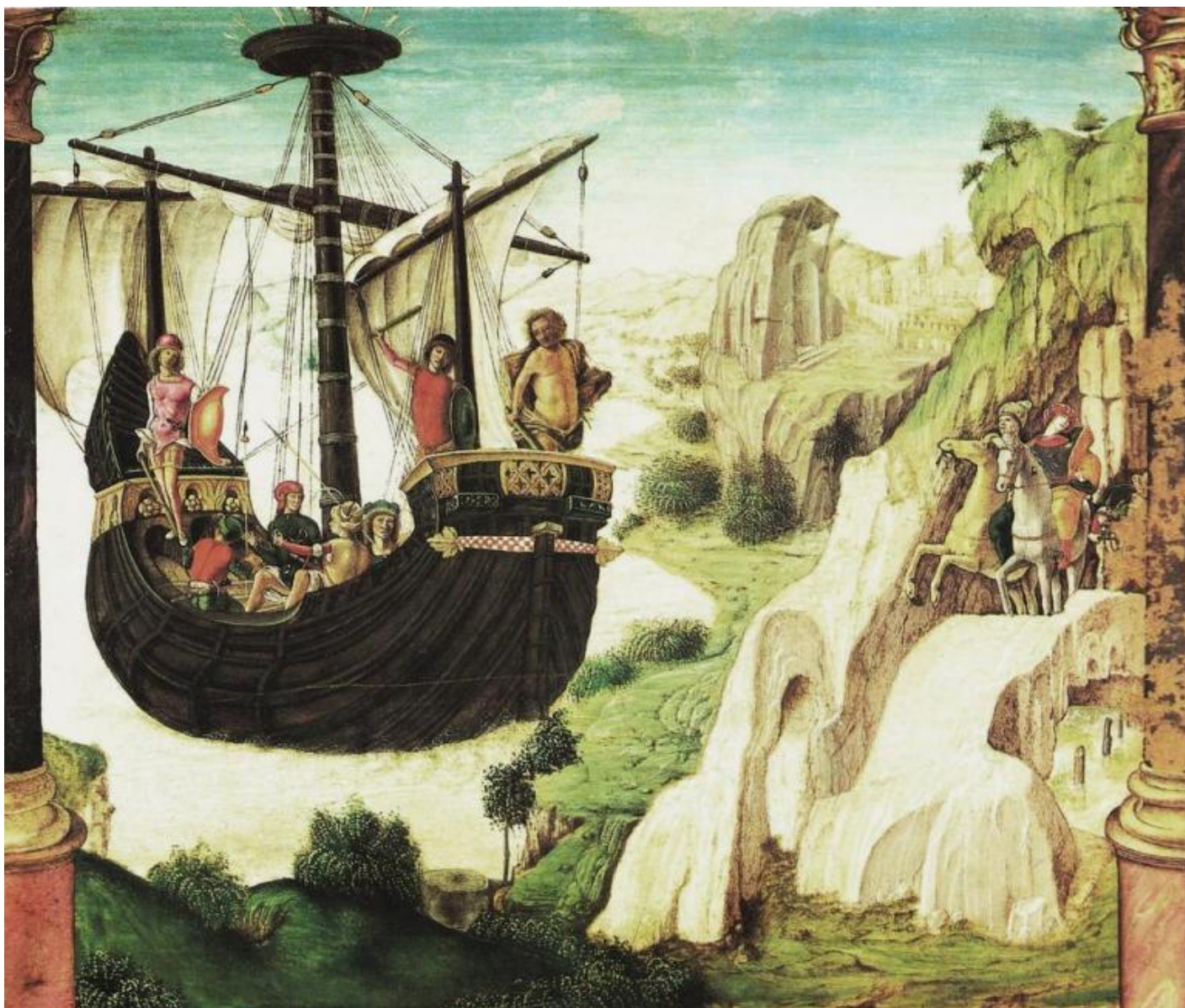
Lorenzo Costa, La spedizione degli Argonauti, 1485, Museo Civici Eremitani, Padova.

Argo è il soggetto principale, almeno dal punto di vista visivo che in un quadro è ciò che conta, di un'incantevole tavoletta che si può ammirare al museo di Padova, e che si trova riprodotta ormai pressoché ovunque si parli del viaggio degli Argonauti.