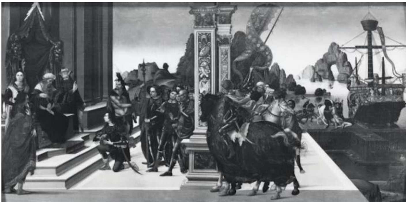
Maestro del 1487, Partenza degli Argonauti, 1487, National Gallery, Londra.

La ragione di questa predilezione sembrerebbe quella, alquanto curiosa secondo la nostra mentalità, che individuava in Medea un simbolo di fedeltà coniugale, pronta a tutto pur di difenderla; nonché, mi vien da aggiungere, un monito al marito perché osservi il patto coniugale, se si pensa a cosa Medea è stata capace di fare quando ha scoperto il tradimento di Giasone, con il tradizionale strascico grandguignolesco che miti e tragedie non si fanno scrupolo di raccontare in ogni dettaglio, nell'eterna vicenda che vede come prime vittime i figli, come dimostra la cronaca nera di tutti i tempi, con la differenza che le stragi, oggi, sembrano appannaggio quasi esclusivo dei padri, deboli e isterici quanto violenti.