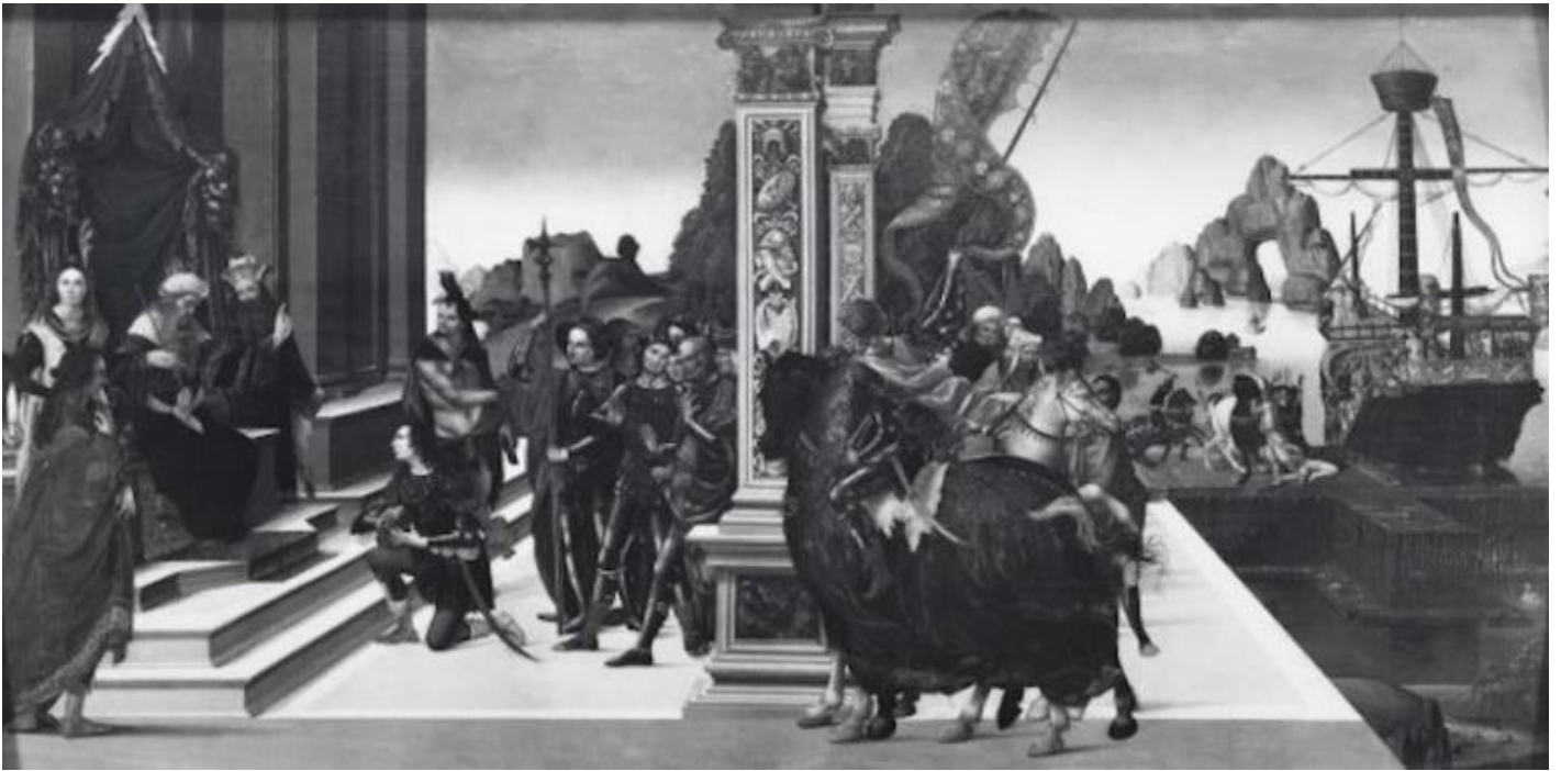
Maestro del 1487, Partenza degli Argonauti, 1487, National Gallery, Londra.

La ragione di questa predilezione sembrerebbe quella, alquanto curiosa secondo la nostra mentalità, che individuava in Medea un simbolo di fedeltà coniugale, pronta a tutto pur di difenderla; nonché, mi vien da aggiungere, un monito al marito perché osservi il patto coniugale, se si pensa a cosa Medea è stata capace di fare quando ha scoperto il tradimento di Giasone, con il tradizionale strascico grandguignolesco che miti e tragedie non si fanno scrupolo di raccontare in ogni dettaglio, nell'eterna vicenda che vede come prime vittime i figli, come dimostra la cronaca nera di tutti i tempi, con la differenza che le stragi, oggi, sembrano appannaggio quasi esclusivo dei padri, deboli e isterici quanto violenti.