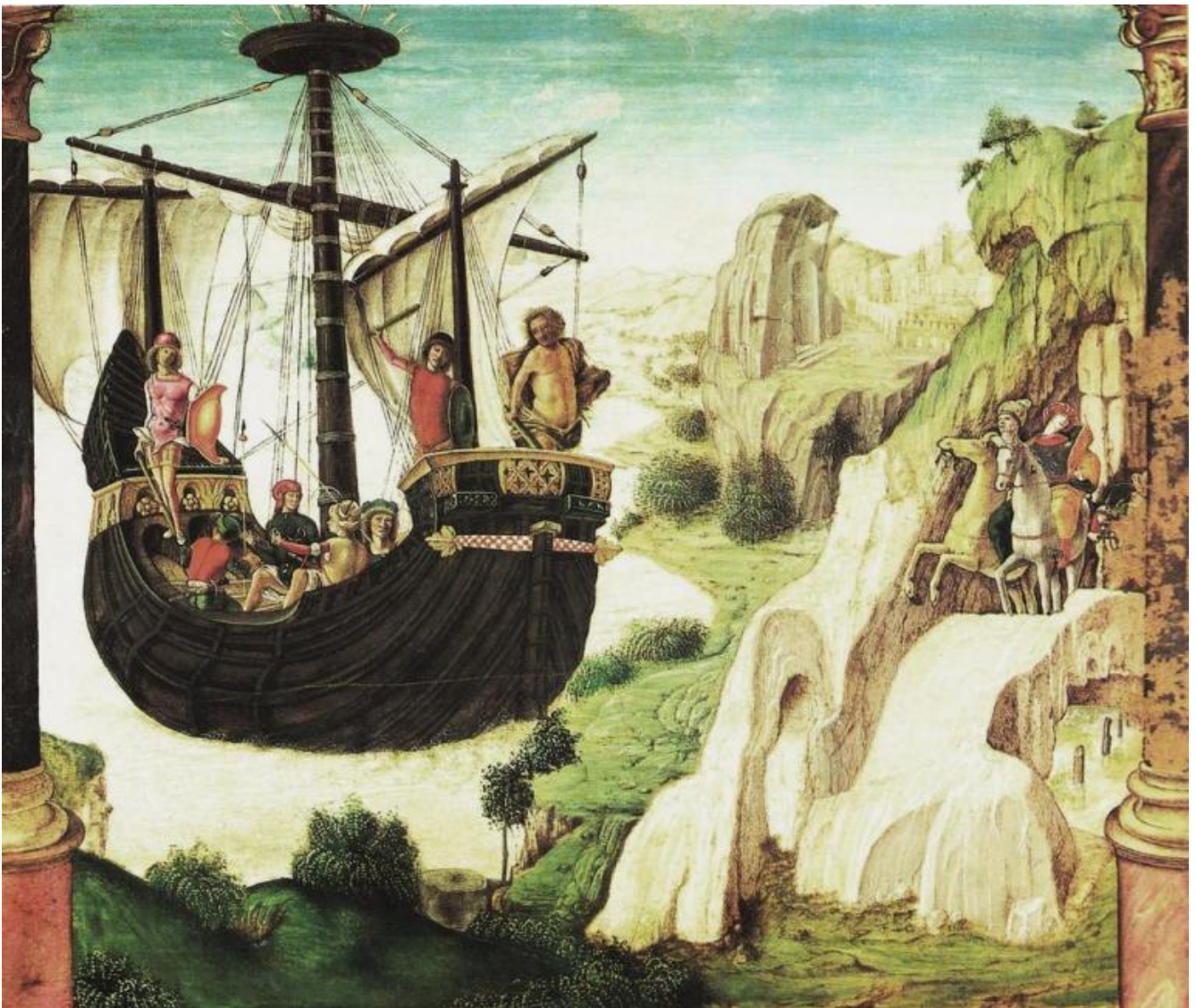
Lorenzo Costa, La spedizione degli Argonauti, 1485, Museo Civici Eremitani, Padova.

Attraversare il mare resta un pericolo ancora oggi, anche se non per tutti. Ma ancora c'è chi lo affronta alla ricerca del suo vello d'oro, o più modestamente dell'oro di una sopravvivenza dignitosa e pacifica. Ma coloro che il mare reclama a sé, con la connivenza degli uomini, oggi raramente hanno tumuli, sacrifici offerti agli dei, rituali che li accompagnino nell'Ade e ne conservino la memoria come per gli Argonauti morti durante il loro viaggio. Vanno a fondo, le ossa spolpate come già Fleba il fenicio 3000 anni prima, o galleggiano sul mare, portati a spalla dalle onde verso riva, come se solo così possano trovare un porto. Favore degli dei non ne hanno, nessuna Argo che li trasporta e protegge.