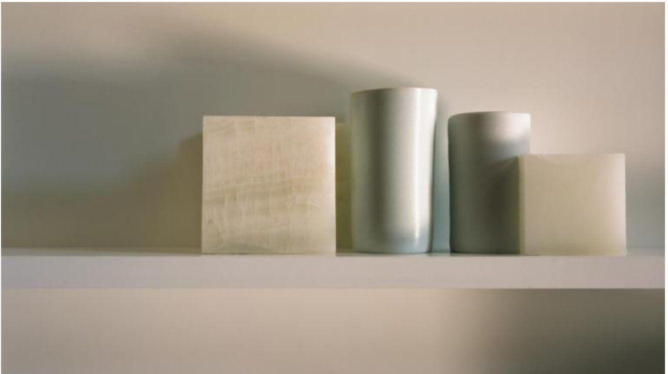
Edmund De Waal, Library of exile, British Museum, Londra.