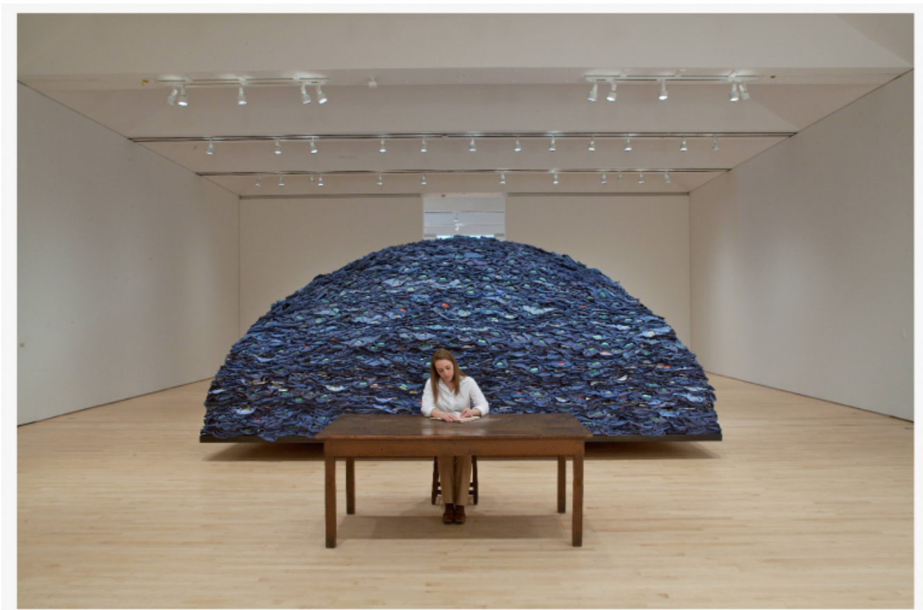
Ann Hamilton, Indigo Blues, 1991.