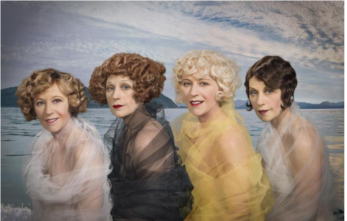
Cindy Sherman, Untitled 584 , 2017-18.

Ã; ma anche attraverso le tacite convenzioni che strutturano il modo in cui il corpo Ã; percepito culturalmente. (Judith Butler, â??Atti performativi e costituzione di genereâ?•)