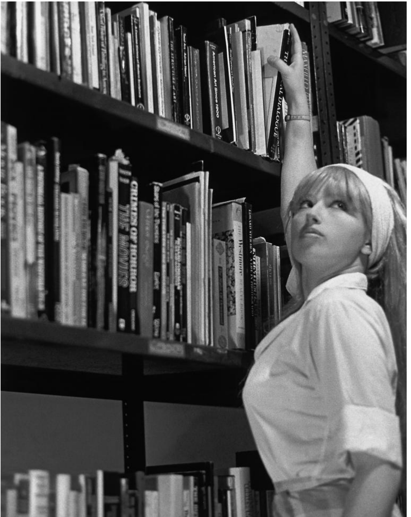
Cindy Sherman, Untitled Film Stills 84, 1978.