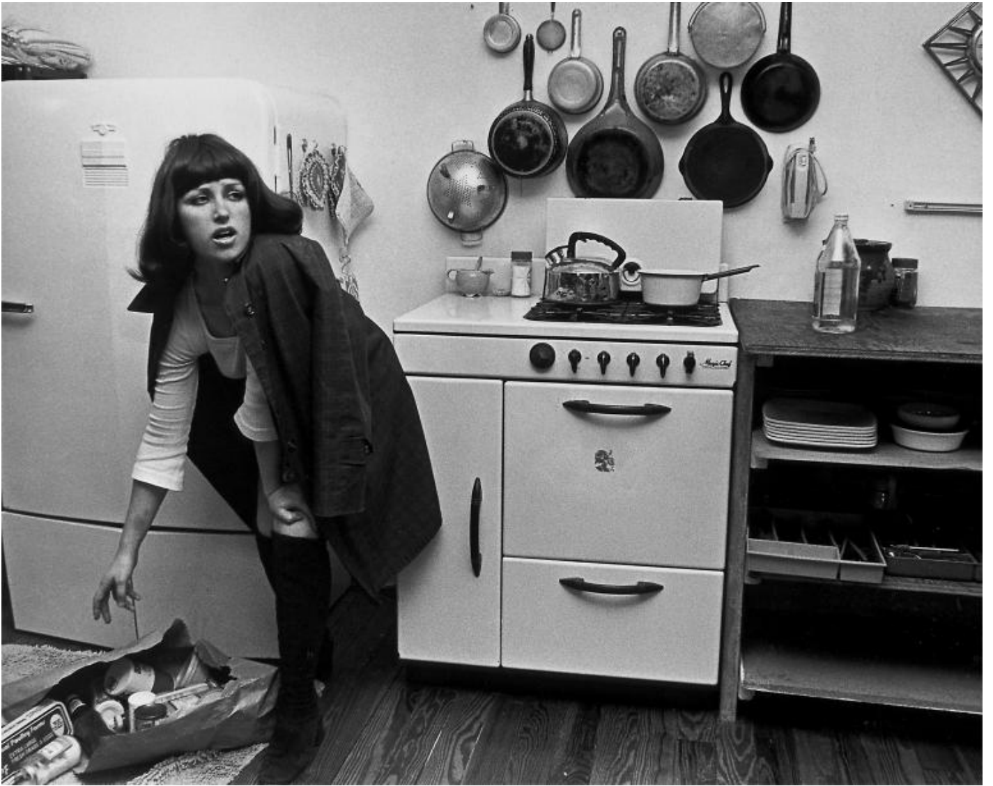
Cindy Sherman, Untitled Film Stills 84, 1978.