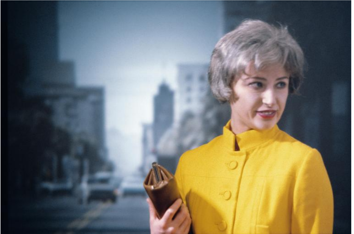
Cindy Sherman, Untitled 74, 1980.

Posture e drammi di immaginarie Brigitte Bardot, Anna Magnani, Kim Novak mettono allora in scena possibili film hollywoodiani, mescolando i codici della cultura popolare e vernacolare con i riferimenti al grande cinema: se quest'ultimo costituisce il riferimento cui ispirarsi, nessuna vera citazione – tuttavia da ricercare in questi scatti. Il cinema, la televisione – come sarà per le riviste di moda – sono lo spunto per appropriarsi di un linguaggio e incarnarlo, inscenarlo. Con Rear Screen Projections (1980), omaggiando una tecnica cinematografica molto usata a partire dagli anni '30, apprezzata in particolare da Hitchcock, Sherman passa dal bianco e nero al colore e inaugura un modo di fare la posa a colori e in studio che rimarrà centrale in tutta la sua produzione.