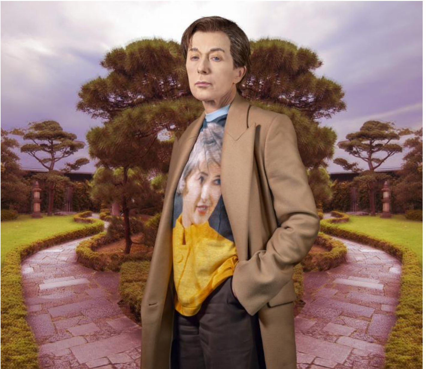
Cindy Sherman, Untitled 602, 2019.

L'opzione che io difendo non è quella di ridescrivere il mondo dal punto di vista delle donne: non saprei nemmeno dire quale sia questo punto di vista, ma, qualunque cosa sia, temo che non valorizzi le singolarità e non ho alcuna intenzione di sposarla [?!] È la stessa categoria di «donna», in quanto presupposto, a richiedere una genealogia critica delle complesse risorse politiche e discorsive che, a loro volta, la costituiscono. (Judith Butler, ivi .)