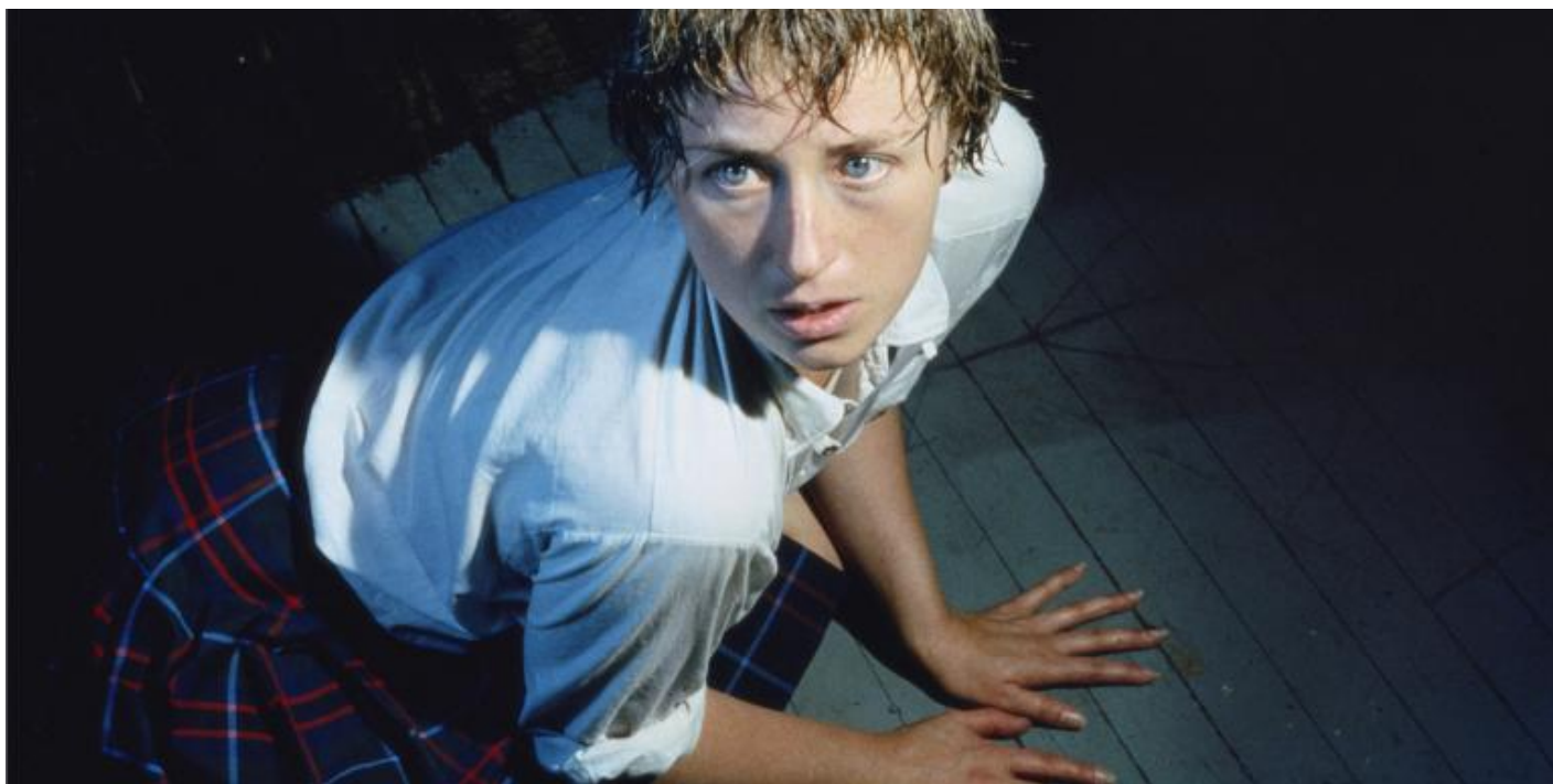
Cindy Sherman, Untitled 92, 1981.

Se continuiamo a tenere vivo questo spazio " grazie a te. Anche un solo euro per noi significa molto. Torna presto a leggerci e SOSTIENI DOPPIOZERO