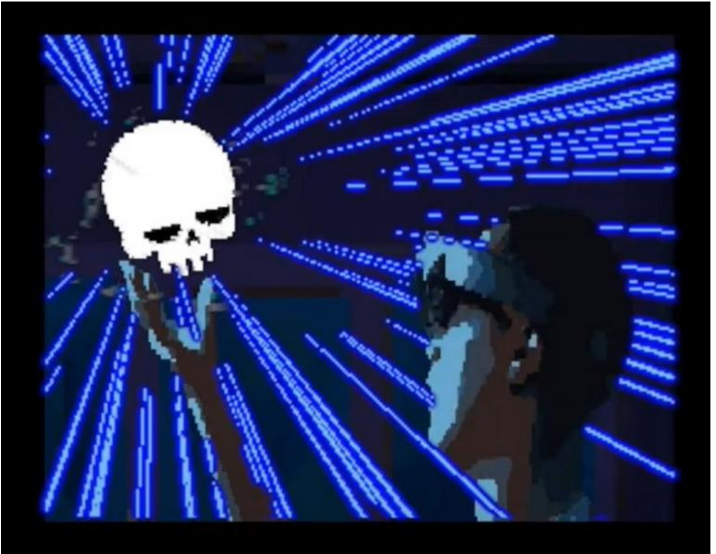
Shakespeare Showdown, di Enchiridion.

La seconda domanda Ã¨ invece piÃ¹ problematica e richiede di capire che cosa Ã¨ anche lâ??interazione a teatro. Semplificando un discorso che richiederebbe piÃ¹ spazio, propongo che questa abbia luogo quando ha luogo un primato dellâ??evento della relazione sulla forma della composizione. In altri termini, il pubblico interagisce tanto di piÃ¹ con il lavoro dellâ??attore, reagendo ad esempio con uno slancio dellâ??immaginazione che completa i contorni di quanto vede e ascolta, quanto piÃ¹ i ritmi e le azioni che avvengono sulla scena sono â??fluidiâ?. Se questo non accade, abbiamo appunto il dominio della forma, dove lâ??unico atto possibile Ã¨ la contemplazione di una rigida impalcatura. Interagire Ã¨ dunque diverso dal semplice reagire: significa esondare quanto piÃ¹ possibile dai limiti della composizione formale, che non si identifica necessariamente con il far entrare il pubblico dentro lo spettacolo attraverso giochi, alzate di mano, o richieste di commenti. Anche se tali cose avvengono, puÃ² darsi che siano semplici variazioni di una forma che non lascia spazio alla libera interpretazione o immaginazione.