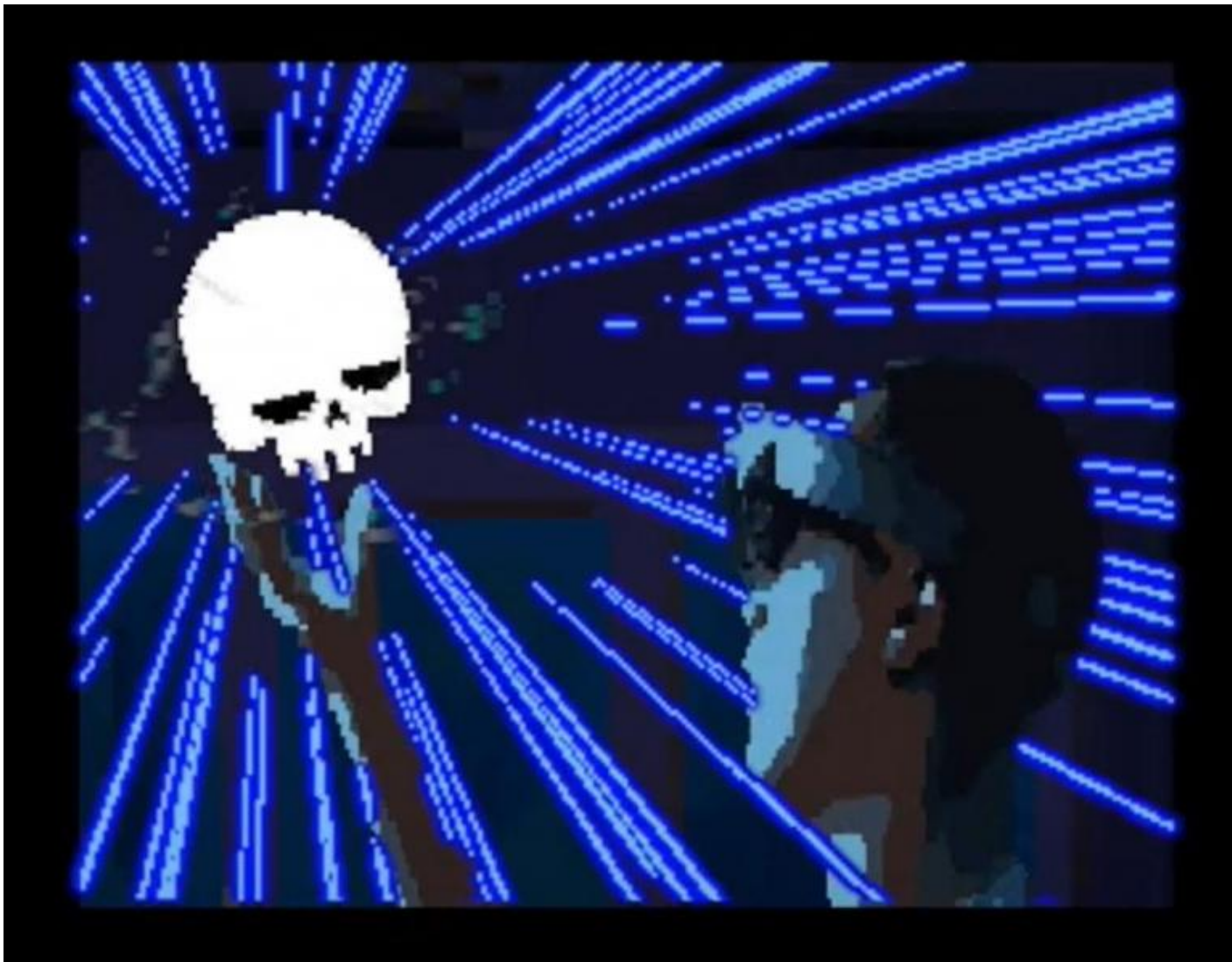
Shakespeare Showdown, di Enchiridion.

La seconda domanda è invece più problematica e richiede di capire che cosa è anche l'interazione a teatro. Semplificando un discorso che richiederebbe più spazio, propongo che questa abbia luogo quando ha luogo un primato dell'evento della relazione sulla forma della composizione. In altri termini, il pubblico interagisce tanto di più con il lavoro dell'attore, reagendo ad esempio con uno slancio dell'immaginazione che completa i contorni di quanto vede e ascolta, quanto più i ritmi e le azioni che avvengono sulla scena sono "fluidi". Se questo non accade, abbiamo appunto il dominio della forma, dove l'unico atto possibile è la contemplazione di una rigida impalcatura. Interagire è dunque diverso dal semplice reagire: significa esondare quanto più possibile dai limiti della composizione formale, che non si identifica necessariamente con il far entrare il pubblico dentro lo spettacolo attraverso giochi, alzate di mano, o richieste di commenti. Anche se tali cose avvengono, può darsi che siano semplici variazioni di una forma che non lascia spazio alla libera interpretazione o immaginazione.