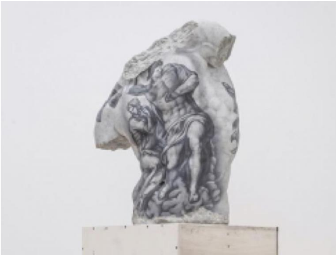
Fabio Viale, Kouros, 2018, ©Fabio Viale.