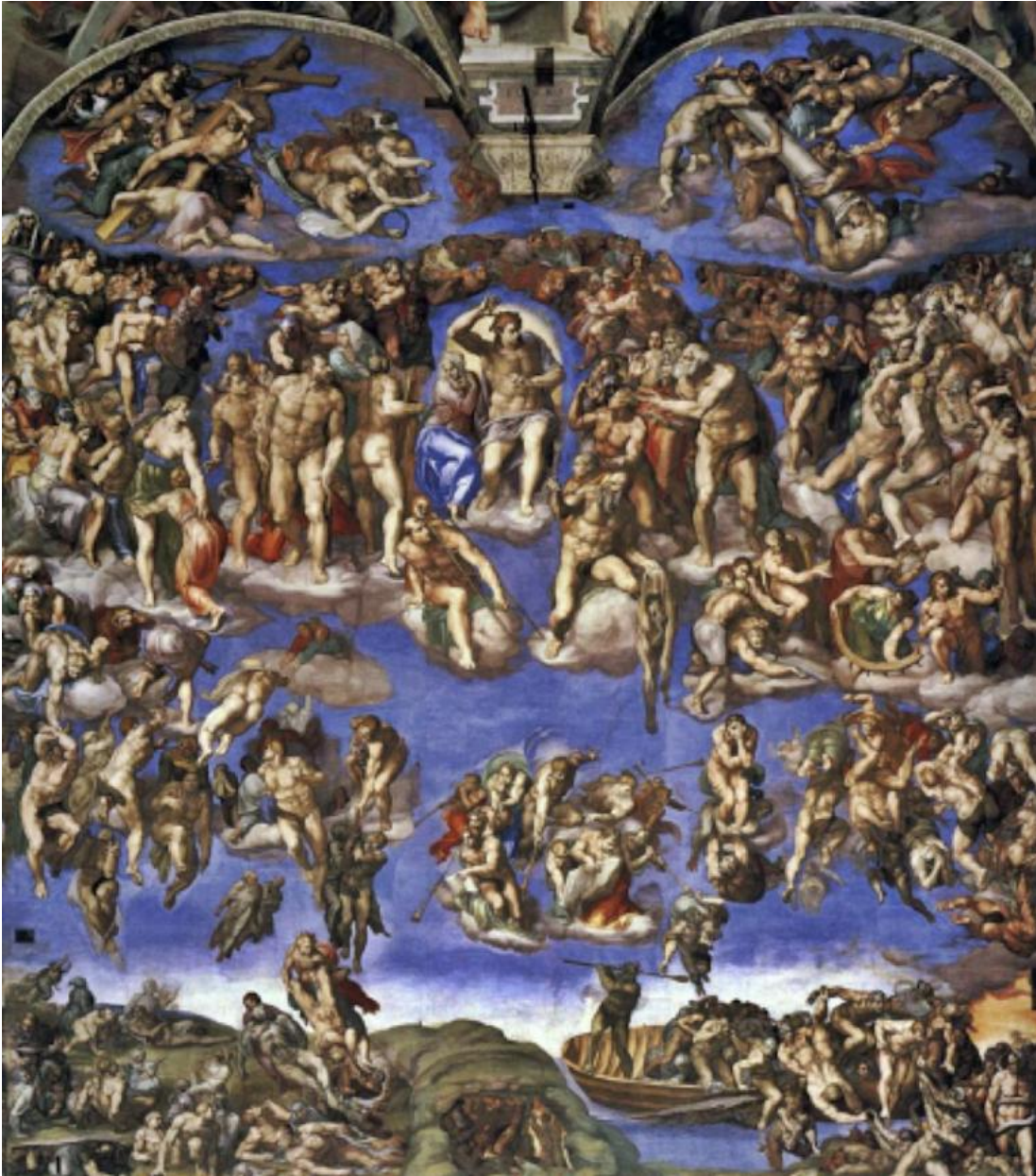
Michelangelo, Giudizio Universale, Dominio pubblico - Wikimedia Commons.

propone un'inedita ipotesi interpretativa dei capolavori contenuti nella Cappella del palazzo apostolico. Già dalle pagine introduttive del libro si scopre infatti la volontà dell'autore di cogliere il senso complessivo degli affreschi messi in dialogo tra loro. Sebbene di fatto questi capolavori della storia dell'arte siano stati realizzati in momenti e su commissioni diverse e da artisti di differenti generazioni, la ricerca di Careri propone percorsi inattesi e una loro lettura originale complessiva. A partire da una analisi antropologica delle immagini, che impone di misurarsi con la dottrina teologica dell'epoca, viene infatti posta l'attenzione su un'ipotesi, finora mai tentata, di rinvenire negli affreschi della Cappella Sistina sia un recupero del passato ebraico da parte della cristianità sia connotazioni tipicamente antiggiudaiche. Una ricerca che si muove dalle riflessioni delle Lettere di San Paolo e che è un'ulteriore conferma dell'originalità di metodo delle ricerche di Careri .