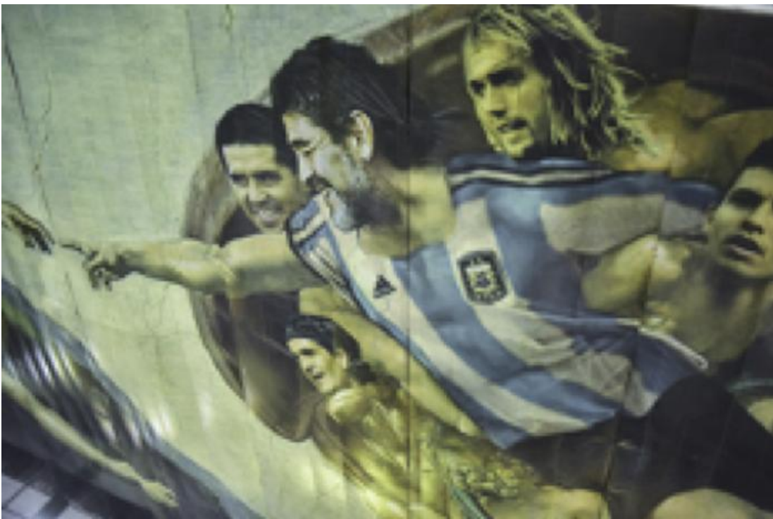
Santiago Barbeito, Murale Maradona, 2018