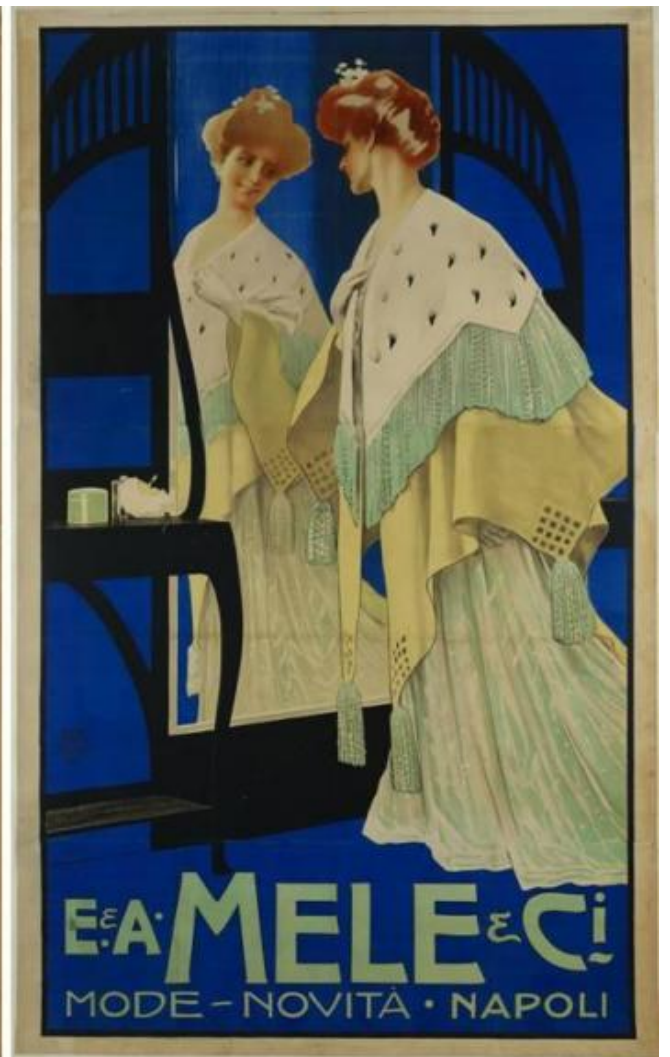
Manifesti pubblicitari per i Magazzini Mele di Napoli: Marcello Dudovich, 1907; Leopoldo Metlicovitz, 1900, 1909.