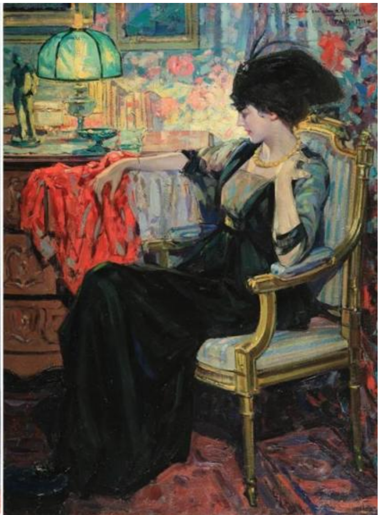
Filippo Palizzi e Giuseppe Cecchinelli, Fontana degli aironi, 1887; Ulisse Caputo, Figura di donna seduta, 1918

Il titolo della rassegna, N'aria 'e Primmavera , è mutuato da una strofa della poesia Marzo (1898) di Salvatore Di Giacomo: