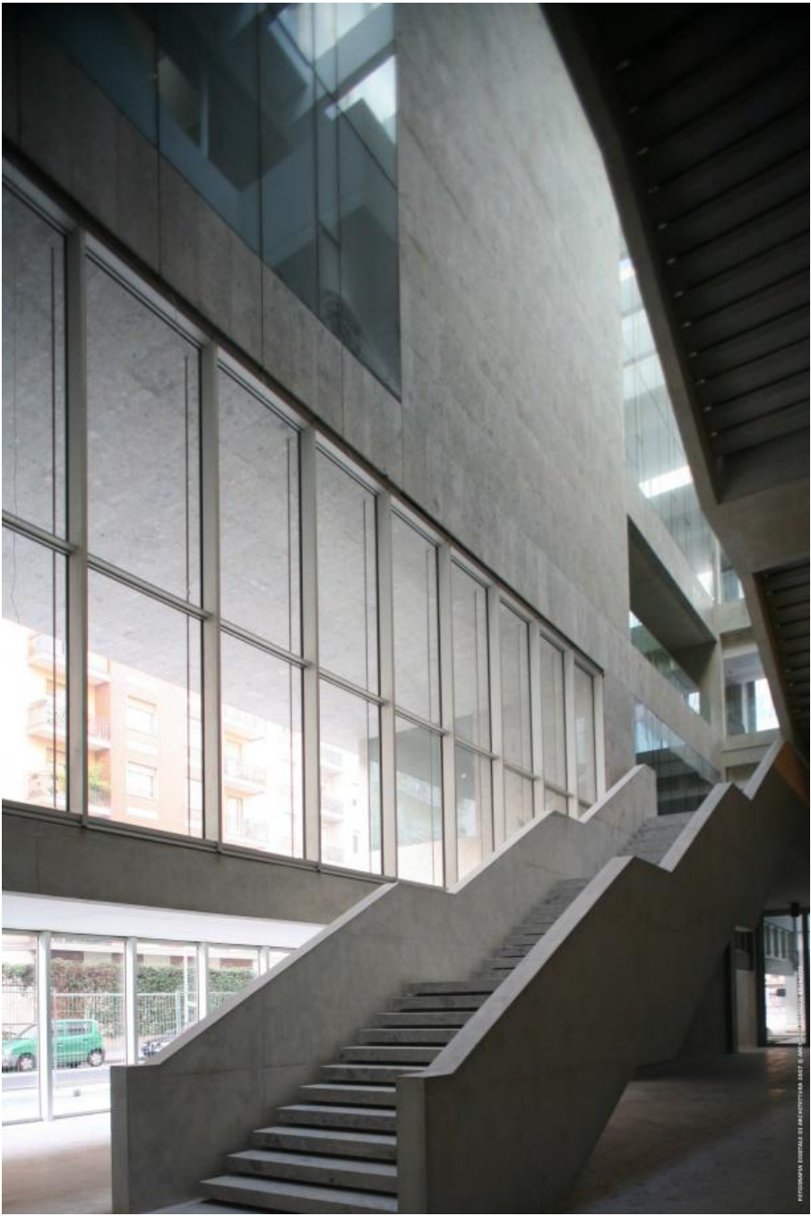
FOTOGRAFIA ARCHITETTURA BY ARCHITETTURA 2017 E 2018 - FOTOGRAFIA ARCHITETTURA