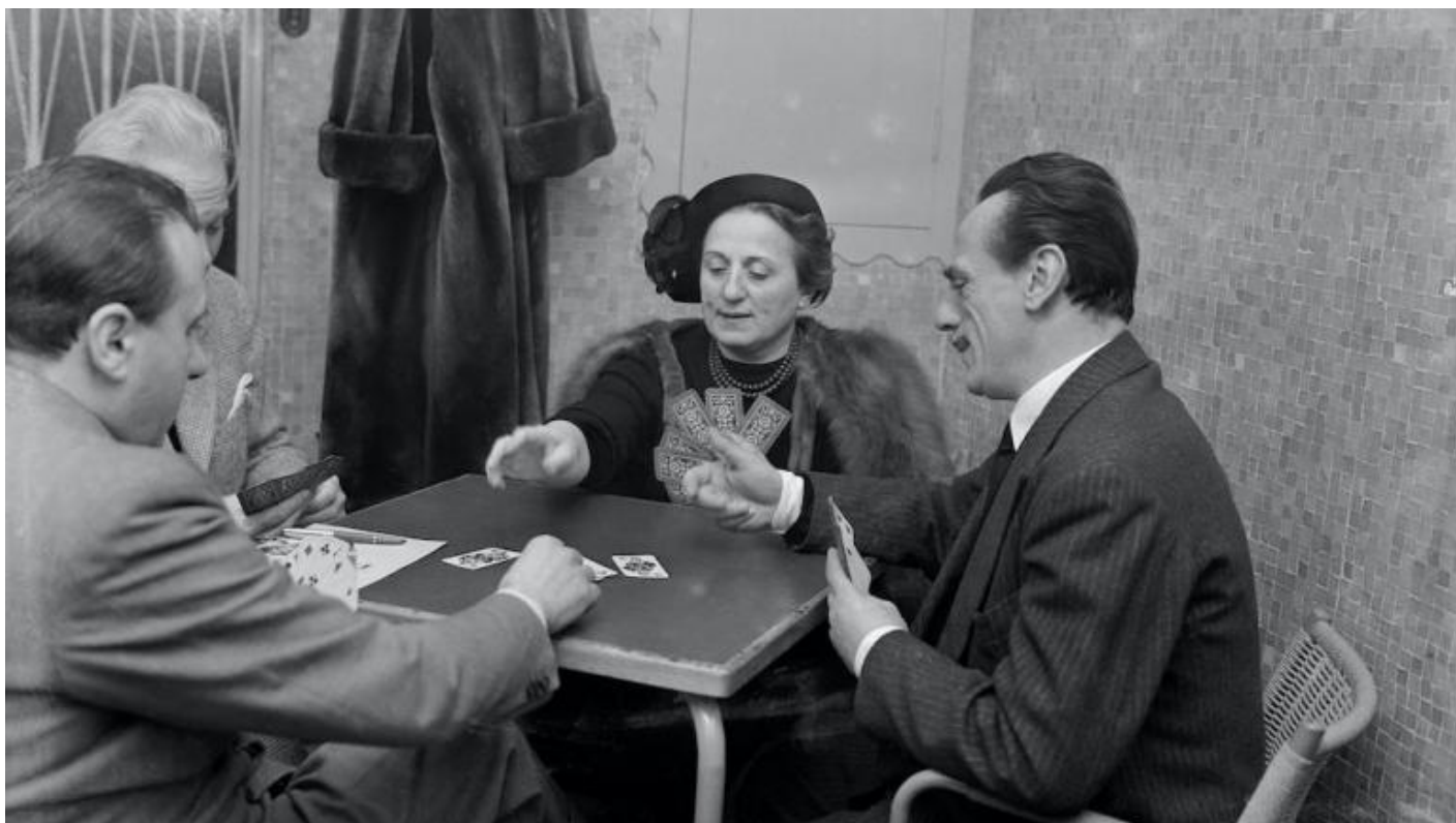
Scopone con Titina.

Il nostro Eduardo ripercorre le liti con Peppino, il rapporto con le tre compagne, in diversi periodi della vita, le vicende personali, l'amore per i figli, esemplificato in una poesia per Luca, che tratteggia anche la trasmissione d'arte: