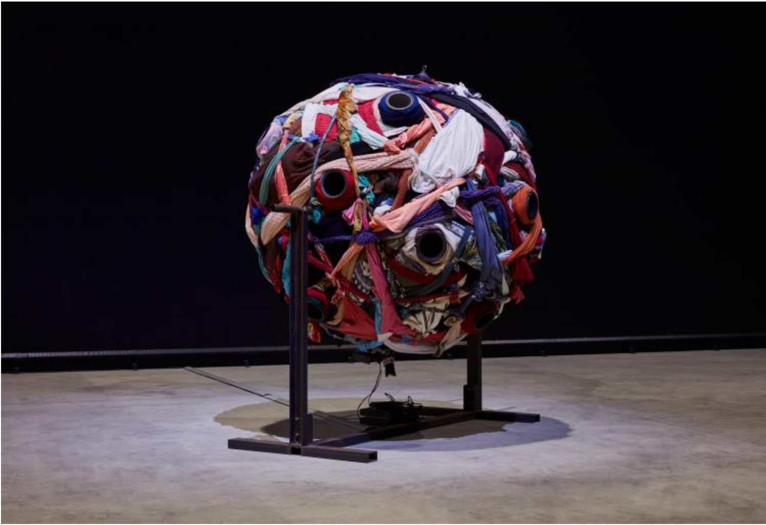
Chen Zhen The Voice of Migrators, 1995 Installation view, Pirelli HangarBicocca, Milan, 2020 PINAULT COLLECTION Â© Chen Zhen by ADAGP, Paris