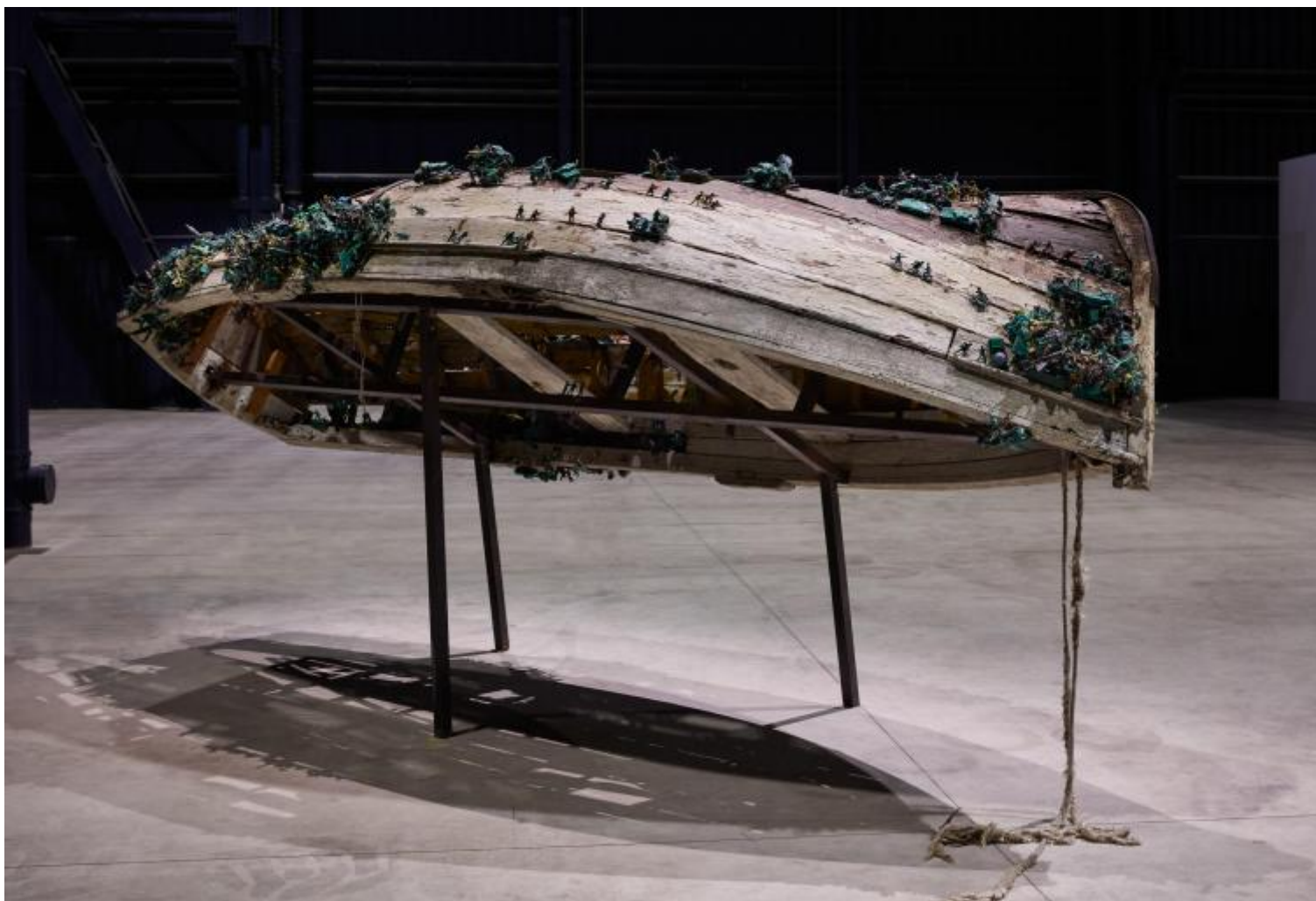
Chen Zhen Six Roots Enfance / Garçon - Childhood / Boy, 2000 Installation view, Pirelli HangarBicocca, Milan, 2020 © Chen Zhen by ADAGP, Paris

A.S. – La prima volta che ho visto Kiefer ero a Tel Aviv. Era il 2011, Breaking of the Vessels , l'inaugurazione del Museum of Art. Ascoltarti mi ha fatto sovrapporre due scene, a dieci anni di distanza, e lo ha fatto perché credo che sia stato allora – io ho poca memoria, quindi chissà se questo ricordo è davvero nato lì – che ho incontrato la parola “gratitudine”. Allora non credo che si fosse delineata così, nella mia testa, ma come una percezione molto confusa e molto embrionale del rapporto sacrale con la materia, l'incontro con il mondo, con la carne, con la terra sotto la suola delle scarpe. In quel momento studiavo Perec e leggevo W o il ricordo di infanzia , dove le lettere dell'alfabeto ebraico si fanno biscotto. Quello che dici: il vetro, la colla, i semi, le lamiere, le piccole storie e “l'histoire avec sa grande Hache”, l'ascia che aveva portato via la madre allo scrittore francese. Con “gratitudine”, oggi, in questa nuova scena, credo di intendere il rapporto con l'ulteriore. Si passa necessariamente dai crolli, dagli stracci, dal suono continuo e confuso delle voci dei dispersi in mare. Ma anche dalla tradizione – gli oggetti del suo “mondo di prima”, come lo hai chiamato –, dall'eredità, dallo sradicamento che è anche sempre nuova possibilità di dialogo. Non c'è altra via che la ferita del mondo, il taglio.