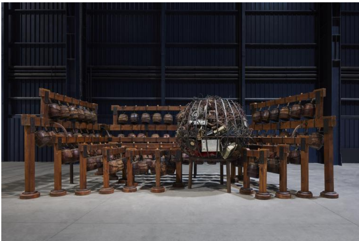
Chen Zhen Daily Incantations, 1996 Installation view, Pirelli HangarBicocca, Milan, 2020 Private collection, Courtesy de Sarthe Gallery, Hong Kong © Chen Zhen by ADAGP, Paris Courtesy Pirelli HangarBicocca, Milan Photo: Agostino Osio.

stillante dell'acqua (come non pensare ai film pi 1 liquidi di Andrej Tarkovskij?) si 1 convertito in pura, numinosa atmosfera. Mi sono messa ad ascoltarla e assorbirla. Gli occhi mi erano meno utili della pelle o del naso. Si trattava di respirare e ricordare, forse rivivere.