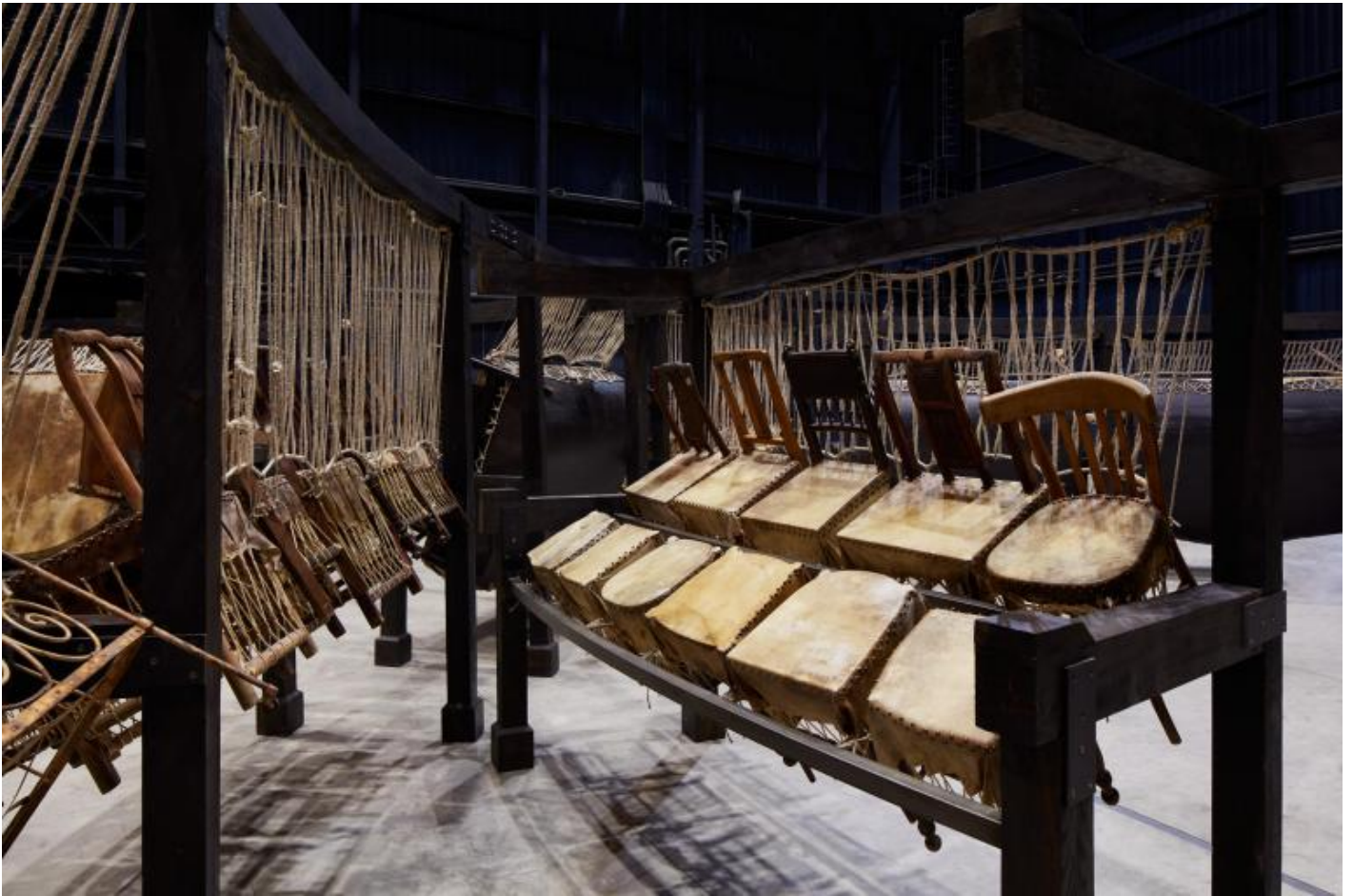
Chen Zhen Jue Chang, Dancing Body / Drumming Mind (The Last Song), 2000 (detail) Installation view, Pirelli HangarBicocca, Milan, 2020 PINAULT COLLECTION © Chen Zhen by ADAGP, Paris

La parola che mi viene in mente è "aggressione", ma credo che dipenda dal fatto che ho letto di recente un'intervista a Susan Sontag in cui sottolinea che la parola aggressione ha, nel tempo, acquisito un senso peggiorativo. Sontag trova questo ipocrita, poiché, dice, vivere è un'aggressione: muoversi nel mondo è occupare uno spazio, calpestare, modificare equilibri. Qualcosa mi ha detto di un'invasione: le macchinine coprono l'automobile, il rumore dei calcoli la preghiera: ma, insieme, mi pare davvero, come dice Sontag, che prendere la parola "aggressione" nella sua sola connotazione negativa sarebbe semplificare troppo. Non si tratta, come mi è parso, di denunciare un dominio, ma di mostrare il confine labile, lo spazio possibile. Mi sono chiesta, per esempio, prima di leggere, se quell'acqua incessante goccia a goccia a colmare le vasche e ricoprire gli oggetti della nostra vita quotidiana: libri, giocattoli, piatti, vestiti: fosse acqua che corrode o acqua che purifica.