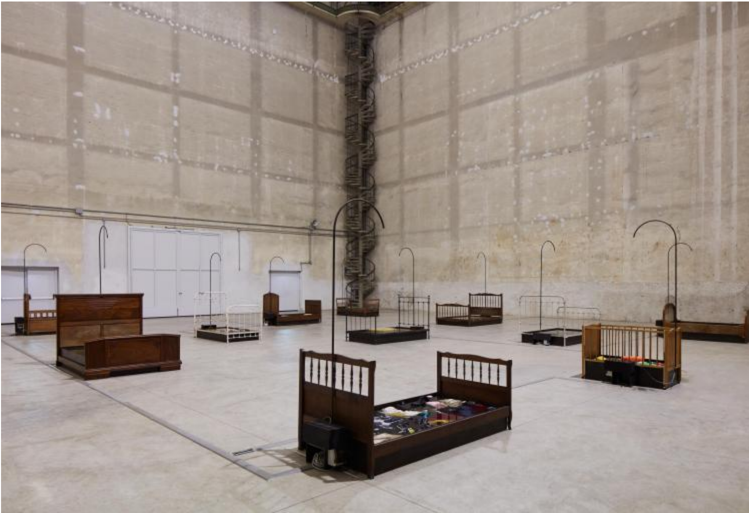
Chen Zhen Jardin-Lavoir, 2000 Veduta dell'installazione, Pirelli HangarBicocca, Milano, 2020 © Chen Zhen by ADAGP, Parigi

M.N. Era quello che desideravo, cara Anna: un'interlocuzione, un attraversare insieme a occhi ben aperti lo spazio dell'Hangar Bicocca popolato dalle opere (vogliamo chiamarla autobiografia artistica?) di Chen Zhen, un creatore che si è misurato per oltre vent'anni della sua brevissima vita (1955, Shanghai - 2000, Parigi) con l'annuncio della propria morte.