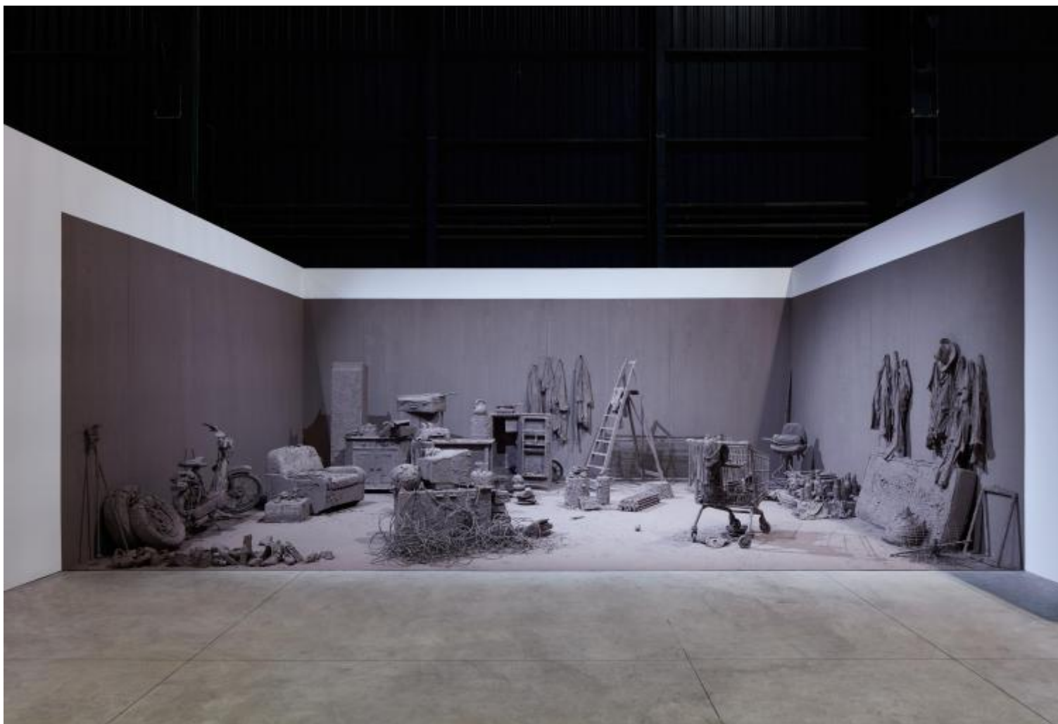
Chen Zhen Purification Room, 2000 Installation view, Pirelli HangarBicocca, Milan, 2020 © Chen Zhen by ADAGP, Paris Courtesy Pirelli HangarBicocca, Milan, and GALLERIA CONTINUA Photo: Agostino Osio.