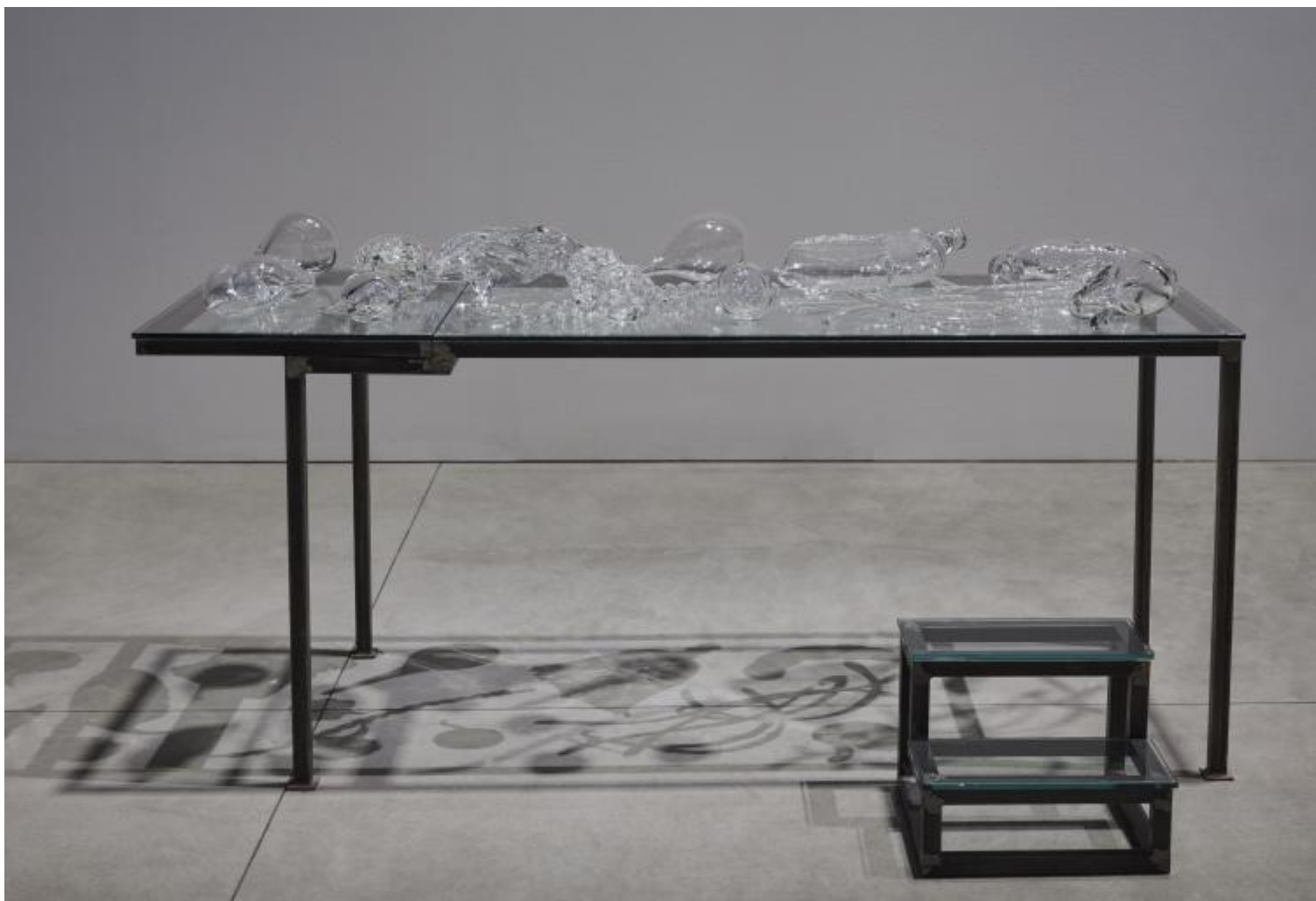
Chen Zhen Crystal Landscape of Inner Body (Serpent), 2000 Installation view, Pirelli HangarBicocca, Milan, 2020 © Chen Zhen by ADAGP, Paris, Courtesy Pirelli HangarBicocca, Milan, and GALLERIA CONTINUA Photo: Agostino Osio.

M.N. – “Quello che mi interessa è la trasformazione, non il monumento. Non costruisco rovine, ma sento che le rovine sono momenti in cui le cose si mostrano. Una rovina non è una catastrofe. È il momento in cui le cose possono ricominciare.” A dirlo è Anselm Kiefer, l’artista che ha ideato I sette palazzi celesti sotto i quali ti piace sostare. Oggi, per uno di quei casi nient’affatto casuali che si danno nell’arte, le sue vacillanti torri postatomiche occupano lo spazio che va attraversato per uscire dalla mostra di Chen Zhen. Bisogna passare da lì per tornare alla luce e all’aperto. Trasformate in luogo di transito, segnalano la resistenza impassibile della materia, la sua muta beanza.