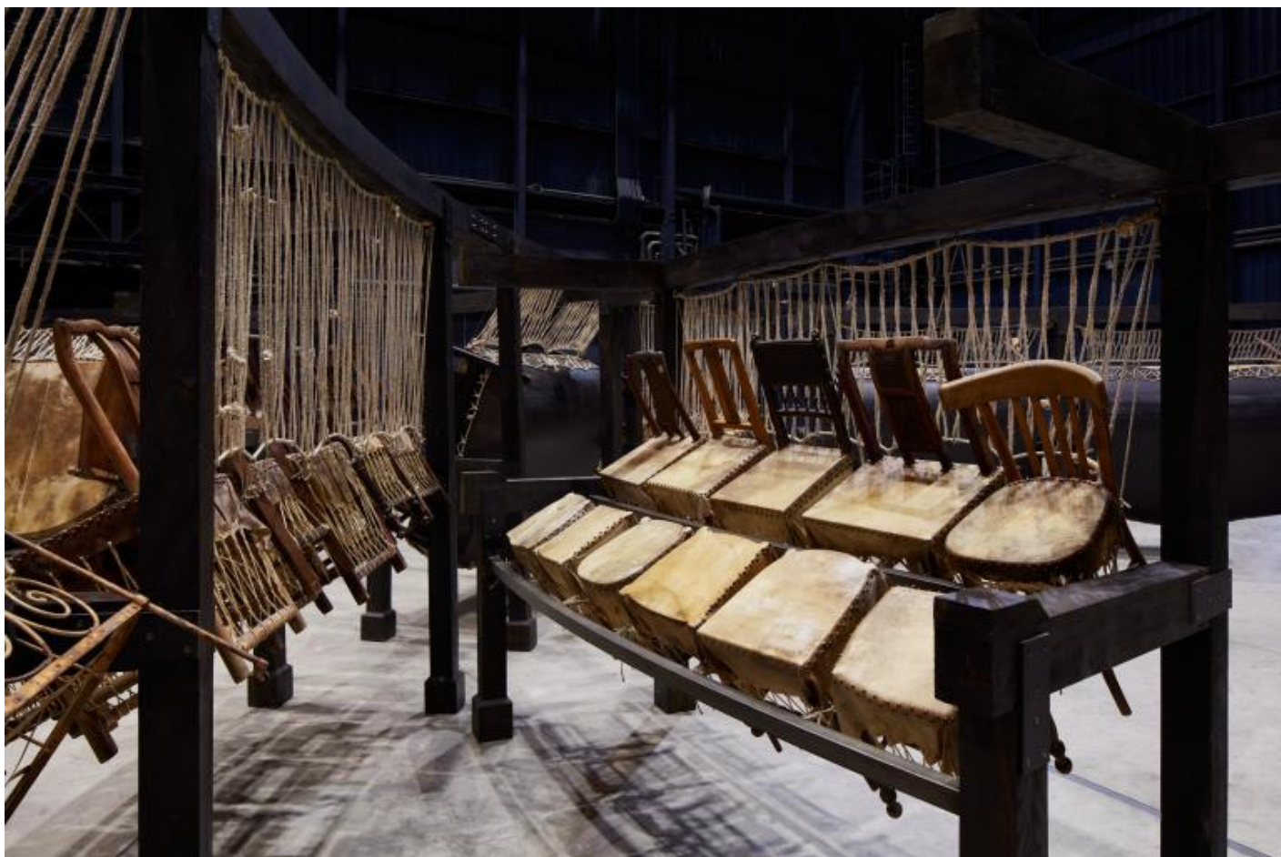
Chen Zhen Jue Chang, Dancing Body – Drumming Mind (The Last Song), 2000 (detail) Installation view, Pirelli HangarBicocca, Milan, 2020 PINAULT COLLECTION © Chen Zhen by ADAGP, Paris

La parola che mi viene in mente è “aggressione”, ma credo che dipenda dal fatto che ho letto di recente un’intervista a Susan Sontag in cui sottolinea che la parola aggressione ha, nel tempo, acquisito un senso peggiorativo. Sontag trova questo ipocrita, poiché, dice, vivere è un’aggressione: muoversi nel mondo è occupare uno spazio, calpestare, modificare equilibri. Qualcosa mi ha detto di un’invasione – le macchinine coprono l’automobile, il rumore dei calcoli la preghiera – ma, insieme, mi pare davvero, come dice Sontag, che prendere la parola “aggressione” nella sua sola connotazione negativa sarebbe semplificare troppo. Non si tratta, così mi è parso, di denunciare un dominio, ma di mostrare il confine labile, lo spazio possibile. Mi sono chiesta, per esempio, prima di leggere, se quell’acqua incessante goccia a goccia a colmare le vasche e ricoprire gli oggetti della nostra vita quotidiana – libri, giocattoli, piatti, vestiti – fosse acqua che corrode o acqua che purifica.