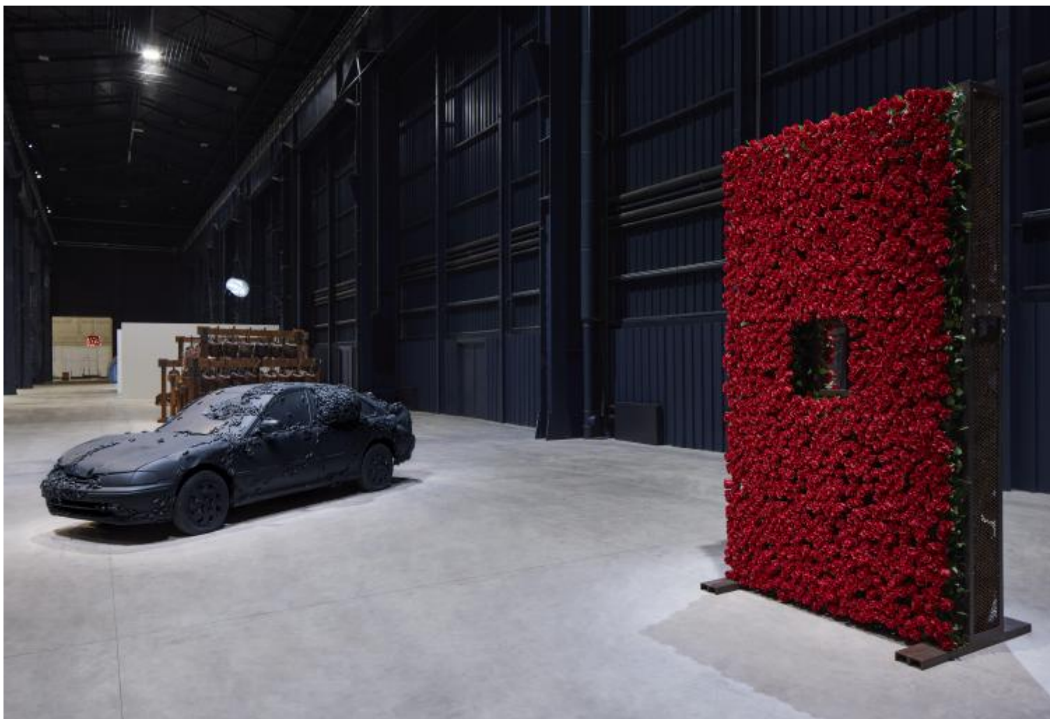
Chen Zhen Veduta della mostra, "Short-circuits", Pirelli HangarBicocca, Milano, 2020