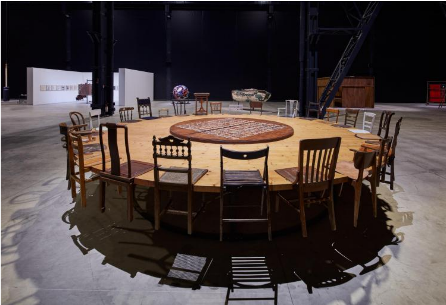
Chen Zhen Exhibition view, â??Short-circuitsâ?•, Pirelli HangarBicocca, Milan, 2020 Â© Chen Zhen by ADAGP, Paris

dâ??uso quotidiano, materiali di scarto. Ne nascono opere aderenti allâ??esistente, quasi una sua replica, che tuttavia non descrivono, anzi sembrano contestare il visibile.