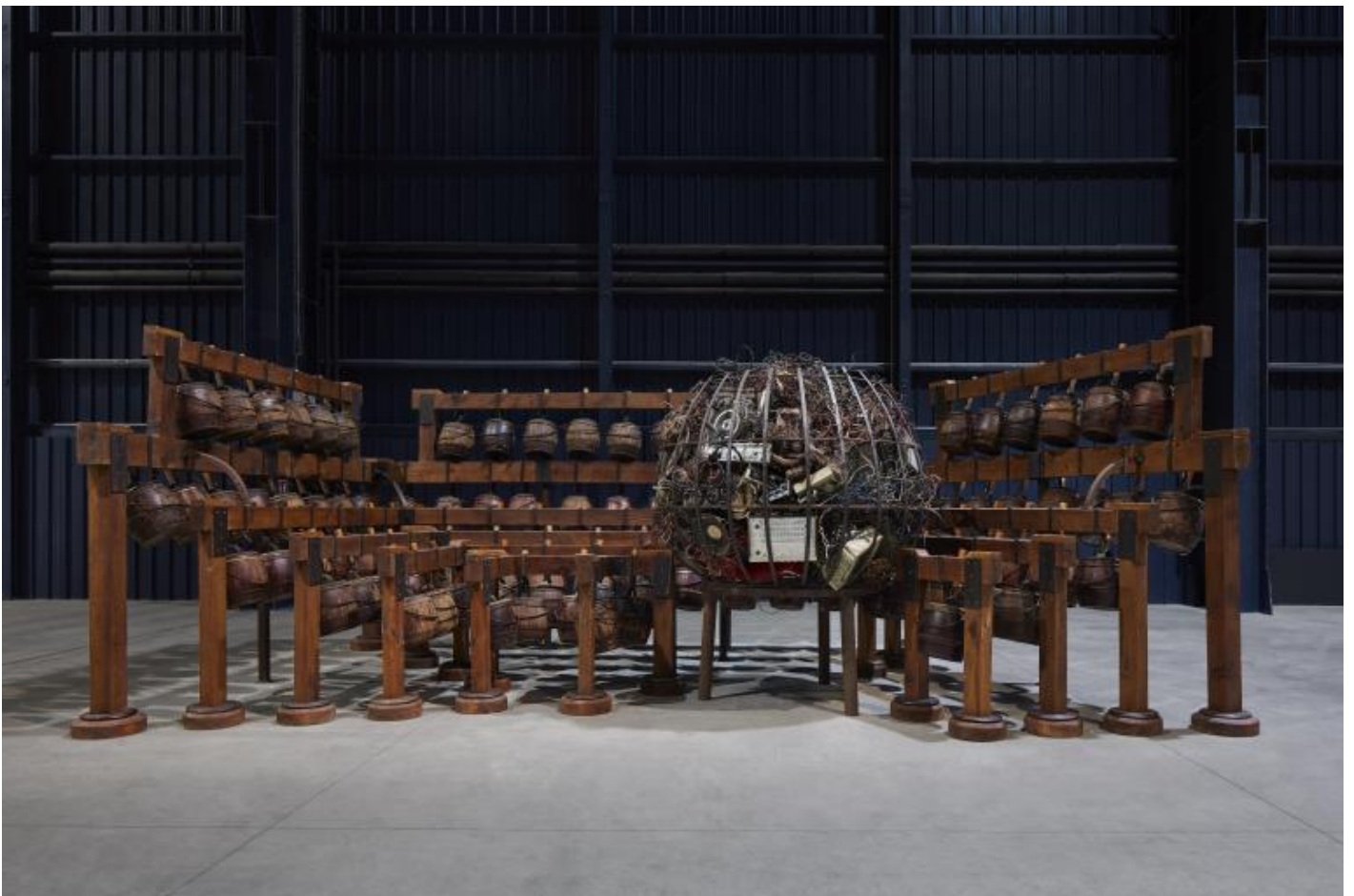
Chen Zhen Daily Incantations, 1996 Installation view, Pirelli HangarBicocca, Milan, 2020 Private collection, Courtesy de Sarthe Gallery, Hong Kong È© Chen Zhen by ADAGP, Paris Courtesy Pirelli

Corrente, accidentalitÀ , contatto, resistenza. Cose, oggetti, pensieri, le nostre vite fluiscono, non ristagnano, vengono misteriosamente a contatto e quellÈ?accidentalitÀ puÀ produrre uno scontro oppure unÈ?osmosi, una ferita o una stasi transitoria, una piccola pace. Tu parli dellÈ?acqua, del ritmo implacabile con cui Chen Zhen la costringe ad annegare i referti di una quotidianitÀ in via di estinzione, e ti domandi se sia acqua che sommerge o salva. E se non facesse nÈ" lâ?una nÈ" lâ?altra cosa, ma creasse semplicemente un ambiente acustico che scardina le coordinate spaziali È? sotto e sopra, dentro e fuori È? e disallinea passato e presente? SÈ", quel grande cubo di cemento colmo di letti disattivati e del suono stillante dellÈ?acqua (come non pensare ai film piÀ liquidi di Andrej Tarkovskij?) si È" convertito in pura, numinosa atmosfera. Mi sono messa ad ascoltarla e assorbirla. Gli occhi mi erano meno utili della pelle o del naso. Si trattava di respirare e ricordare, forse rivivere.