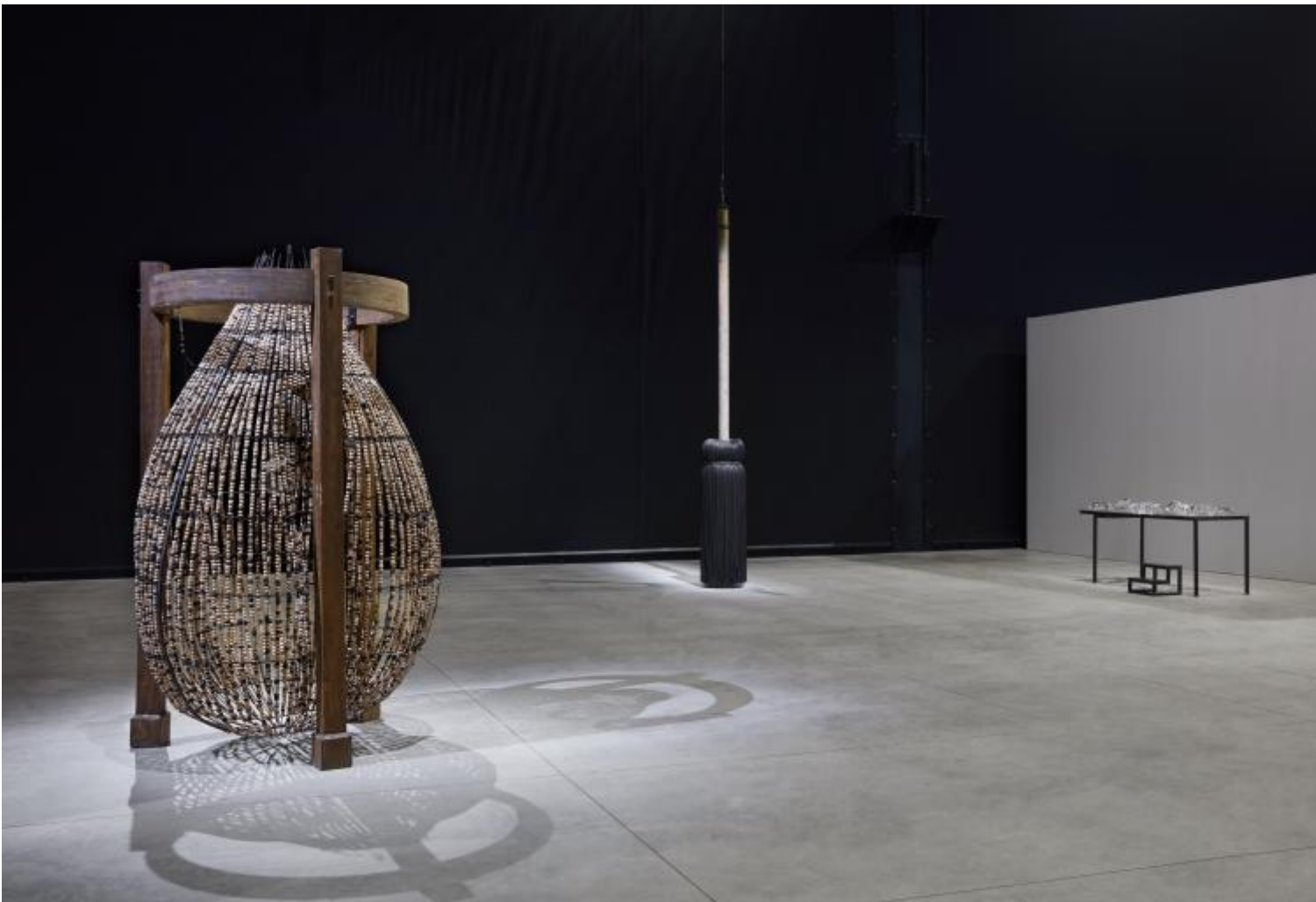
Chen Zhen Veduta della mostra, â??Short-circuitsâ?•, Pirelli HangarBicocca, Milano, 2020    Chen Zhen by ADAGP, Parigi

non credi? Abbracciare il proprio corpo, toccarlo. Mi sembra davvero una vittoria ultima sulla legge di necessit  .