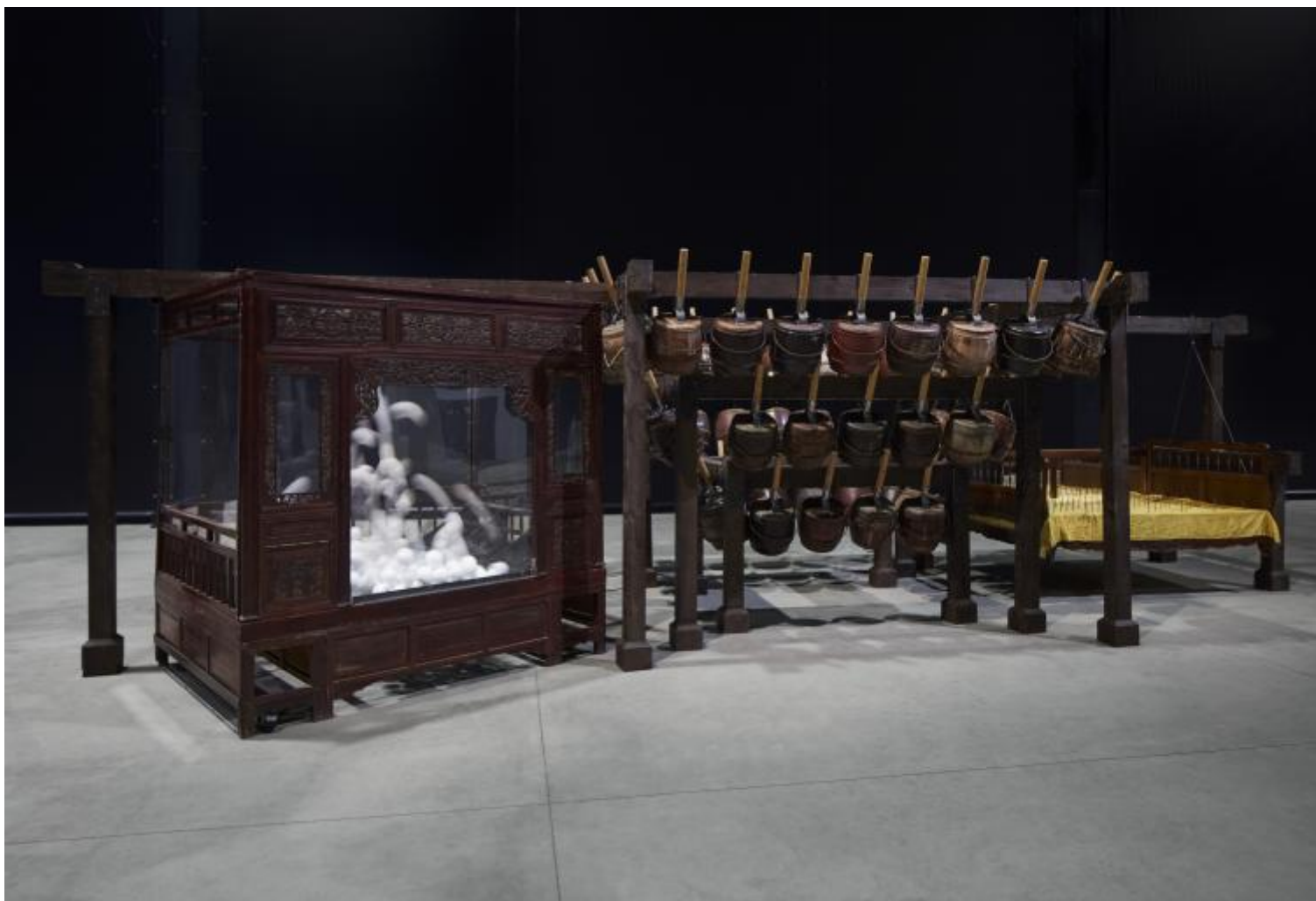
Chen Zhen Nightly Imprecations, 1999 Installation view, Pirelli HangarBicocca, Milan, 2020 Private collection, Courtesy Blondeau & Cie, Geneva © Chen Zhen by ADAGP, Paris Courtesy Pirelli HangarBicocca, Milan Photo: Agostino Osio.

L'opera di entrambi muove il pensiero, emoziona, perturba, induce a chiedersi chi siamo nel mondo. E lo fa proponendo una modalità che, ancora una volta, ha a che vedere con lo spazio e con il tempo: ambedue gli artisti stratificano, incrostano, sovrappongono, macerano, giustappongono sostanze stridenti (il vetro e il ferro, il cemento e la carta). Il riciclaggio cui sottopongono materiali e oggetti dismessi è un preciso gesto politico: muta la storia delle cose e le converte in Storia, ovvero in un fatto dolorosamente collettivo.