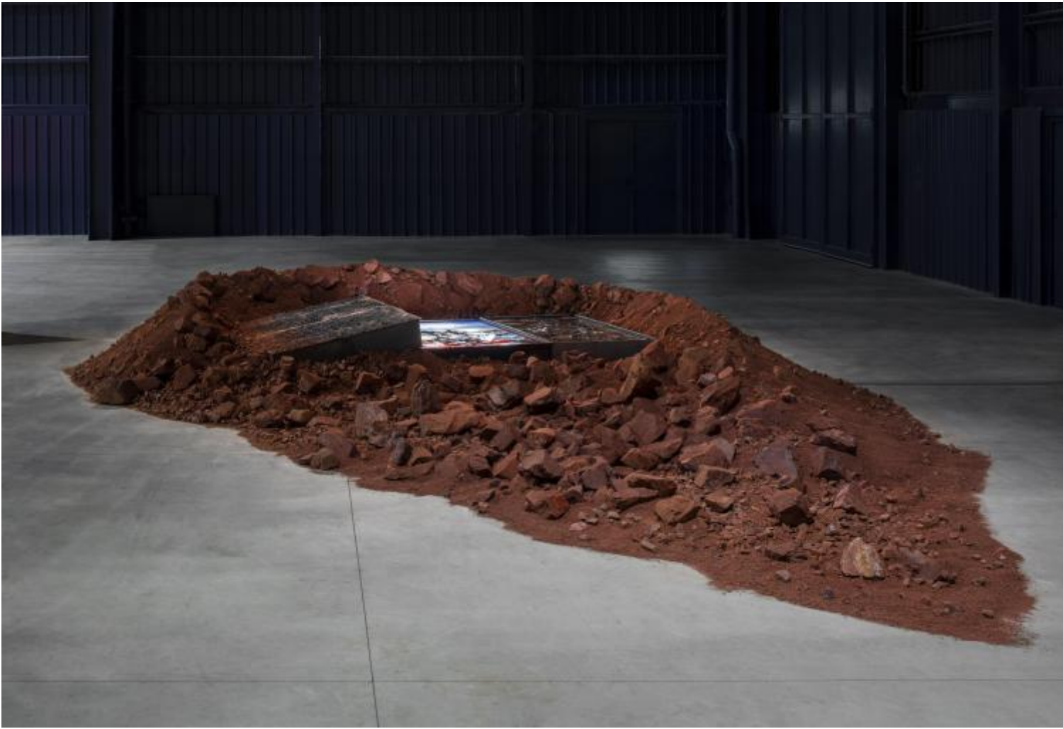
Chen Zhen Eruption Future, 1992 Installation view, Pirelli HangarBicocca, Milan, 2020 Private collection, Paris Â© Chen Zhen by ADAGP, Paris