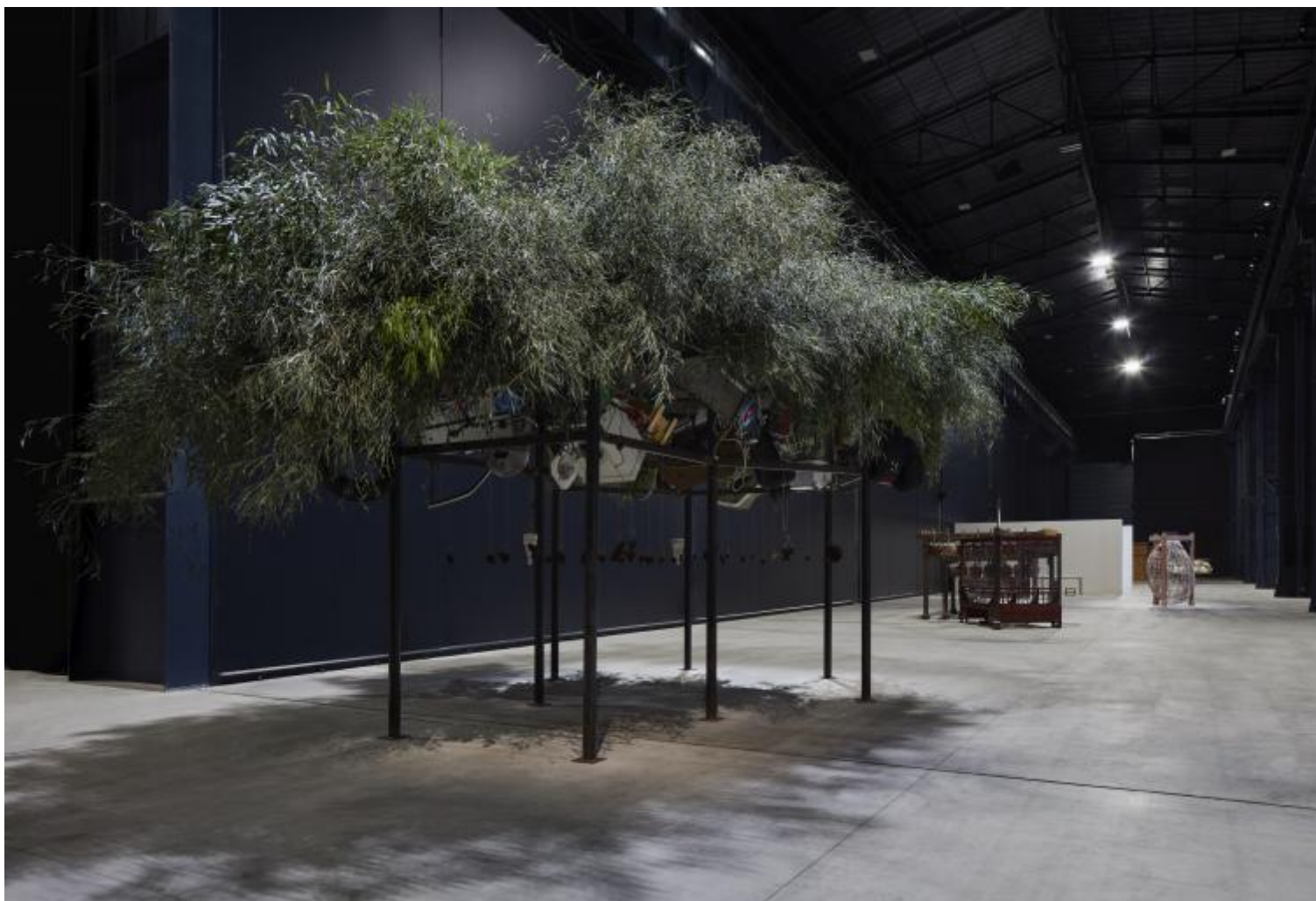
Chen Zhen Fu Dao / Fu Dao, Upside-down Buddha / Arrival At Good Fortune, 1997 Installation view, Pirelli HangarBicocca, Milan, 2020 © Chen Zhen by ADAGP, Paris

Chen Zhen mi pare racconti questo, e mi pare che raccontare la ferita del mondo, attraverso gli occhi di un rapporto mutato con esso – dato dalla sua storia singolare –, sia, infine, l’unico modo di cantarlo, il mondo. Ecco perché dico gratitudine. Una forma del rilanciare: dopo di me, come prima di me, in questo mutare di forme e scenari di guerra e rinascite. Divago, ma io credo che questa sia la ragione per cui le scuole dovrebbero frequentare gli spazi dell’arte. Quei soldatini di plastica, la miriade di macchinine giocattolo che ricoprono il rottame di automobile ( Perseverance of Regeneration , 1999): soltanto nella prossimità incendiata si avverte il proliferare di insetti sulla pelle. Insetti del consumo, della distruzione. Se non sento che camminano proprio su di me, come avverto la ferita? Sono stata poco davanti ai bambù con i Buddha rovesciati e le televisioni e i circuiti elettronici e la bicicletta appesi ( Fu Dao / Fu Dao, Upside-down Buddha / Arrival at Good Fortune , 1997). Mi sono raccontata che sono alta e non potevo camminarci sotto, ma la verità è che in quel rovesciato c’era qualcosa, per me, nel mio corpo fisico, di faticoso: sotto-sopra.