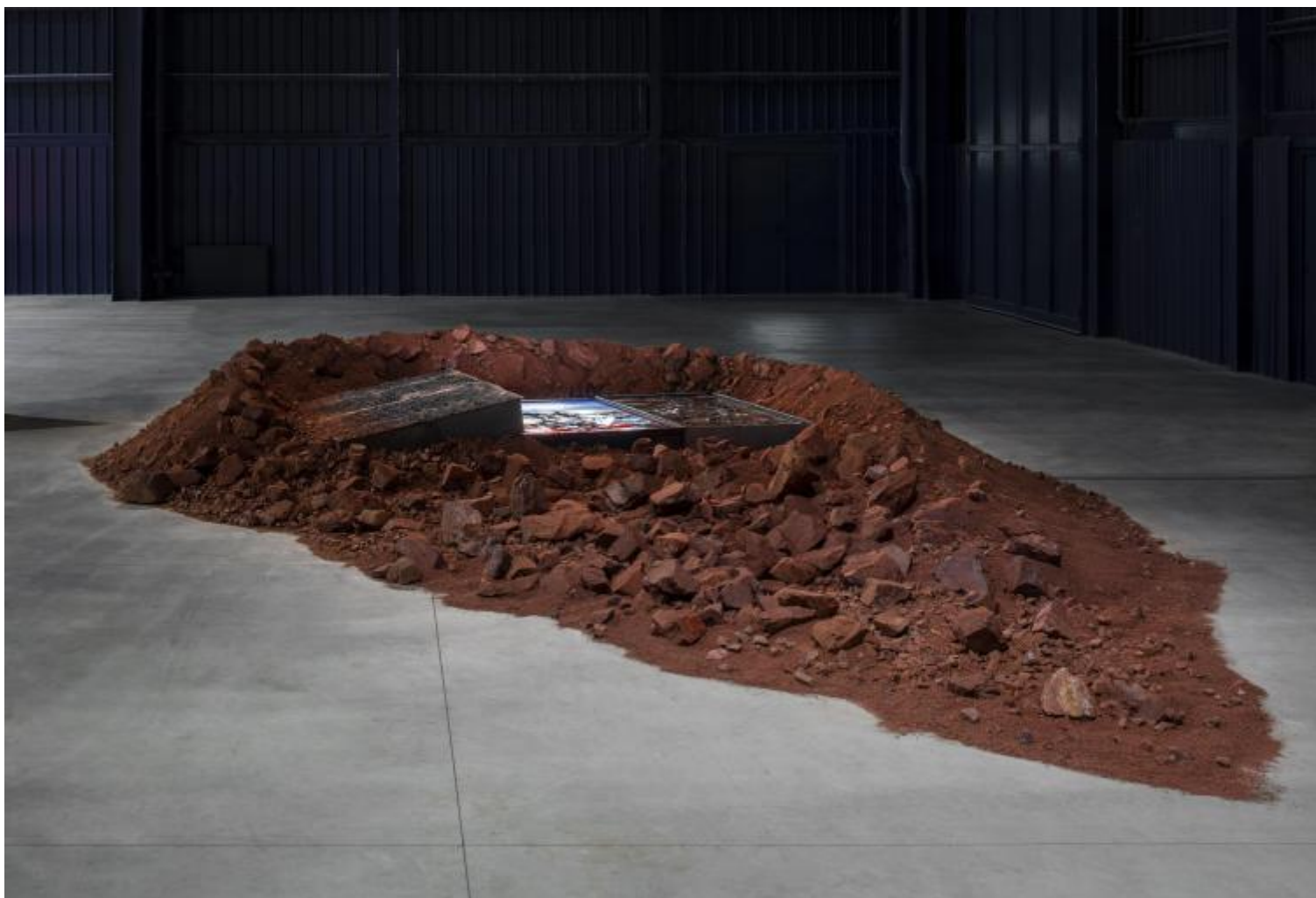
Chen Zhen Eruption Future, 1992 Installation view, Pirelli HangarBicocca, Milan, 2020 Private collection, Paris © Chen Zhen by ADAGP, Paris Courtesy Pirelli HangarBicocca, Milan Photo: Agostino Osio.

Lo sfondamento della trincea binaria – nell’esperienza artistica e esistenziale di Chen Zhen, tra Cina e Parigi, c’è del resto lo spartiacque/ponte del Tibet – immette non solo in una terzietà spaziale, ma in una dimensione temporale inedita, che non può essere indagata se non soggettivamente, affidandosi a catene associative che nascono dalla memoria epigenetica e dal sogno, da quella zona dell’esperienza personale che precede l’acquisizione della parola e coincide con il sapere assoluto del corpo. Che sia per questo che tra i “materiali” usati con più evidente piacere plastico da Chen Zhen ci sono la musica, il suono, i rumori e il silenzio, l’altissimo silenzio congelato nella sua Purification Room del 2000?