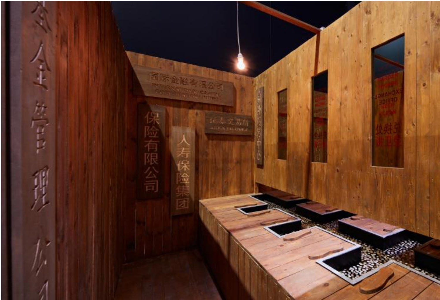
Chen Zhen Le Bureau de change, 1996-2004 Installation view, Pirelli HangarBicocca, Milan, 2020