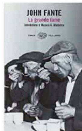
Dago Red (1940), Il Dio di mio padre (1985), Una moglie per Dino Rossi (1985), La grande fame (2000)