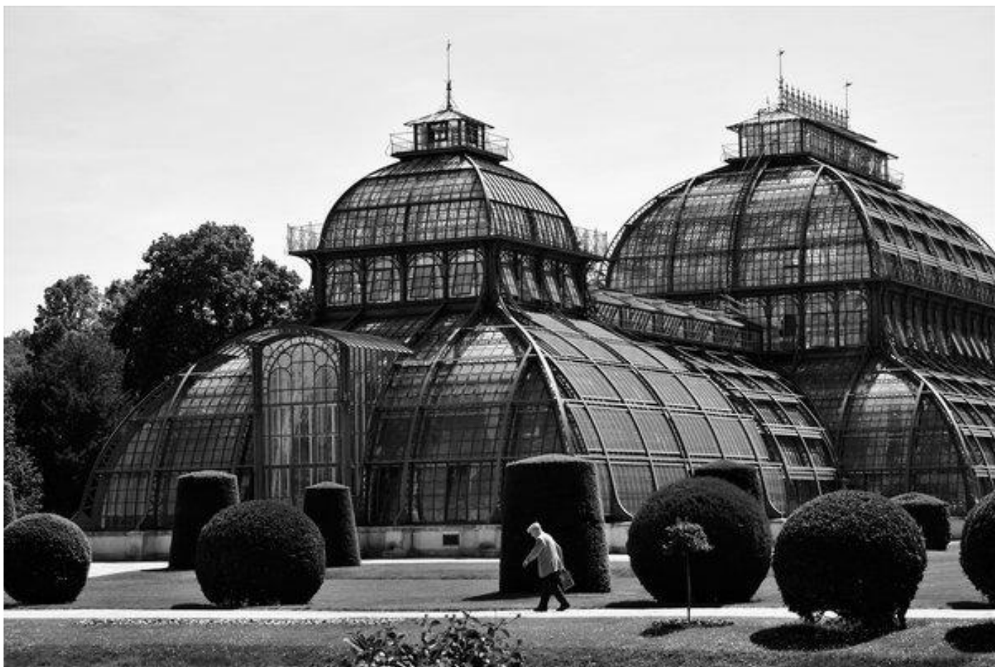
Palmenhaus, Schönbrunn.

Sebbene sia uno dei quartieri più vasti di Vienna, in pochi giorni potevamo dire di averlo in tasca, esplorato in lungo e in largo – e pareva che nessuna targa commemorativa o palazzina in Jugendstil, anche la più timida e nascosta, ci fosse sfuggita. Era necessario – ma forse lo era più per me, che per le bambine e mia moglie – escogitare un nuovo itinerario, con un obiettivo preciso, un punto verso cui tendere corpo e mente, una meta, dunque, che trascendesse la mera urgenza di movimento e aria aperta.