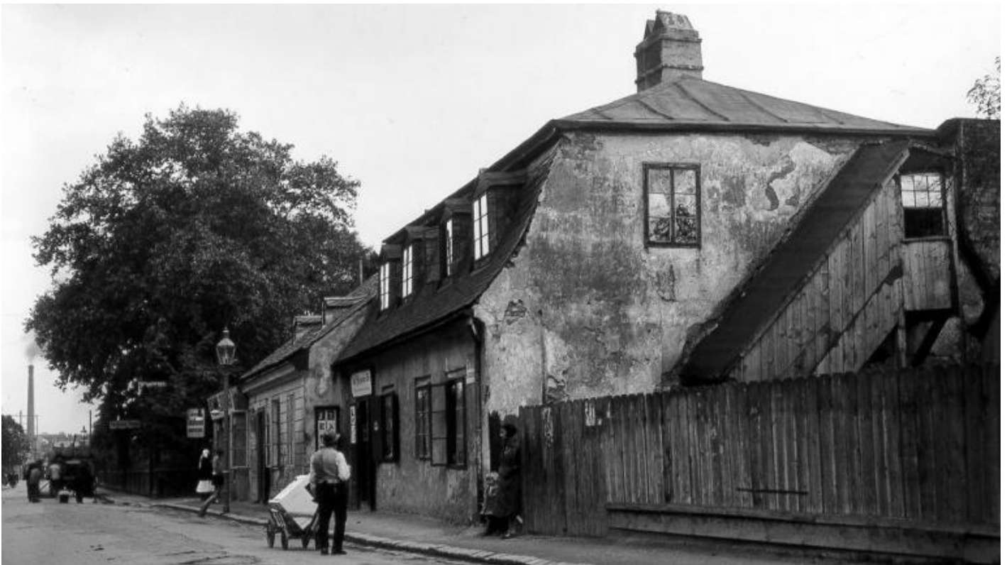
AuhofstraÃ?e 191-193, 1130 Wien.

Â«Nella Auhofstrasse, a cinque minuti da casa mia, scendendo la collina, câ??era una latteria [Molkerei] che vendeva yogurt, pane e burro, cibi che potevo consumare tranquillamente allâ??unico tavolino del negozio, seduto sullâ??unica sedia. Era lÃ che facevo colazione prima di andare in laboratorio. E quando restavo a casa ci tornavo anche piÃ tardi, durante la giornata. In quegli anni vivevo volentieri di pane e burro e yogurt, perchÃ© risparmiavo il piÃ possibile per comprarmi dei libri.Â»