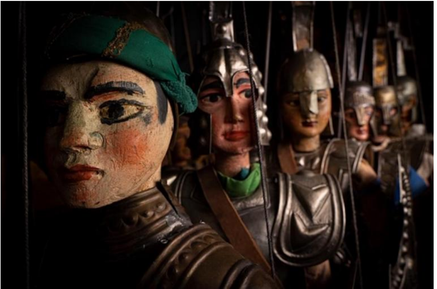
Guerrieri dell'Ira di Achille.