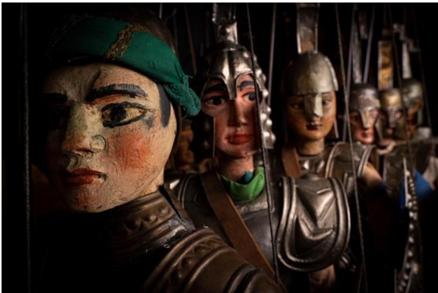
Guerrieri dell'Ira di Achille.