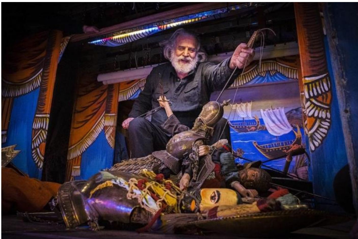
Un'immagine da Eneide.