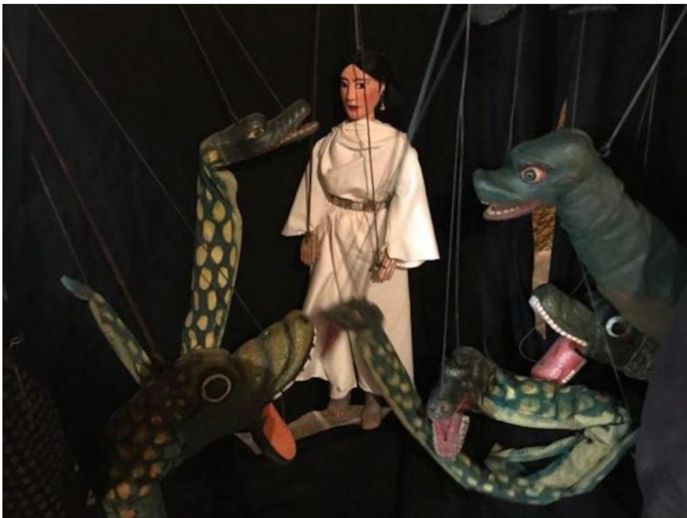
Un'immagine da Medusa.