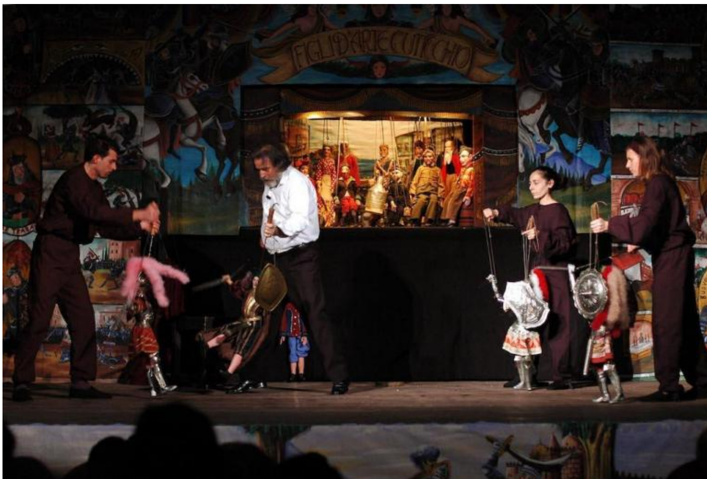
Un'immagine da Don Giovanni.

Continua Cuticchio: “Aprimmo quindi la sala nel vecchio magazzino vicino all’antico porto arabo. Intanto continuava il lavoro nelle scuole. Non potevo tornare tutti gli anni con le stesse storie. Gli insegnanti mi chiedevano se avevo qualcosa di nuovo e dovevo far fronte alla concorrenza di clown, prestigiatori, giocolieri, animatori... Mi misi a leggere alcuni libri di testo delle medie e scoprii che studiavano l’ Iliade , l’ Odissea e altri poemi. Dal 1974 iniziai a costruire i pupi per queste altre storie, e ci sono voluti molti anni. Integravo le nuove figure con paggetti della tradizione. Il lavoro più impegnativo è stato sbalzare le armature. L’ Iliade è quasi diventata un’ Odissea , tanto ci ho lavorato”.