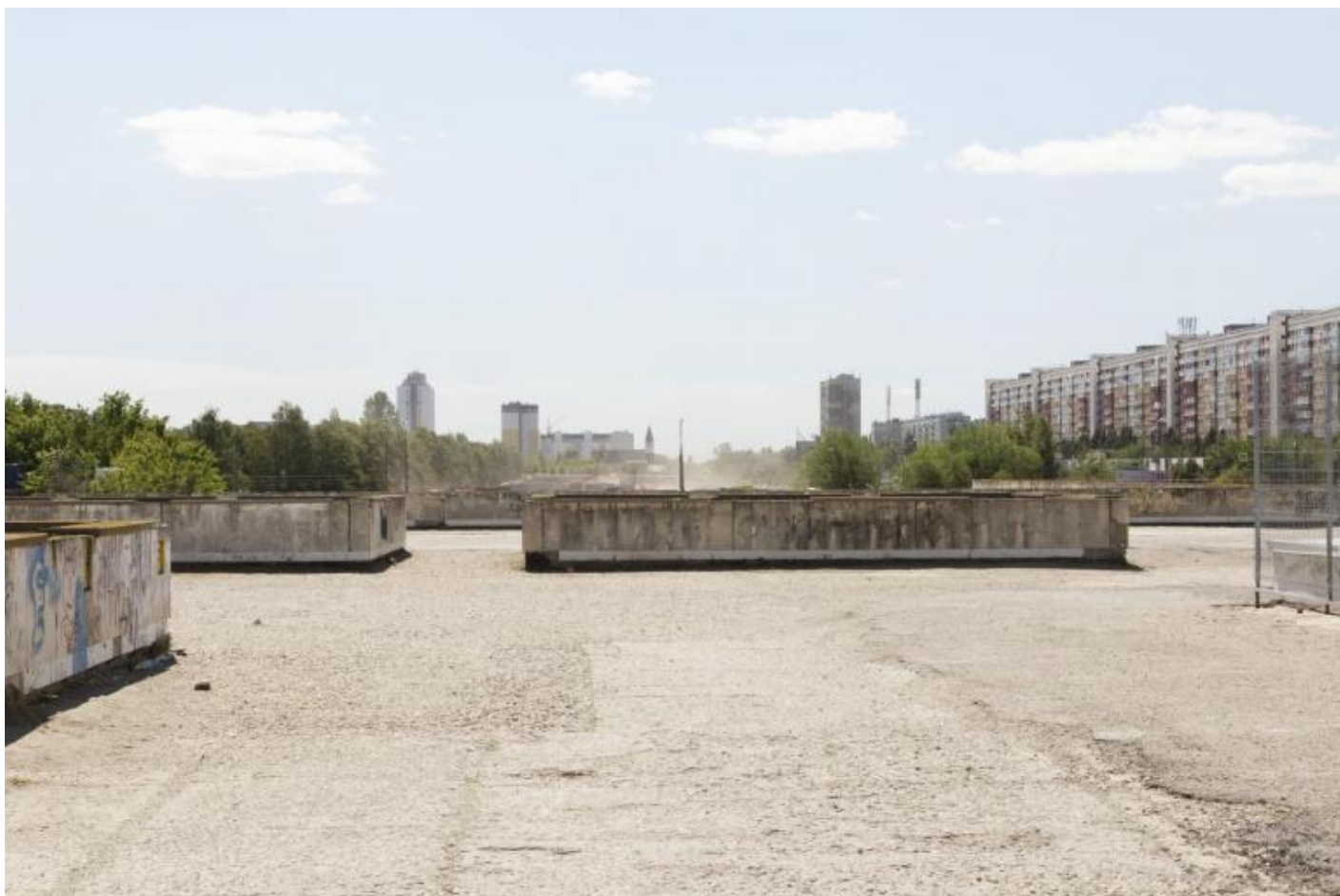
Foto Giovanna Silva da Togliatti. La fabbrica della Fiat © Humboldt Books 2020.