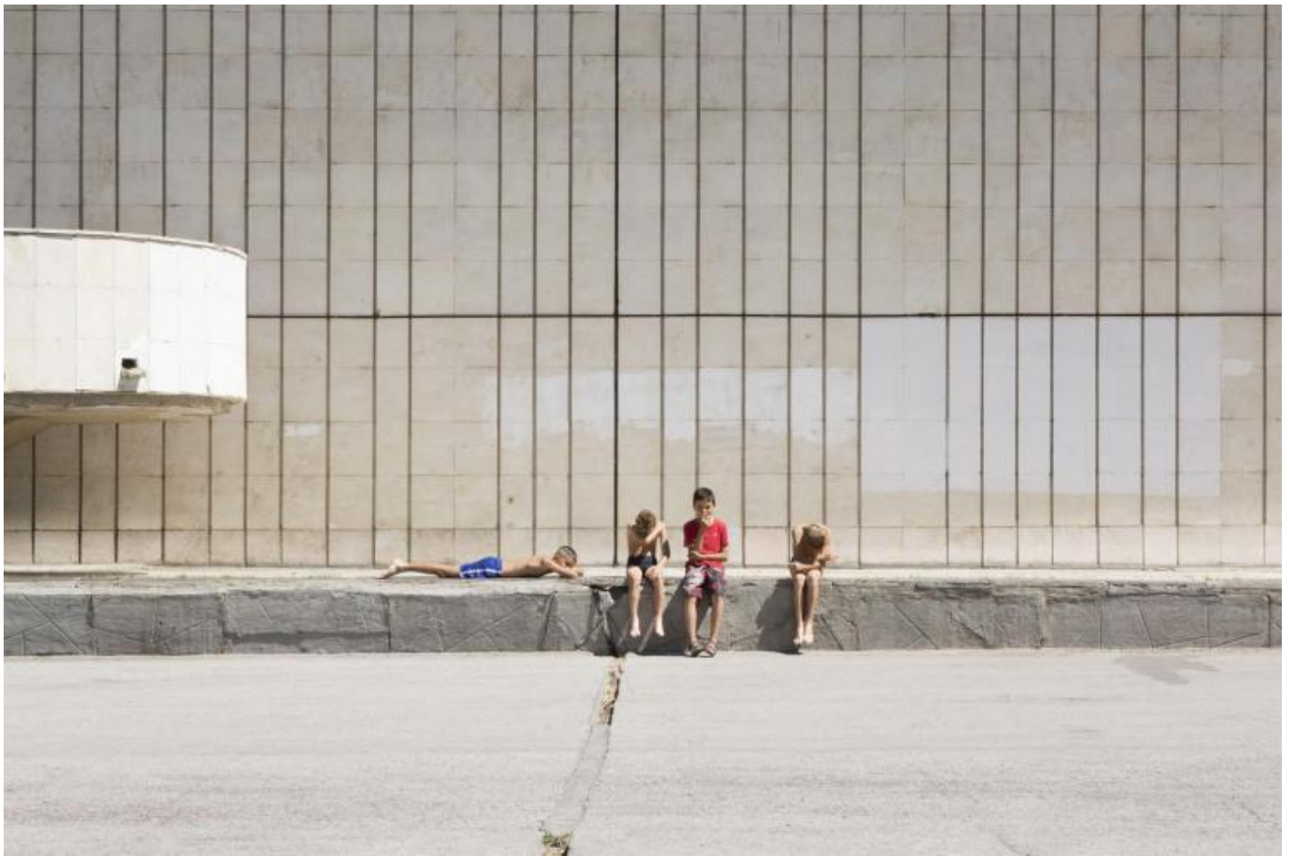
Foto Giovanna Silva da Togliatti. La fabbrica della Fiat © Humboldt Books 2020.

La nostalgia resta la musa di queste pagine. Ma di quale nostalgia si tratta? Mentre in Europa questo sentimento si fonda sulla percezione del tempo — il tempo passato e perduto —, quello presente invece nell'anima russa nasce dallo spazio, dalle immense estensioni di quel paese, che anche qui nella regione del Volga dominano incontrastati — lo stesso fiume davanti a Togliatti — quasi un lago. Tra le molte malinconie presenti in questo libro non c'è — per me — quella per la fine del comunismo. Anzi, giunta — quasi consolata — dall'epilogo storico dell'URSS. Quando l'autore visiona insieme con l'ingegnere Mangiarino, suo mentore nel viaggio dentro la storia della AutoVAZ, un documentario dedicato alla città di Togliatti, l'uomo Fiat richiama la sua attenzione sulla parte dedicata all'inaugurazione dello stabilimento.