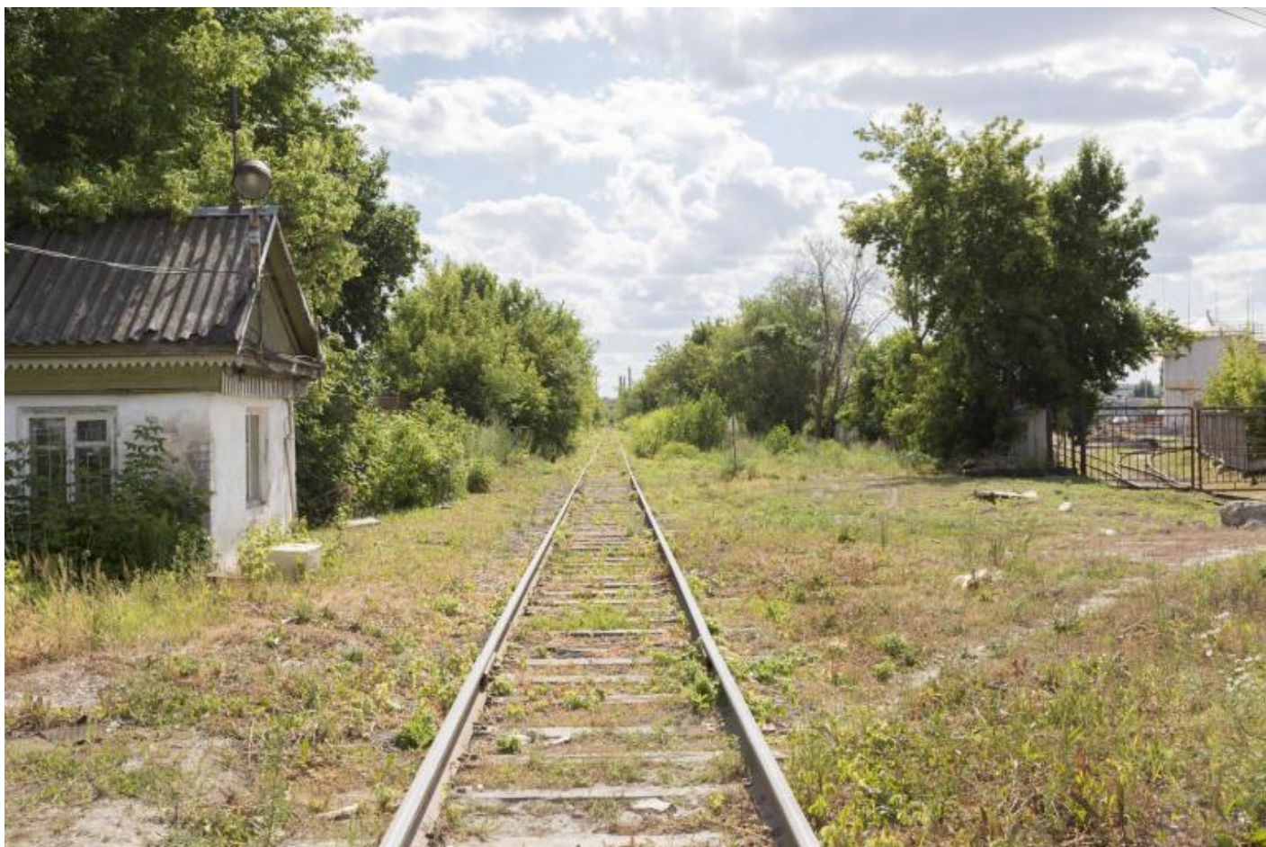
da Togliatti. La fabbrica della Fiat