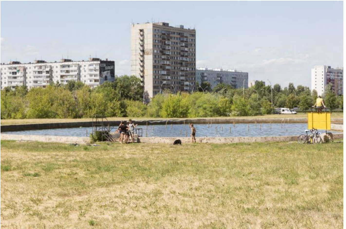
Foto Giovanna Silva da Togliatti. La fabbrica della Fiat © Humboldt Books 2020.

Togliatti Ã lo schermo su cui proiettare una sorta di delusione per come sono andate le cose? Uscito nei giorni della seconda ondata della pandemia, che ha congelato le nostre vite in unâ attesa che non sembra finire mai, nella sospensione dei giorni e del lavoro, dello studio, dei viaggi, e altro ancora, questo bel libro risulta postumo a sÃ© stesso. Tuttavia nelle foto di Giovanna Silva il volume risulta riposante, perchÃ© non sempre il tempo passato suscita ricordi malinconici, a volte rappresenta invece un meraviglioso momento di sosta nellâ incessante accelerazione che connota la nostra epoca. Camminando allâ indietro a passi di gambero, Giunta e Silva ci hanno concesso un prezioso e salutare tempo di riflessione.