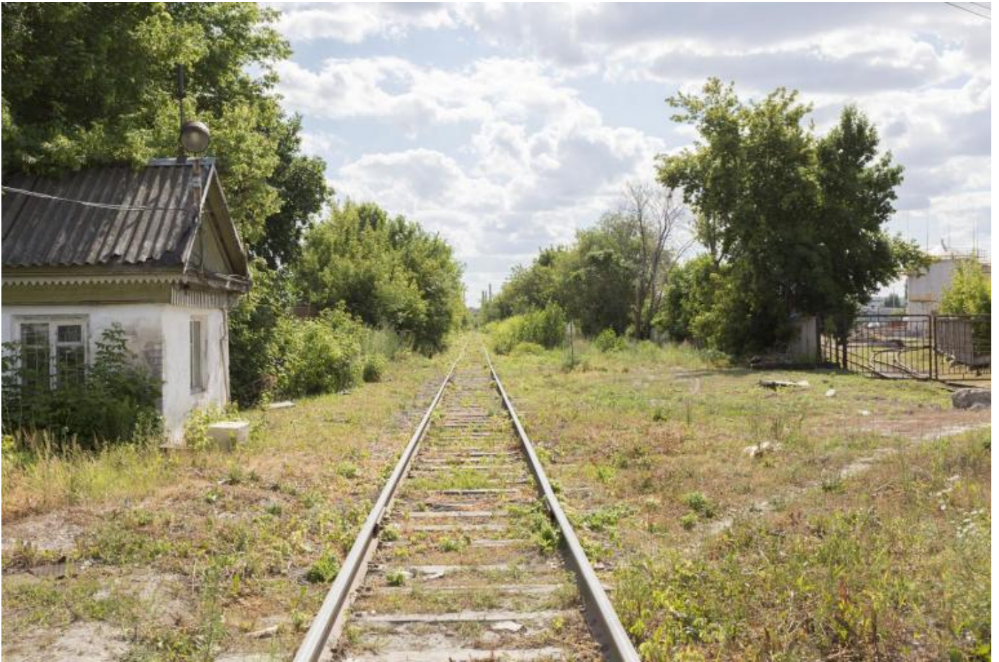
da Togliatti. La fabbrica della Fiat