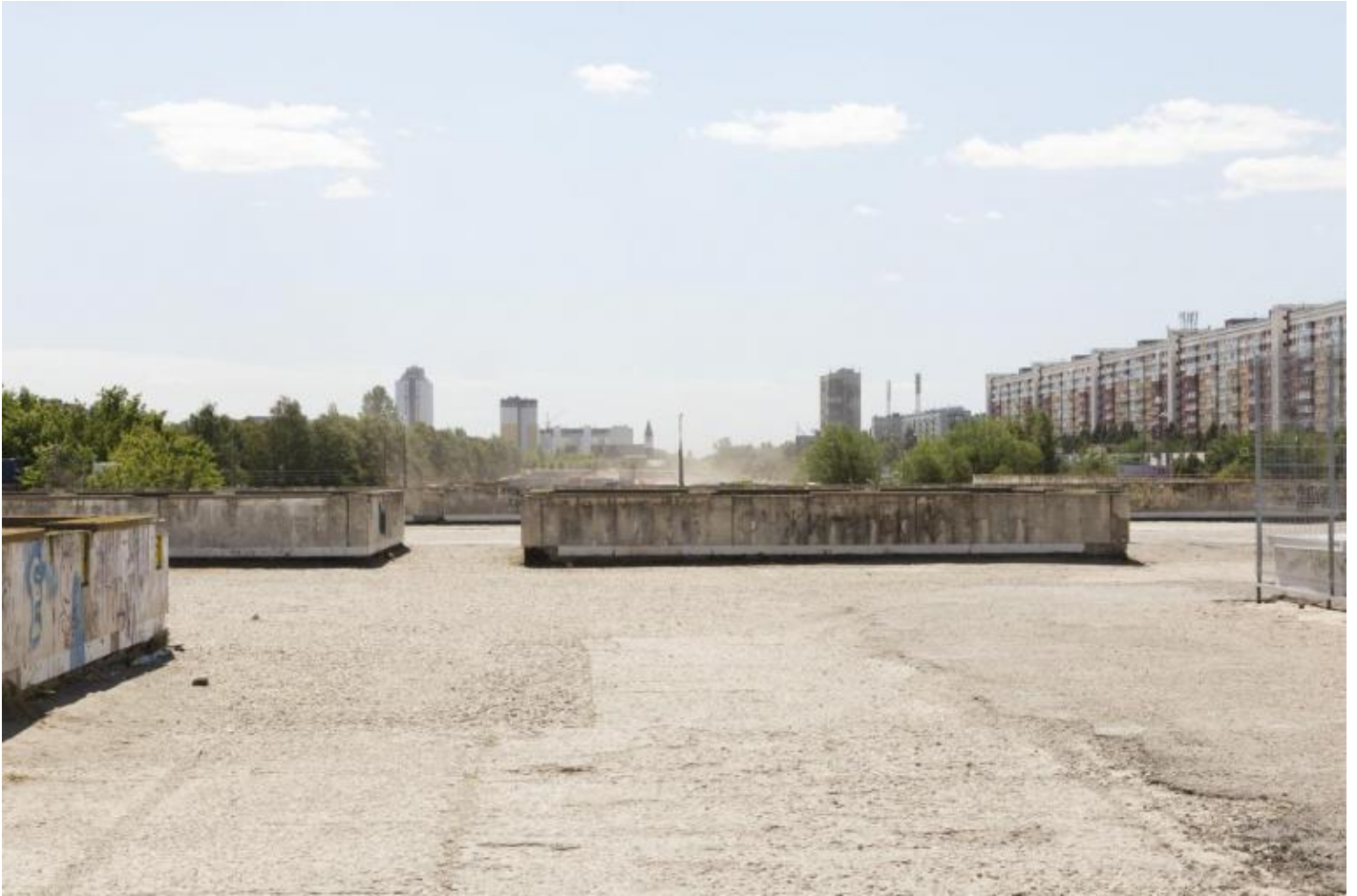
Foto Giovanna Silva da Togliatti. La fabbrica della Fiat © Humboldt Books 2020.