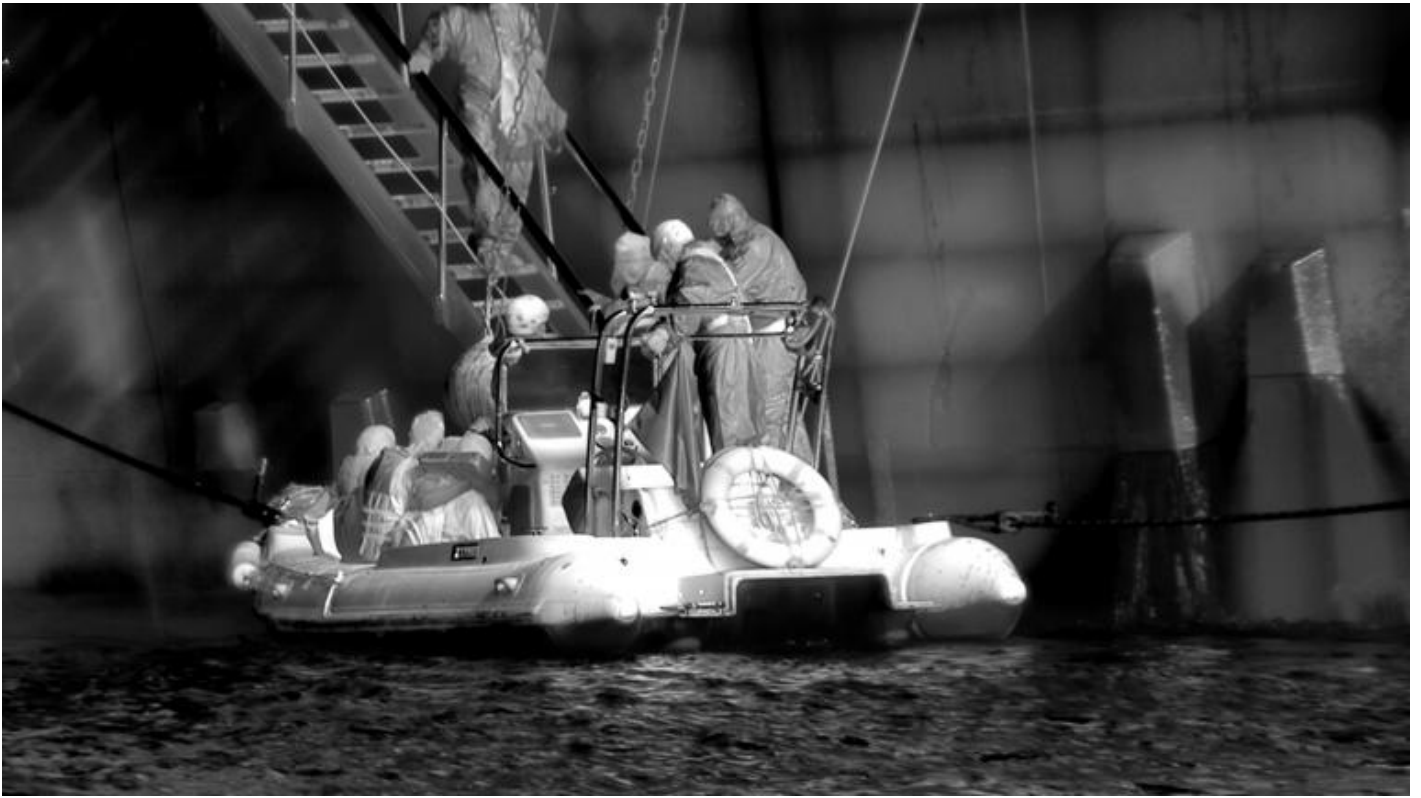
© Richard Mosse - Still from Incoming #27, Mediterranean Sea, 2016, Private Collection SVPL Battello gonfiabile a chiglia rigida (RIB) guidato dalla Guardia di Finanza trasferisce i migranti salvati su una nave della Guardia costiera croata al largo delle coste libiche.

Ed è proprio Urs Stahel che rimanda al concetto di sensor realism (realismo dei sensori), coniato da Rune Saugmann, Frank Moller e Rasmus Bellmer in riferimento alla serie Heat Maps , termine con il quale si intende [?] un realismo estetico basato sulla replica visiva delle tecnologie introdotte per la visualizzazione e la gestione di un problema, piuttosto che la rappresentazione fotorealistica di un problema. La domanda che si pongono gli autori è decisiva: «Che tipo di intervento politico si innesca quando gli artisti coltivano quello che teorizziamo come realismo dei sensori? un'estetica post-fotografica che può essere utilizzata come strategia per impegnarsi, ed indurre gli osservatori ad impegnarsi, nei confronti delle politiche di produzione dei dati visivi?»