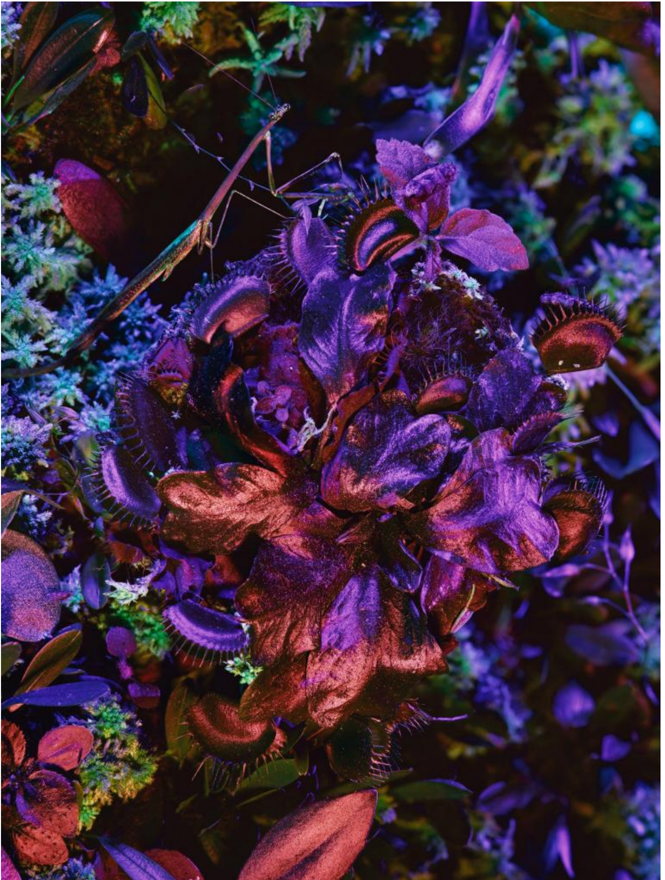
© Richard Mosse - Dionaea muscipula with Mantodea , Ecuadorean cloud forest, 2019, Courtesy of the artist and carlier | gebauer, Berlin/Madrid Serie Ultra.