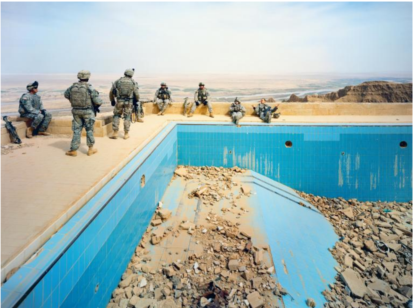
Pool at Uday's Palace, Salah-a-Din Province, Iraq, 2009, Courtesy of the artist and Jack Shainman Gallery, New York Truppe della Compagnia Alfa, Secondo Battaglione, 27° Fanteria "Wolfhounds" a riposo vicino alla piscina del palazzo di Uday Hussein, sulle montagne Jabal Makhoul, nella provincia di Salah-a-Din, Iraq centrale. Questa residenza estiva affacciata sulla