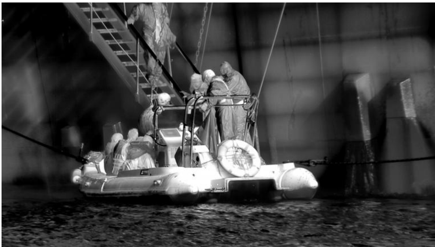
© Richard Mosse - Still from Incoming #27 , Mediterranean Sea, 2016, Private Collection SVPL Battello gonfiabile a chiglia rigida (RIB) guidato dalla Guardia di Finanza trasferisce i migranti salvati su una nave della Guardia costiera croata al largo delle coste libiche.

Ed è proprio Urs Stahel che rimanda al concetto di sensor realism (realismo dei sensori), coniato da Rune Saugmann, Frank Moller e Rasmus Bellmer in riferimento alla serie Heat Maps , termine con il quale si intende “[...] un realismo estetico basato sulla replica visiva delle tecnologie introdotte per la visualizzazione e la gestione di un problema, piuttosto che la rappresentazione fotorealistica di un problema.” La domanda che si pongono gli autori è decisiva: “Che tipo di intervento politico si innesca quando gli artisti coltivano quello che teorizziamo come realismo dei sensori – un’estetica post-fotografica che può essere utilizzata come strategia per impegnarsi, ed indurre gli osservatori ad impegnarsi, nei confronti delle politiche di produzione dei dati visivi?”