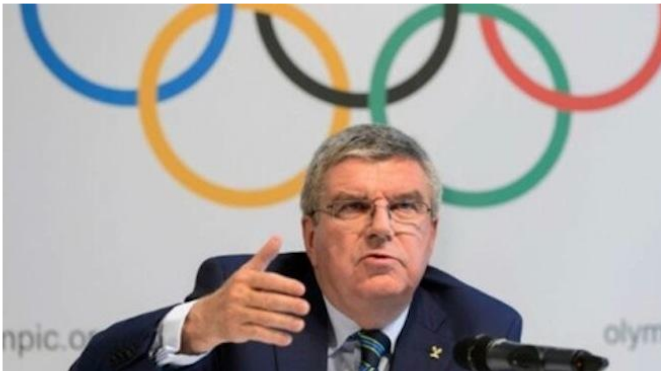
Thomas Bach (presidente CIO).