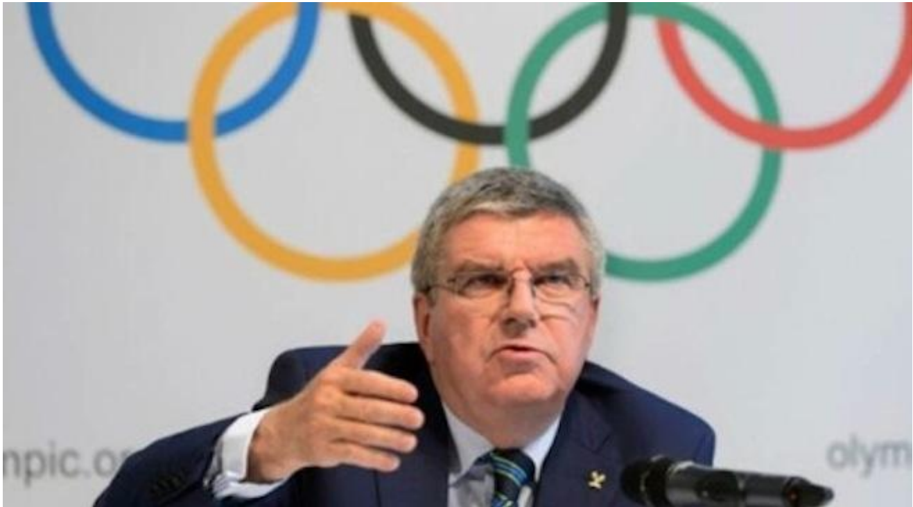
Thomas Bach (presidente CIO).

Dobbiamo prendere atto che oggi lo sport olimpico è completamente intriso di questa logica. L'organizzazione olimpica non ha più niente a che fare con lo spirito olimpico della Carta, con la pace o l'amicizia. Il dott. Ueyama, nell'intervento già citato, riferendosi a queste uscite improvvise della dirigenza CIO, ha detto: "Queste persone o non hanno mai letto La Carta, o non hanno minimamente intenzione di applicarla".