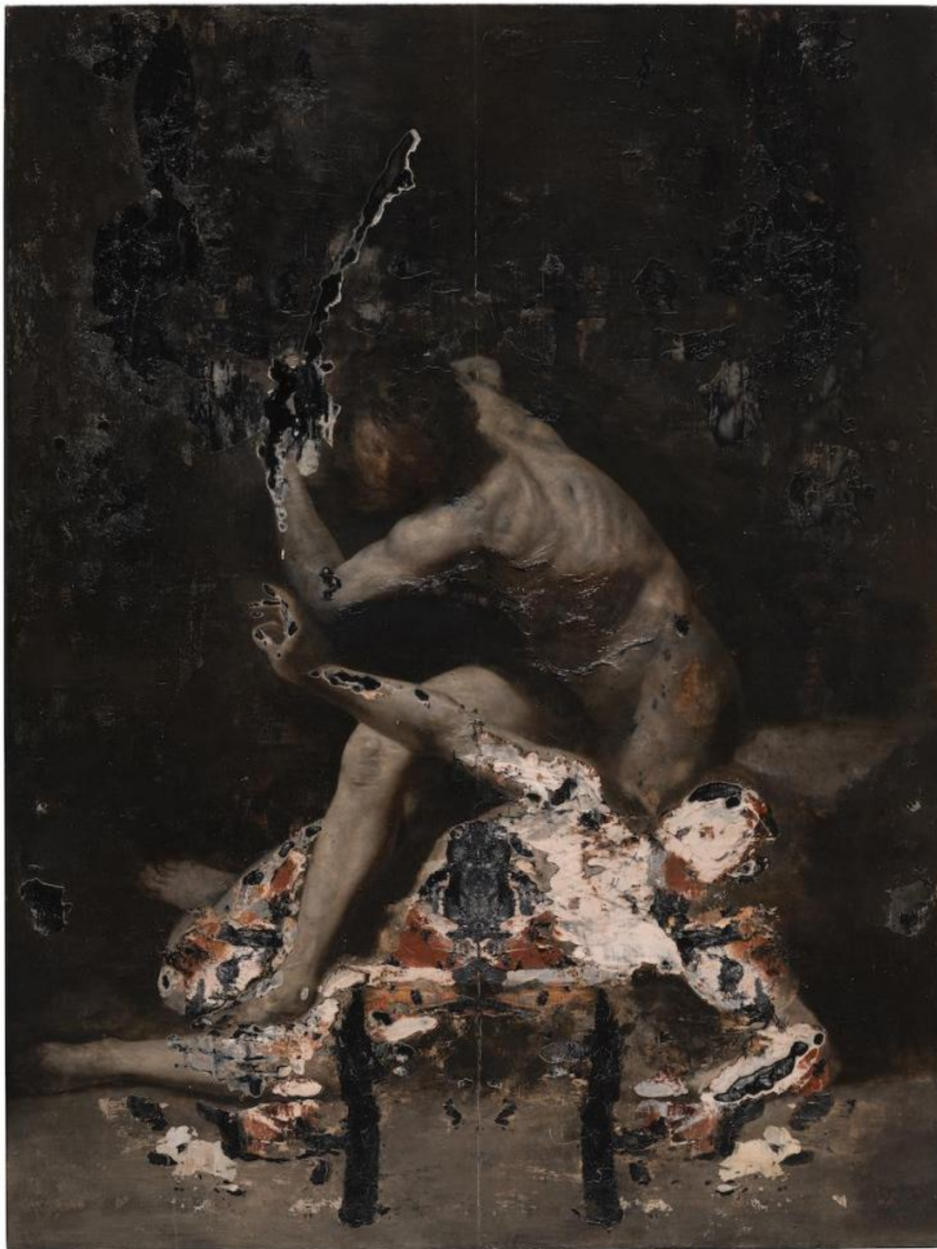
Nicola Samorì, Caino, 2020, olio su lino, 200 x 150 cm © Monitor, Roma / Lisbon / Pereto © Galerie EIGEN+ART, Leipzig / Berlin. AmC Collezione Coppola, Vicenza. Foto Rolando Paolo Guerzoni.