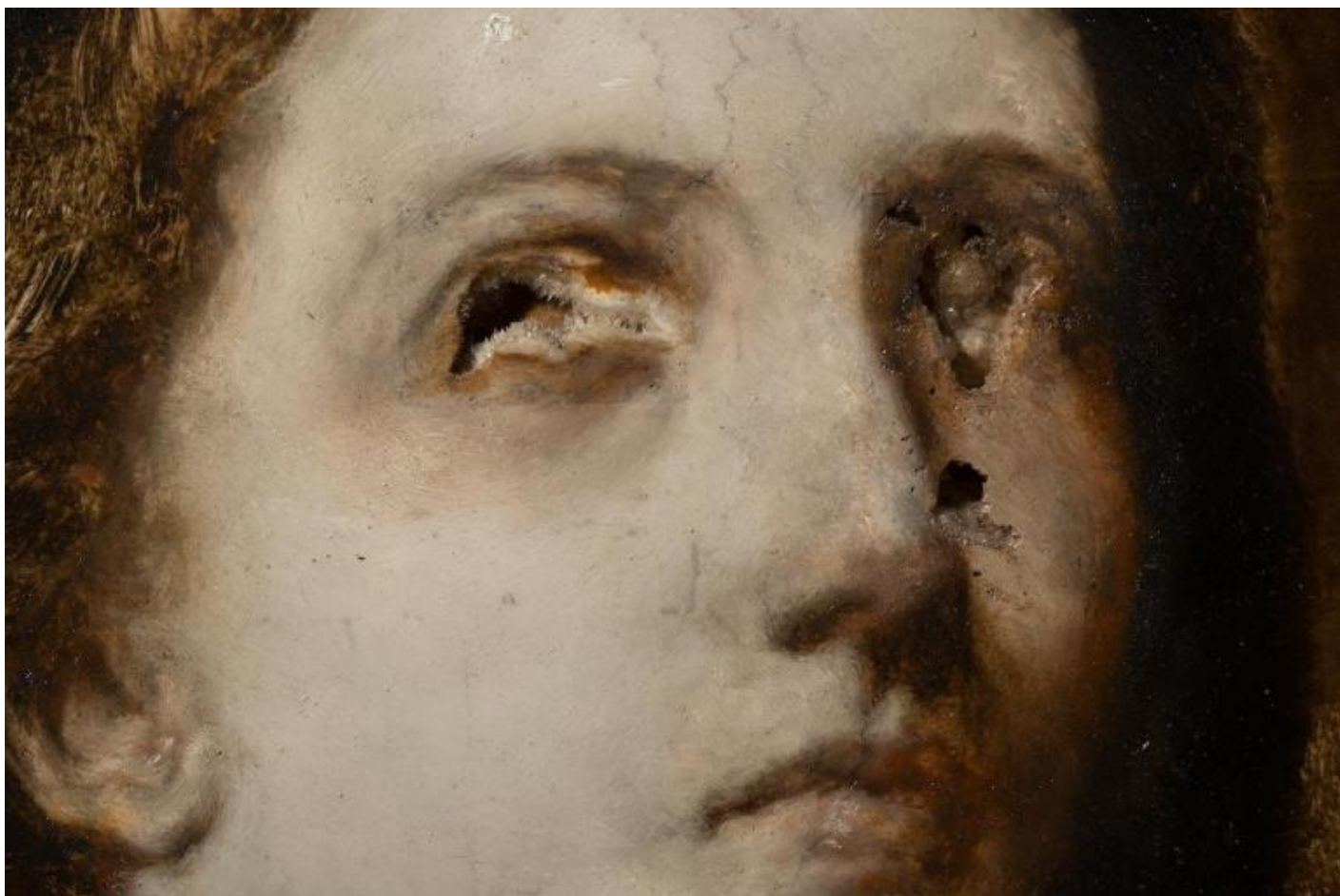
Nicola Samorì, Lucia, 2019, olio su onice e pietra di Trani, 40 x 30 cm © Monitor, Roma / Lisbon / Pereto © Galerie EIGEN+ART, Leipzig / Berlin. Foto Rolando Paolo Guerzoni.

L'arte di Samorì è esigente, come lo è il suo creatore. Il linguaggio delle immagini non è quello della letteratura, ci sono cose che la scrittura dell'arte tenta rischiosamente di nominare; l'indicibile è carattere proprio del visivo e tra ciò che non è enunciabile e il visibile si gioca il movimento del pensiero, quell'esercizio di interpretazione e traduzione destinato gioiosamente a fallire e, nondimeno, a essere fertile. Samorì si fa carico in prima persona di questo rischio e riesce a entrare nel proprio lavoro anche con la parola, analizzando i processi del proprio lavoro con la stessa lucidità chirurgica con cui si approccia alla materia, padroneggiandola, e ciò è evidente tanto nelle rare testimonianze audiovisive come nella più consistente documentazione di interviste e conversazioni.