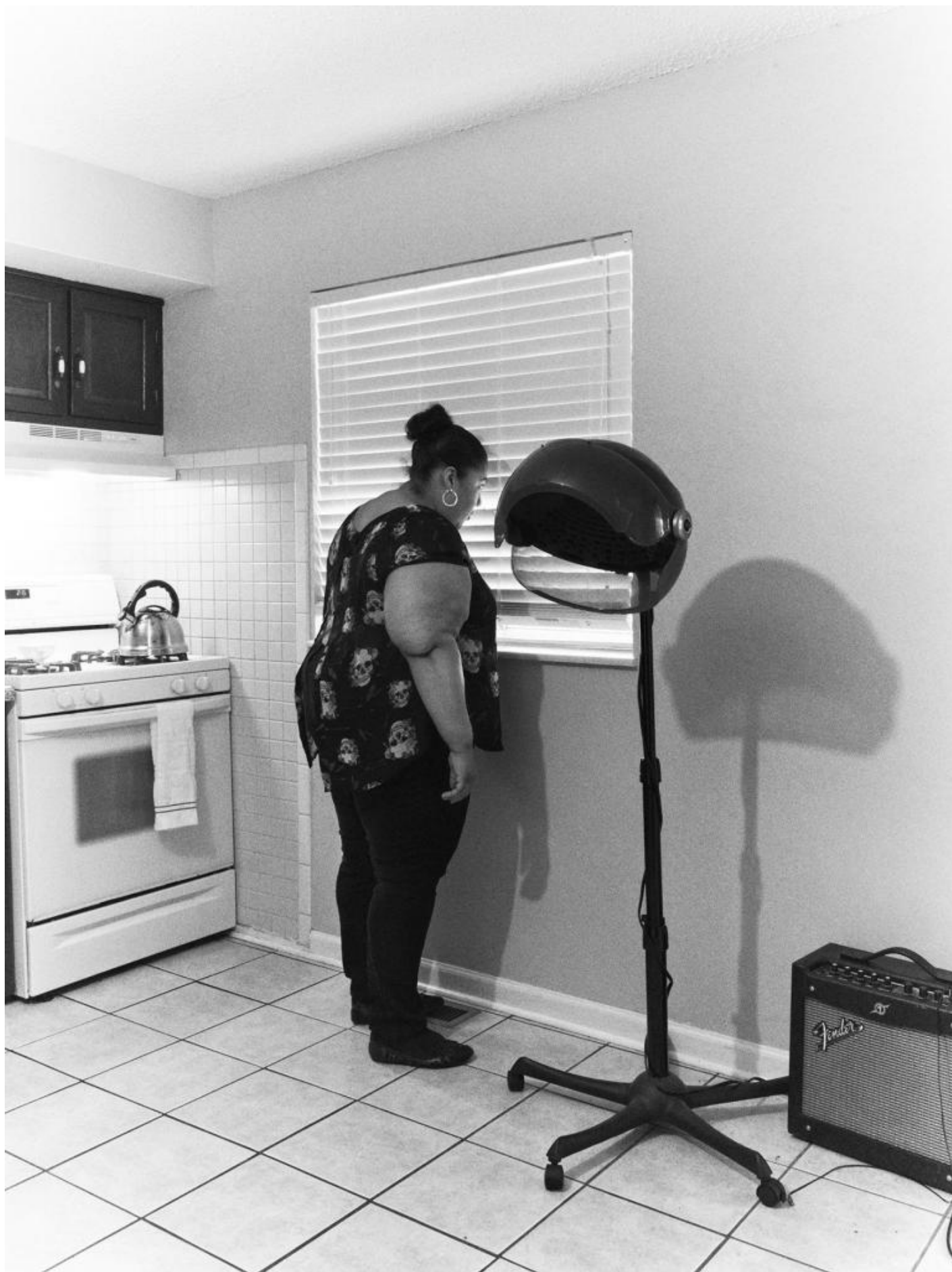
Piergiorgio Casotti & Emanuele Brutti, INDEX G, 2018