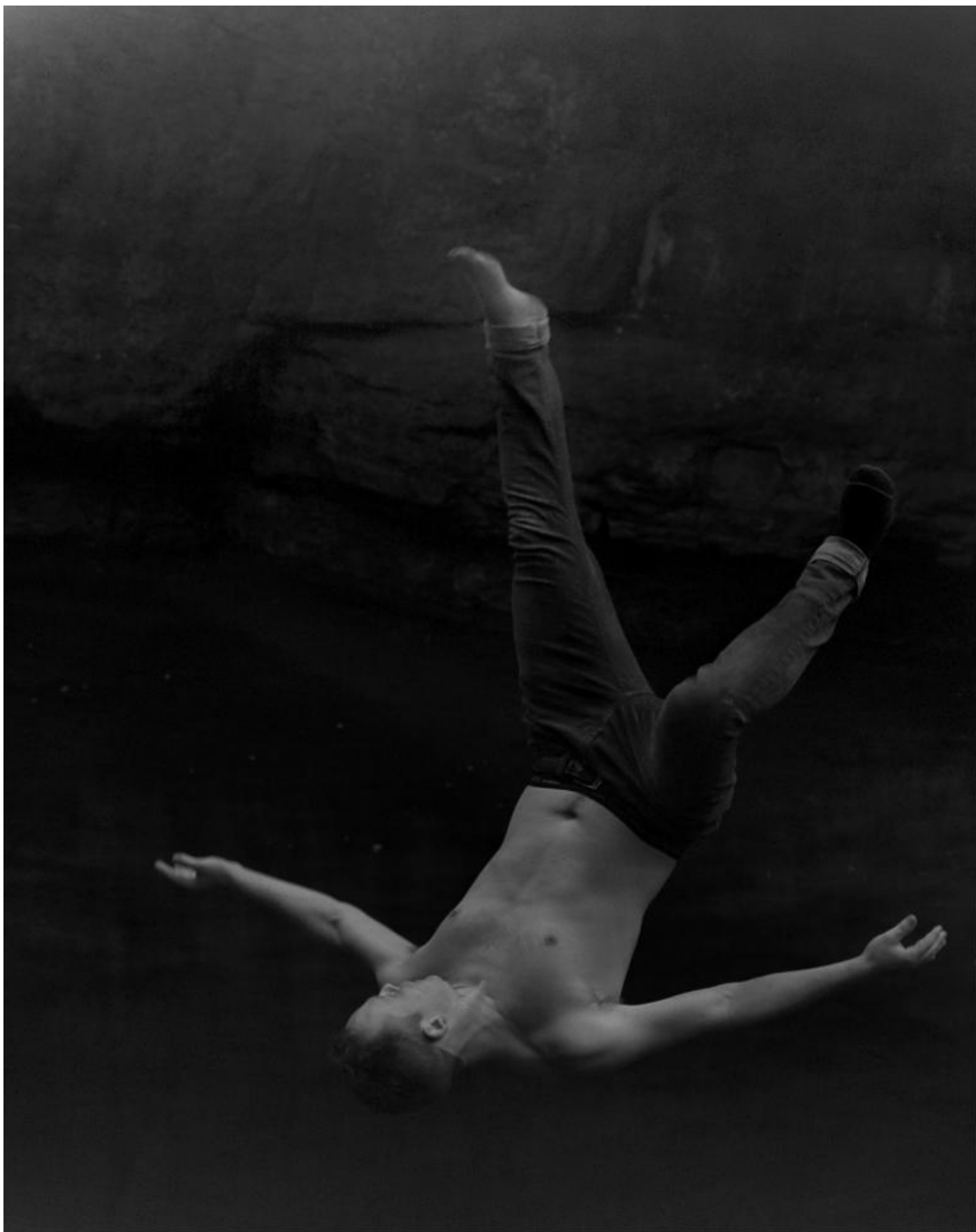
Raymond Meeks, Halfstory #1543, 2017, Courtesy Casemore Kirkeby.