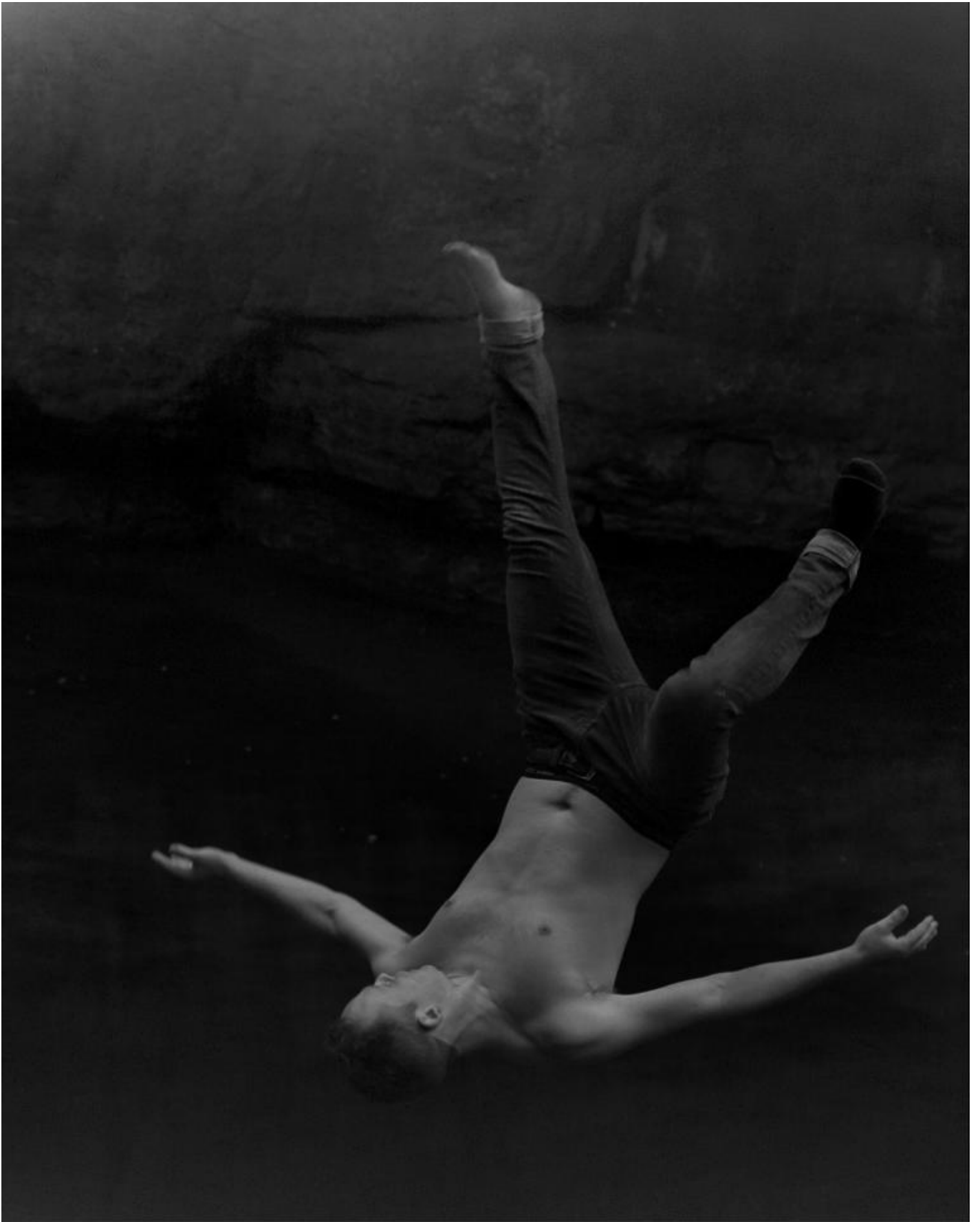
Raymond Meeks, Halfstory #1543, 2017.