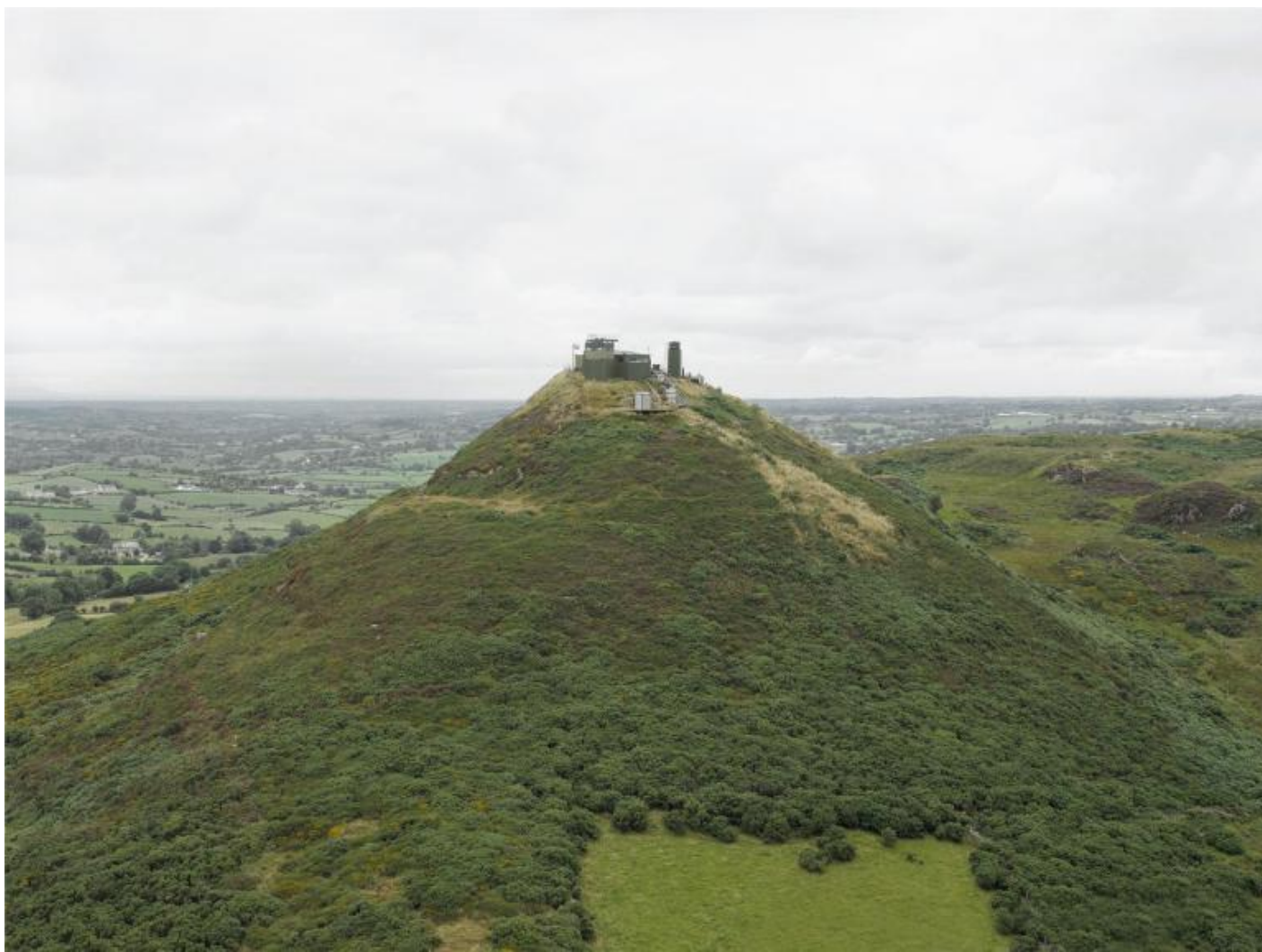
Donovan Wylie, Northern Ireland 2015, from The Tower Series.