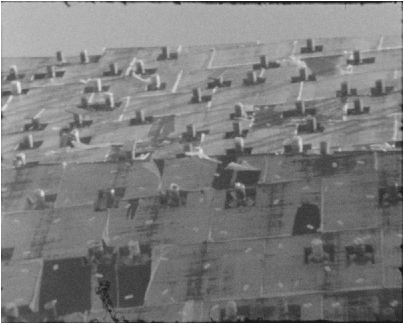
Yasmina Benabderrahmane, La Bâte , 2020 ©Yasmina Benabderrahmane, Adagp, Paris, 2021.

La realtà del suo paese di origine diviene l'occasione per scoprire, dietro l'apparenza della modernità, la realtà del mito, del sempre uguale e proprio per questo infinitamente destinato a ripetersi. Le foto più significative mostrano la semplicità di alcuni gesti: un occhio chiuso, strizzato come per un gesto istintivo di difesa, una misbaâ , Yah sgranata tra due dita: gesti senza tempo, energia intensa, silenziosa, e discreta. Come piccole sculture viventi si oppongono al mostro artificiale e artificioso che domina il luogo in cui sono nati. Le immagini di Yasmina sembrano fatte di polvere e di terra. E forse proprio questo intendono evocare: il passaggio del tempo, il ciclo della vita umana che passa, lasciando memoria di sé non nelle architetture, quanto nei gesti e nei riti collettivi. Si percepisce che la fotografa non è di fronte allo spazio, ma dentro di esso, un corpo che condivide suolo e radici insieme alle persone che ha fotografato. Un esserci che non è una semplice forma di co-abitazione, ma è una co-esistenza. Scattare una foto è dunque esistere insieme al soggetto ritratto. E raccogliere la sua eredità. La fotografa riceve ospitalità, è portatrice di conoscenza, e le sue immagini sono il dono ricevuto.