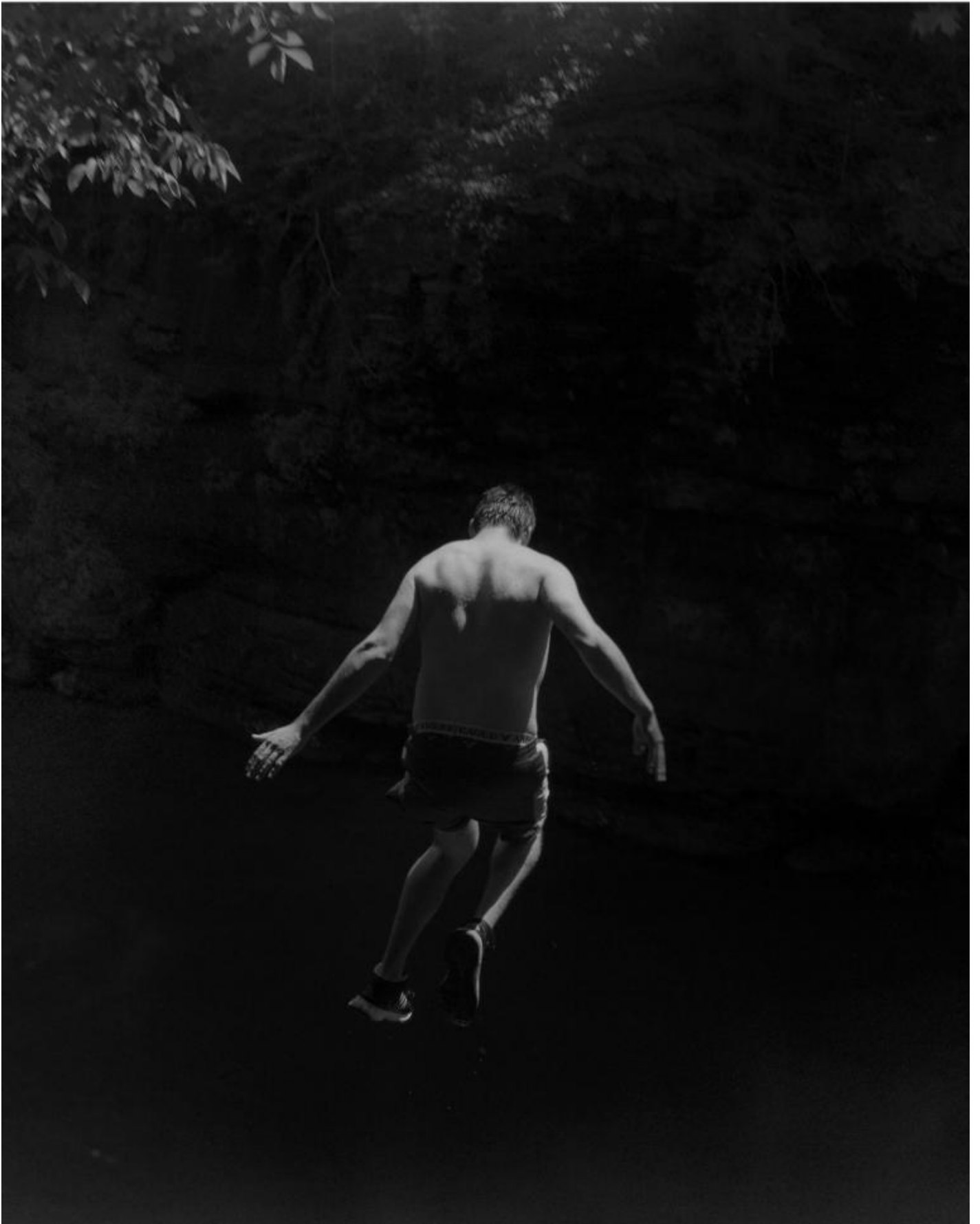
Raymond Meeks, Halfstory #1370997, 2017, Courtesy Casemore Kirkeby.