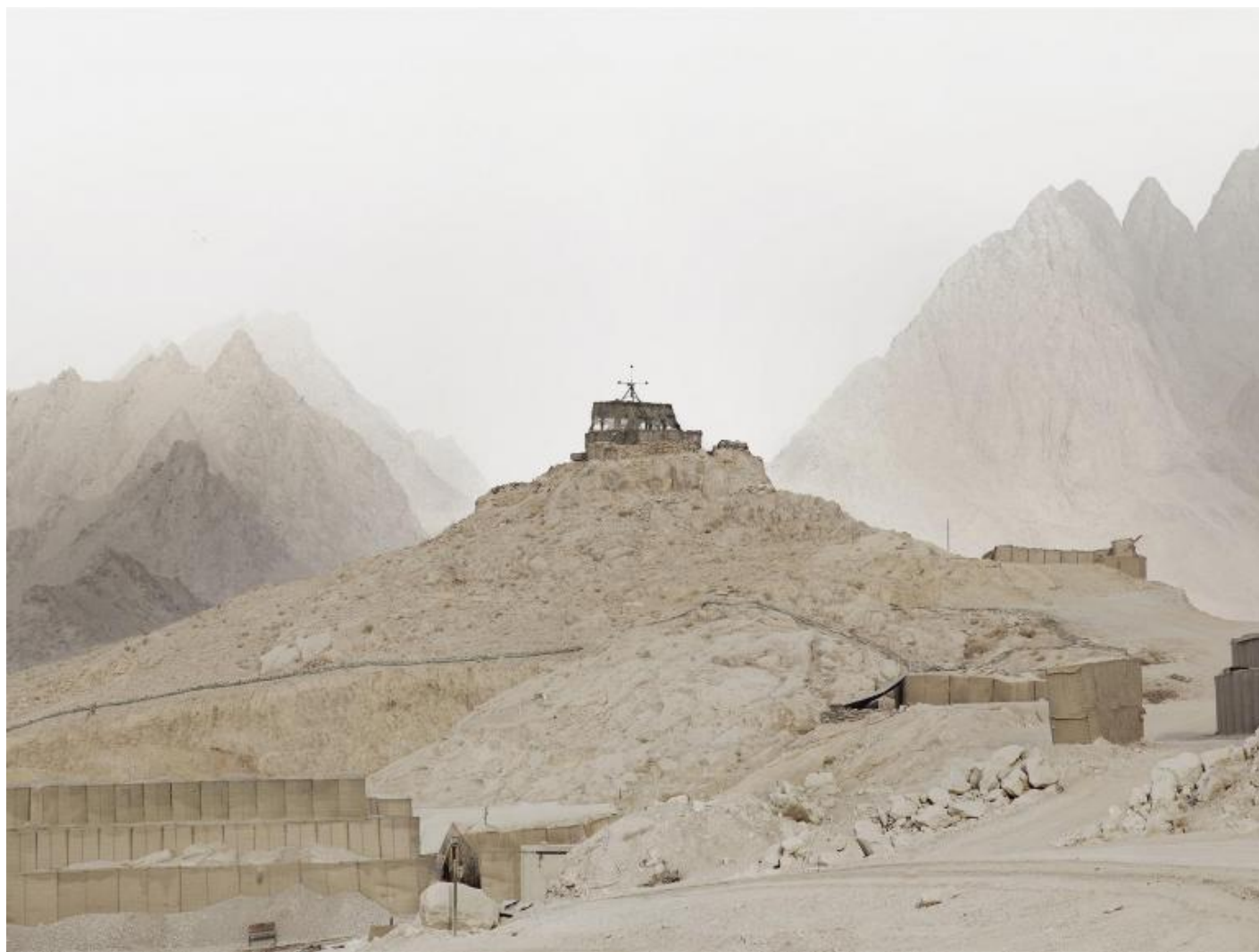
Donovan Wylie, Kandahar Province, Afghanistan 2010, from The Tower Series.