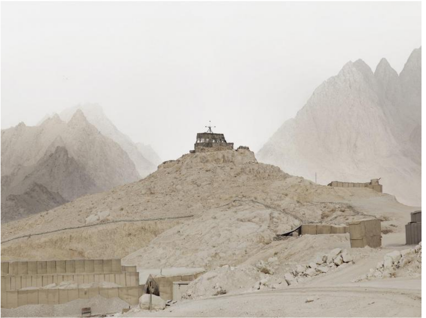
Donovan Wylie, Kandahar Province, Afghanistan 2010, from The Tower Series.