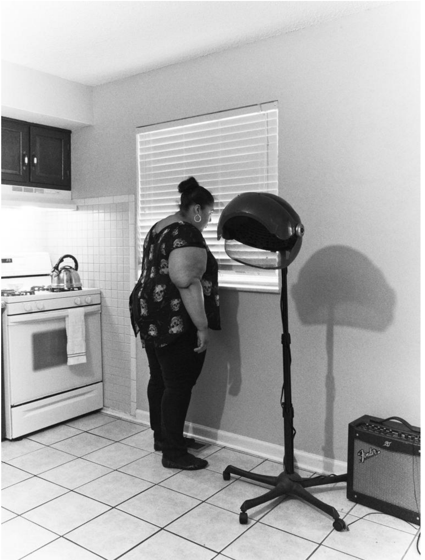
Piergiorgio Casotti & Emanuele Brutti, INDEX G, 2018 © Piergiorgio Casotti & Emanuele Brutti.