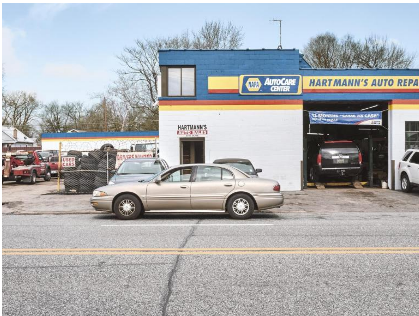
Piergiorgio Casotti & Emanuele Brutti, INDEX G, 2018 © Piergiorgio Casotti & Emanuele Brutti.