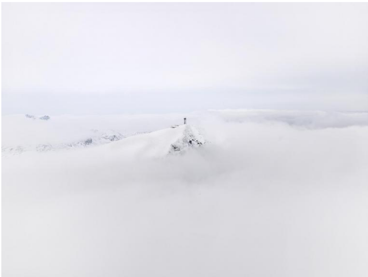
Donovan Wylie, Labrador, Canada, 2013, from The Tower Series.

Queste fortezze lontane e inaccessibili, a causa della loro indecifrabilità, esprimono un'aura di forza che di conseguenza genera, in chi guarda, pensieri di impotenza. L'impossibilità di sottrarsi al controllo riporta alla mente il panopticon di Jeremy Bentham, e l'idea di una sorveglianza totale e permanente.