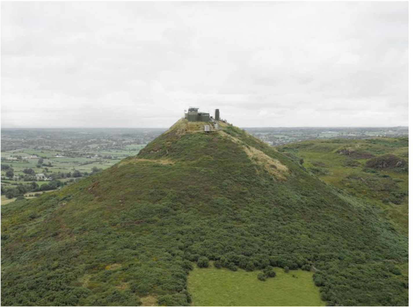
Donovan Wylie, Northern Ireland 2015, from The Tower Series.