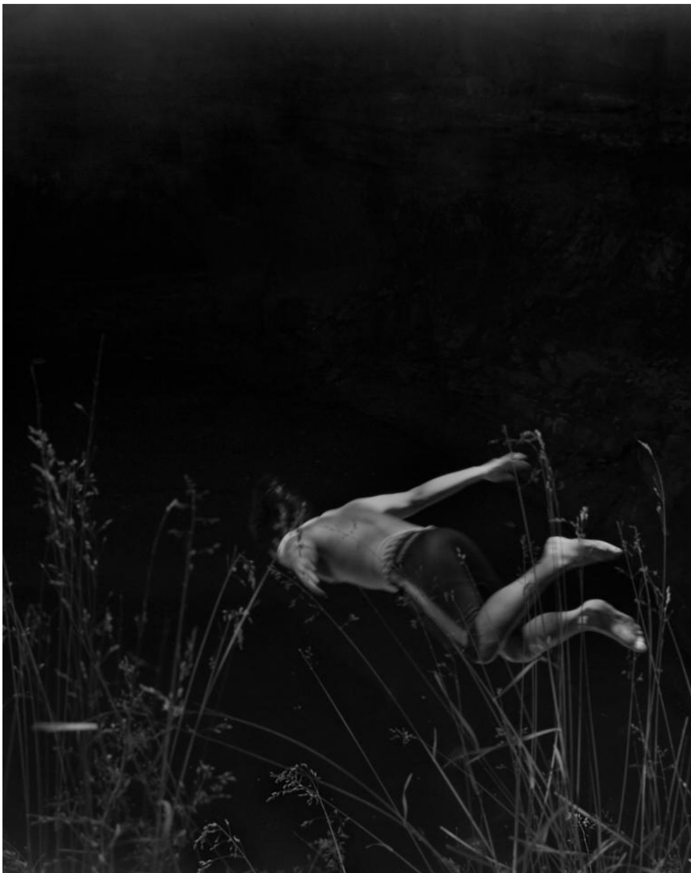
Raymond Meeks, Halfstory #1360214, 2017, Courtesy Casemore Kirkeby.