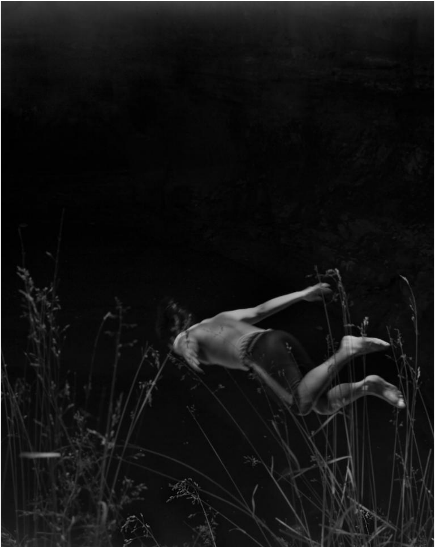
Raymond Meeks, Halfstory #1360214, 2017