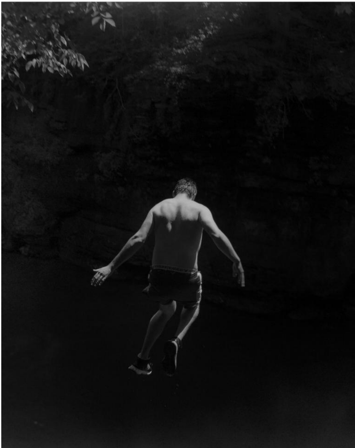
Raymond Meeks, Halfstory #1370997, 2017, Courtesy Casemore Kirkeby.