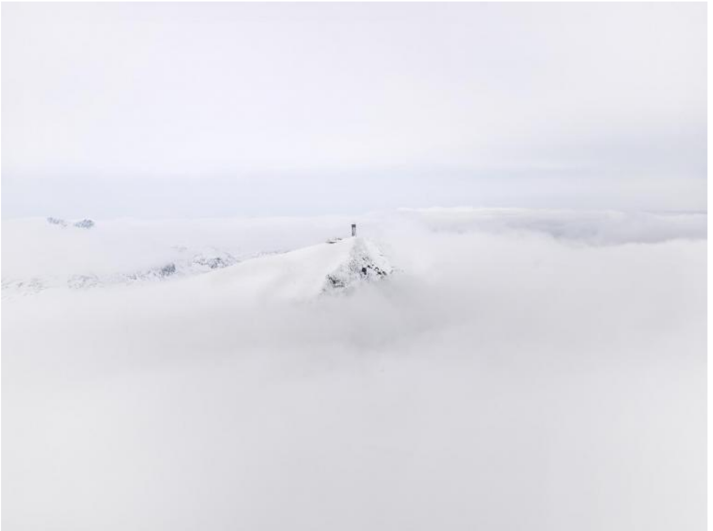
Donovan Wylie, Labrador, Canada, 2013, from The Tower Series.

Queste fortezze lontane e inaccessibili, a causa della loro indecifrabilità, esprimono un'aura di forza che di conseguenza genera, in chi guarda, pensieri di impotenza. L'impossibilità di sottrarsi al controllo riporta alla mente il panopticon di Jeremy Bentham, e l'idea di una sorveglianza totale e permanente.