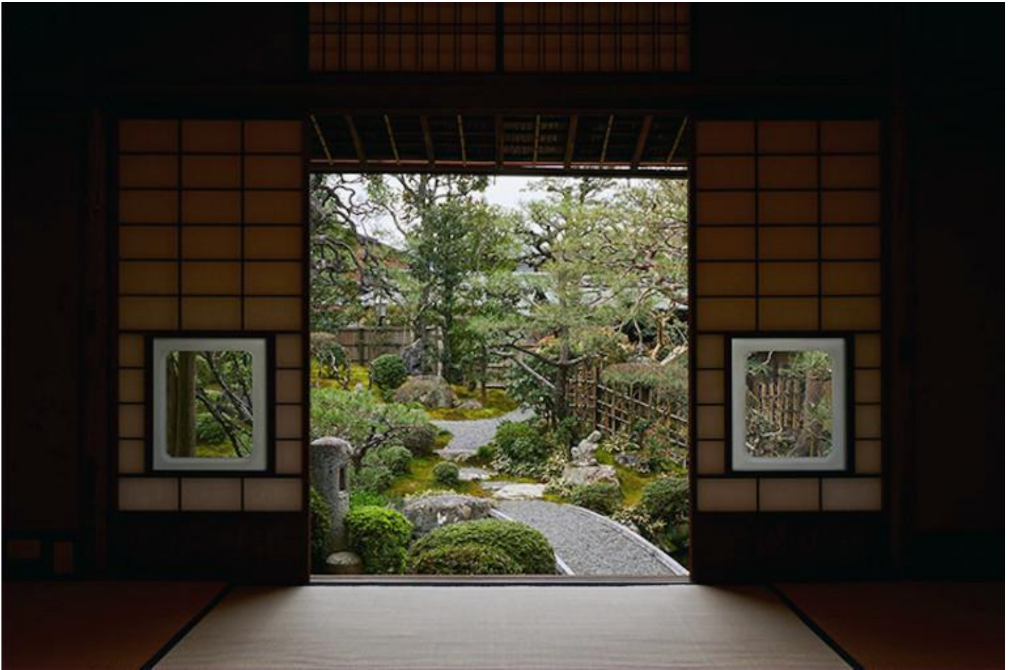
Una veduta del giardino della Sekison-tei, la casa in cui Tanizaki abitò dal 1949 al 1956.

Il corpo e la natura, e più in generale la meditazione sul passato, rimandano incessantemente per Tanizaki all'archetipo materno, dunque a un rapporto di fusione tra il bambino e la madre, che nel ricordo intreccia il piacere al rimpianto. Dopo una giovinezza influenzata soprattutto da modelli occidentali, il suo interesse per la cultura e le arti della tradizione crebbe a partire dagli anni '20, ed è spesso associato al trasferimento dal Kantō al Kansai, ma già in precedenza, non a caso, aveva trovato espressione in uno dei suoi racconti più evocativi basati su questo archetipo, scritto due anni dopo la morte della madre e poco prima di quella del padre. In Nostalgia della madre (1919) un bambino cammina nelle tenebre della notte tra filari di pini in uno scenario apparentemente sconfinato, seguendo i bagliori che intravede in lontananza, il rumore delle onde del mare e i suoni di voci e strumenti musicali che richiamano il Giappone di un tempo, come visioni di una fantasmagoria. E come in un altro racconto in cui Tanizaki reinventa la propria infanzia nella magnifica casa di Kyoto dove visse per alcuni anni dal 1949, Il ponte dei sogni (1959), due sono le figure femminili che incontra: dapprima una matrigna che scambia per sua madre, in una casa di contadini dal tetto ricoperto d'erba miscanthus , e lungo la strada, infine, la donna che stava cercando, dagli «occhi sottili come una inflorescenza di susuki », e che in un primo momento stenta a riconoscere.