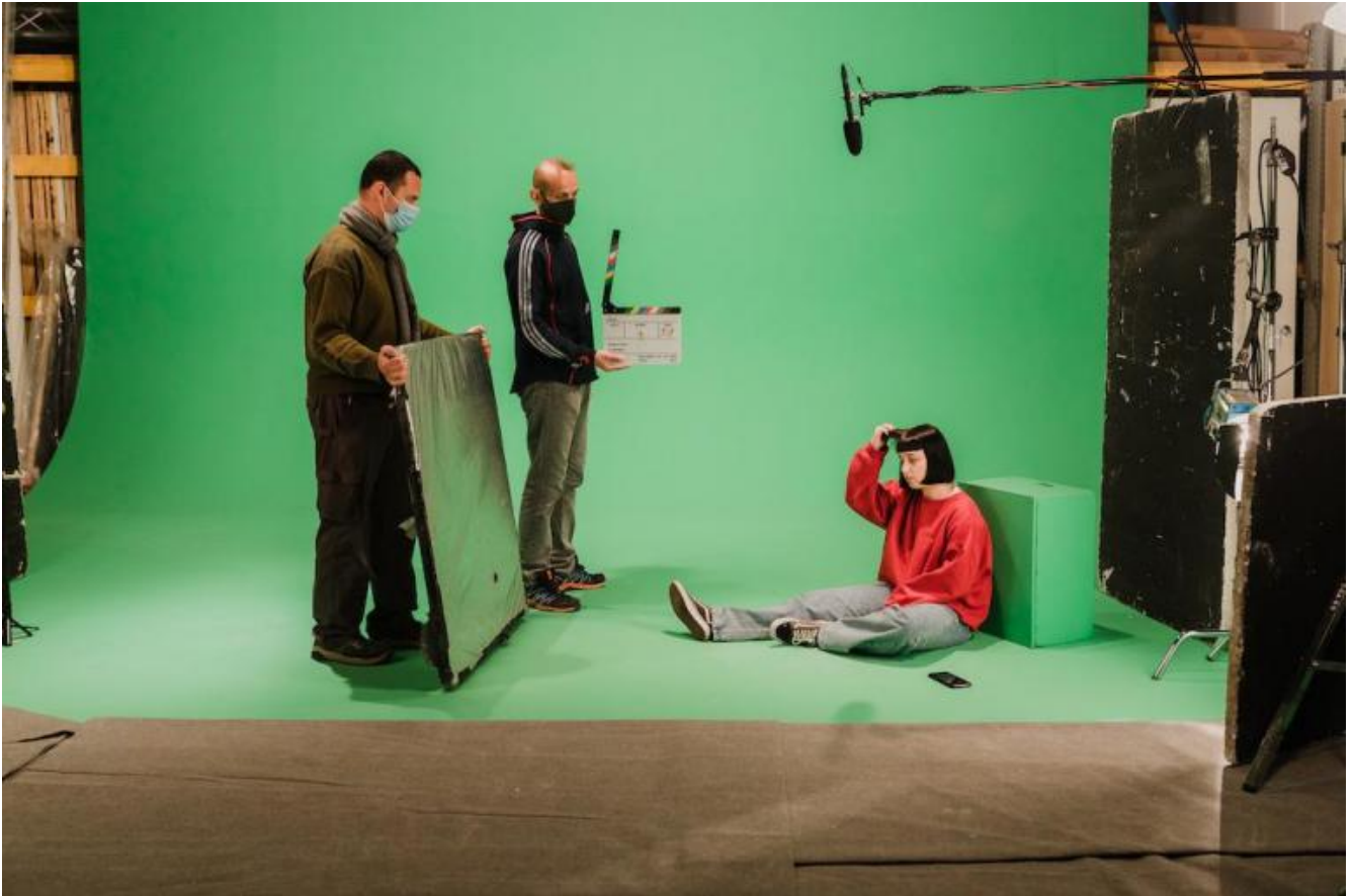
Il Labirinto, riprese, ph. Davide Saccà Harperstudio.

crea nel rapporto dal vivo, quale è quella della separazione di un individuo che contempla e di un attore/oratore che agisce, è qui frantumata.