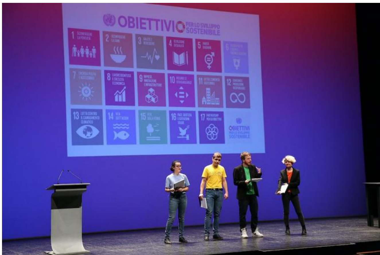
Presentazione di Politico Poetico all'Arena del Sole.