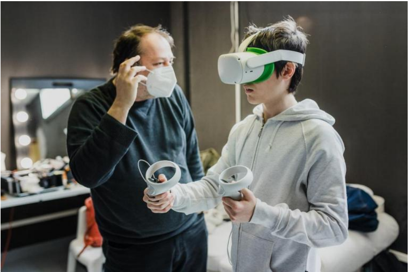
Il Labirinto, prove di visione.

tagliarsi le vene, salvo poi vedere il suo doppio che muore per dissanguamento. Quest'ultima modalità ha forse anche un significato simbolico e che, per così dire, prova che l'adolescenza è una categoria dello spirito, più che una condizione anagrafica. L'adulto che trova sollievo dai suoi tormenti con privazioni o rinunce volontarie (si pensi a chi sacrifica tutto per la carriera) non è diverso dall'adolescente che si taglia le vene, istigato dai tormenti interiori. Le altre due modalità creano un rapporto di identificazione tra noi e i sette ragazzi / le sette ragazze molto meno forte, ma nondimeno lo generano. In questo senso, potremmo dedurne che addentrarsi nel Labirinto significa conoscere il lato oscuro dell'adolescenza per studiare il dark side dell'adulto. Il Teseo-spettatore cammina tra i cunicoli labirintici per salvare sia gli adolescenti ateniesi, sia sé stesso.