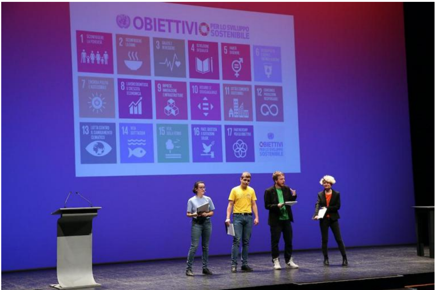
Presentazione di Politico Poetico all'Arena del Sole.

Si tratta di un'azione collettiva che ha preso una direzione 'corale' e una 'collegiale'. Il giorno 16, c'è stato il raduno a Piazza Maggiore di Bologna di 100 ragazzi e ragazze che, in piedi sopra delle cassette della frutta rovesciate, hanno presentato alla cittadinanza 300 progetti di contributo alla suddetta Agenda 2030, in particolare ai cinque temi centrali del programma (Ambiente; Lavoro ed Economia; Disuguaglianze; Città e Comunità; Pace e Giustizia). La giornata successiva ha previsto l'evento Il Parlamento incontra la città . Quattordici rappresentanti della folla di adolescenti del 16 sono andati nel Teatro Arena del Sole di Bologna per leggere cinque lettere aperte alla città e altrettante "Liste di azione e raccomandazione" di fronte a un pubblico costituito da giovani coetanei, da adulti sensibili all'apertura al contributo politico giovanile e da membri della politica o delle istituzioni. Le sintesi delle presentazioni dei 300 giovani degli "Speakers Corners" sono ora raccolte sul sito del progetto di Teatro dell'Argine, nella forma di piccoli video da 2-3 minuti ciascuno con cui si può interagire tramite una mappa virtuale del territorio bolognese.