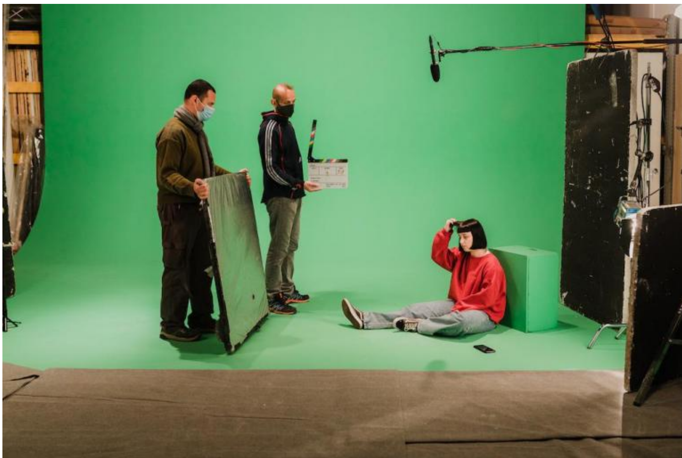
Il Labirinto, riprese, ph. Davide Saccà Harperstudio.