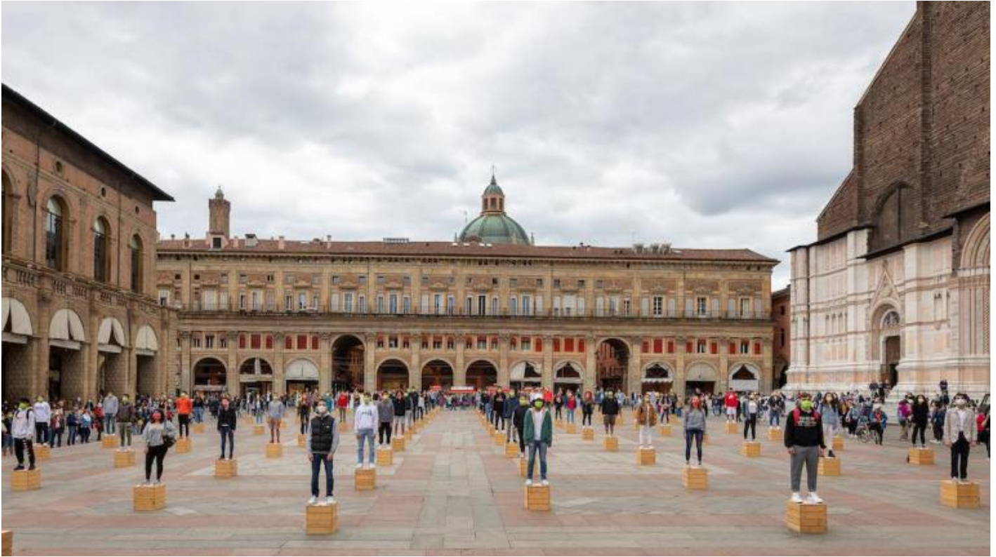
Speakers Corners

rubare in casa, o un'anonima ragazza che viene costretta alla prostituzione dalla madre e la cui storia è narrata con una favola in rima, per rendere sostenibile l'orrore allo spettatore. L'associazione dei sette ragazzi e delle sette ragazze con il mito del Labirinto è motivata dal fatto che quattordici erano gli adolescenti ateniesi che Atene mandava come tributo al Minotauro. Entrambi i gruppi condividono lo stesso destino: la morte per divoramento. I giovani mitici sono però smembrati da un mostro taurino, quelli contemporanei dalla brutalità della vita.