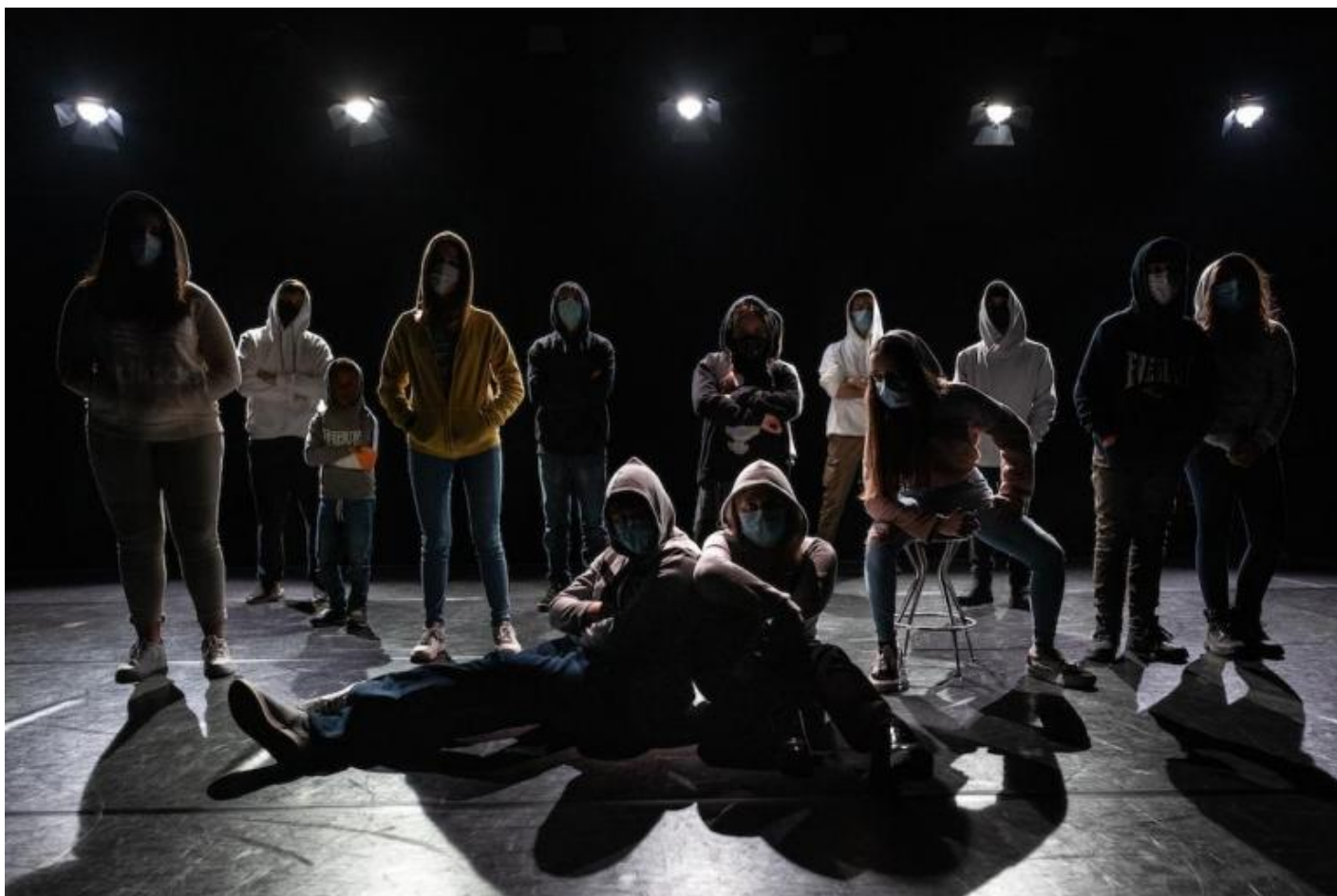
Il Labirinto, riprese.

Il piano politico e quello poetico sono insomma complementari. Il valore del progetto di Teatro dell'Argine sta infatti nell'evidenziare che, per incentivare le giovani generazioni a farsi motore attivo di una rivoluzione, bisogna partire da un'indagine sistemica e integrale dell'adolescenza. Solo così è possibile scoprire i pregi e i difetti di quello che si auspica compirà un rovesciamento dell'attuale stato di cose intollerabile. Ma in questo progetto non viene perso di vista neppure il contributo dello spettatore, che anzi è invitato a scoprire una seconda adolescenza. Parlare degli adolescenti e coinvolgerli in un programma rivoluzionario implica anche ringiovanire l'adulto, dargli rinnovate energie nella promozione di un cambiamento. Se questa ipotesi è plausibile, la scelta di ricorrere all'interazione virtuale acquista un senso molto particolare. Non si tratta di un espediente, figlio del fermo obbligato delle attività in presenza dovute alla pandemia, per fare comunicazione politica e intraprendere azioni poetiche performative in modo alternativo. La virtualità usa in sé mezzi molto semplici per calare lo spettatore dentro la materia magmatica dell'adolescenza, toccandola per così dire a larghe braccia. La barriera anche piccola che inevitabilmente si crea nel rapporto dal vivo, quale è quella della separazione di un individuo che contempla e di un attore/oratore che agisce, è qui frantumata.