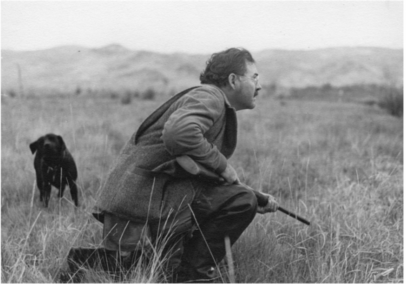
Ernest Hemingway a caccia di anatre a Ketchum, Idaho. Ottobre 1941.