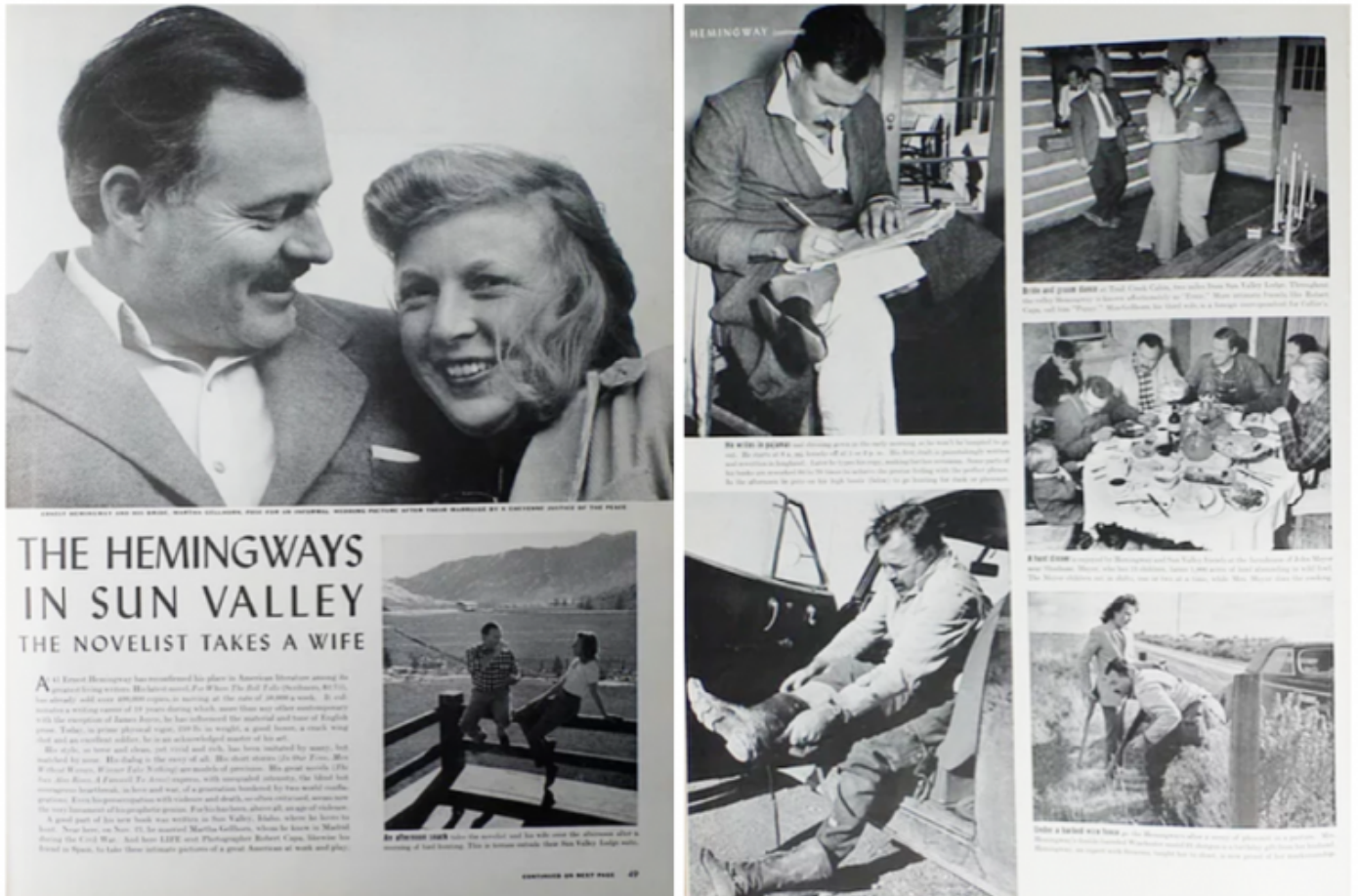
Reportage di Robert Capa pubblicato sul settimanale Life . Gennaio 1941.

solo una per Katina Paxinou come migliore attrice non protagonista, mentre quello stesso anno lâ??Oscar come miglior film lo vinse Casablanca , pellicola in cui, anche IÃ?, aveva recitato Ingrid Bergman.