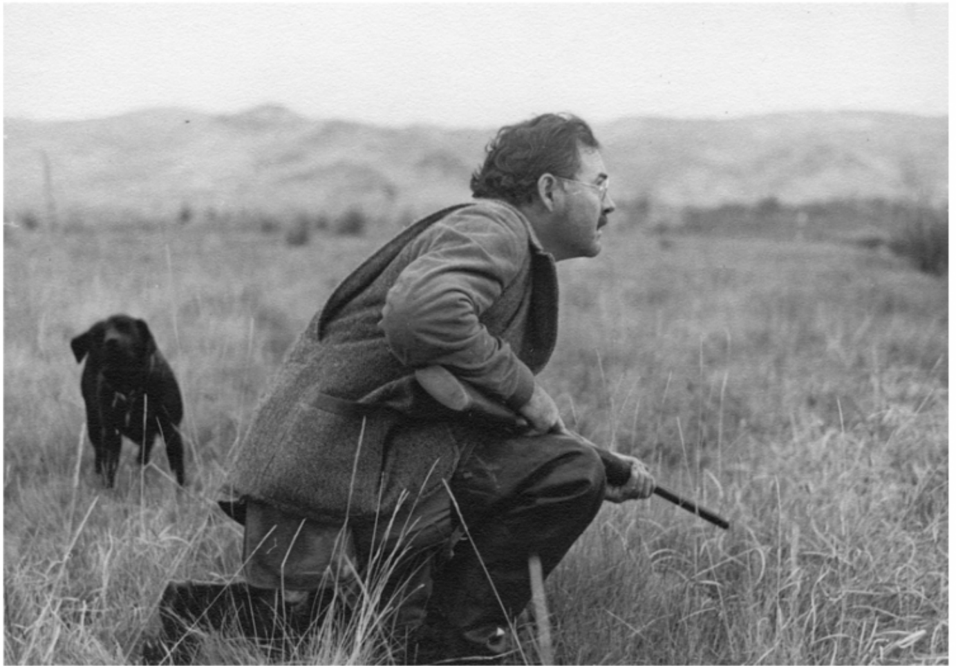
Ernest Hemingway a caccia di anatre a Ketchum, Idaho. Ottobre 1941.