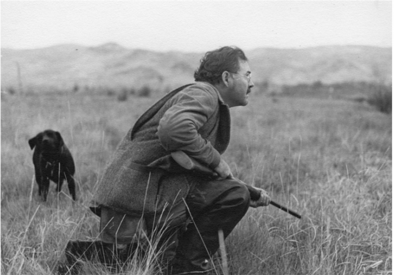
Ernest Hemingway a caccia di anatre a Ketchum, Idaho. Ottobre 1941.