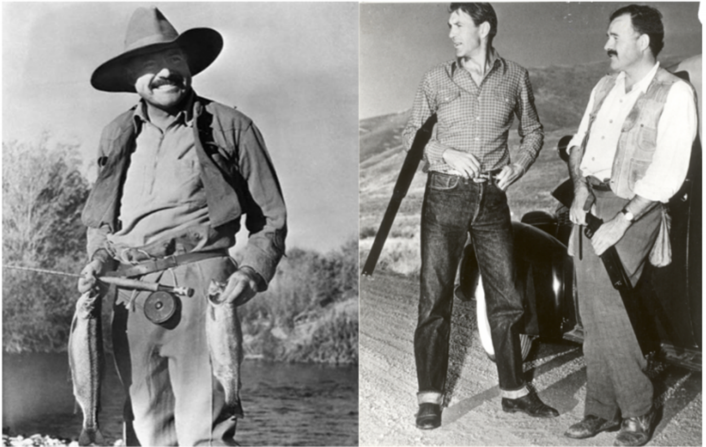
La prima foto "ufficiale" di Hemingway a Ketchum fu presa a pesca sul Big Wood River. Quella fu anche l'unica volta in cui si dedicò alla pesca in Idaho. Per il resto fu sempre e solo caccia. A destra è ritratto insieme all'amico Gary Cooper.