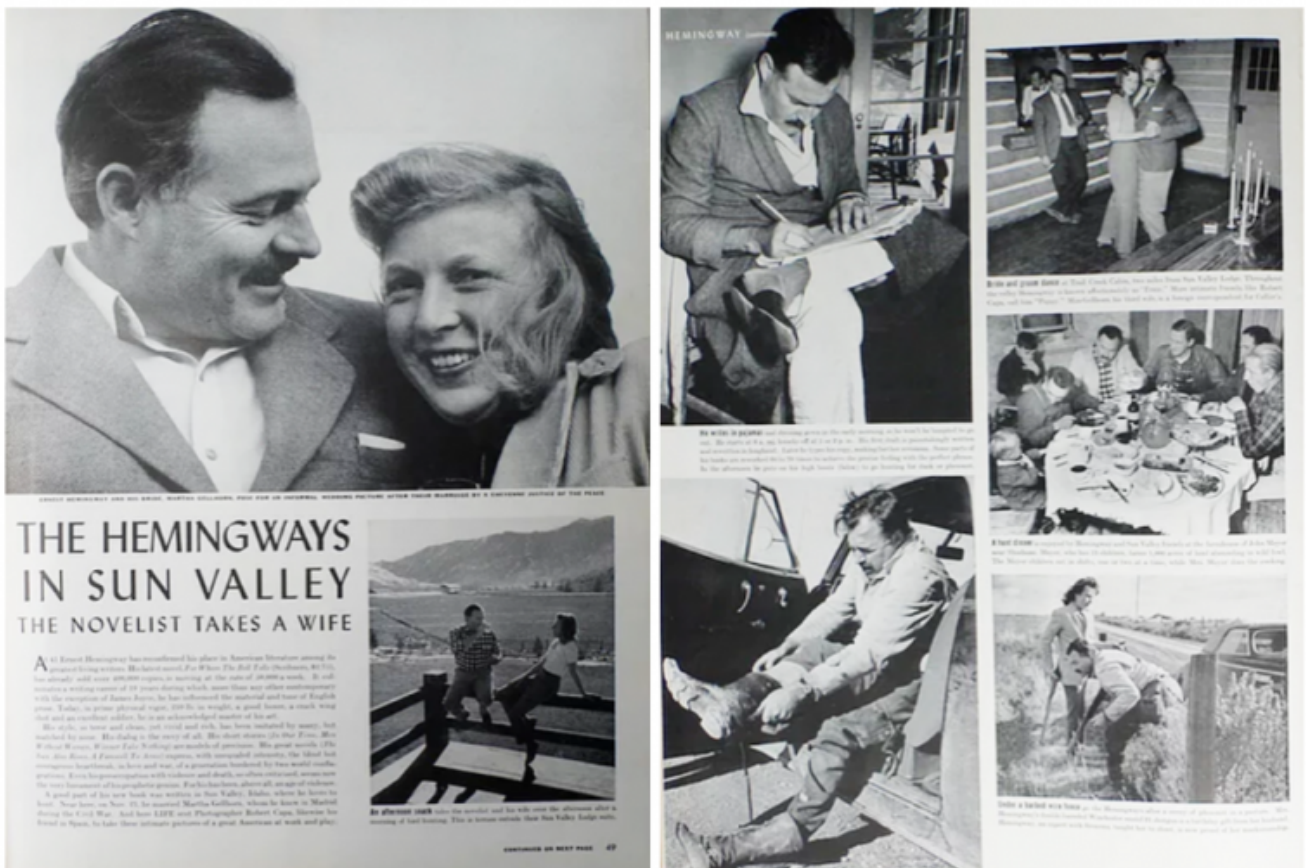
Reportage di Robert Capa pubblicato sul settimanale Life . Gennaio 1941.

La trasposizione cinematografica avrebbe fatto infuriare lo scrittore al punto di essere stato vicino a rompere l'amicizia con Cooper per aver accettato i compromessi della sceneggiatura (comunque i due rimasero sempre vicini e il ventennale sodalizio tra lo scrittore e l'attore è stato raccontato nel film documentario The True Gen , del 2013). Il pubblico fu però di diversa opinione, e il film ebbe un successo strepitoso, con gli uomini che si commuovevano davanti all'eroismo di Cooper (il senatore John McCain disse che il personaggio di Jordan era stato il suo idolo giovanile), e fra le signore divenne di gran moda il taglio di capelli "alla Bergman". La pellicola ricevette anche ben nove nomination all'Oscar (1944), vincendone solo una per Katina Paxinou come migliore attrice non protagonista, mentre quello stesso anno l'Oscar come miglior film lo vinse Casablanca , pellicola in cui, anche lì, aveva recitato Ingrid Bergman.