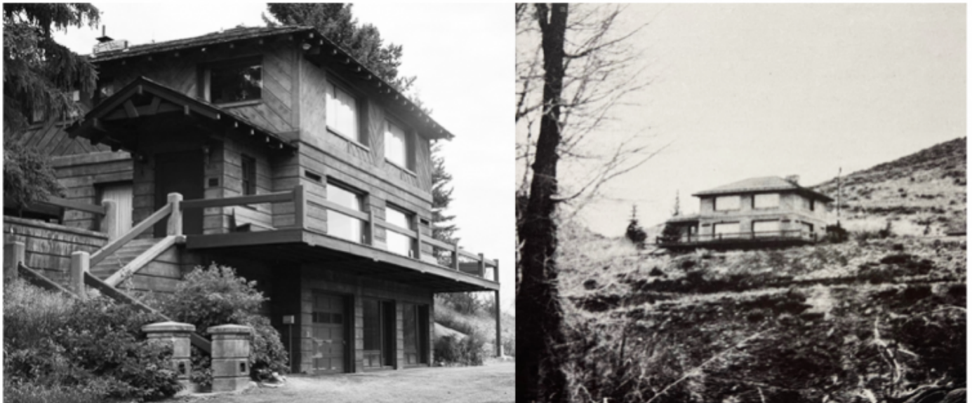
La casa di Ketchum dove Ernest Hemingway si suicidò. A sinistra come è oggi, a destra durante la costruzione

Il 1940 fu l'anno del divorzio da Pauline e il secondo in cui passò la stagione invernale a Sun Valley con Martha. Presero alloggio in una suite da 38 dollari a notte che, grazie ai servigi da testimonial, pagava al prezzo nominale di 1 dollaro. A novembre Ernest e Martha si sposarono. Festeggiarono con amici del posto e Robert Capa, che lo aveva raggiunto, come dicevamo poc'anzi, per lavorare a un reportage per Life ("The Novelist Takes A Wife"), contribuendo così ad alimentare il mito hemingwayano e quello della stazione sciistica. Capa immortalò, poi, in un secondo reportage, l'anno successivo, le avventure di caccia di Hemingway e ("Life Goes Hunting At Sun Valley").