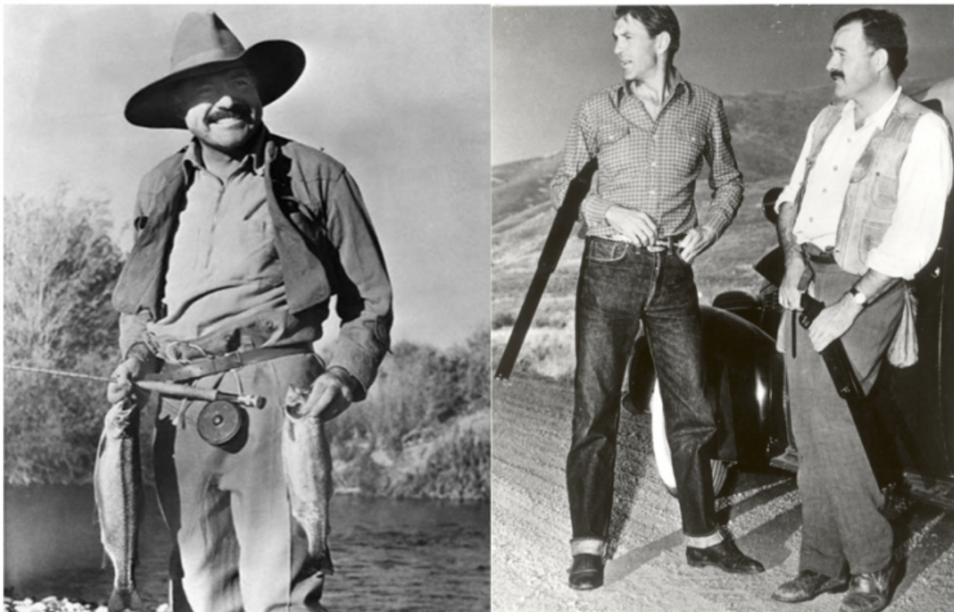
La prima foto “ufficiale” di Hemingway a Ketchum fu presa a pesca sul Big Wood River. Quella fu anche l’unica volta in cui si dedicò alla pesca in Idaho. Per il resto fu sempre e solo caccia. A destra è ritratto insieme all’amico Gary Cooper.