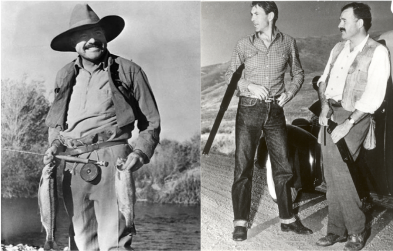
La prima foto "ufficiale" di Hemingway a Ketchum fu presa a pesca sul Big Wood River. Quella fu anche l'unica volta in cui si dedicò alla pesca in Idaho. Per il resto fu sempre e solo caccia. A destra è ritratto insieme all'amico Gary Cooper.