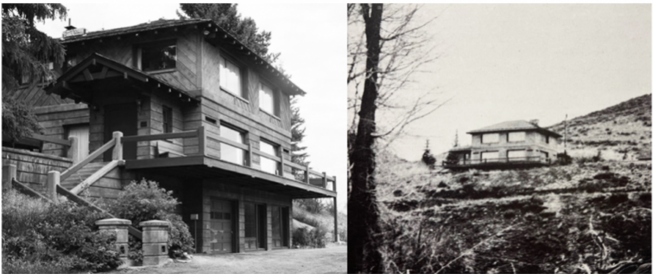
La casa di Ketchum dove Ernest Hemingway si suicidò. A sinistra come è oggi, a destra durante la costruzione