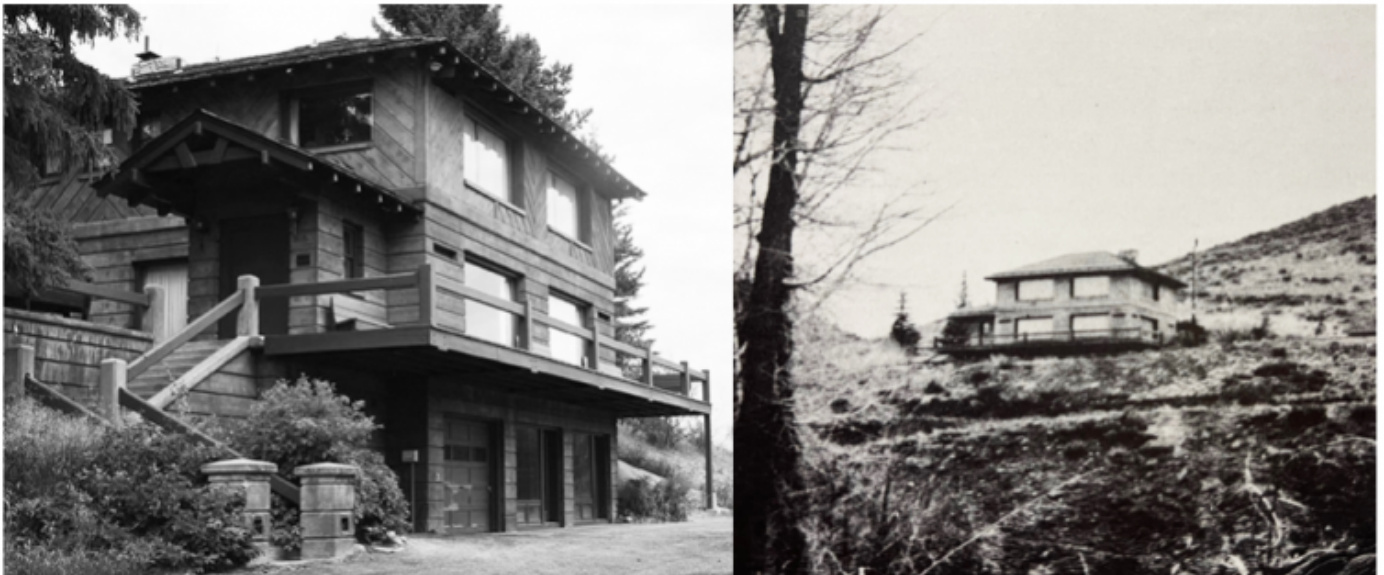
La casa di Ketchum dove Ernest Hemingway si suicidò. A sinistra come è oggi, a destra durante la costruzione

Il 1940 fu lâ??anno del divorzio da Pauline e il secondo in cui passÃ² la stagione invernale a Sun Valley con Martha. Presero alloggio in una suite da 38 dollari a notte che, grazie ai servigi da testimonial, pagava al prezzo nominale di 1 dollaro. A novembre Ernest e Martha si sposarono. Festeggiarono con amici del posto e Robert Capa, che lo aveva raggiunto, come dicevamo pocâ??anzi, per lavorare a un reportage per Life (â??The Novelist Takes A Wifeâ?•), contribuendo cosÃ¬ ad alimentare il mito hemingwayano e quello della stazione sciistica. Capa immortalÃ², poi, in un secondo reportage, lâ??anno successivo, le avventure di caccia di Hemingway e (â??Life Goes Hunting At Sun Valleyâ?•).