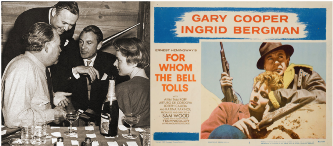
Ernest Hemingway a cena a Ketchum con Gary Cooper e Ingrid Bergman reduci dal successo di pubblico del film Per chi suona la campana , candidato a ben nove premi Oscar.

La biblioteca, pur in possesso di materiali inediti e di una collezione di immagini altrettanto inedite dello scrittore, in effetti non può fare granché per pubblicizzare i materiali in deposito perché i proprietari dei diritti si rifiutano di autorizzarne la pubblicazione: si possono solo sfogliare in loco. Uno fra i tanti motivi? Evitare che con quelle diavolerie della tecnica moderna qualcuno possa fare dei fotomontaggi, sostituire una testa con quella di un altro e annunciare al mondo: «lo conoscevo Hemingway».