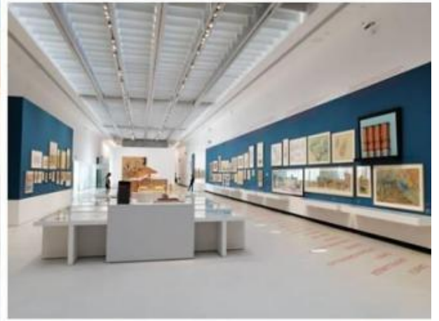
Alcune vedute della mostra in corso al MAXXI Aldo Rossi. L'architetto e le città.

Aldo Rossi. L'architetto e le città – il titolo della mostra, curata da Alberto Ferlenga con il coordinamento di Carla Zhara Buda e realizzata in collaborazione con la Fondazione Aldo Rossi e con l'apporto di Fausto e Vera Rossi e di Chiara Spangaro, visitabile fino al 17 ottobre 2021 al Museo MAXXI di Roma. Tra documenti, carteggi, modelli, schizzi, disegni e fotografie, i pezzi esposti sono più di 800, prevalentemente provenienti dalla Fondazione Aldo Rossi conservata presso il MAXXI stesso.