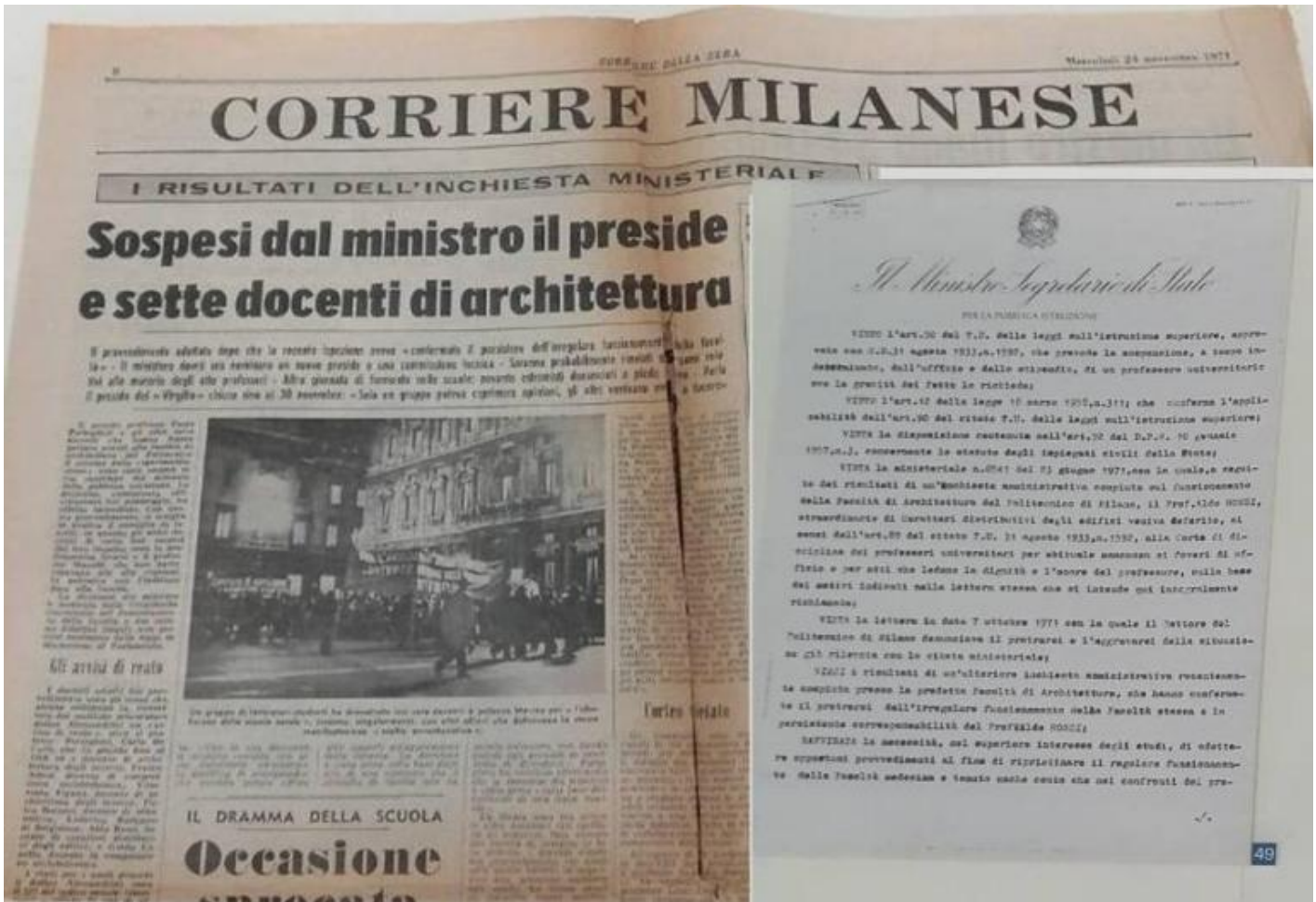
La pagina milanese di Il Corriere della sera del 24 novembre 1971 in cui si dà notizia della iniqua sospensione dei docenti di Architettura, tra cui Aldo Rossi, e dell'allora preside Paolo Portoghesi. Lettera del ministero che comunica ad Aldo Rossi la sua avvenuta sospensione dall'attività di insegnamento al Politecnico di Milano, datata 23 giugno 1971. Entrambi i documenti sono esposti nella mostra romana.

A proposito di questa infame 'cacciata', Aldo Rossi ha coscientemente e laconicamente annotato nei suoi Quaderni Azzurri (il cui titolo forse è un omaggio alle Note Azzurre di Carlo Pisani Dossi, zibaldone di osservazioni e commenti di varia natura, come queste sue note raccolgono invece pensieri che ruotano soprattutto attorno all'architettura e alla città? bello pensarlo.):