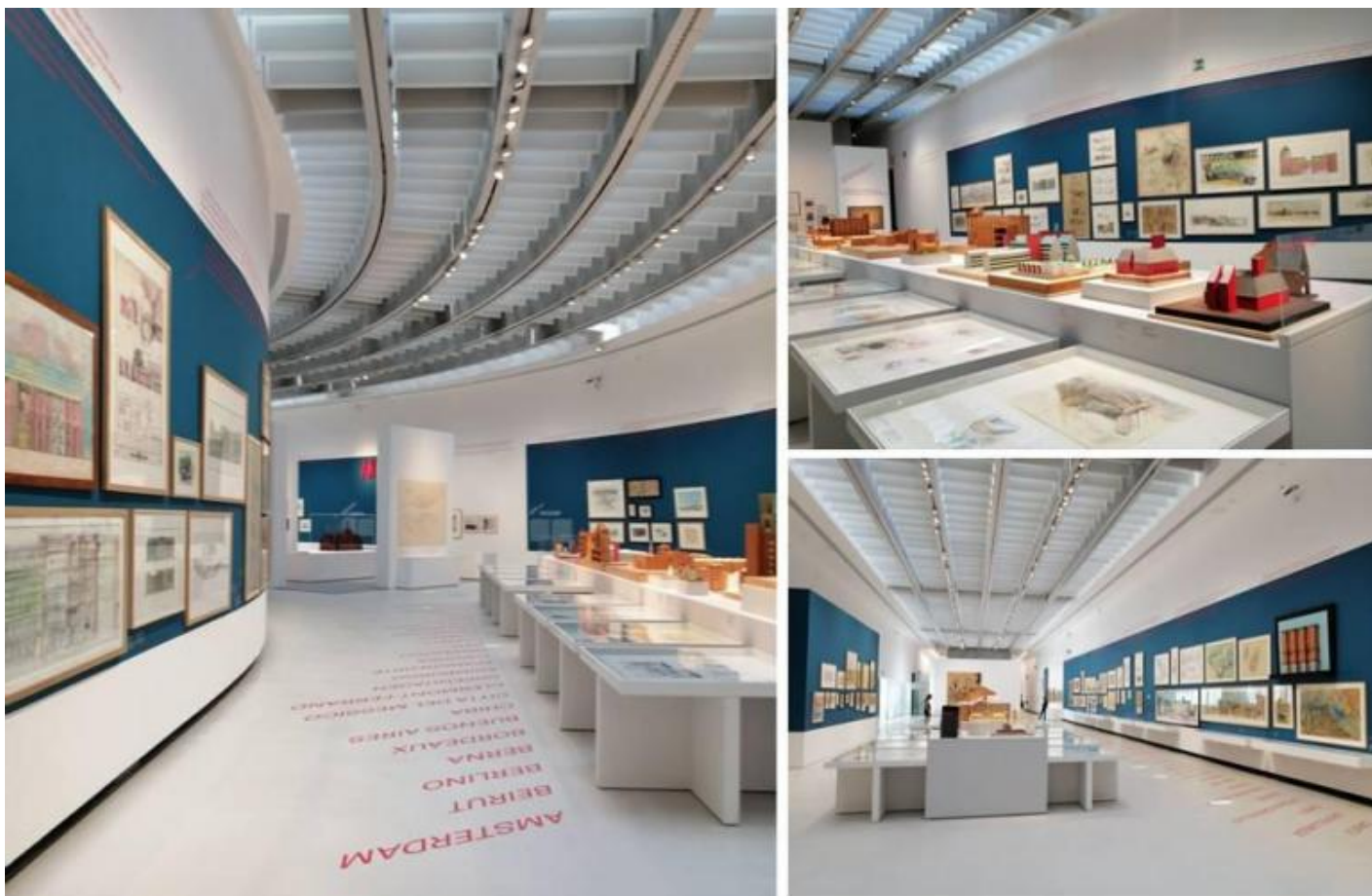
Alcune vedute della mostra in corso al MAXXI Aldo Rossi. L'architetto e le città.

Aldo Rossi. L'architetto e le città è il titolo della mostra, curata da Alberto Ferlenga con il coordinamento di Carla Zhara Buda e realizzata in collaborazione con la Fondazione Aldo Rossi e con l'apporto di Fausto e Vera Rossi e di Chiara Spangaro, visitabile fino al 17 ottobre 2021 al Museo MAXXI di Roma. Tra documenti, carteggi, modelli, schizzi, disegni e fotografie, i pezzi esposti sono più di 800, prevalentemente provenienti dalla Fondazione Aldo Rossi conservata presso il MAXXI stesso.