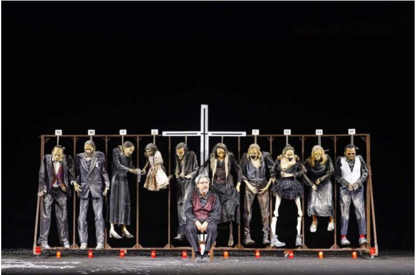
Pupo di zucchero, ph. Ivan Nocera.

tornano esibendo fantocci come proprie controfigure. A un primo sguardo appaiono come i componenti di una classe morta kantoriana, per rivelarsi presto scheletri rivestiti con abiti di tutti i giorni, manichini inquietanti di una vita che fu, come la sequenza di vescovi, monaci, preti, cittadini, adulti, bambini che riempiono la cripta della chiesa dei Cappuccini della Palermo della regista: una teoria di memento mori e di vite depositate che quando visiti quel sito prima guardi con curiosità, poi ammiri, che quindi ti tolgono l'aria e ti costringono a fuggire alla luce.