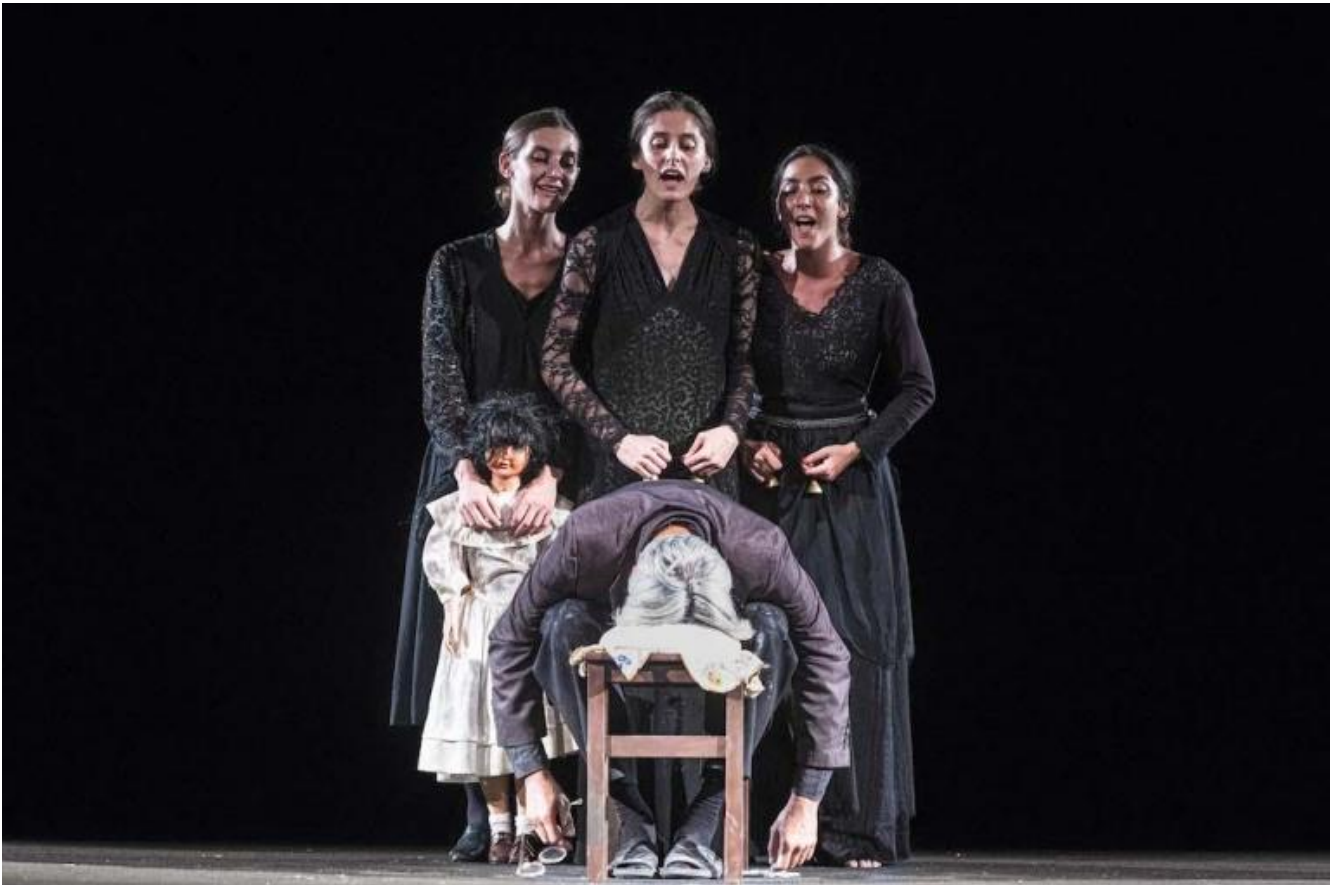
Pupo di zucchero

Tre spazi molto diversi diventano nodali per la narrazione. In Pupo di zucchero di Emma Dante al centro della scena c'è un vecchio, alle prese con i propri ricordi, intento a preparare un tradizionale pupo di zucchero per la ricorrenza dei morti. E subito intorno a lui, che parla napoletano, con ispirazioni da storie del Cunto de li cunti di Giovan Battista Basile, quei morti, quelle morte, le sorelle, il padre sparito in mare, la madre marsigliese, il parente spagnolo e la sua violenta storia d'amore, zii e zie appaiono, come ricordi, come ossessioni, marcate dalla voglia di vivere e dall'incombere della parca che tutto taglia. Le musiche scatenano i corpi; il desiderio, l'amore che penetrano quella vite trapassate spesso si rovesciano nel loro opposto, in violenza, brama di possesso che mai è amore. Il buio si fa luce, passato che urge nella mente in assenza di vita presente.