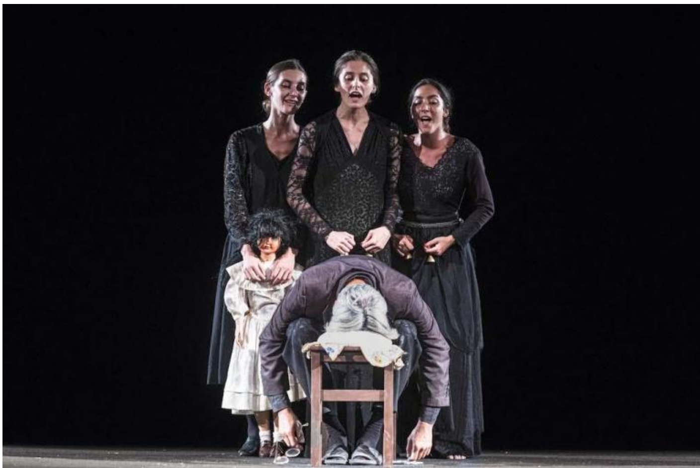
Pupo di zucchero

Tre spazi molto diversi diventano nodali per la narrazione. In Pupo di zucchero di Emma Dante al centro della scena c'è un vecchio, alle prese con i propri ricordi, intento a preparare un tradizionale pupo di zucchero per la ricorrenza dei morti. E subito intorno a lui, che parla napoletano, con ispirazioni da storie del Cunto de li cunti di Giovan Battista Basile, quei morti, quelle morte, le sorelle, il padre sparito in mare, la madre marsigliese, il parente spagnolo e la sua violenta storia d'amore, zii e zie appaiono, come ricordi, come ossessioni, marcate dalla voglia di vivere e dall'incombere della parca che tutto taglia. Le musiche scatenano i corpi; il desiderio, l'amore che penetrano quella vite trapassate spesso si rovesciano nel loro opposto, in violenza, brama di possesso che mai è amore. Il buio si fa luce, passato che urge nella mente in assenza di vita presente.