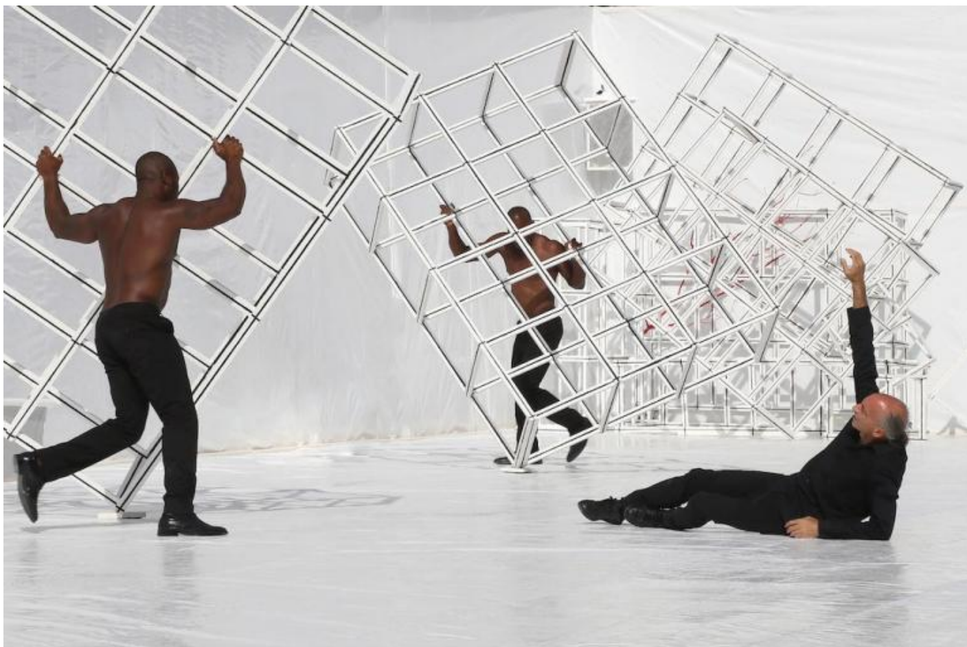
Naturae, ph. Stefano Vaja.

La scena presto si riempie di figuranti, ognuno come un'apparizione fantastica, svincolata da ogni realismo, in un vorticare seducente e stordente: personaggi in antichi abiti sacerdotali, ciechi che indicano il cielo, uomini lanterne, soavi danzatrici rinchiusi nei geometrici parallelepipedi come in piccole celle di vita, scale rosse, uomini libro, corpi in bianco ridipinti nel colore del sangue. È tutto un sogno e un desiderio, cullato dai suoni ripetuti di una musica che in certi momenti occhieggia a cellule tardoromantiche, un pulsare immaginifico che finisce con specchi rivolti agli spettatori, perché, riflettendosi, si guardino a fondo. Ricerca di una meta altrove , indefinita, o, sottilmente, in quel bianco assoluto che come il nero di Emma Dante può alludere alla morte, coscienza che bisogna lasciarsi galoppare e che fissarsi in una meta è impossibile? Con un ultimo possente attore nero che, dopo quasi un'ora di meraviglie, fa girare una di quelle figure geometriche modulari vorticosamente, virtuosisticamente sulle spalle, specchiandosi nel regista che torna a gesticolare, come un iniziato o una persona che si muova in un sogno che non sappiamo dove porterà.