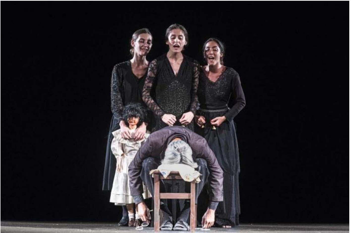
Pupo di zucchero

Tre spazi molto diversi diventano nodali per la narrazione. In Pupo di zucchero di Emma Dante al centro della scena c'è un vecchio, alle prese con i propri ricordi, intento a preparare un tradizionale pupo di zucchero per la ricorrenza dei morti. E subito intorno a lui, che parla napoletano, con ispirazioni da storie del Cunto de li cunti di Giovan Battista Basile, quei morti, quelle morte, le sorelle, il padre sparito in mare, la madre marsigliese, il parente spagnolo e la sua violenta storia d'amore, zii e zie appaiono, come ricordi, come ossessioni, marcate dalla voglia di vivere e dall'incombere della parca che tutto taglia. Le musiche scatenano i corpi; il desiderio, l'amore che penetrano quella vite trapassate spesso si rovesciano nel loro opposto, in violenza, brama di possesso che mai è amore. Il buio si fa luce, passato che urge nella mente in assenza di vita presente.