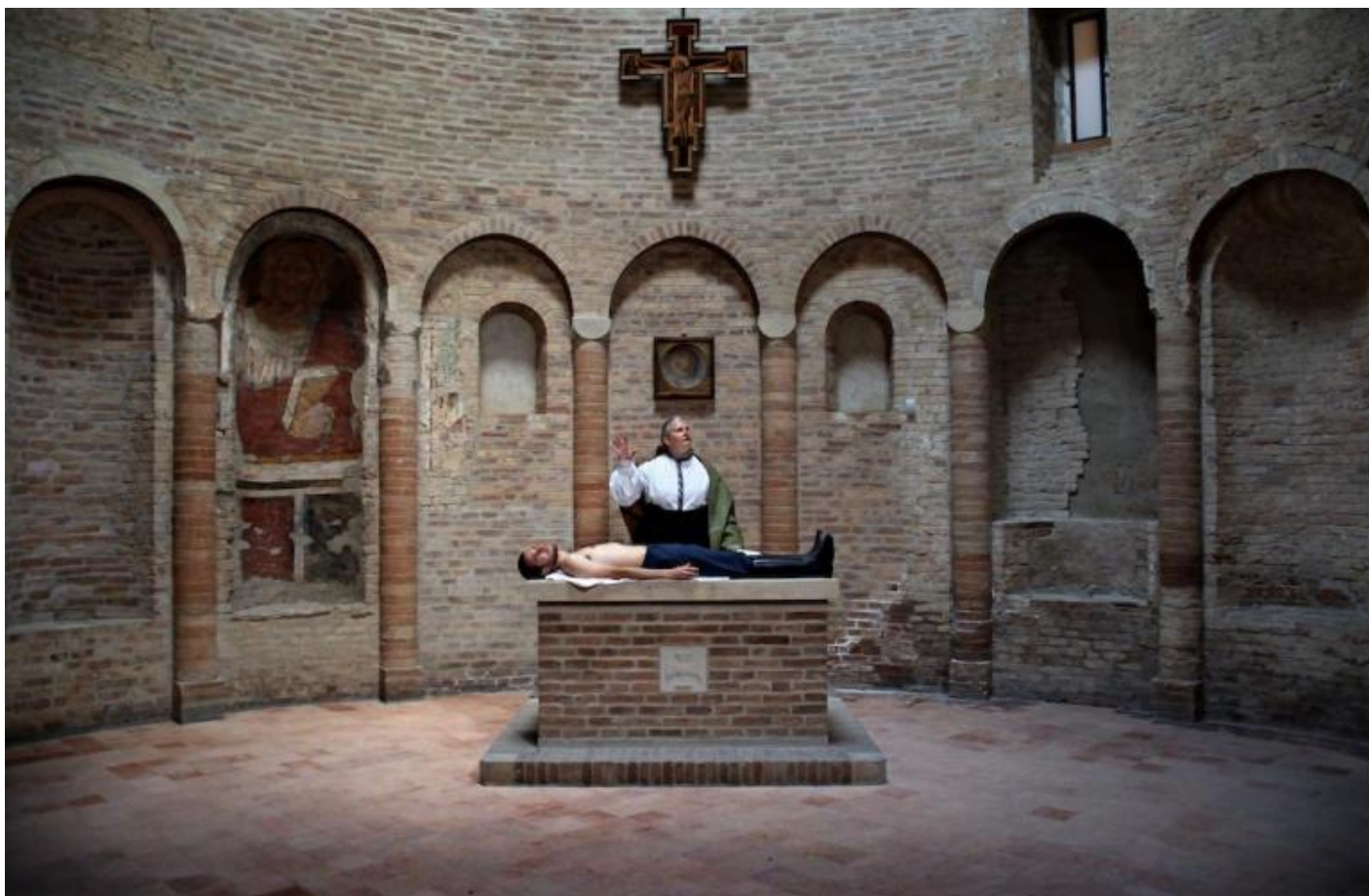
Il volto, ph. Franco Guardascione.

Dostoevskij è stiracchiato nel senso che ne vengono utilizzati brani per ricostruire un proprio viaggio di pensiero, un po' ideologico se vogliamo, che ci parla della sofferenza inflitta all'uomo dall'uomo e della necessità di una redenzione attraverso il fare disarmato dell'Idiota controfigura del Cristo e attraverso l'ingenuità ridente della bambina (mancano, per intenderci, i lati più oscuri del rapporto tra Rogožin e il principe Myškin).