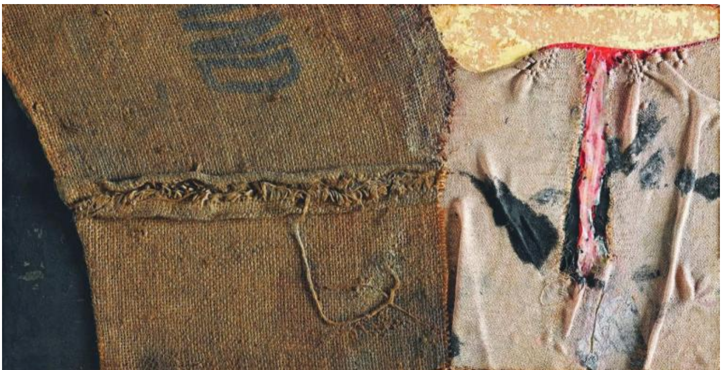
Alberto Burri, Sacco, 1955.

In mostra sono presenti opere provenienti dalla Fondazione Palazzo Albizzini Collezione Burri, dagli Archivi Mario Giacomelli di Senigallia e Sassoferrato, dall'Archivio Sarteanesi e dalla Galleria dello Scudo di Verona. Accanto a fotografie tratte dalle serie Presa di coscienza sulla natura , Storie di Terra o Motivo suggerito dal taglio dell'albero troviamo anche alcune opere grafiche e uniche di Burri, come la serie Combustioni 1965, Cretti 1971, Sacchi , Combustioni su carta e legno , e un prezioso Cretto bianco . All'interno del percorso espositivo si ha la possibilità di vedere anche un'opera pittorica di Giacomelli, realizzata dall'artista prima di dedicarsi completamente al mezzo fotografico; tra gli anni Sessanta e gli anni Ottanta infatti l'autore ha realizzato circa 400 opere pittoriche, la maggior parte delle quali astratte, oggi conservate negli Archivi Mario Giacomelli.