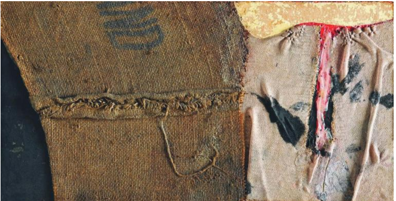
Alberto Burri, Sacco, 1955, Courtesy Fondazione Palazzo Albizzini Collezione Burri ©Fondazione Palazzo Albizzini Collezione Burri - Photo Alessandro Sarteanesi.

In mostra sono presenti opere provenienti dalla Fondazione Palazzo Albizzini Collezione Burri, dagli Archivi Mario Giacomelli di Senigallia e Sassoferrato, dall'Archivio Sarteanesi e dalla Galleria dello Scudo di Verona. Accanto a fotografie tratte dalle serie Presa di coscienza sulla natura , Storie di Terra o Motivo suggerito dal taglio dell'albero troviamo anche alcune opere grafiche e uniche di Burri, come la serie Combustioni 1965 , Cretti 1971 , Sacchi , Combustioni su carta e legno , e un prezioso Cretto bianco . All'interno del percorso espositivo si ha la possibilità di vedere anche un'opera pittorica di Giacomelli, realizzata dall'artista prima di dedicarsi completamente al mezzo fotografico; tra gli anni Sessanta e gli anni Ottanta infatti l'autore ha realizzato circa 400 opere pittoriche, la maggior parte delle quali astratte, oggi conservate negli Archivi Mario Giacomelli.