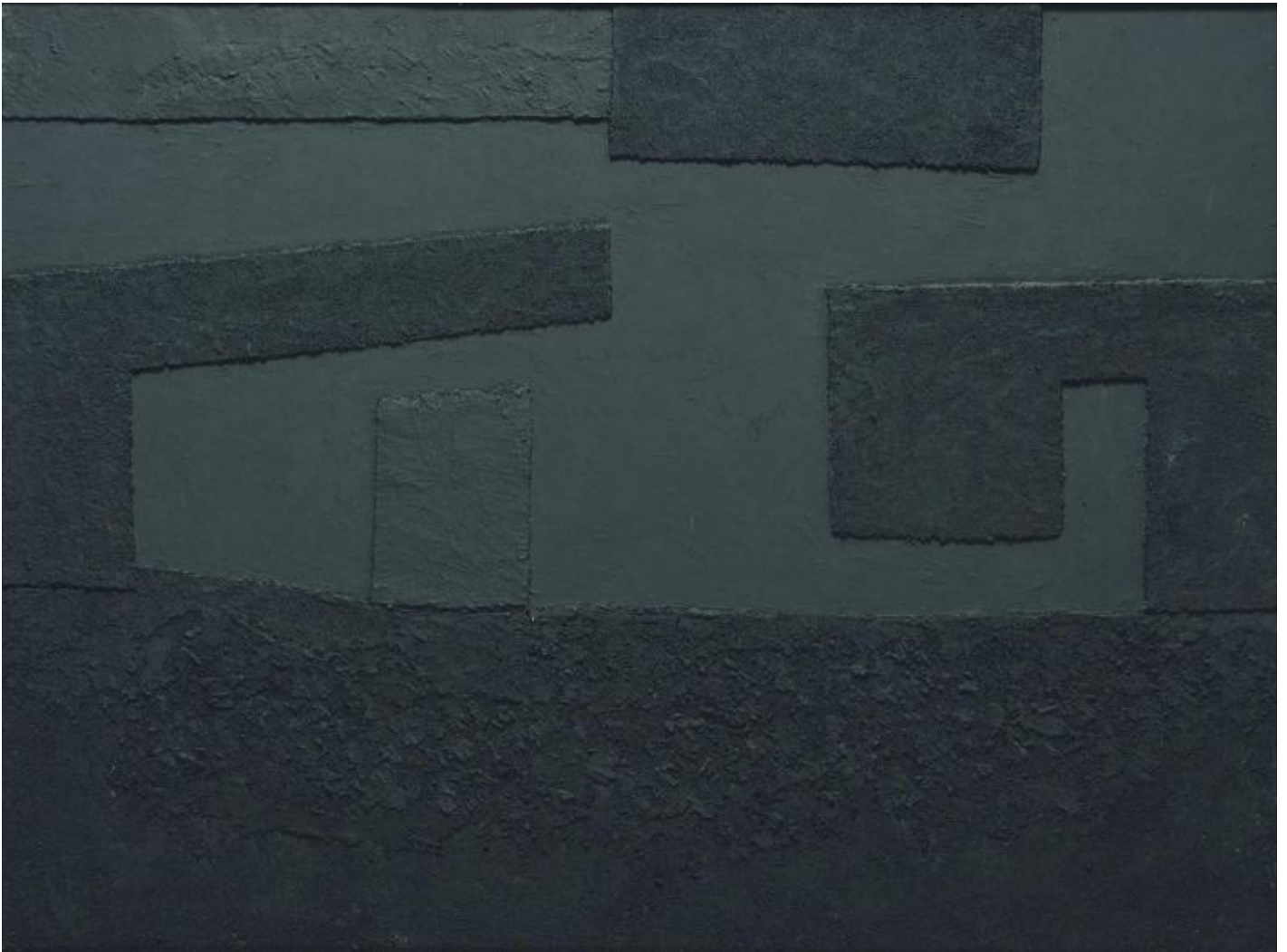
Alberto Burri, Cellotex , 1992, Courtesy Galleria dello Scudo, ©Fondazione Palazzo Albizzini Collezione Burri - Photo Alessandro Sarteanesi.

Giacomelli d'altronde, ben prima di conoscere personalmente Burri, aveva già dimostrato apprezzamento e stima per pittura del maestro tifernate, e Burri stesso era a sua volta affascinato dall'arte fotografica e interessato al lavoro di Giacomelli, come testimoniato anche da una lettera del 1966.