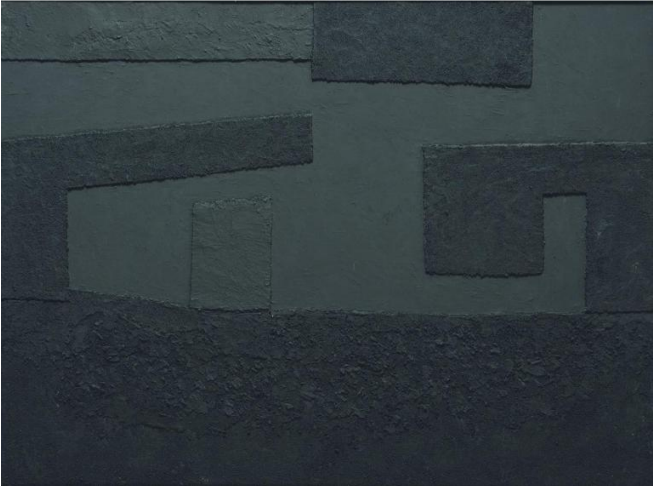
Alberto Burri, Cellotex, 1992, Courtesy Galleria dello Scudo, ©Fondazione Palazzo Albizzini Collezione Burri - Photo Alessandro Sarteanesi.

Giacomelli d'altronde, ben prima di conoscere personalmente Burri, aveva già dimostrato apprezzamento e stima per pittura del maestro tifernate, e Burri stesso era a sua volta affascinato dall'arte fotografica e interessato al lavoro di Giacomelli, come testimoniato anche da una lettera del 1966.