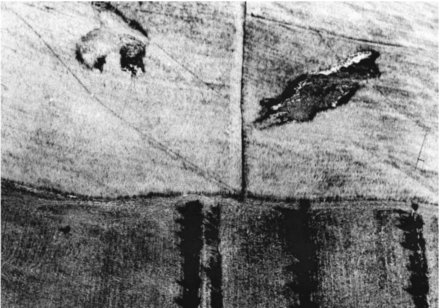
Mario Giacomelli, Paesaggio, 1965, (donata ad Alberto Burri), Courtesy Fondazione Palazzo Albizzini Collezione Burri, Archivio Mario Giacomelli ©Rita e Simone Giacomelli.

In entrambi i casi infatti si riscontra l’attitudine a concepire e costruire l’immagine come sintesi e come astrazione, come ricettacolo di segni che assumono valenze e giungono a esiti simili dal punto di vista formale, ma comunque differenti e specifici in base alla poetica dell’artista. Da un lato c’è Alberto Burri, uno degli esponenti più significativi dell’informale italiano di tendenza materica, che fa proprio della materia squarciata, strappata, bruciata, bucata e composta in maniera pittorica la protagonista delle sue opere. Dall’altro lato c’è Mario Giacomelli, che ha fatto dell’indagine sul paesaggio marchigiano la sua cifra poetica distintiva: nonostante infatti durante la sua lunga carriera la sua ricerca abbia spaziato tra tematiche differenti (tra le altre, celeberrima è la serie Verrà la morte e avrà i tuoi occhi , in cui viene raccontata la vita all’interno di un ospizio), la riflessione sul paesaggio intorno a Senigallia, suo luogo d’origine, è stata una costante, mai abbandonata o trascurata.