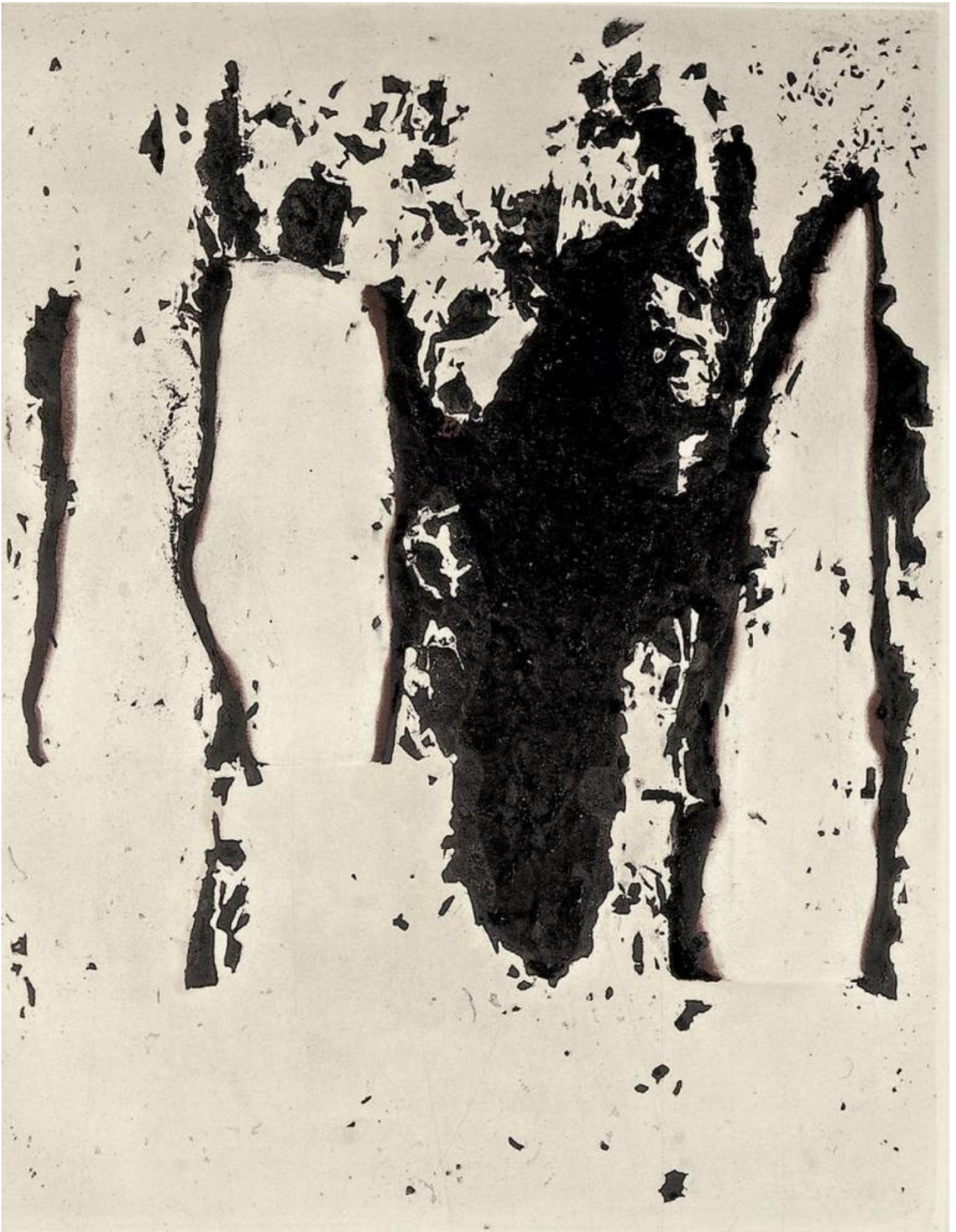
Alberto Burri, Combustione, 1965, ©Fondazione Palazzo Albizzini Collezione Burri - Photo Alessandro Sarteanesi.