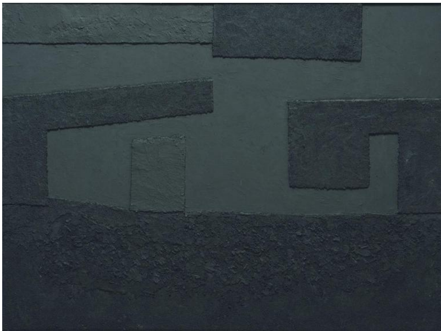
Alberto Burri, Cellotex, 1992.

Giacomelli d'altronde, ben prima di conoscere personalmente Burri, aveva già dimostrato apprezzamento e stima per pittura del maestro tifernate, e Burri stesso era a sua volta affascinato dall'arte fotografica e interessato al lavoro di Giacomelli, come testimoniato anche da una lettera del 1966.