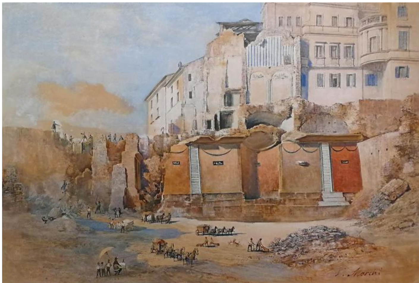
Vincenzo Marchi, Scavi archeologici, 1880-89. Roma, Museo di Roma, Gabinetto delle stampe, GS 2985.

La seconda sezione della mostra Vivere e abitare a Roma tra la fine dell'età repubblicana e l'età tardo-antica: le dimore di lusso e i contesti domestici ricostruisce l'ambiente nel quale sono stati rinvenuti i mosaici. Diversi acquarelli su carta documentano il momento dei ritrovamenti. Suggestivo quello dipinto da Vincenzo Marchi, che rappresenta il ninfeo scavato nella proprietà dei Claudii Claudiani.