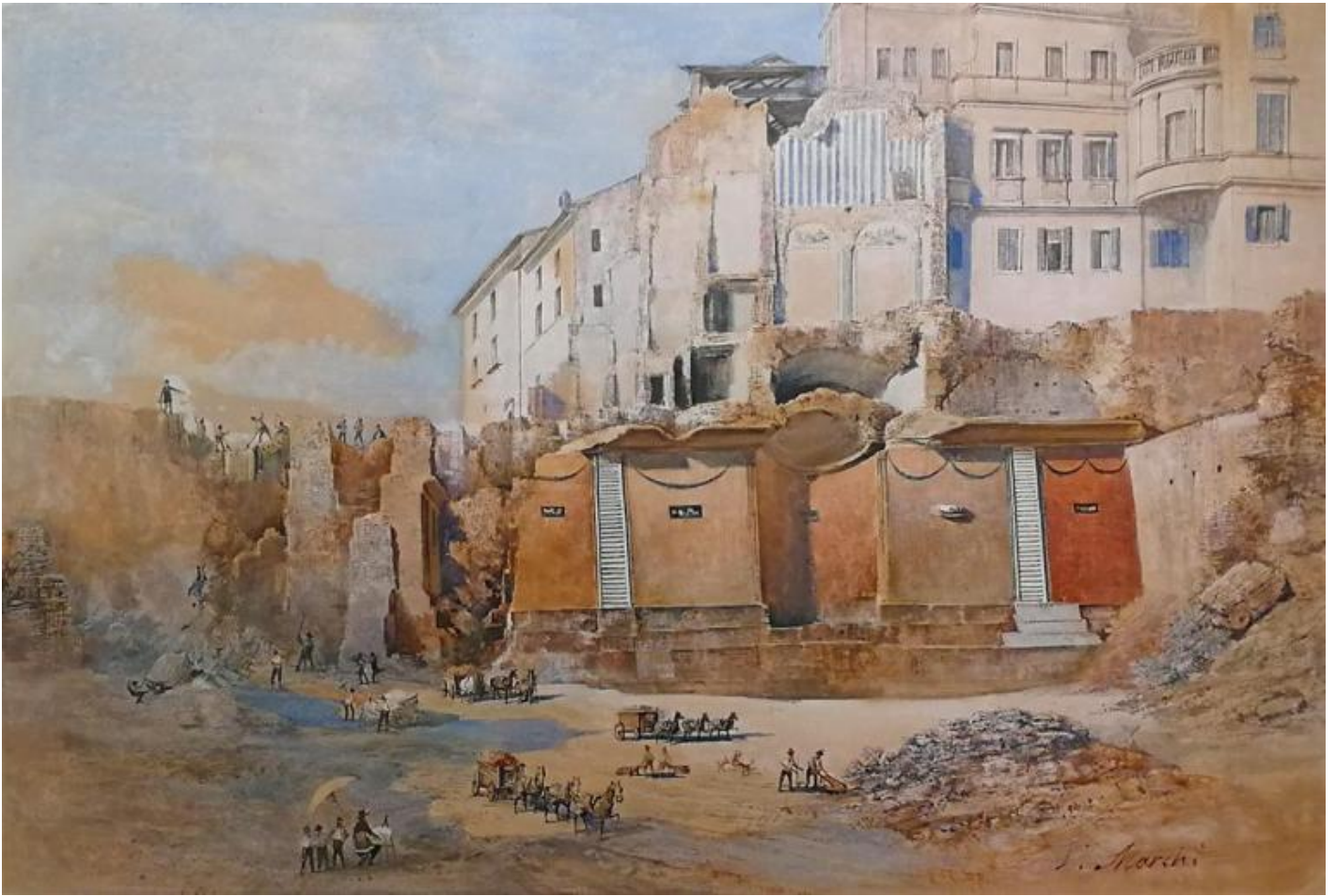
Vincenzo Marchi, Scavi archeologici, 1880-89. Roma, Museo di Roma, Gabinetto delle stampe, GS 2985.

La seconda sezione della mostra Vivere e abitare a Roma tra la fine dell'etÀ repubblicana e l'etÀ tardo-antica: le dimore di lusso e i contesti domestici ricostruisce l'ambiente nel quale sono stati rinvenuti i mosaici. Diversi acquarelli su carta documentano il momento dei ritrovamenti. Suggestivo quello dipinto da Vincenzo Marchi, che rappresenta il ninfeo scavato nella proprietÀ dei Claudii Claudiani.