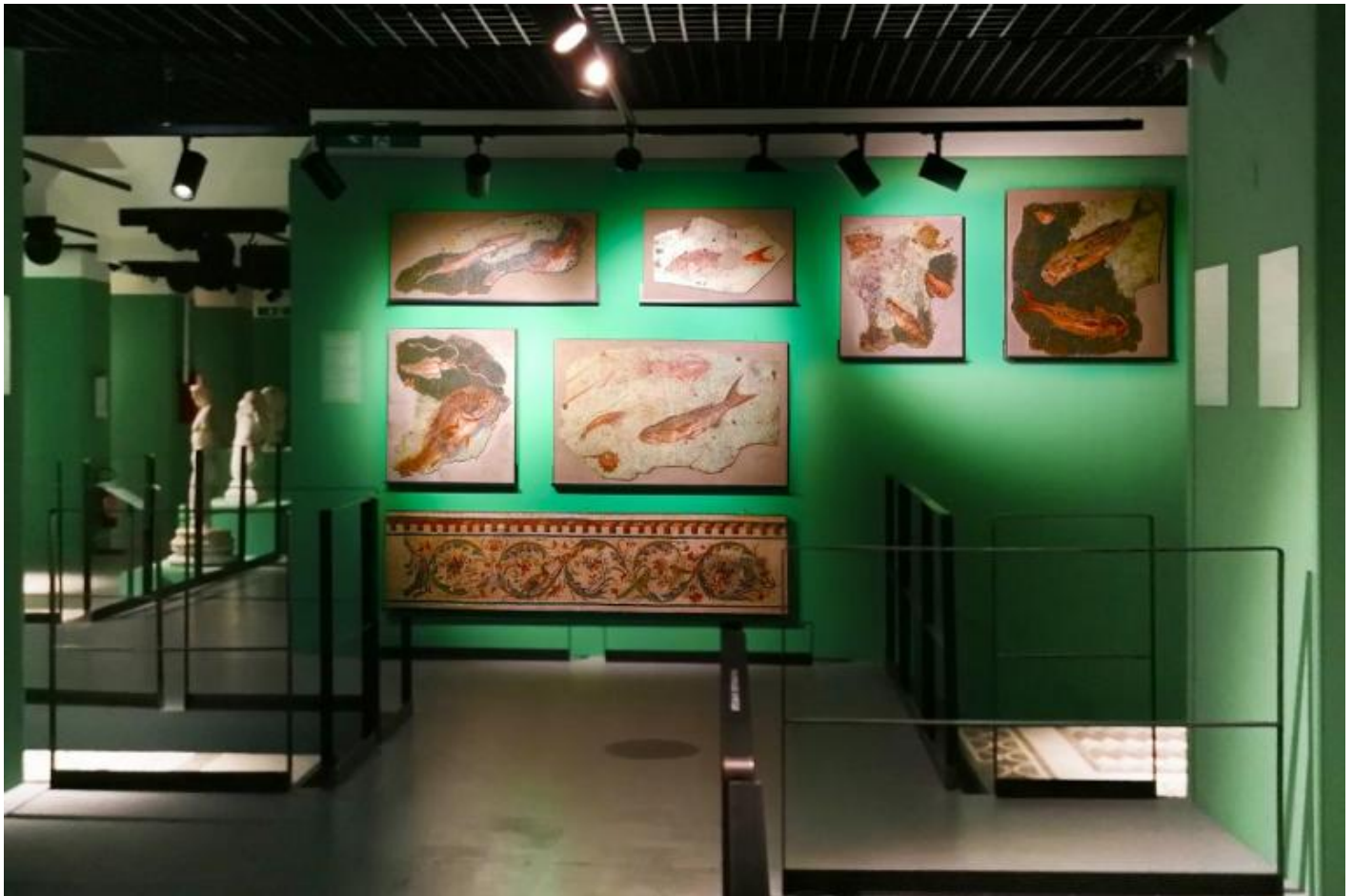
Veduta della seconda sezione della mostra: Vivere e abitare a Roma tra la fine dell'età repubblicana e l'età tardo-antica: le dimore di lusso e i contesti domestici.

Incantevole il mosaico policromo con fondale marino, nel quale i pesci guizzano lanciando bagliori colorati (notare la tessere azzurre inserite tra l'occhio e la branchia del pesce). Gli effetti luministici e chiaroscurali resi con l'uso di tessere minute sembrano gettare un ponte sull'abisso che ci separa dalla mentalità delle maestranze greche e dei committenti, che tra il II e il I secolo a.C. inaugurarono a Roma la moda di “vivere alla greca”, ma il lutto moderno per la perdita di qualcosa che abbiamo amato o ammirato, segnalato da Freud, marca la distanza che ci separa da questi antichi appassionati d'arte, che iniziarono a collezionare mosaici come già prima collezionavano statue e oggetti di lusso di fabbricazione greca.