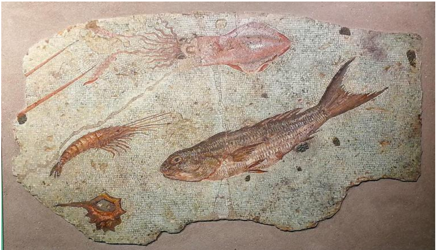
Mosaico policromo con fondale marino. Primo quarto del I secolo a.C. Roma, Musei Capitolini, Centrale Montemartini, AC 323559.

A differenza del mosaico della Casa del Poeta Tragico , qui non ci sono equivoci: l'immagine comunica anche a noi il fascino di ciò che appare d'un tratto e poi scompare: la natura breve e transitoria di un'esperienza, che Publio Ovidio Nasone associa alla bellezza: «La bellezza è un bene fragile» ( Ars Amatoria , II, 113). La caducità del bello ne aumenta il valore, annota Sigmund Freud nel resoconto di una passeggiata in compagnia di due amici, constatando che i due avvertivano nel loro godimento del bello un'interferenza perturbatrice del pensiero della caducità (« Caducità », in Opere. 1915-1917 , volume 8, OSF, Boringhieri 1989, pp. 173-176).