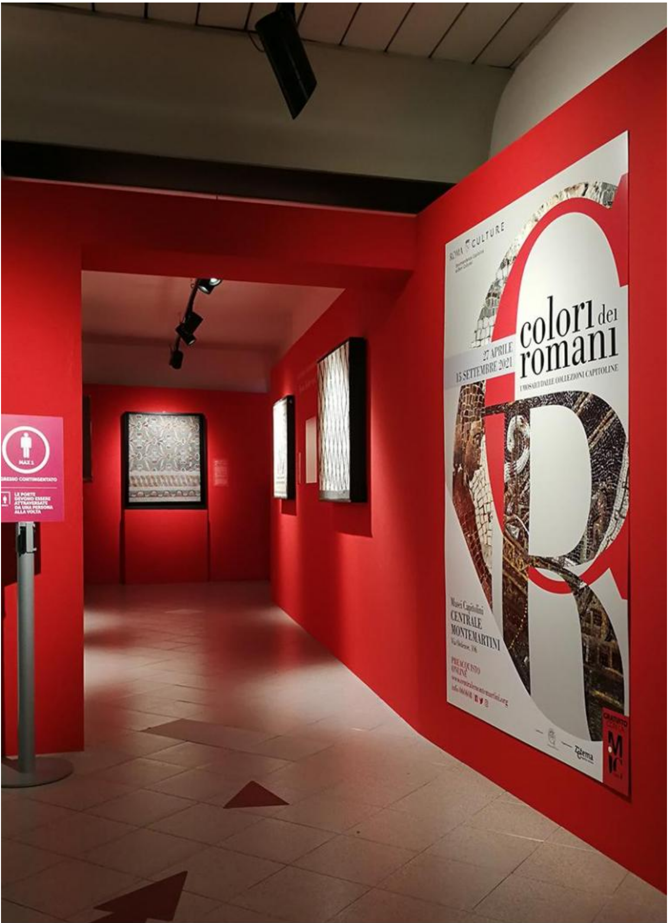
Colori dei Romani. I mosaici dalle Collezioni Capitoline, ingresso della mostra.