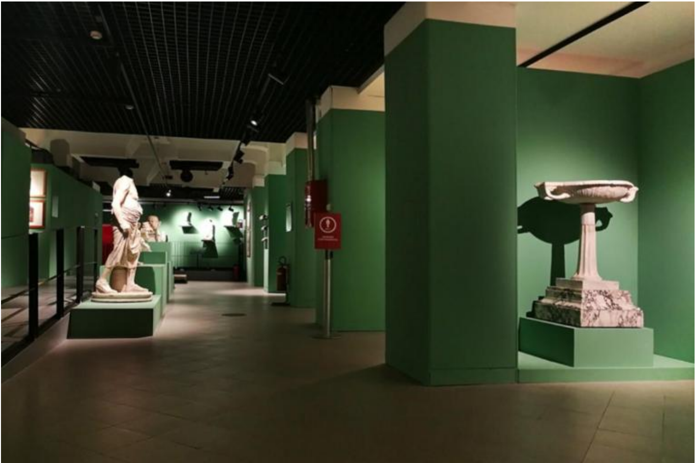
Veduta della seconda sezione della mostra: Vivere e abitare a Roma tra la fine dell'età repubblicana e l'età tardo-antica: le dimore di lusso e i contesti domestici.

Il “vivere alla greca”, che trionfa tra il II e il I secolo a.C., si accompagna alla ricerca del lusso sia nella sfera pubblica che in quella privata. Plinio stigmatizza il trionfo del lusso: “luxuriae gloria”, che consiste nel possedere ciò che può andare perduto in un attimo: “dalla terra abbiamo estratto gli oggetti di murra e di cristallo, resi pregiati dalla loro stessa fragilità [...] questo il vero trionfo del lusso; possedere ciò che potesse andar totalmente distrutto in un attimo” ( Storia Naturale , XXXIII, 5). Con un'acutezza degna di un sociologo ante-litteram, Plinio rileva nella ricchezza la causa della deprecabile deriva del sentire che lega la bellezza alla caducità, criticando gli stili di vita e i modi di abitare del suo tempo.