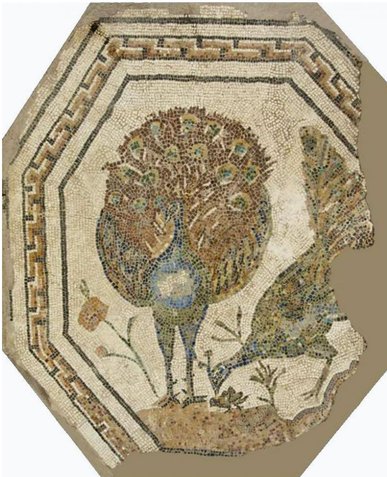
Mosaico policromo ottagonale con pavoni, proveniente da una tomba lungo la Via Appia. Il secolo d.C. Roma, Musei Capitolini, Antiquarium, VM 60.