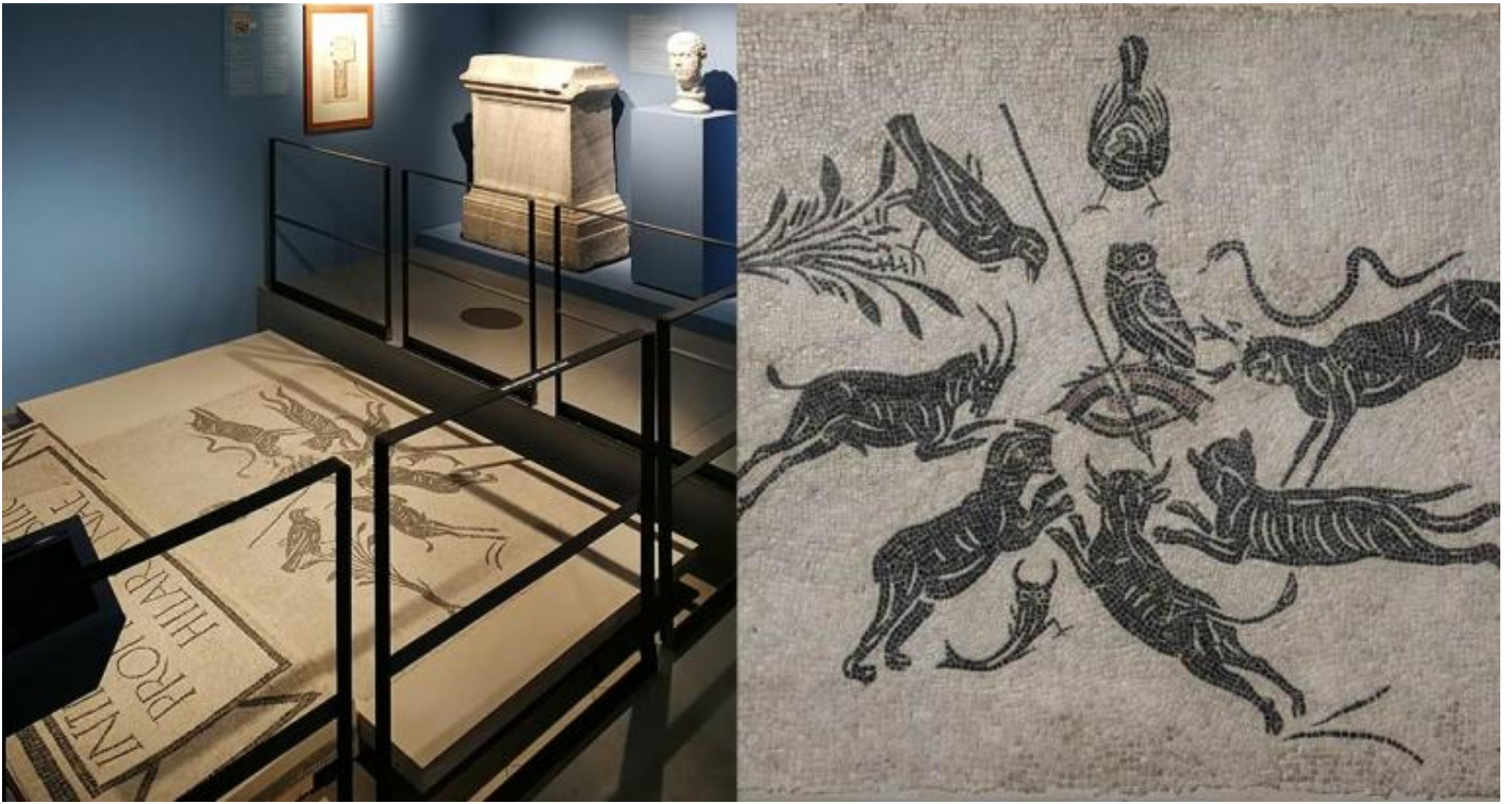
Veduta della sezione Gli spazi del sacro: la basilica Hilariana / Mosaico bianco nero con scena di malocchio. MetÀ del II sec. d.C. Roma, Musei Capitolini, Antiquarium, AC 4951.

Nella terza sezione Gli spazi del sacro: la basilica Hilariana , sede del collegio dei sacerdoti addetti al culto di Cibele e di Attis, Å esposto un mosaico apotropaico raffigurante un occhio umano trafitto da una freccia, sul quale Å appollaiata una civetta. Secondo gli studi condotti sul reperto, l'occhio trafitto da un dardo e circondato da una serie di animali sarebbe simbolo dell'invidia. Non Å tuttavia chiaro se lâ?occhio abbia un rapporto anche con quello glaucopide di Atena, che vede nel buio (per questa ragione associata alla civetta) lanciando raggi visivi e luminosi rappresentati a guisa di dardi (Charles Mugler, Sur une polÃ©mique scientifique dans Aristophane , in Revue des Åtudes Grecques , 1959). Albert Lejune, Euclide et Ptolome. Deux stades de lâ?optique geometrique grecque , Louvain, 1948, pp. 18-21 e 59). L'opacitÅ di queste immagini costituisce la profonditÅ stessa del simbolo, perchÅ© â?il simbolo dÅ il suo senso in enigma â?• (Paul Ricoeur, Il simbolo dÅ a pensare , Morcelliana, Brescia, 2002, p. 19). Il mosaico trovato all'ingresso della basilica Hilariana Å un emblema posto al centro di un modo di pensare per immagini con valore simbolico, che spesso ricorrono nei contesti religiosi e funerari.