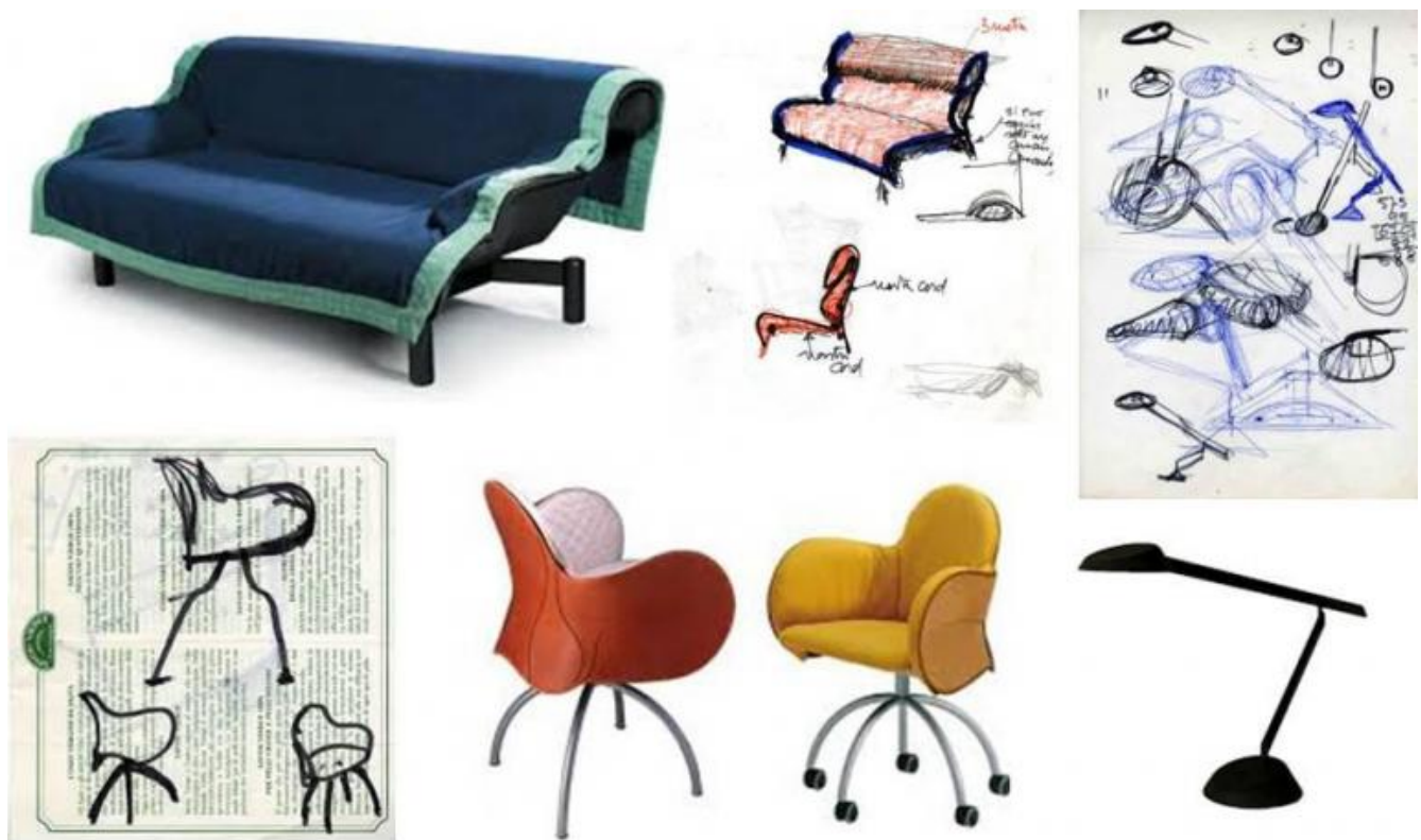
Vico Magistretti, divano Simbad, Cassina, 1981; lampada Lester, Oluce, 1987; sedia Incisa, De Padova 1992.

A proposito della Ant Chair di quest'ultimo, così ha detto nel 1954: "Per me la Ant Chair non è semplicemente una sedia, è un archetipo, e direi addirittura, dopo Thonet, un grande esempio di archetipo perfetto [...] il più importante pezzo di questa metà di secolo."