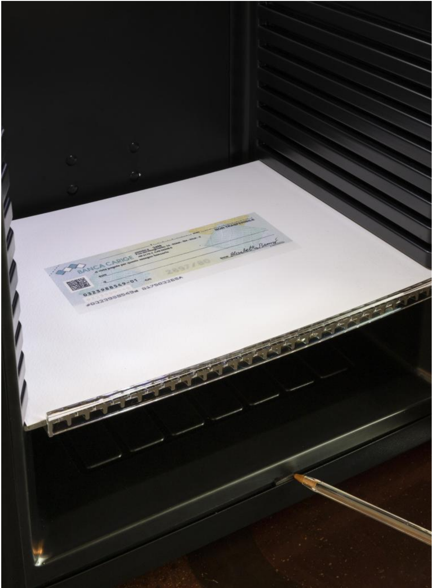
Sala 4, Elisabetta Benassi, Installation view, ph Andrea Rossetti.