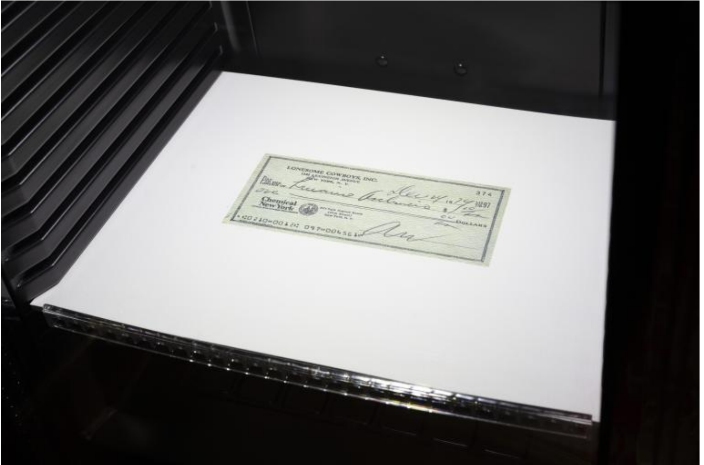
Sala 2, Assegno Warhol.

due video in cui la si vedeva in moto con un sosia dello scrittore in uno e giocare a calcio con lui nell'altro ( Time code e You'll never walk alone , del 2000) e, come si ricorderà, venne assassinato il 2 novembre di quell'anno, episodio dunque sotteso all'evento in causa, che fece slittare la mostra milanese all'anno seguente in un clima decisamente cambiato anche in questo senso in cui il testo suonava come una sorta di testamento. Scriveva, sempre con la profondità e inesorabilità delle sue interrogazioni: «Ci può essere una divisione storica nell'universo in cui viviamo? Può scorrere una linea divisoria tra gli uomini? E in particolare nelle loro coscienze? Una rivoluzione marxista può, prima, separare il tutto unico attraverso quella opposizione fatale e totale che è la lotta di classe e poi trasformarlo fino a farlo sparire? Queste sono le domande che costituiscono il messaggio che l'Europa manda all'America, il messaggio della quale invece implica unitarietà, omogeneità, compattezza.