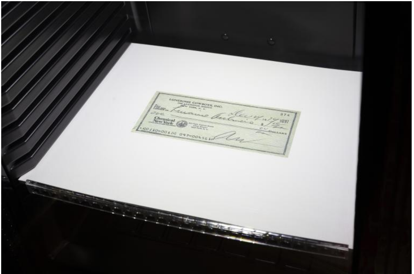
Sala 2, Assegno Warhol.

episodio dunque sotteso all'evento in causa, che fece slittare la mostra milanese all'anno seguente in un clima decisamente cambiato anche in questo senso in cui il testo suonava come una sorta di testamento. Scriveva, sempre con la profondità e inesorabilità delle sue interrogazioni: "Ci può essere una divisione storica nell'universo in cui viviamo? Può scorrere una linea divisoria tra gli uomini? E in particolare nelle loro coscienze? Una rivoluzione marxista può, prima, separare il "tutto unico" attraverso quella opposizione fatale e totale che è la lotta di classe e poi trasformarlo fino a farlo sparire?" Queste sono le domande che costituiscono il messaggio che l'Europa manda all'America, il messaggio della quale invece "implica unitarietà, omogeneità, compattezza.