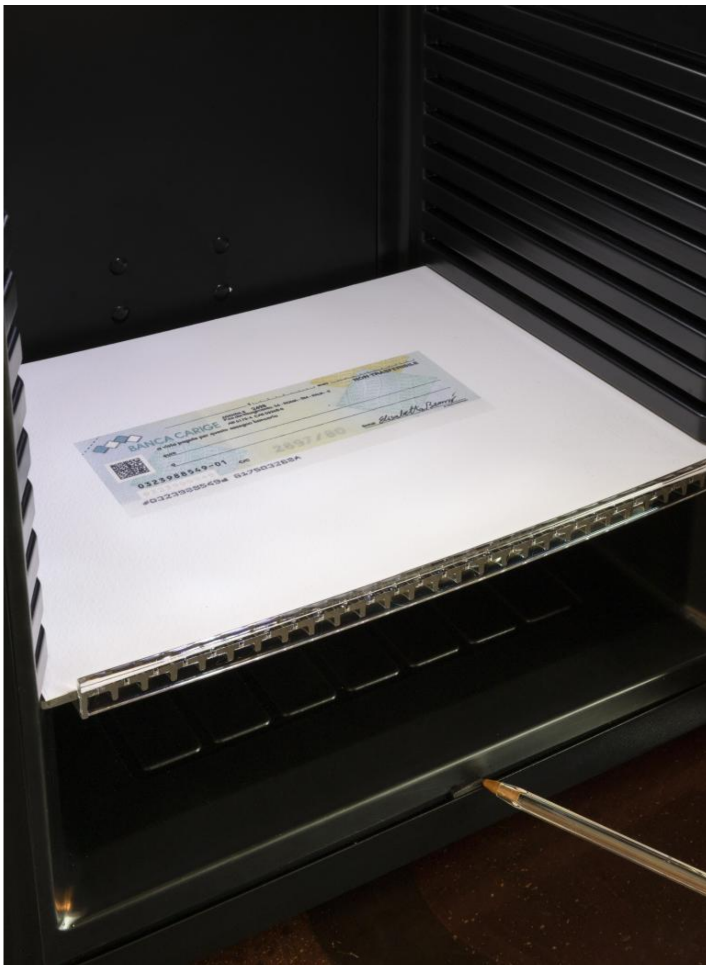
Sala 4, Elisabetta Benassi, Installation view, ph Andrea Rossetti.