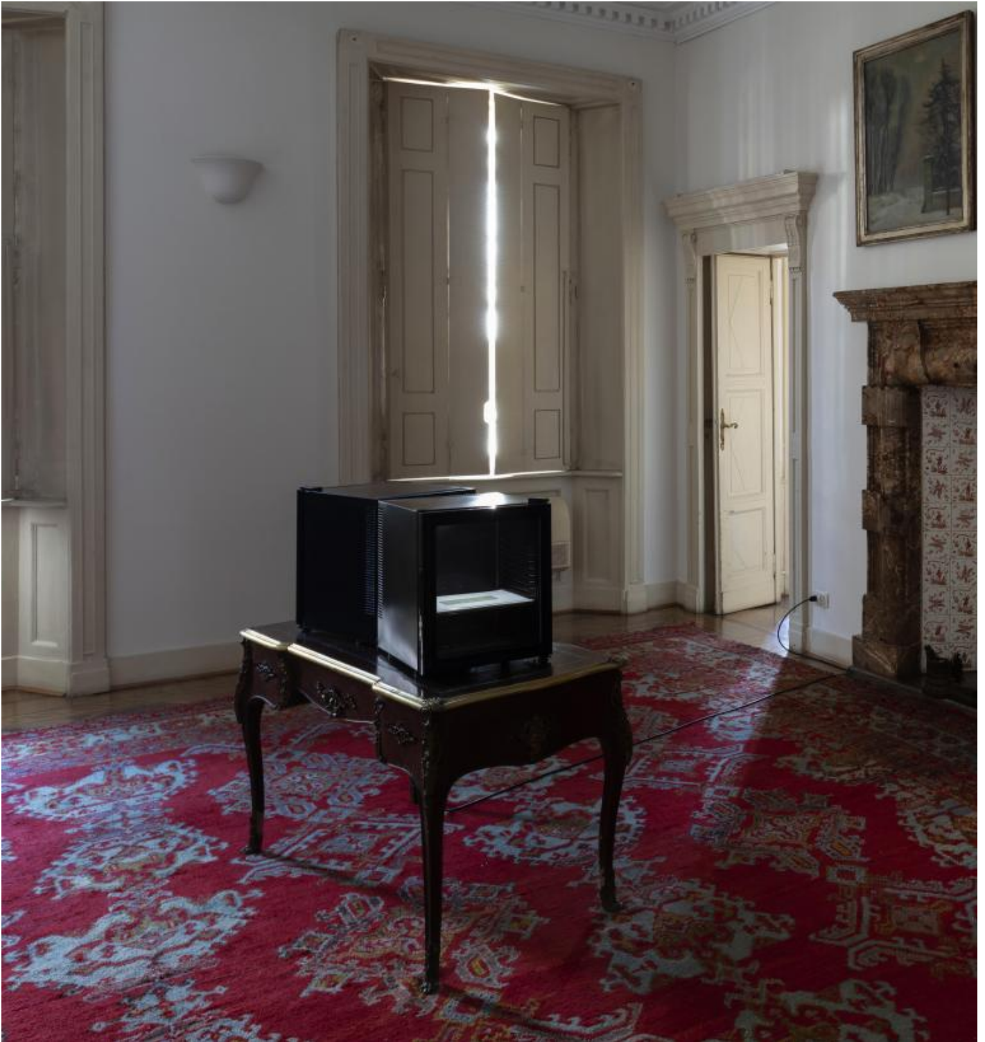
Sala 2, Elisabetta Benassi, Installation view.

rovesciamenti che Ã in ballo anche a livello di immagine.