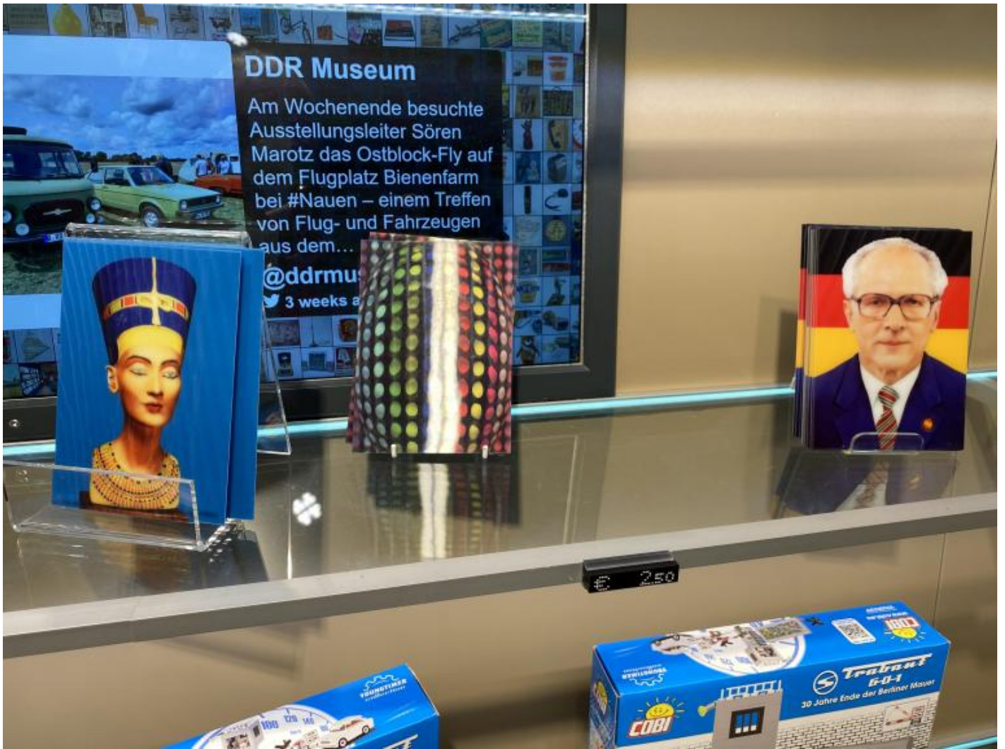
Nefertiti, Honecker e riproduzioni della Trabant.

Uscendo da questo caotico assemblaggio di pseudo-emozioni, e risalendo le scale per guadagnare Karl-Liebknecht-Straße, al di là della strada fra gli alberi, si scorgono le sagome di Marx ed Engels con lo sguardo più fisso che mai puntato oggi sull'Humoldt Forum, la parte moderna del Castello prussiano recentemente ricostruito.