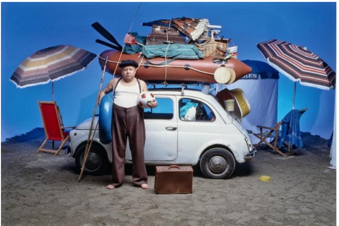
Fantozzi al mare.

Azzardo, per ribadire il discorso sulle esperienze condivise e sulle rispettive specificità, il rimando a un'immagine cinematografica che ha fatto storia in Italia: Fantozzi in ferie alle prese con la sua Cinquecento stracarica di ogni masserizia. Ancora una volta emerge la necessità di collegare situazioni, abitudini, comportamenti apparentemente identici alla situazione specifica di ogni cultura per evitare sia le generalizzazioni che le attribuzioni peculiari non corrette.