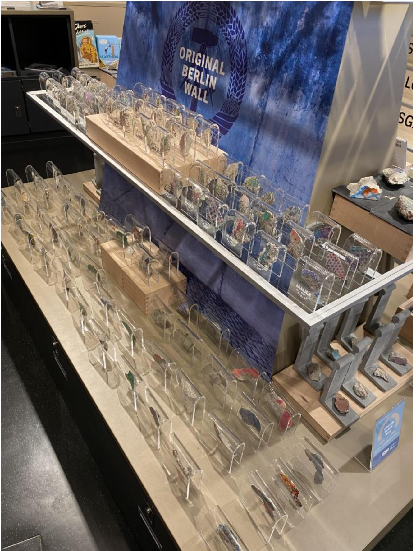
Frammenti di Muro.