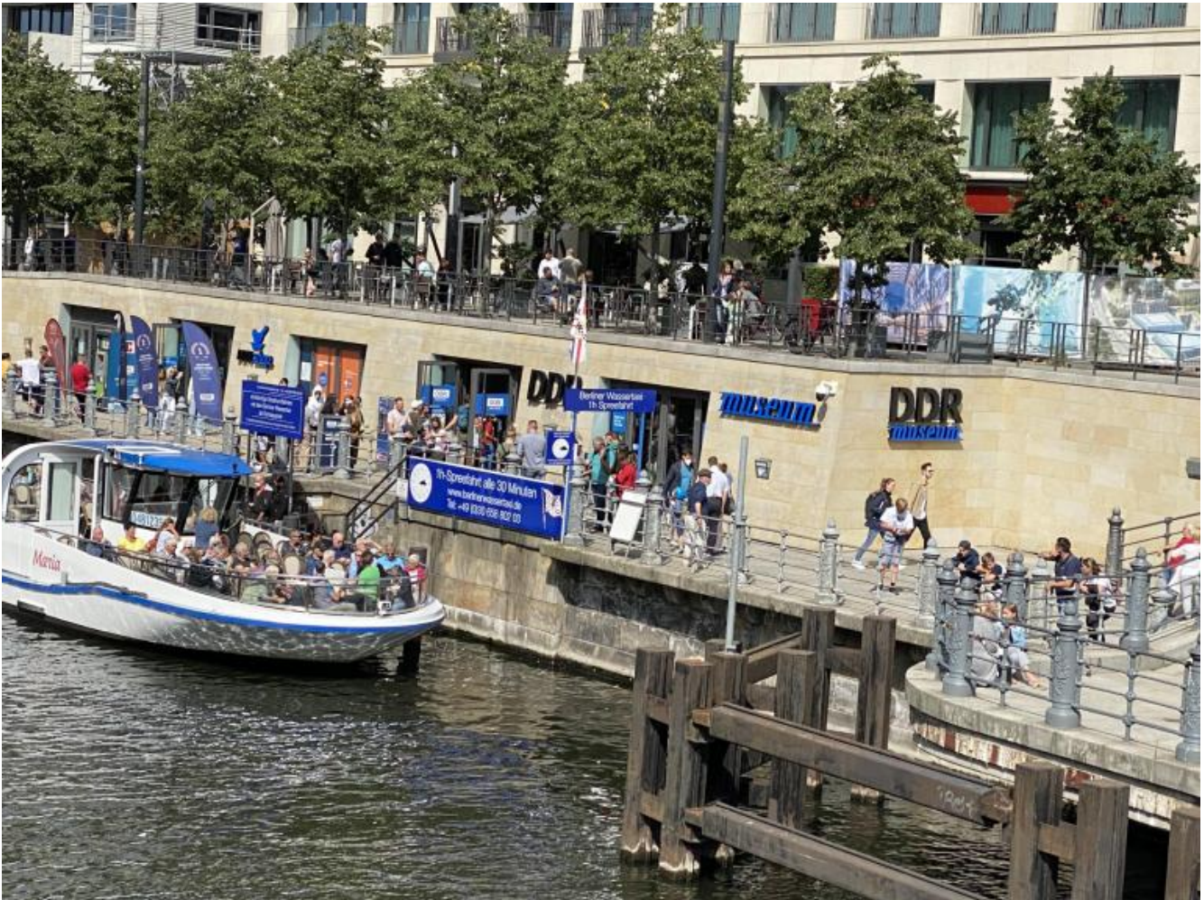
L'ingresso al DDR Museum di Berlino.

Possiede una collezione di 300.000 artefatti , 13.000 già digitalizzati, sotto la cura del dott. Wolle, responsabile anche dei volumi, per ora tre, che propongono la storia della DDR attraverso gli oggetti (100 euro l'uno). Imposta la promozione sulla totale interattività dei suoi reperti: i visitatori possono (anzi devono) toccare le cose, aprire cassette e armadi, addirittura indossare abiti e giocare con gli oggetti.