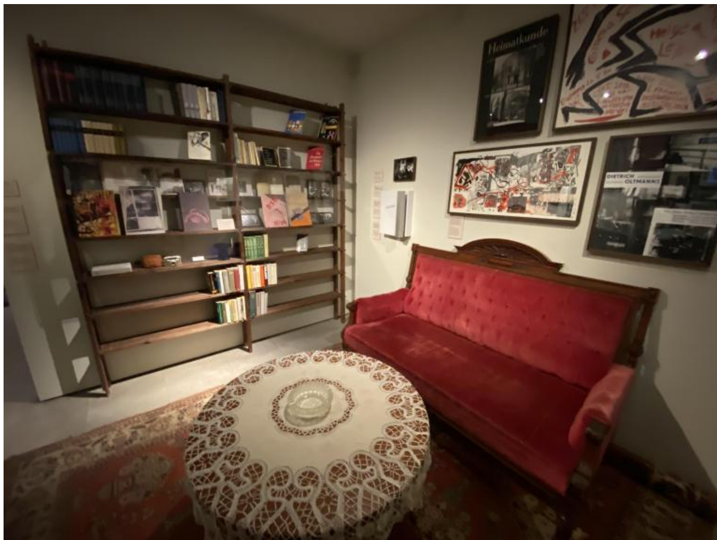
La ricostruzione di un salotto domestico.

il terrazzino della dacia, modesto ed essenziale, evoca serene giornate di relax (corredate da filmini in super 8),