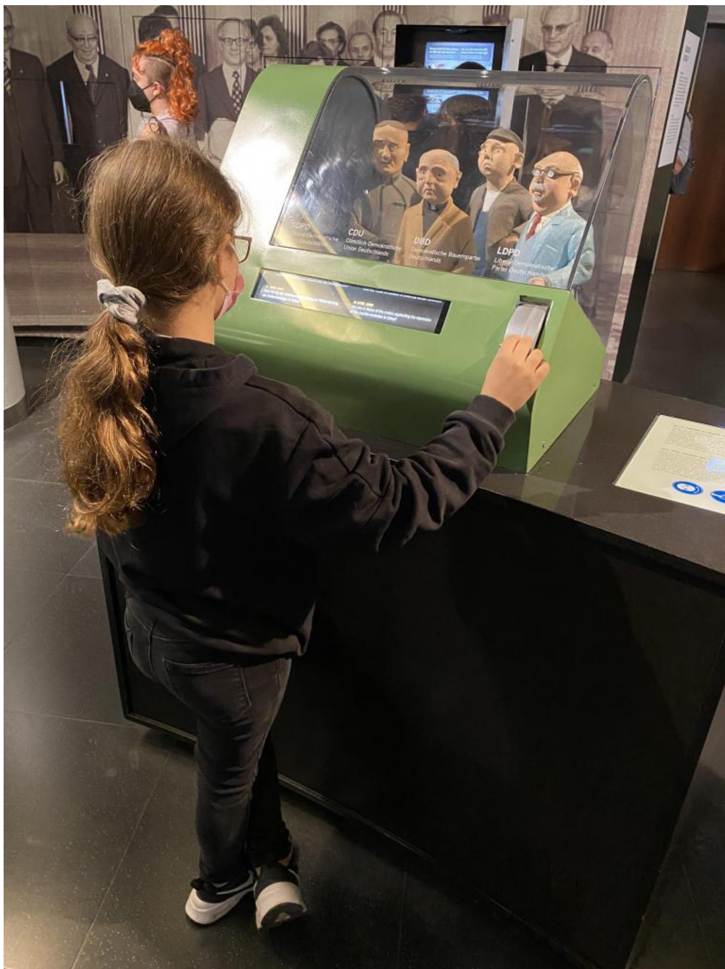
Una bambina aziona il meccanismo che fa votare all'unanimità i delegati politici.