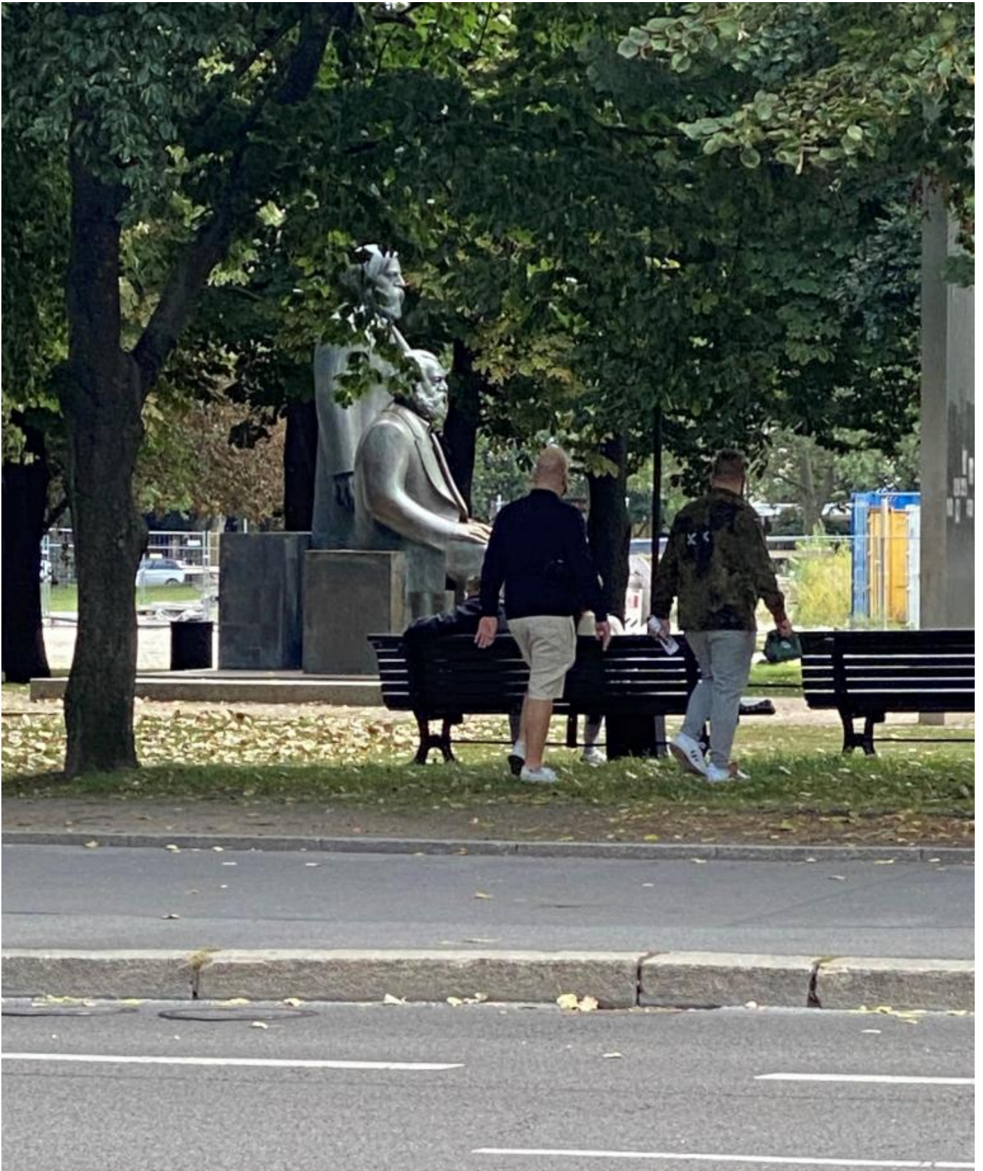
Le statue di Marx e Engels.

Dal 2013 Berlino offre anche una piÃ¹ ridotta ma assai piÃ¹ apprezzabile esposizione permanente dedicata alla vita quotidiana nella DDR ( Alltag in der DDR ), organizzata dalla Stiftung Haus der Geschichte der Bundesrepublik Deutschland (Fondazione Casa della Storia della Repubblica Federale Tedesca), ospitata