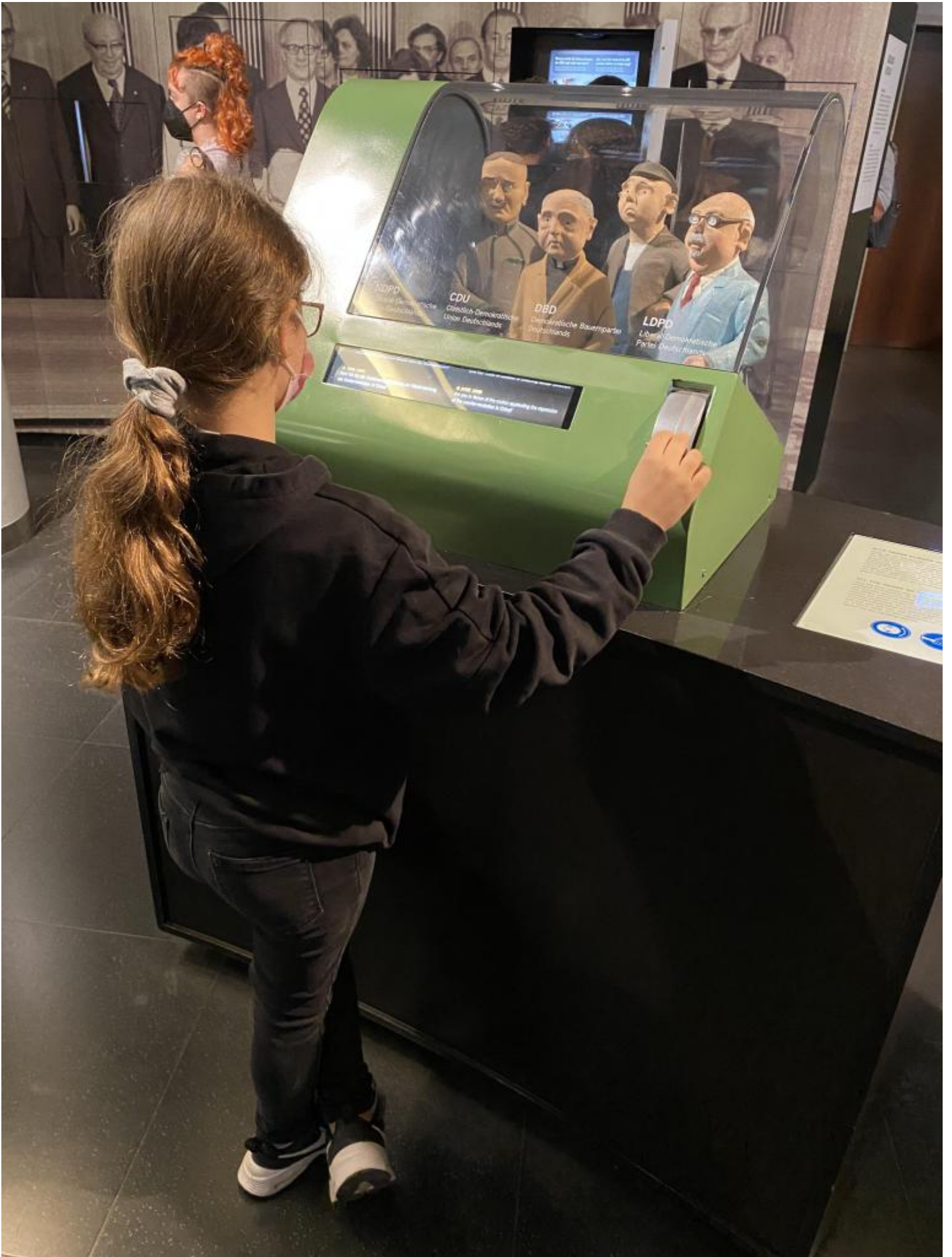
Una bambina aziona il meccanismo che fa votare all'unanimità i delegati politici.