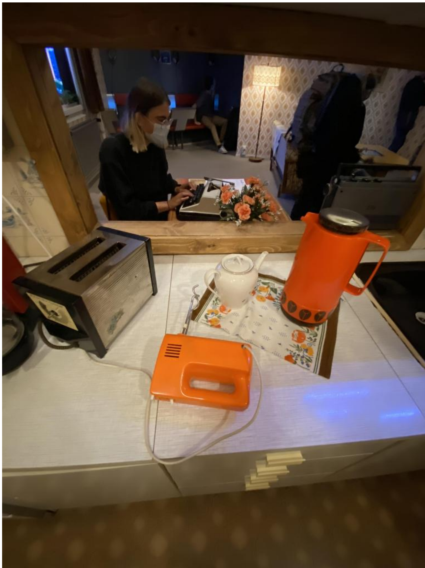
Una ragazza si cimenta su una macchina per scrivere al di là della finestrella di una cucina con elettrodomestici d'epoca.