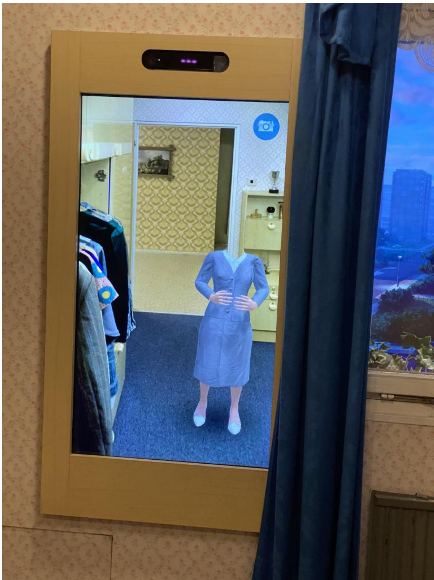
Il manichino senza testa nello specchio per i selfie.