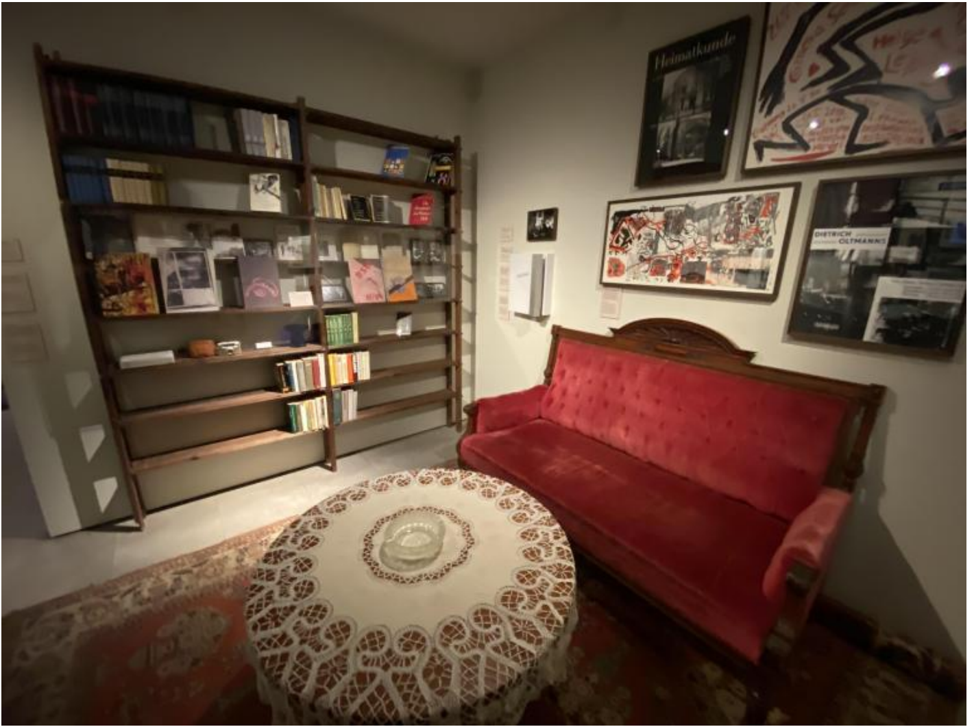
La ricostruzione di un salotto domestico.

il terrazzino della dacia, modesto ed essenziale, evoca serene giornate di relax (corredate da filmini in super 8),