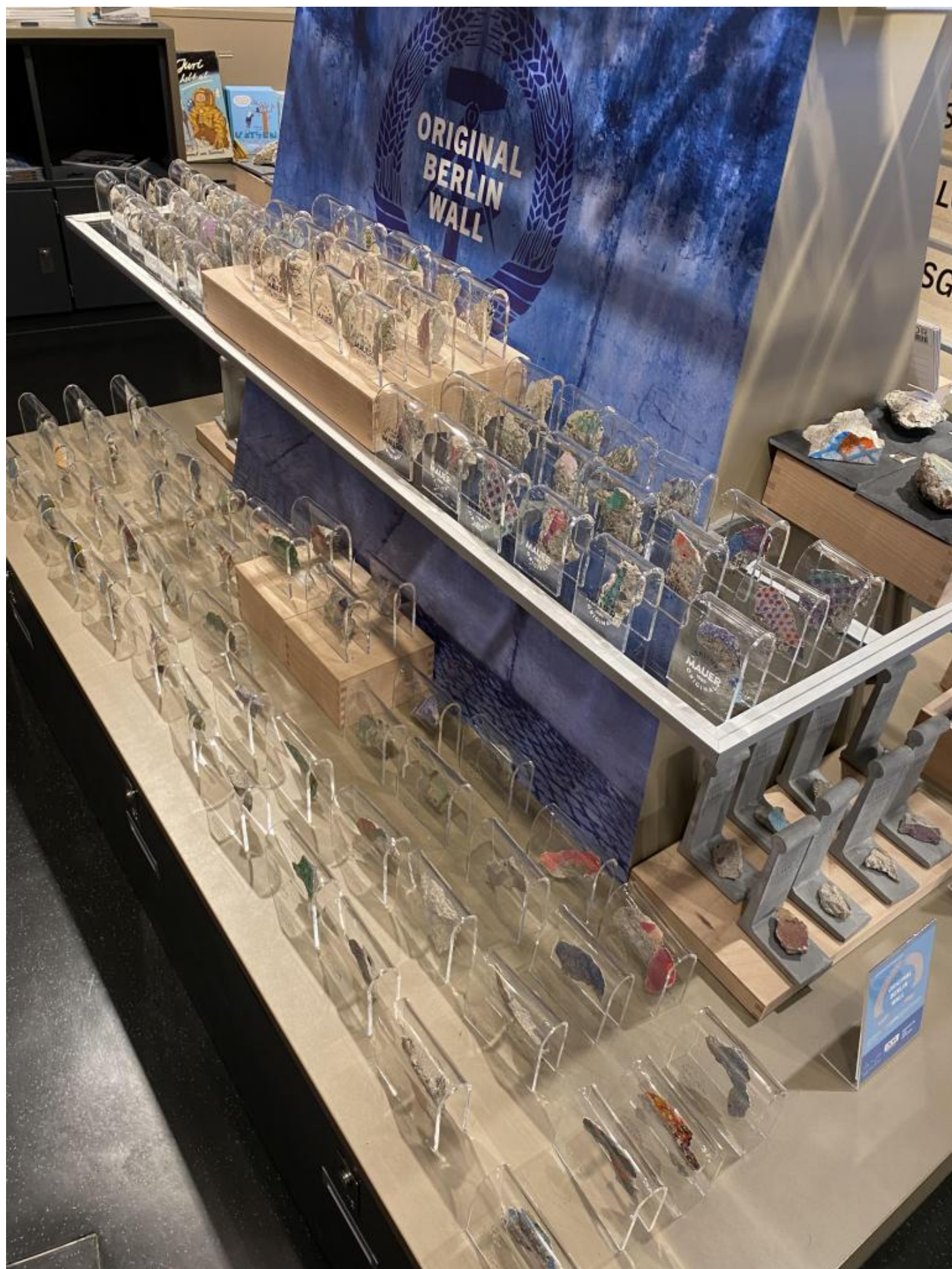
Frammenti di Muro.