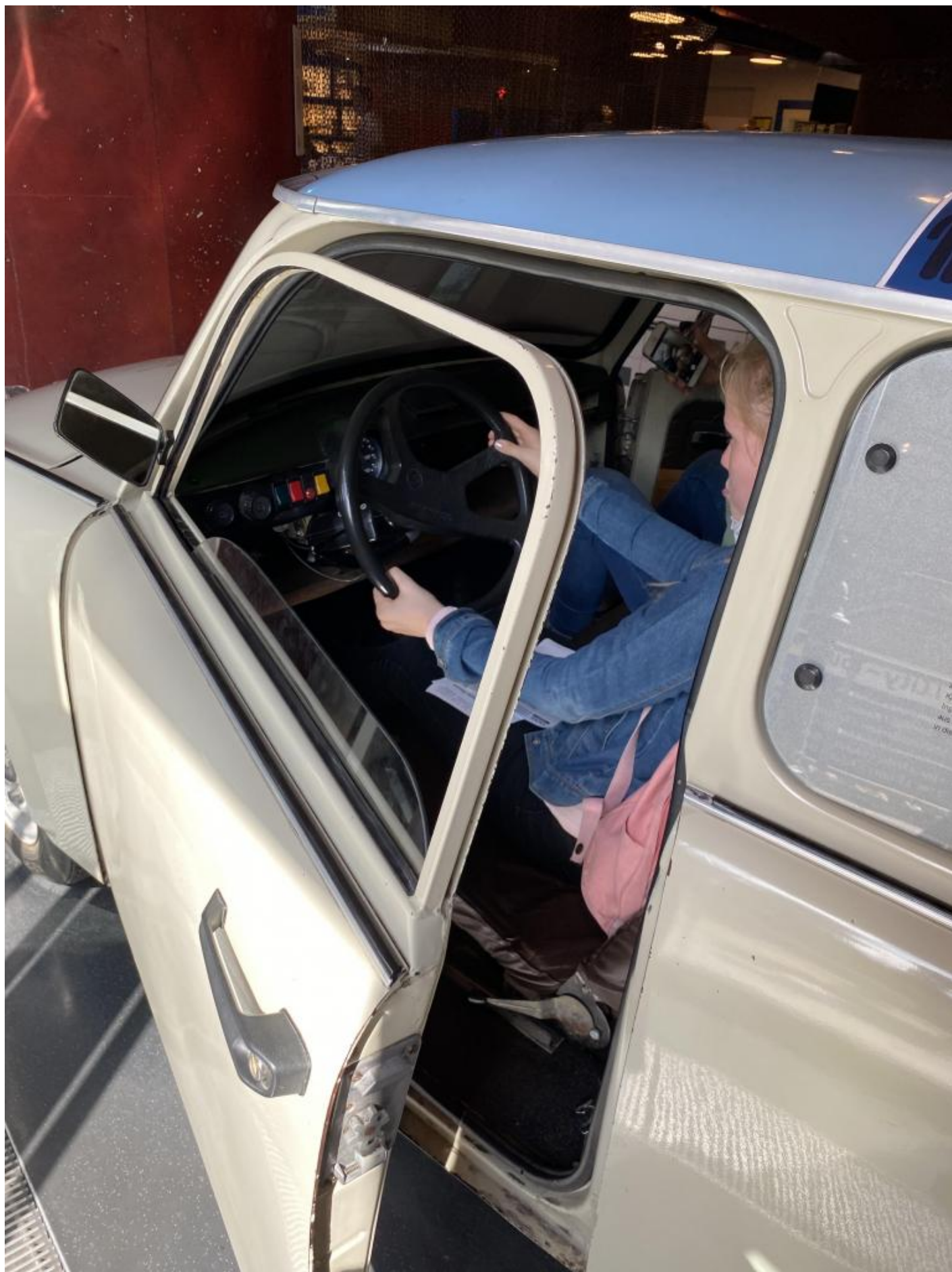
A bordo della Trabi.