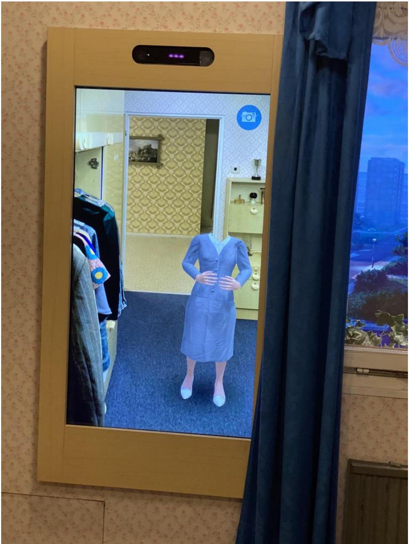
Il manichino senza testa nello specchio per i selfie.