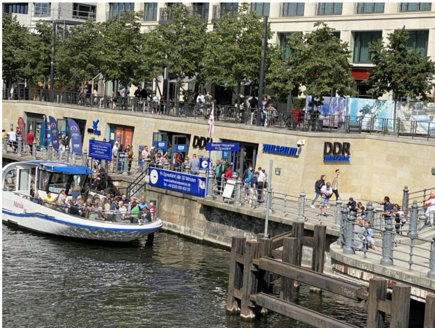
L'ingresso al DDR Museum di Berlino.

Possiede una collezione di 300.000 artefatti , 13.000 già digitalizzati, sotto la cura del dott. Wolle, responsabile anche dei volumi, per ora tre, che propongono la storia della DDR attraverso gli oggetti (100 euro l'uno). Imposta la promozione sulla totale interattività dei suoi reperti: i visitatori possono (anzi devono) toccare le cose, aprire cassette e armadi, addirittura indossare abiti e giocare con gli oggetti.