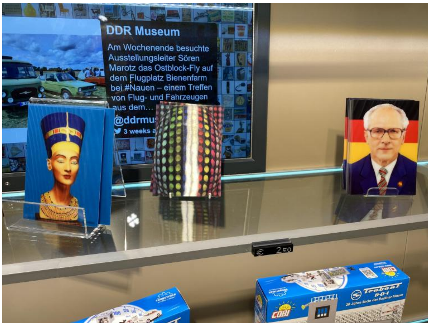
Nefertiti, Honecker e riproduzioni della Trabant.

Uscendo da questo caotico assemblaggio di pseudo-emozioni, e risalendo le scale per guadagnare Karl-Liebknecht-Straße, al di là della strada fra gli alberi, si scorgono le sagome di Marx ed Engels con lo sguardo più fisso che mai puntato oggi sull'Humboldt Forum, la parte moderna del Castello prussiano recentemente ricostruito.