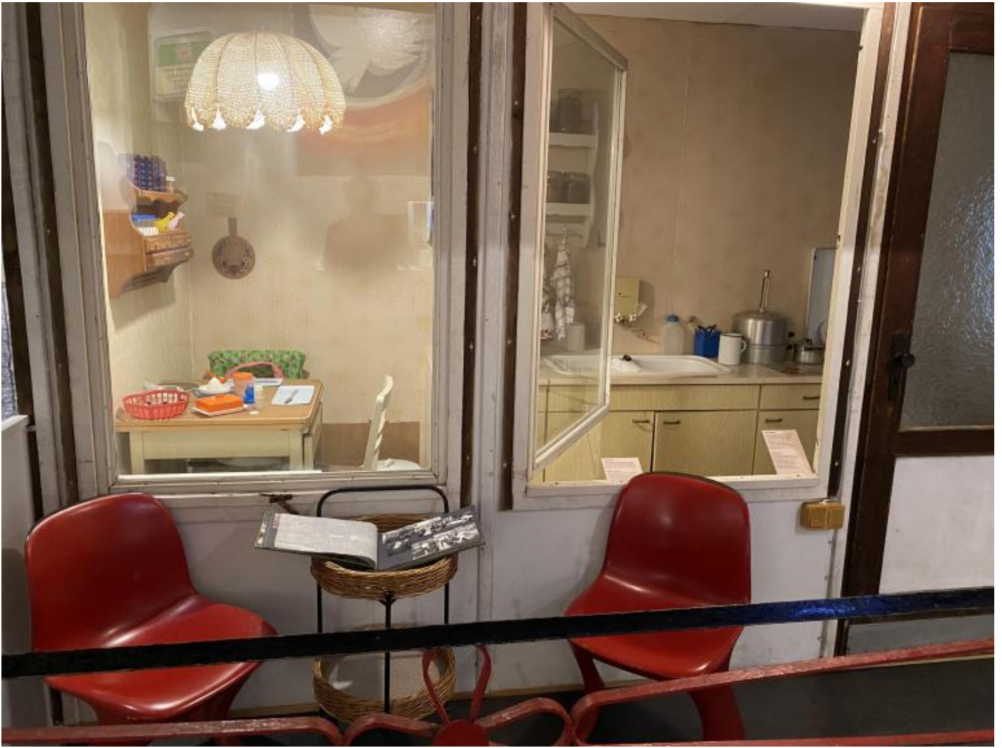
La dacia nella ricostruzione del museo.

la Kneipe (osteria-birreria), con menu autentici dell'epoca sul tavolino, testimonia di una vita sociale non necessariamente inficiata in ogni sua manifestazione del peso politico.