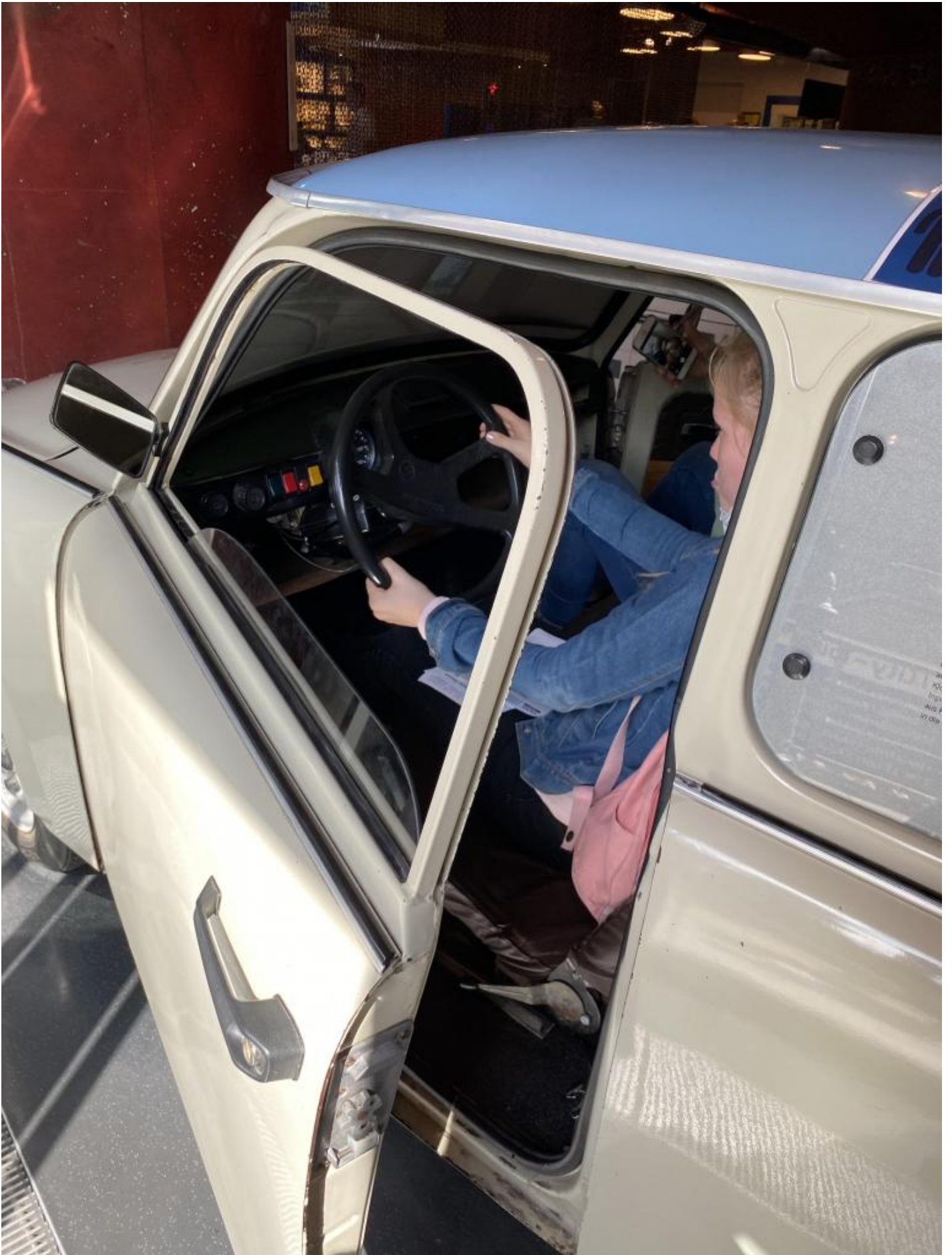
A bordo della Trabi.