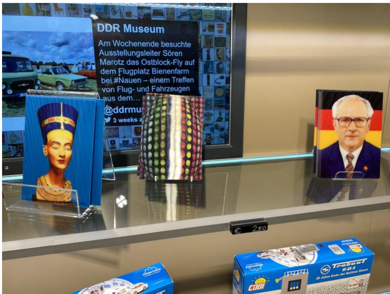
Nefertiti, Honecker e riproduzioni della Trabant.

Uscendo da questo caotico assemblaggio di pseudo-emozioni, e risalendo le scale per guadagnare Karl-Liebknecht-Straße, al di là della strada fra gli alberi, si scorgono le sagome di Marx ed Engels con lo sguardo più fisso che mai puntato oggi sull'Humboldt Forum, la parte moderna del Castello prussiano recentemente ricostruito.