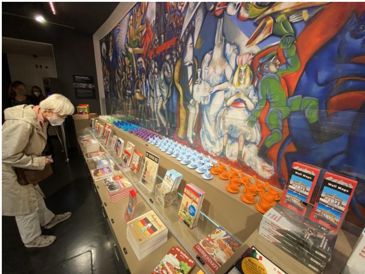
Portauovo DDR e murales.

L'aspetto commerciale trova il suo compimento orgiastico nel grande spazio souvenir. Sullo sfondo del grande murales di Ronald Paris, Elogio del comunismo , che troneggiava originariamente sulla gigantesca Casa della statistica a ridosso di Alexanderplatz, sfilano decine di porta uovo, altrettanti pezzi di muro con certificato di garanzia, gadget di ogni genere e grado fino a fotografie tridimensionali di Honecker e, per non farsi mancare nulla, Nefertiti (siamo a Berlino, o no?).