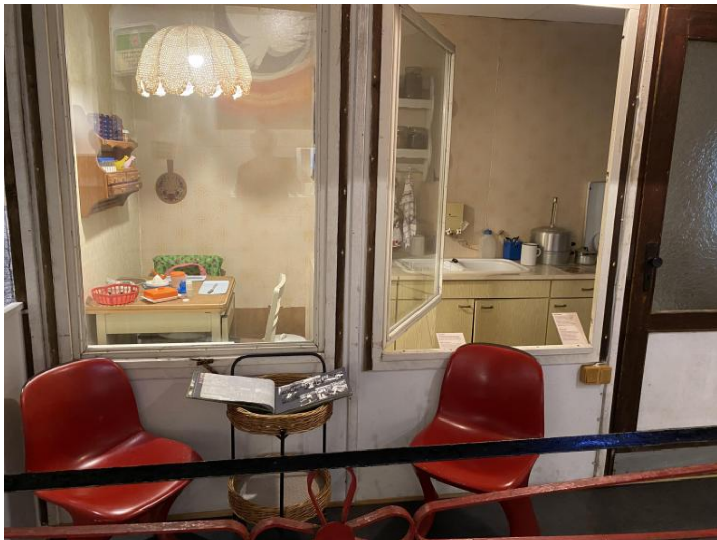
La dacia nella ricostruzione del museo.

la Kneipe (osteria-birreria), con menu autentici dell'epoca sul tavolino, testimonia di una vita sociale non necessariamente inficiata in ogni sua manifestazione del peso politico.