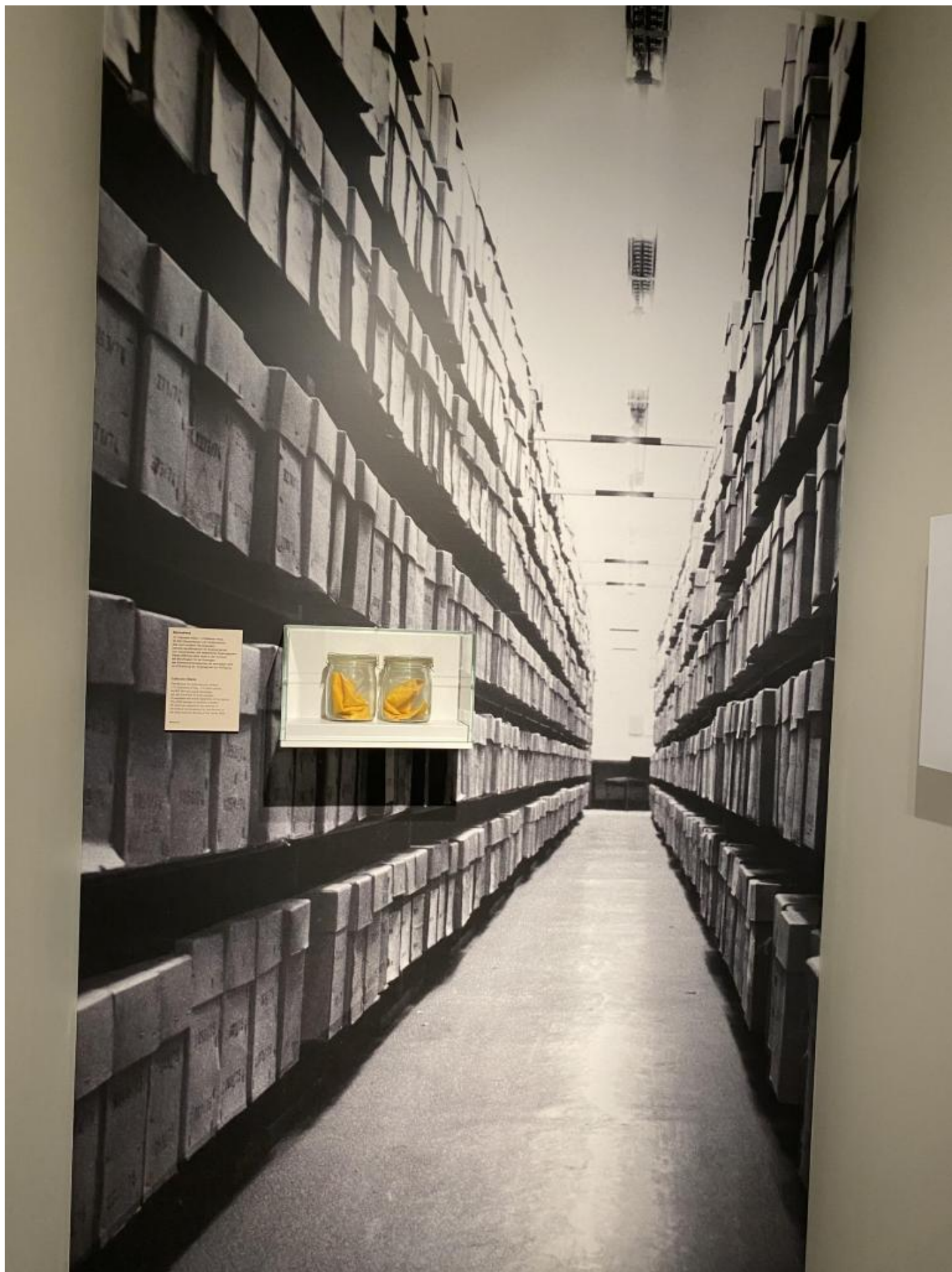
Gli archivi della STASI.