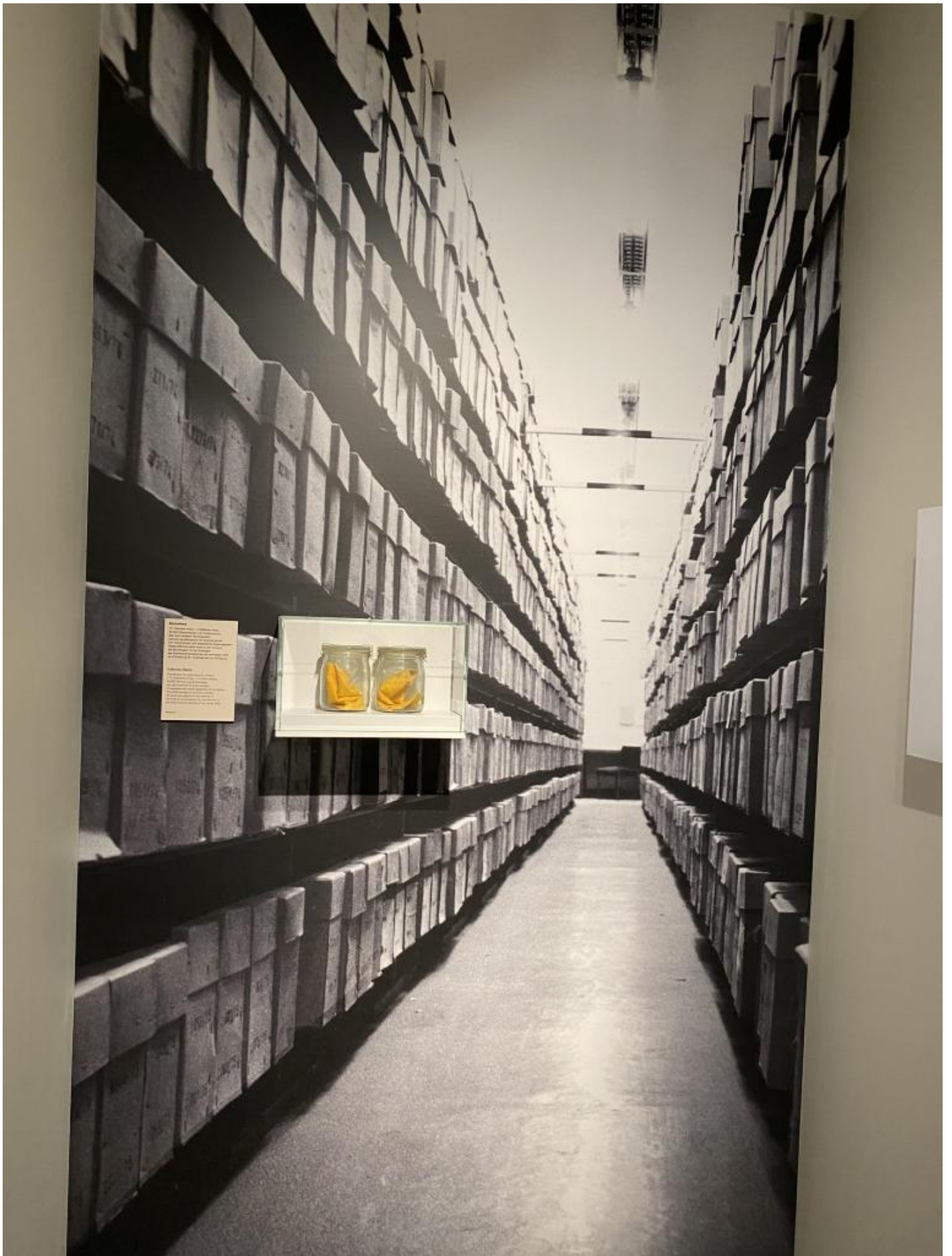
Gli archivi della STASI.