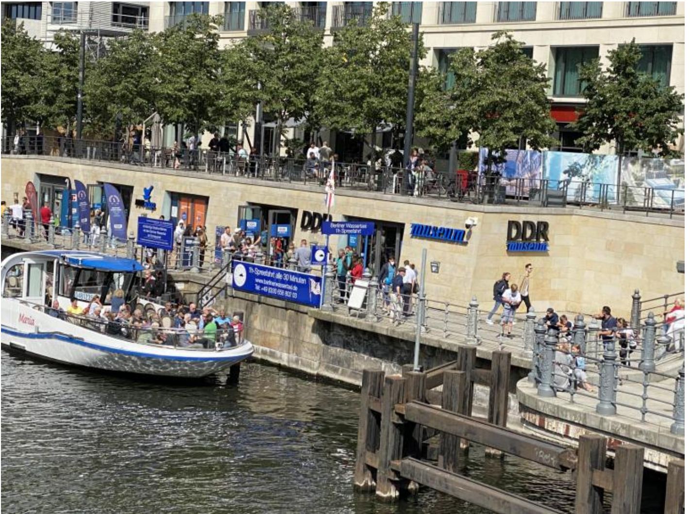
L'ingresso al DDR Museum di Berlino.