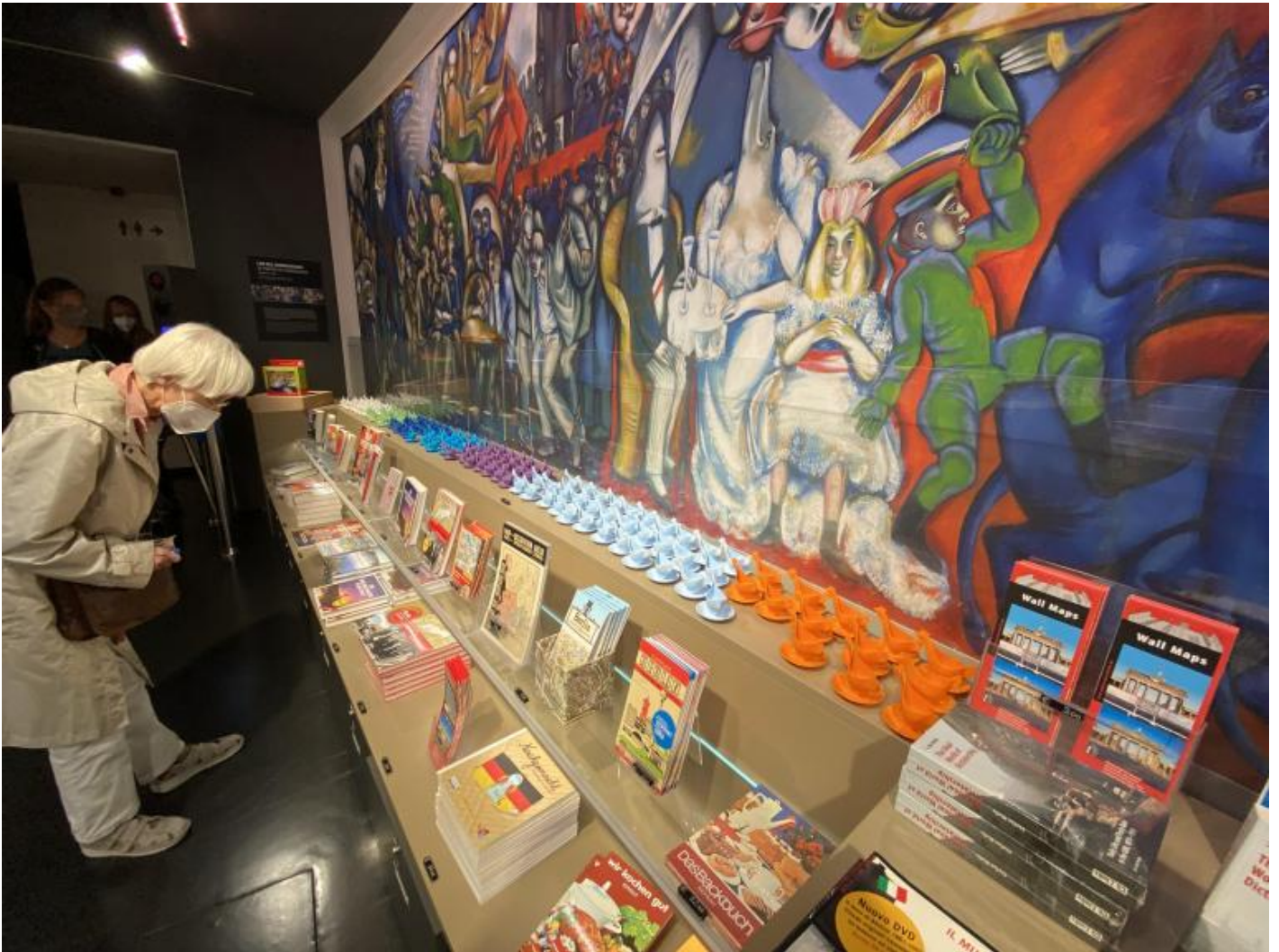
Portauovo DDR e murales.

L'aspetto commerciale trova il suo compimento orgiastico nel grande spazio souvenir. Sullo sfondo del grande murales di Ronald Paris, Elogio del comunismo , che troneggiava originariamente sulla gigantesca Casa della statistica a ridosso di Alexanderplatz, sfilano decine di porta uovo, altrettanti pezzi di muro con certificato di garanzia, gadget di ogni genere e grado fino a fotografie tridimensionali di Honecker e, per non farsi mancare nulla, Nefertiti (siamo a Berlino, o no?).