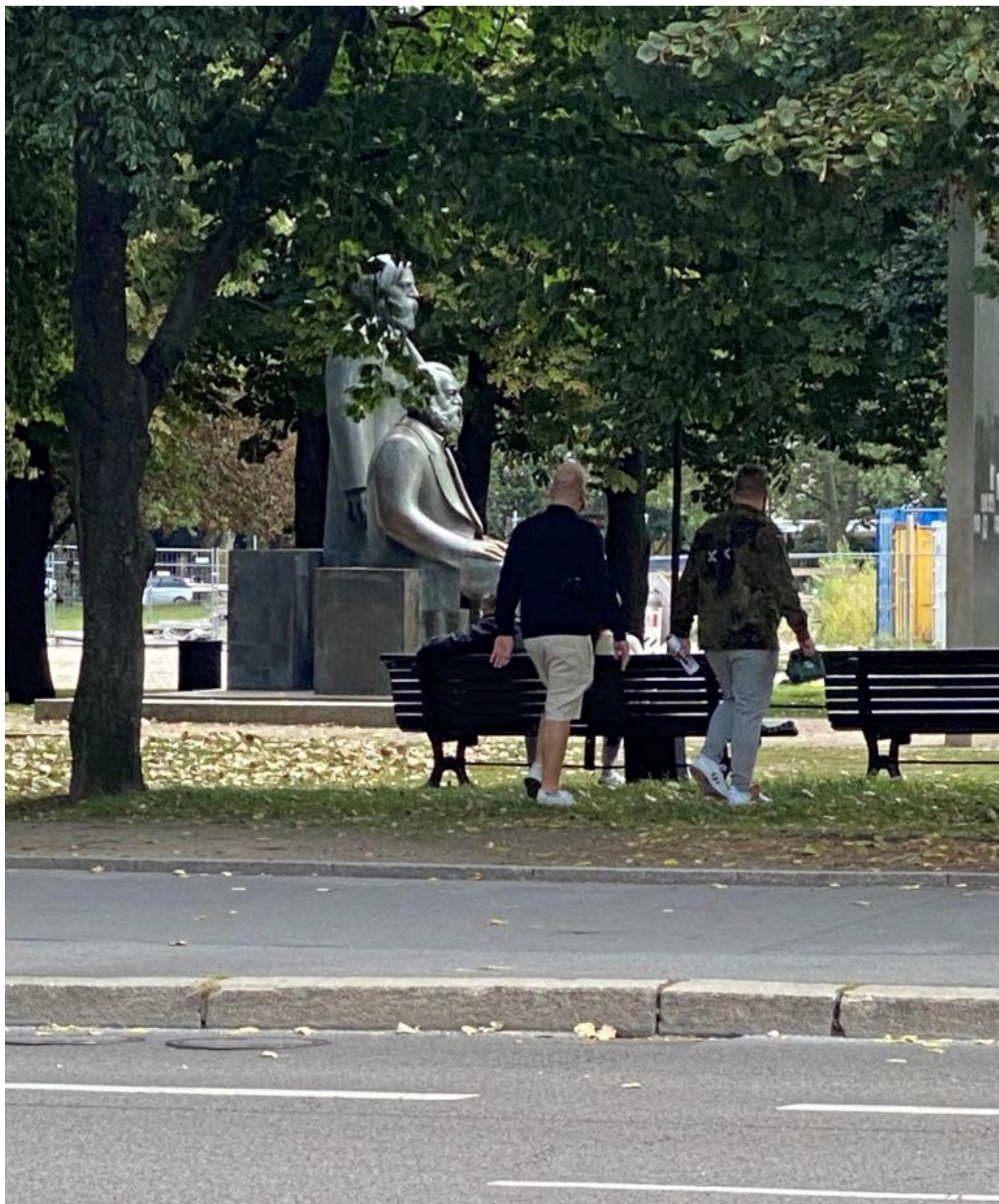
Le statue di Marx e Engels.

Dal 2013 Berlino offre anche una più ridotta ma assai più apprezzabile esposizione permanente dedicata alla vita quotidiana nella DDR ( Alltag in der DDR ), organizzata dalla Stiftung Haus der Geschichte der Bundesrepublik Deutschland (Fondazione Casa della Storia della Repubblica Federale Tedesca), ospitata