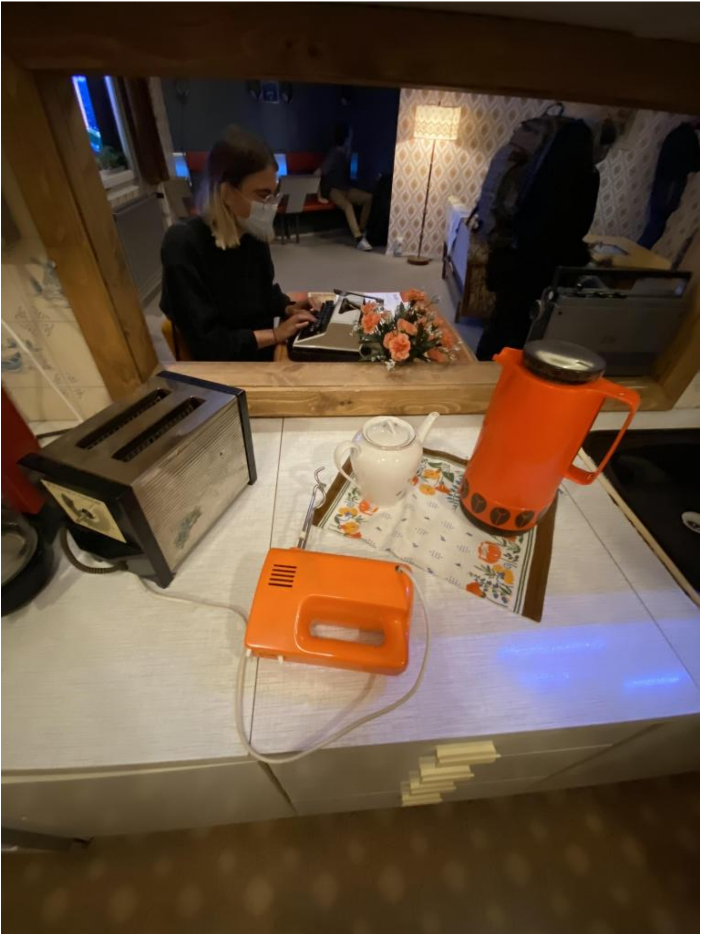
Una ragazza si cimenta su una macchina per scrivere al di là della finestra di una cucina con elettrodomestici d'epoca.