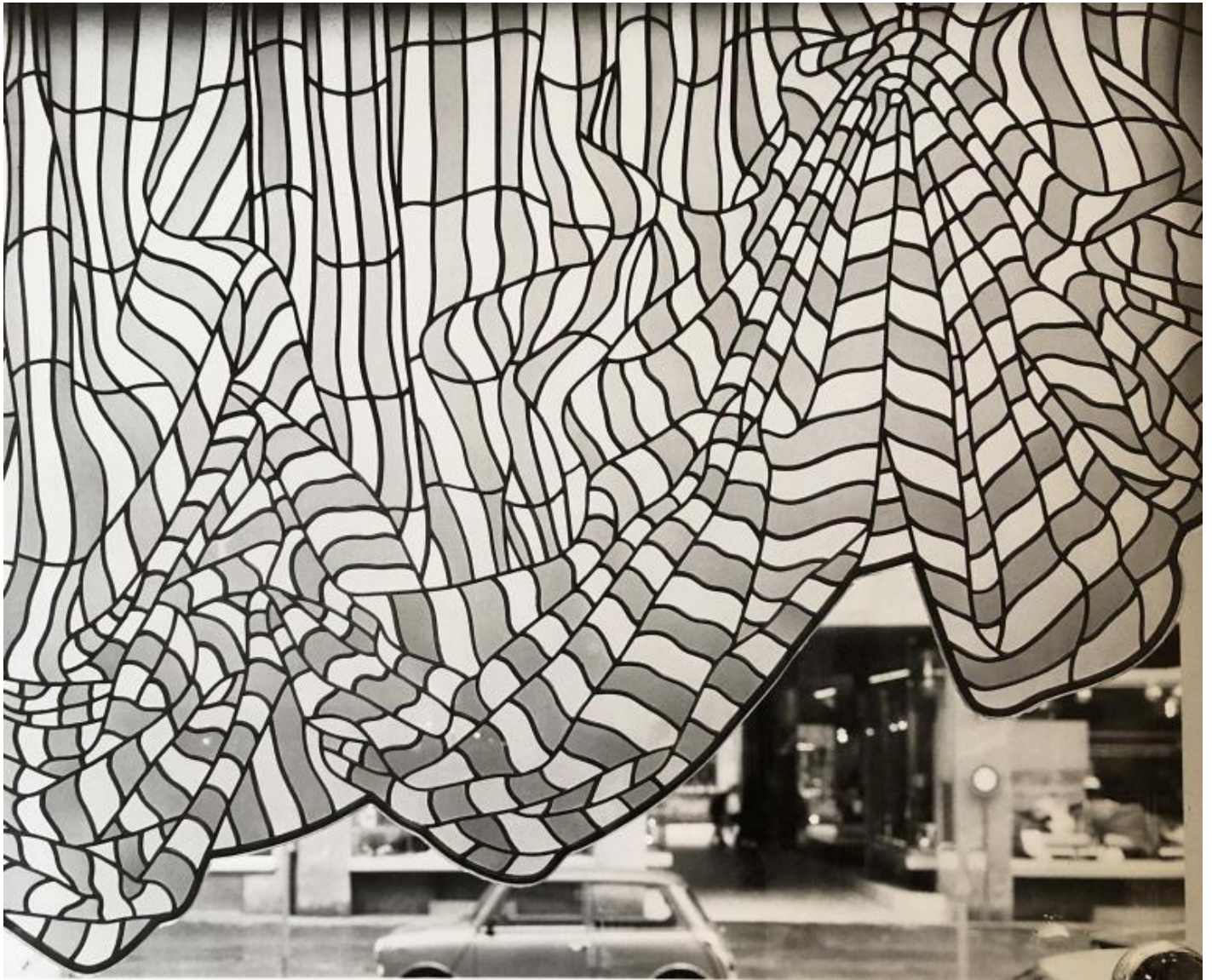
Boutique Lanvin a Zurigo, foto di Albert Habl \tilde{\text{A}} 1/4 tzetl.

Ma dall'altro lato \tilde{\text{A}} evidente che i temi dello svelare e del celare, dell'illusione ottica, dell'anamorfismo, delle illusioni prospettiche, del labirinto, persino del mostruoso, gravitano potentemente tra i loro interessi.