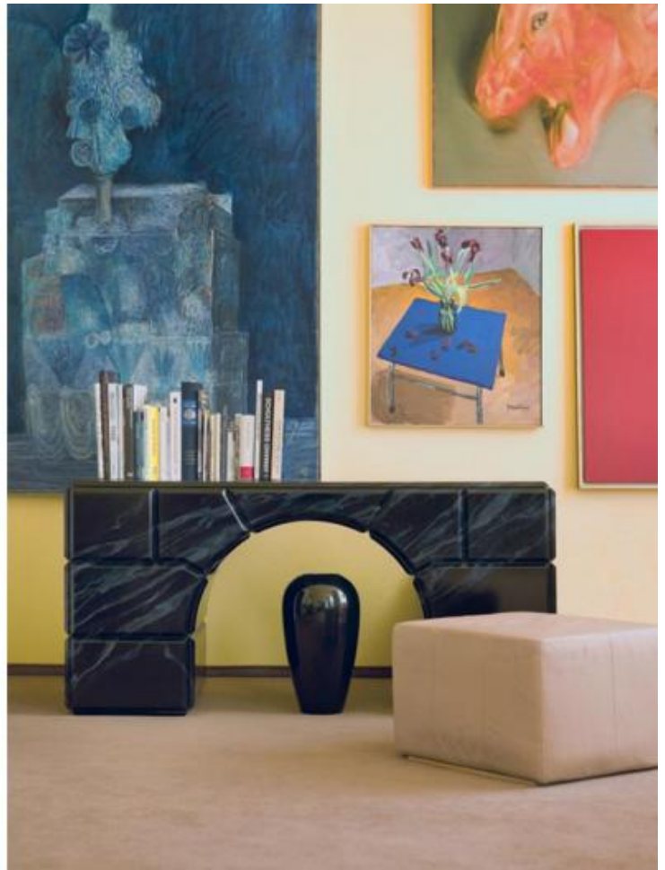
Casa Haussmann, foto di Lukas Wassmann.

Questa re-interpretazione di elementi del passato in chiave postmoderna, dove illusione sostituisce imitazione e grandissima importanza viene data ai materiali, ai particolari costruttivi, agli accostamenti, si presta a molte letture. Robert Haussmann nel testo che accompagna la mostra e ne inventa il titolo, afferma l'importanza della tecnica artigianale come parte fondante del lavoro dello studio. È noto infatti che la successiva collaborazione italiana con Alessandro Guerriero e il gruppo Alchimia, pur cementata da una profonda ammirazione reciproca e da una forte amicizia, sia naufragata per la mancanza di precisione nell'esecuzione delle loro opere, aspetto sul quale gli Haussmann fondavano il proprio linguaggio, mai esclusivamente formalista. Il testo si conclude con un appello in favore dell'istituzione di un WWF di quelle tecniche