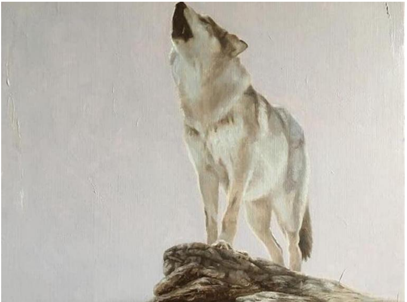
Marco Bettio, Ciò che non siamo ci identifica e ci svela , 2017, Olio su lino, 30x40cm.

L'elemento decisivo di questa teoria è la ri-creazione del cane come figura dependente: tramutato in servitore o parassita, il cane è una creatura maledetta perché ha perverso la propria natura. Teoria perlomeno riduttiva (anche se è servita spesso a giustificare molti abusi umani sui cani), poiché sottovaluta che abitare un mondo plasmato dagli uomini richiede creatività, intelligenza e generosità anche da parte dei cani, per molti aspetti indubbiamente dipendenti dagli uomini per il nutrimento o come animali domestici o da lavoro. Senza dimenticare che il vantaggio della convivenza è reciproco, data l'estrema disponibilità dei cani a mettersi al nostro servizio in mille modi, a partire dal ruolo storico di agenti di contenimento o di conversione del cibo, chiamati a consumare quanto prodotto in eccesso durante i mesi di abbondanza e diventando essi stessi cibo in quello di penuria (i cani sono stati e sono mangiati da culture diffuse in ogni punto del pianeta anche se o di conseguenza la cinofagia è stata usata come strumento di discriminazione).