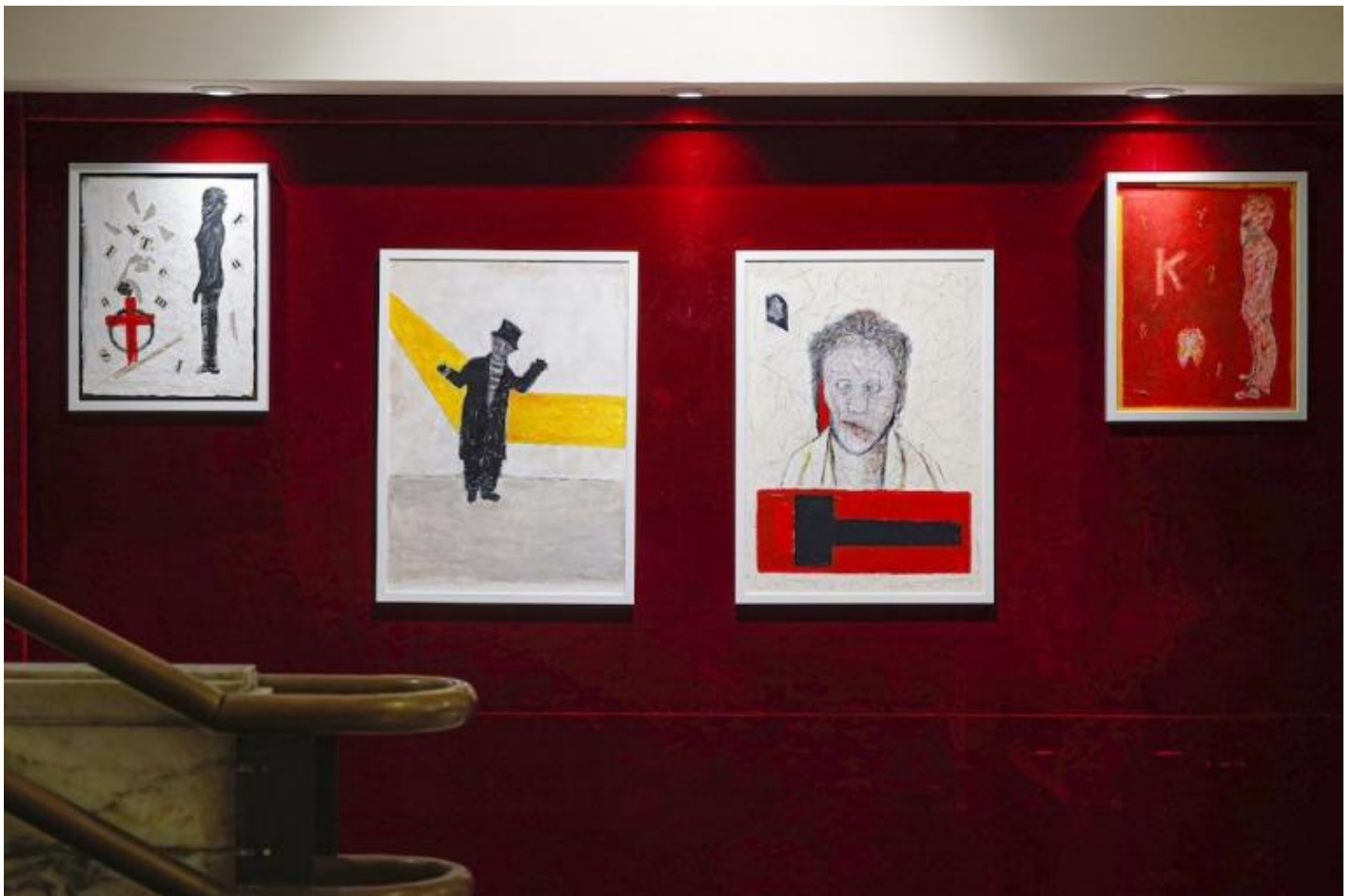
BECKETT.T tra ombre e silenzi, mostra a cura di Tonino Taiuti allestita nel foyer del Ridotto del Mercadante.

Allo spettacolo si accompagna una mostra, BECKETT.T tra ombre e silenzi , allestita nel foyer del teatro a opera di Taiuti stesso, da sempre appassionato di pittura e arti figurative, un altro punto in comune con Beckett, insieme alla passione per la musica. E quindi anche attraverso questo mezzo, e già dal titolo, l'artista segnala il suo riconoscimento nell'autore irlandese, producendo feticci: rappresentazioni di Beckett, la cui sagoma stilizzata ritorna più e più volte accompagnata da croci - la T di Taiuti (in napoletano, il ta'nto - la cassa da morto); personaggi senza volto e dallo sguardo vitreo in attesa di essere portati sulla scena, libri in cui compaiono quasi ossessivamente le parole - Beckett, Krapp e la sigla T.T., e memorabilia dello spettacolo, tutti marmorizzati - dallo sguardo di medusa dell'artista stesso, dalle note sul programma di sala di Gabriele Frasca, peraltro autore della recente traduzione utilizzata da Taiuti per il suo primo testa a testa con Beckett.