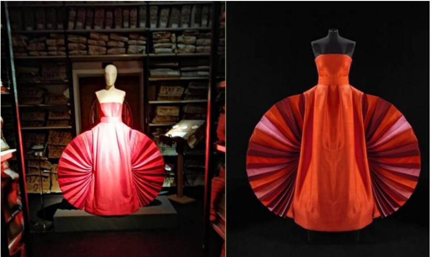
Roberto Capucci, abito-scultura a ventaglio, 1980.

Roberto Capucci si arrabbia se lo si chiama stilista, e non gli piace neppure il termine couturier. Lui preferisce dirsi sarto. Tutt'al pi 1 artista. Ecco, s 1 , sarto-artista 1 la definizione che lo connota nel modo pi 1 appropriato, poich 1 dell'uno e dell'altro egli ha la natura e il talento, ma, soprattutto, ne possiede le capacit 1 tecniche e il prorompente estro creativo.