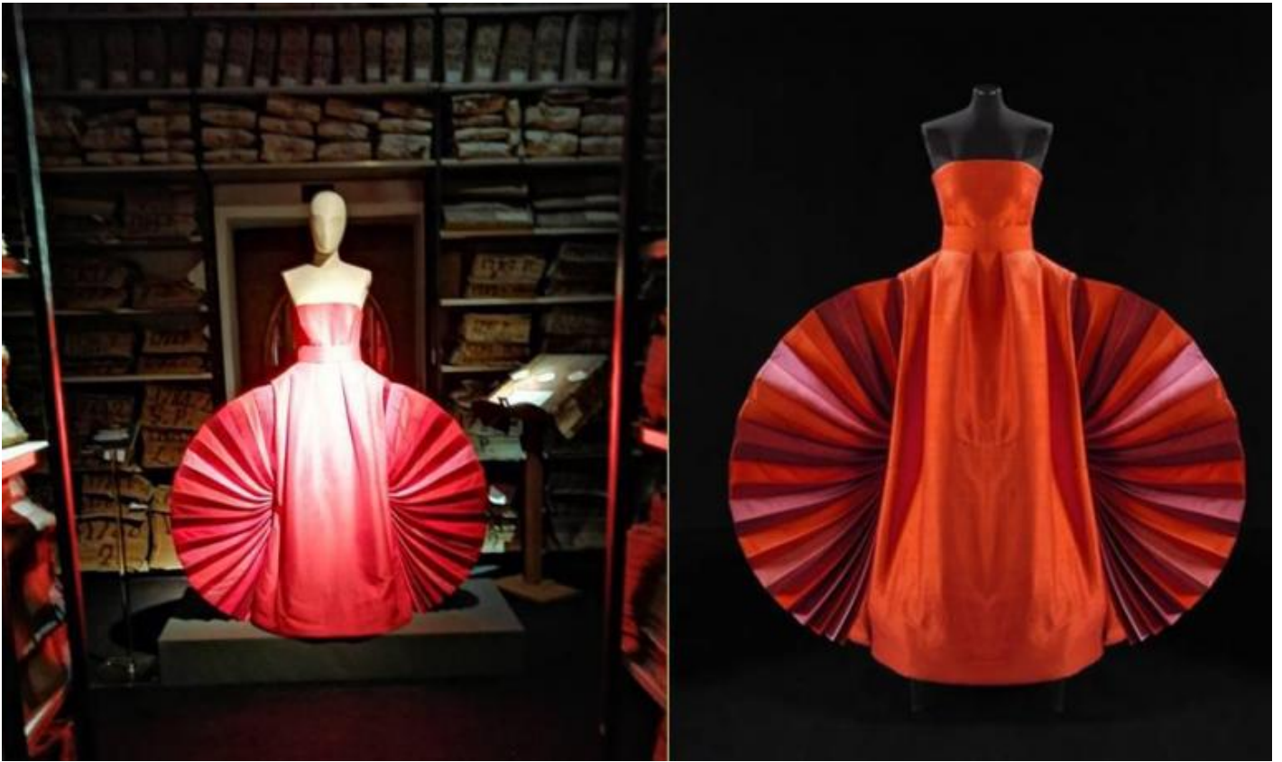
Roberto Capucci, abito-scultura a ventaglio, 1980.

Roberto Capucci si arrabbia se lo si chiama stilista, e non gli piace neppure il termine couturier. Lui preferisce dirsi sarto. Tutt'al pi 1 artista. Ecco, s 1 , sarto-artista 1 la definizione che lo connota nel modo pi 1 appropriato, poich 1 dell'uno e dell'altro egli ha la natura e il talento, ma, soprattutto, ne possiede le capacit 1 tecniche e il prorompente estro creativo.