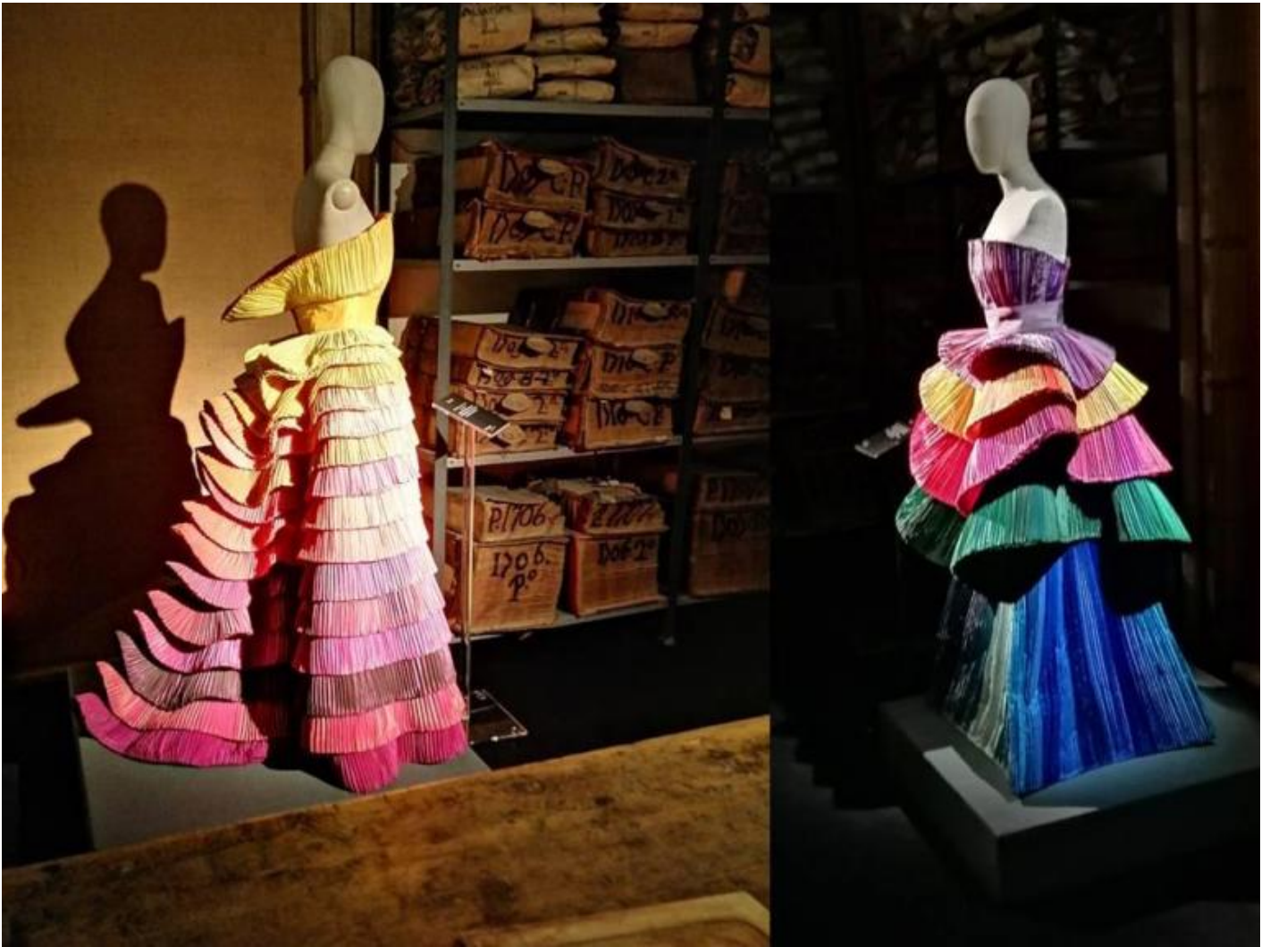
Alcuni degli abiti-scultura di Roberto Capucci, ricchi di pieghe, esposti nella mostra Pagine di seta. In alto a sinistra, L'angelo d'Oro, uno dei suoi capolavori, un trionfo di plissé, lamé, seta e taffetà, realizzato nel 1987. (ph. MLG).

Il suo amore per l'opulenza e la complicata sinuosità delle forme che crea, fanno sì che il linguaggio artistico di Roberto Capucci sia affine a quello barocco, soprattutto lo è per la sua predilezione per la piega.