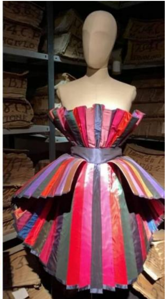
Un disegno di progetto di Roberto Capucci, con i sillabi degli accostamenti cromatici. L'abito realizzato in taffetà con intarsi policromi.