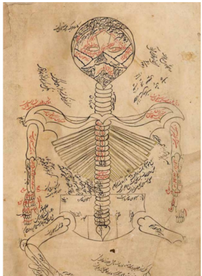
Le due raffigurazioni dello scheletro umano tratte dal Canone di Medicina di Avicenna, che aprono e chiudono Cellula .