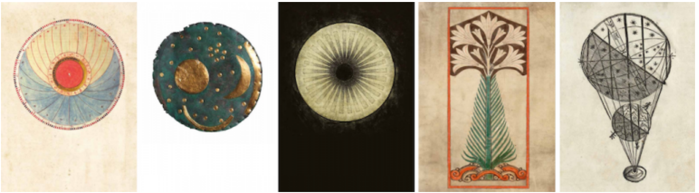
Le cinque immagini che introducono rispettivamente ciascun opus di Cellula .