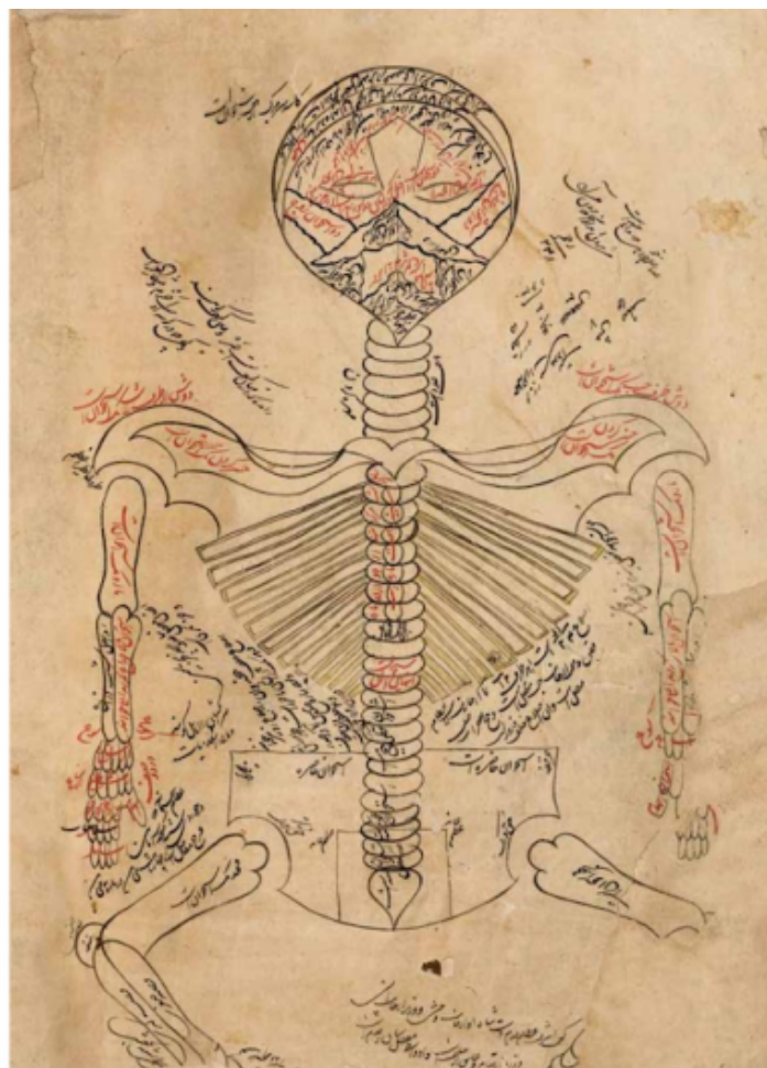
Le due raffigurazioni dello scheletro umano tratte dal Canone di Medicina di Avicenna, che aprono e chiudono Cellula.

Ma la teoria d'immagini che informano Cellula pare non accontentarsi di rintracciare la loro essenza originaria esclusivamente attraverso il pensiero che si fa parola scritta nella parallela teoria di analisi e riflessioni che Montanari e Pitozzi dispiegano lungo il volume. Sembra, infatti, manifestarsi la necessità che esse scoprano una propria ulteriore origine in altre 'sopravvivenze' e in altri Leitfossil che le pongano in risonanza con un'archeologia delle immagini capaci di istituire anch'esse uno speculare legame tra cellula e mondo. Così, al pari del cosmo immerso nel bianco della copertina, anche tutte le altre immagini che – carpite alla storia della raffigurazione in un arco che va dall'età del bronzo fino al XVII secolo – fanno da incipit visuale a ciascun opus , si pongono come condensazioni ideali delle linee e delle questioni che quest'ultimo racchiude. Rappresentando al contempo la forza centrifuga capace, al pari delle parole di Pitozzi e Montanari, di proiettare le fotografie che compongono il libro fuori dalla loro dimensione contingentemente teatrale e legarle a un altrove spaziale e temporale che esse non smettono di invocare.