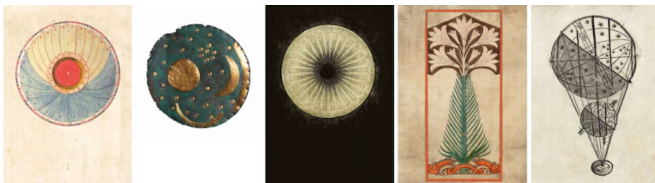
Le cinque immagini che introducono rispettivamente ciascun opus di Cellula.

Ciascuna sezione del libro – che corrisponde a ciascuna direttrice – è presentata come opus , opera. Termine musicale, religioso e architettonico insieme. Ed è proprio una sorta di avanzamento musicale attraverso un ritmo che è architettura in certo modo sacra, che il volume ci conduce da Opus I. Del diafano a Opus V. Dell'ordine geometrico , passando per Opus II. Della tattilità , Opus III. Chroma e Opus IV. Del vegetale . Cinque differenti 'opere' che sono, in realtà, altrettante cellule che fanno da scaturigini per i lavori teatrali del Teatro delle Albe.