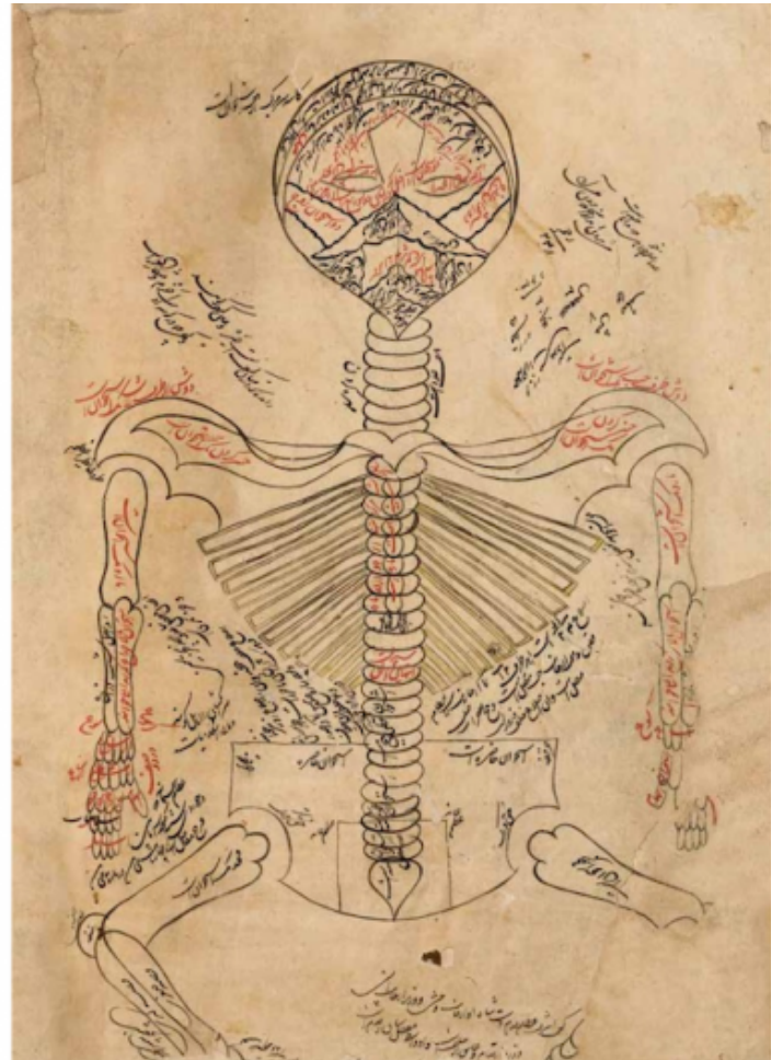
Le due raffigurazioni dello scheletro umano tratte dal Canone di Medicina di Avicenna , che aprono e chiudono Cellula .

Ma la teoria delle immagini che informano Cellula pare non accontentarsi di rintracciare la loro essenza originaria esclusivamente attraverso il pensiero che si fa parola scritta nella parallela teoria di analisi e riflessioni che Montanari e Pitozzi dispiegano lungo il volume. Sembra, infatti, manifestarsi la necessità che esse scoprano una propria ulteriore origine in altre "sopravvivenze" e in altri Leitfossil che le pongano in risonanza con un'archeologia delle immagini capaci di istituire anch'esse uno speculare legame tra cellula e mondo. Così, al pari del cosmo immerso nel bianco della copertina, anche tutte le altre immagini che "carpite alla storia della raffigurazione in un arco che va dall'età del bronzo fino al XVII secolo" fanno da incipit visuale a ciascun opus , si pongono come condensazioni ideali delle linee e delle questioni che quest'ultimo racchiude. Rappresentando al contempo la forza centrifuga capace, al pari delle parole di Pitozzi e Montanari, di proiettare le fotografie che compongono il libro fuori dalla loro dimensione contingentemente teatrale e legarle a un altrove spaziale e temporale che esse non smettono di invocare.