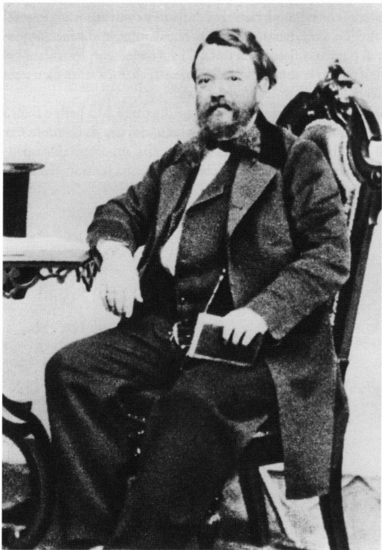
Francesco Maria Piave (1810-1876), intorno al 1860.