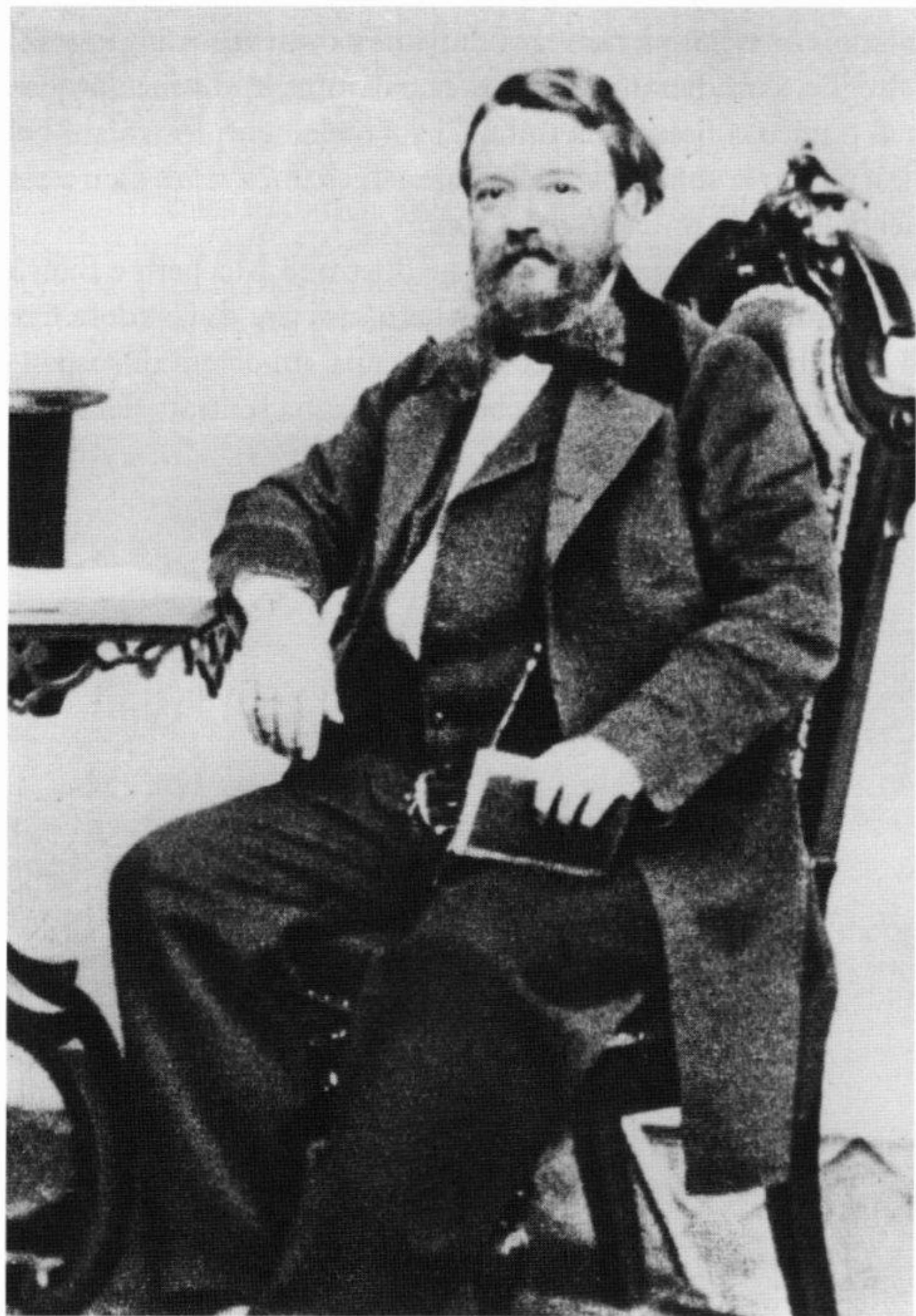
Francesco Maria Piave (1810-1876), intorno al 1860.