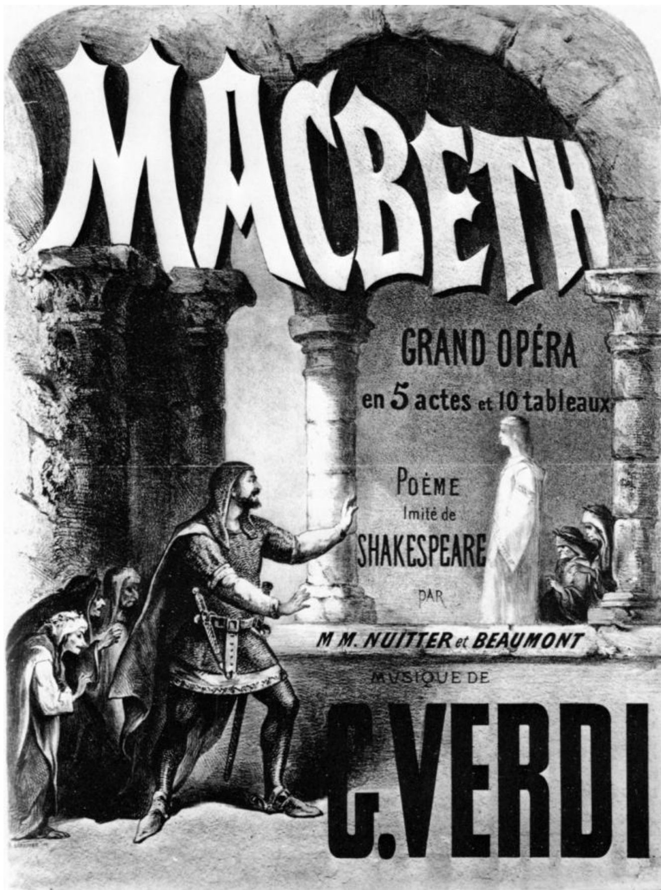
Manifesto della prima di Macbeth riformato per il Theatre Lyrique Imperial di Parigi, 1865, Parigi Bibliotheque de l'Opera.