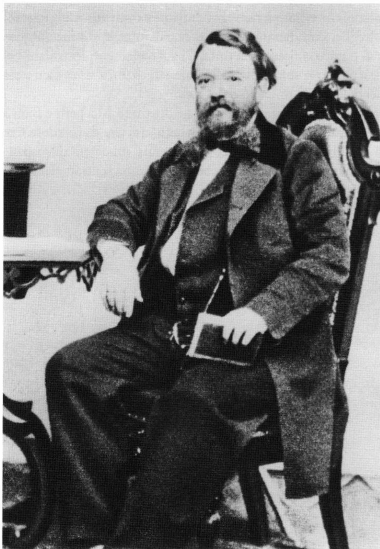
Francesco Maria Piave (1810-1876), intorno al 1860.