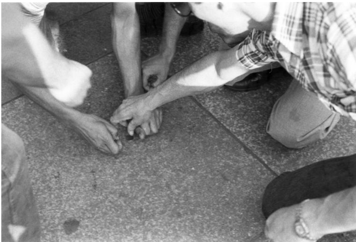
Anna Valeria Borsari, Rappresentazione, presentazione, azione, 1979 Stampe fotografiche Documentazione dell'azione realizzata a Milano in piazza del Duomo

Sempre pensate per un luogo specifico sono poi le serie di Madonne di monete e cereali , create a partire dal 1977 in varie piazze italiane (a Bologna in piazza Maggiore nel 1977; a Firenze in piazza della Signoria nel 1978; e in piazza Duomo, a Milano, nel 1979). In questo caso l'autrice fa un'operazione site-specific opposta rispetto all'abituale pratica degli artisti di strada: se il madonnaro crea la sua opera per ricevere in cambio delle monete, qui è l'artista stessa che crea con monete e chicchi di grano la sua Madonna sorridente e generosa, il tutto evitando di presentarsi come un'artista contemporanea che sta facendo una performance. Lei è "solo" una madonnara un po' strana, che invece di chiedere soldi li offre. Come i monaci tibetani creano con cura estrema meravigliosi e geometrici mandala di sabbie colorate per poi distruggerli loro stessi, in un gesto che indica la loro accettazione dell'impermanenza delle cose, così Anna Valeria Borsari realizza con pazienza e precisione le sue Madonne accettando consapevolmente il loro essere effimere. Ma la sua sembra anche una sorta di eucarestia laica e coinvolgente: conclusa l'opera, infatti, saranno i passanti a impossessarsi felicemente delle monetine e i piccioni a nutrirsi con i semi. Ultimato l'intervento (sempre documentato fotograficamente) la sua Madonna sparisce, perché si è data metaforicamente e realmente come una offerta nei confronti di tutti gli esseri viventi.