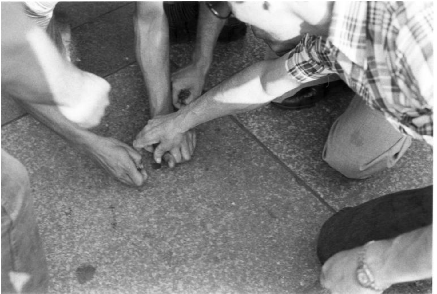
Anna Valeria Borsari, Rappresentazione, presentazione, azione, 1979 Stampe fotografiche â?ˆDocumentazione dellâ??azione realizzata a Milano in piazza del Duomoâ?ˆPh. Courtesy dellâ??artista.

Sempre pensate per un luogo specifico sono poi le serie di Madonne di monete e cereali , create a partire dal 1977 in varie piazze italiane (a Bologna in piazza Maggiore nel 1977; a Firenze in piazza della Signoria nel 1978; e in piazza Duomo, a Milano, nel 1979). In questo caso lâ??autrice fa unâ??operazione site-specific opposta rispetto allâ??abituale pratica degli artisti di strada: se il madonnaro crea la sua opera per ricevere in cambio delle monete, qui Ã? lâ??artista stessa che crea con monete e chicchi di grano la sua Madonna sorridente e generosa, il tutto evitando di presentarsi come unâ??artista contemporanea che sta facendo una performance. Lei Ã? â??soloâ?• una madonnara un poâ?? strana, che invece di chiedere soldi li offre. Come i monaci tibetani creano con cura estrema meravigliosi e geometrici mandala di sabbie colorate per poi distruggerli loro stessi, in un gesto che indica la loro accettazione dellâ??impermanenza delle cose, cosÃ¬ Anna Valeria Borsari realizza con pazienza e precisione le sue Madonne accettando consapevolmente il loro essere effimere. Ma la sua sembra anche una sorta di eucarestia laica e coinvolgente: conclusa lâ??opera, infatti, saranno i passanti a impossessarsi felicemente delle monetine e i piccioni a nutrirsi con i semi. Ultimo lâ??intervento (sempre documentato fotograficamente) la sua Madonna sparisce, perchÃ© si Ã? data metaforicamente e realmente come una offerta nei confronti di tutti gli esseri viventi.