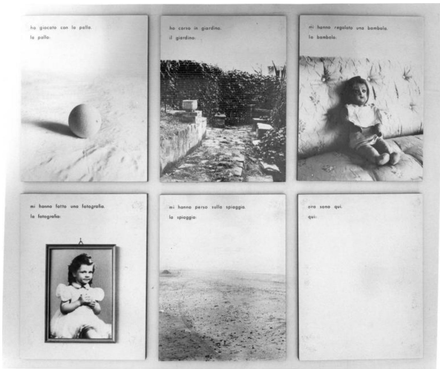
Anna Valeria Borsari, Testimonianze , 1976. Sei stampe fotografiche e lettere trasferibili Collezione privata

Faccio un esempio a partire da un suo lavoro del 1976, Testimonianze , composto da 6 immagini accompagnate da alcune frasi. Nella prima è scritto: "ho giocato con la palla. La palla", e si vede una palla; nella seconda: "ho corso in giardino. Il giardino", e l'immagine ci mostra un giardino chiuso da una fitta siepe simile a un muro verde (ma come poteva prendere slancio la sua corsa se avveniva dentro una sorta di recinto chiuso?); nella quarta immagine compare la scritta: "mi hanno fatto una fotografia. La fotografia", ed ecco un suo ritratto di bimba perbene con abito dalle maniche a sbuffo; quinta immagine: "mi hanno perso sulla spiaggia. La spiaggia", e vediamo una spiaggia talmente bianca e deserta che si perdono i confini tra spiaggia, mare e orizzonte. Come avranno fatto a perderla in un simile vuoto? L'inquietudine si infittisce osservando l'ultimo scatto: "ora sono qui. Qui". Ma in questo "qui", non c'è nessuno, non si vede nulla, anzi non c'è neppure un'immagine, solo la materia della carta fotografica lasciata intonsa.