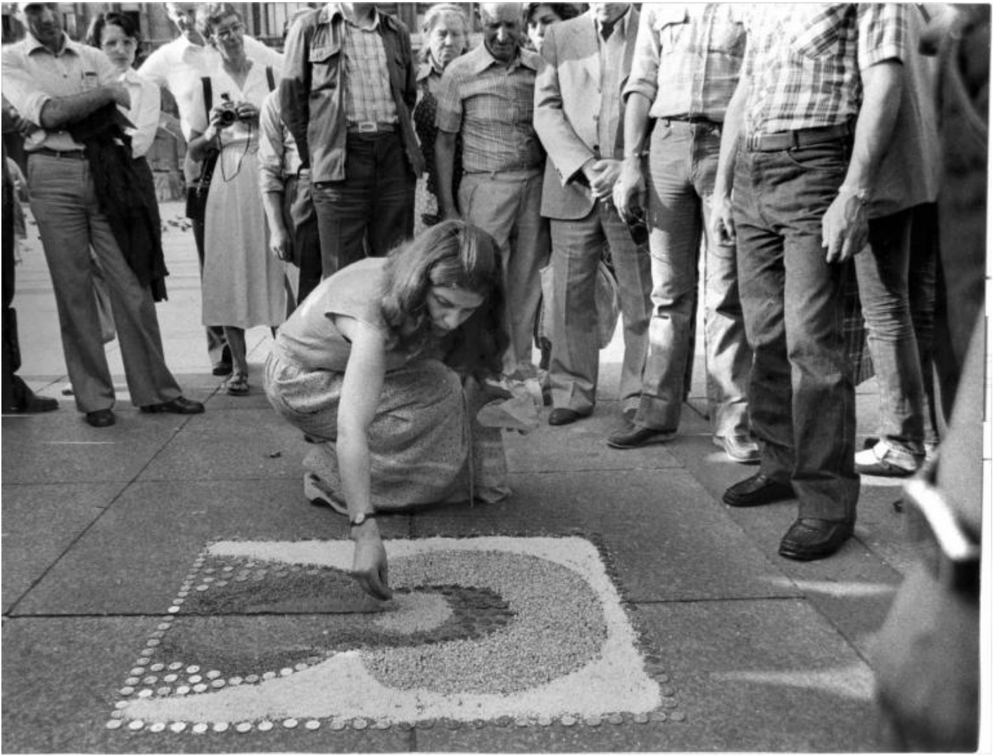
Anna Valeria Borsari, Rappresentazione, presentazione, azione, 1979 Stampe fotografiche â?Documentazione dellâ??azione realizzata a Milano in piazza del Duomoâ?