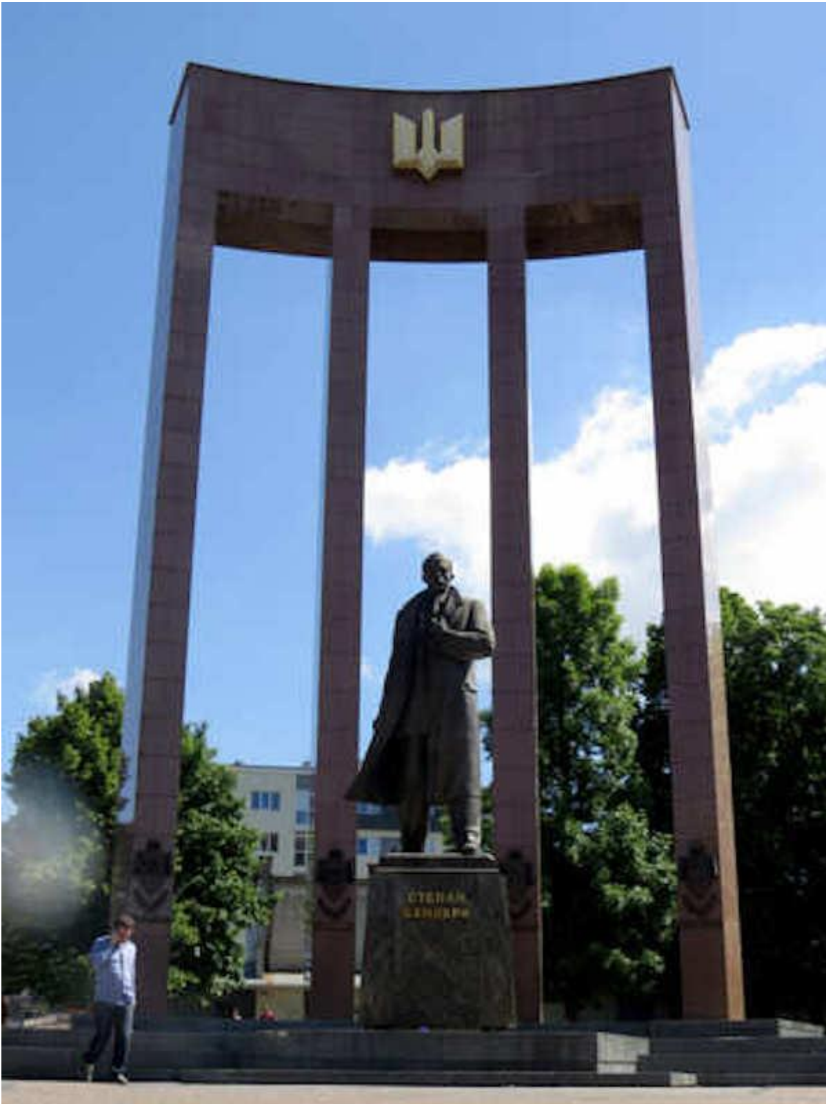
Monumento a Bandera a L'viv

D'altro canto gli ucraini detestano sempre più i russi e il loro governo. Diciamo che sempre più per i russi gli ucraini sono "fascisti", sempre più per gli ucraini i russi sono "comunisti sovietici", anche se entrambi non sono di fatto né l'uno né l'altro.