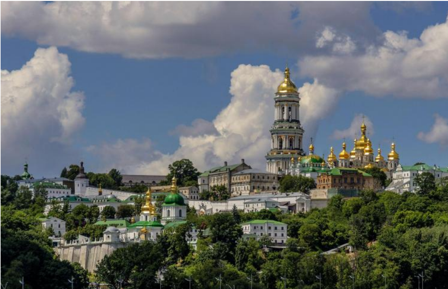
Kyivo-Pecherska Lavra a Kiev (con vista sul Dniepr)

Il vero conflitto tra i due paesi cominciò nel 2014, quando Putin decise di anettere la Crimea alla Russia. Prima a Kiev si alternavano partiti e leader pro-europei (quando un ucraino dice "Europa" intende Europa occidentale, escludendo quindi ipso facto l'Ucraina dall'Europa) e pro-russi, ma con la vittoria del filo-europeo Petro Poroshenko, Putin pensò che l'Ucraina fosse ormai "perduta", e che quindi la cosa migliore fosse annettersi le zone francamente filo-russe del paese "oltre alla Crimea, il Donbass. In realtà, separare la popolazione russa da quella ucraina "come voler separare il latte e il caffè" da un cappuccino.