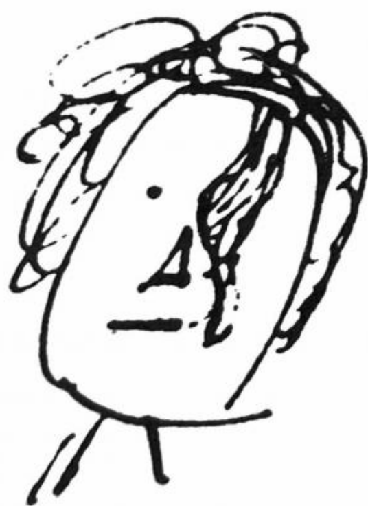
Fig 3. July 5 7