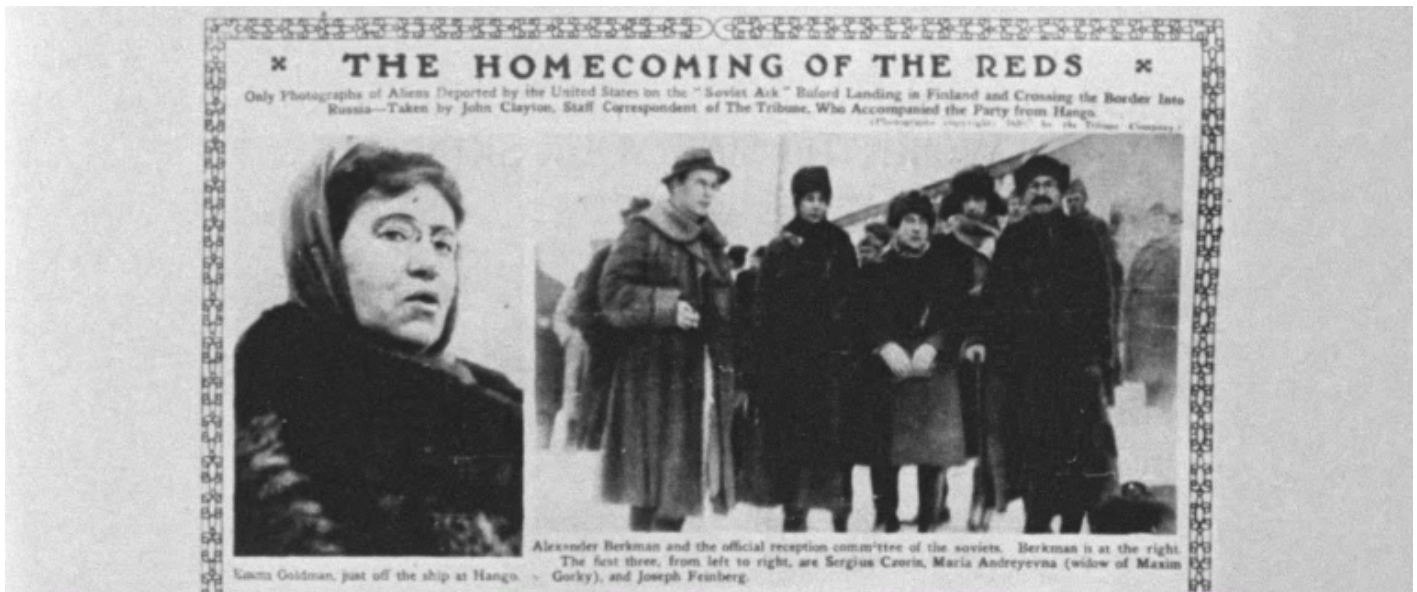
“The Homecoming of the Reds”, “Chicago Tribune”, 14 marzo 1920.

Mano a mano che ci si avvicina alla conclusione, la filologia si piega alla poesia, il saggio inclina al romanzo, pur conservando il medesimo rigore nell'uso delle fonti e dei documenti. Narratore oltre che storico, Teichner sa lasciarsi all'occorrenza guidare dalla sensibilità e dal proprio intuito di filmmaker . Nell'incedere ieratico e un po' austero di questa epica della sconfitta, si fa strada un pathos trattenuto. Impossibile, d'altra parte, ignorare la forza narrativa degli scritti di Goldman ( My Disillusionment in Russia , 1923, e l'autobiografia Living My Life , 1931-34) e di Berkman ( The Bolshevik Myth , 1925), la loro irriverenza, la loro profonda autoironia, il loro senso drammaturgico: non a caso, fra le carte inedite di Berkman, depositate presso l'International Institute of Social History di Amsterdam, Teichner ha ritrovato alcuni soggetti cinematografici inviati – senza successo – agli Studios hollywoodiani.