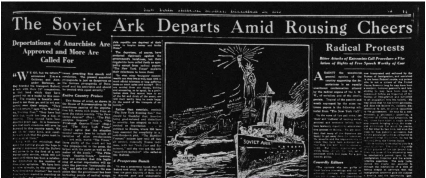
Pagina del New York Tribune , domenica 23 dicembre 1919.

L'azione piÃ¹ spettacolare viene attuata negli ultimi mesi del 1919. Forte della recente approvazione di due nuove leggi assai discusse, l' Espionage Act e l' Immigration Act , il Dipartimento di Giustizia decreta che 249 persone, considerate a vario titolo indesiderabili , vengano espulse dal Paese e deportate verso la Russia sovietica a bordo della Buford, che si guadagna per questa ragione il soprannome giornalistico di Soviet Ark (Arca sovietica) e di Red Ark (Arca rossa).