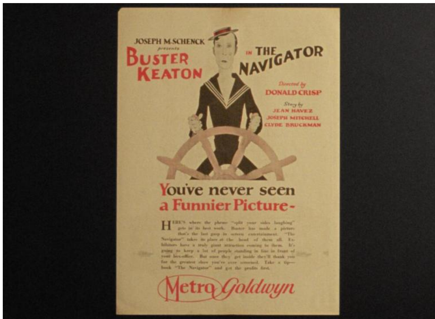
“The Navigator”, annuncio pubblicitario, “Exhibitors Trade Review”, 4 ottobre 1924.

Da Arca sovietica a star del cinema comico: prima che Teichner vi mettesse mano, questa “doppia vita” della Buford apparteneva soprattutto all’aneddotica keatoniana, o al massimo ai più attenti lettori di Wikipedia. E però, malgrado l’episodio fosse già stato menzionato nel 1987 da Kevin Brownlow e David Gill nel bellissimo documentario A Hard Act to Follow , le più recenti biografie dell’attore-regista, uscite all’inizio di quest’anno a poche settimane l’una dall’altra, sembrano sorvolare: Dana Stevens, nel pur notevole Camera Man. Buster Keaton, the Down of Cinema, and the Invention of Twentieth Century , lo ignora del tutto; mentre James Curtis, nel monumentale (oltre 800 pagine) Buster Keaton. A Filmmaker’s Life , lo confina in una nota in fondo al volume.