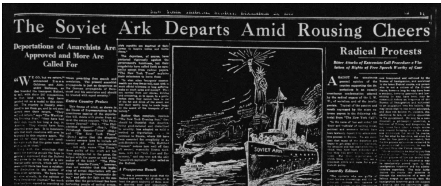
Pagina del "New York Tribune", domenica 23 dicembre 1919.

L'azione più spettacolare viene attuata negli ultimi mesi del 1919. Forte della recente approvazione di due nuove leggi assai discusse, l'Espionage Act e l'Immigration Act, il Dipartimento di Giustizia decreta che 249 persone, considerate a vario titolo "indesiderabili", vengano espulse dal Paese e deportate verso la Russia sovietica a bordo della Buford, che si guadagna per questa ragione il soprannome giornalistico di "Soviet Ark" (Arca sovietica) e di "Red Ark" (Arca rossa).