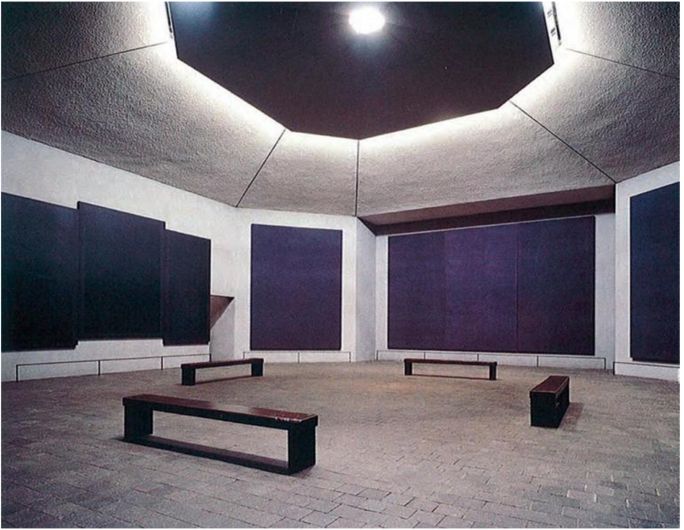
Rothko Chapel, interno, 1971.

Non si può ridurre tutto alle reazioni fotochimiche dei recettori stimolati dalla radiazione elettromagnetica che interagisce con la materia e al calcolo neuronale, mette sull'avviso Venturi nella postfazione. In cinque paragrafi, il curatore degli Scritti esplora la pittura di Rothko confrontandosi direttamente con le opere, sulla base dei numerosi studi dedicati a questo autore che rinnovò la pittura americana del secondo dopoguerra. Venturi ci guida tra le varie letture critiche dell'opera dell'artista precisando che ogni interpretazione alimenta la speranza di "cogliere quello che continua a sfuggirci" (p. 248). Ciò che "sfugge sempre in questa pittura", bisogna cercarlo nella pittura stessa.