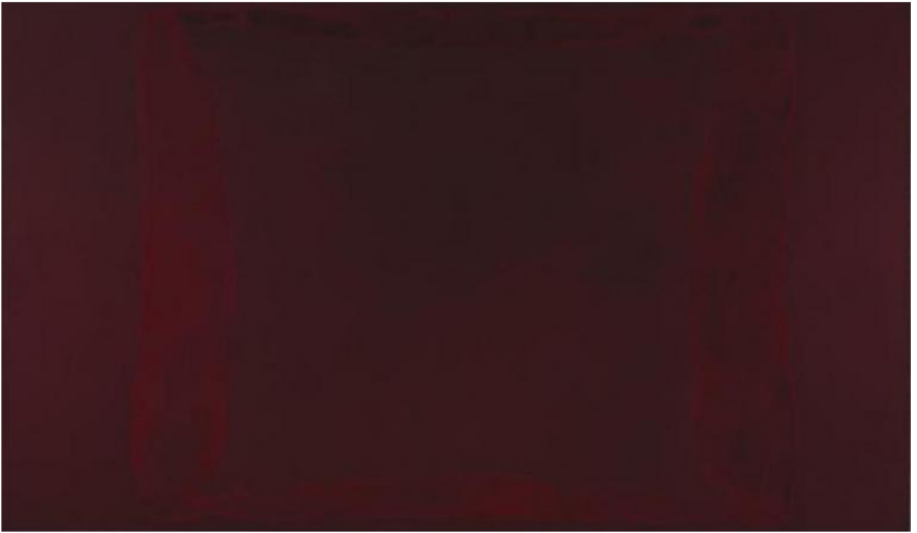
Mark Rothko, Red on Maroon, 1959, Seagram Murales, Tate Britain, Londra.

Nella pittura di Rothko il colore fluttua come quello filmare , trapassando da una tonalità all'altra. Il colore filmare è quello impalpabile della volta celeste, dell'arcobaleno e della nebbia fitta. Per percepirlo nelle opere dell'artista è necessario porsi a una distanza di 18 pollici (45,72 cm) dalla superficie della tela, in modo che il campo visivo sia totalmente occupato dalla campitura di colore (p. 134).