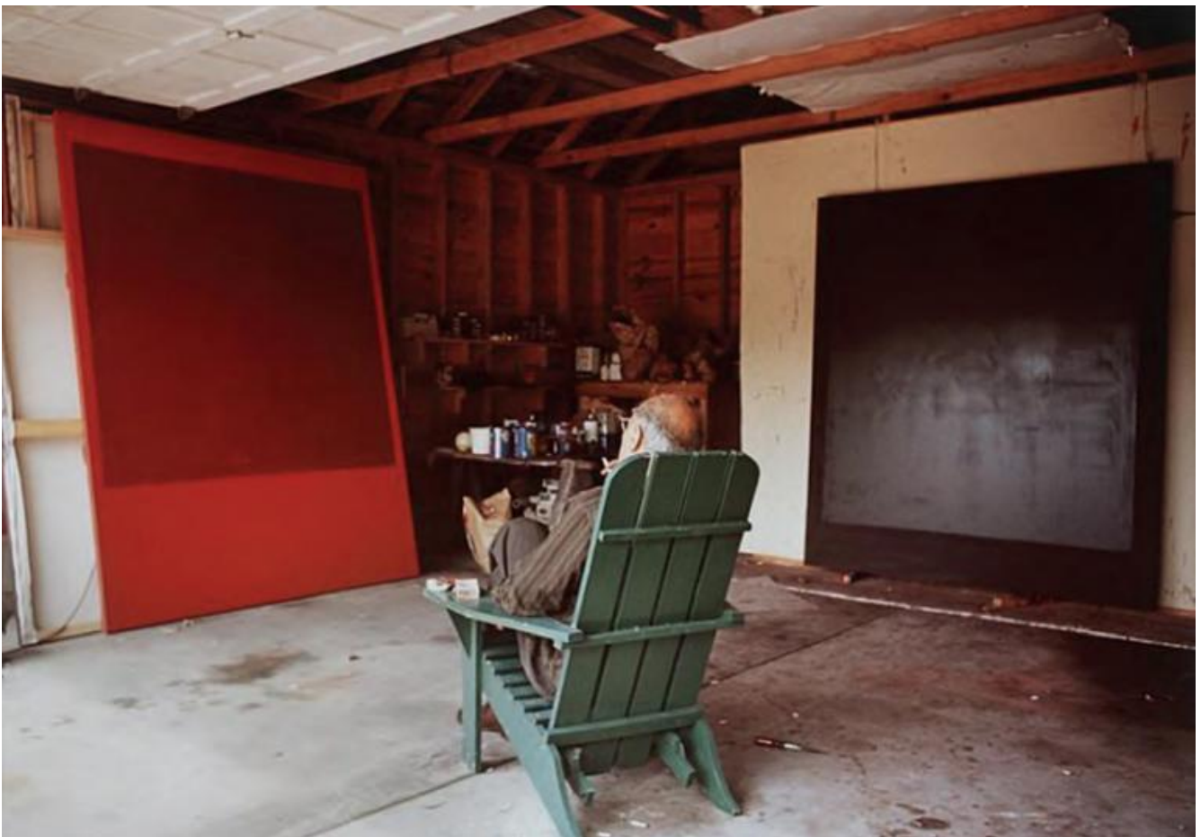
Mark Rothko nel suo studio nell'East Hampton, 1964.

Lo storico dell'arte nota anche una polarità tra la pulsazione del colore e la struttura compositiva dell'opera, ponendola in rapporto a due "geometrie dello sguardo": la visione ravvicinata e a distanza, la prima esemplificata dalla fotografia scattata da Kay Bell Reynal, dove Rothko sembra affacciarsi a una finestra aperta sull'infinito, la seconda dalla fotografia scattata da Hans Namuth, che mostra l'artista seduto su una poltrona mentre contempla una sua opera da alcuni metri di distanza. Rothko si allontana per cogliere la struttura compositiva, o si avvicina per immergersi nel colore che si espande, fluttua, palpita e respira.