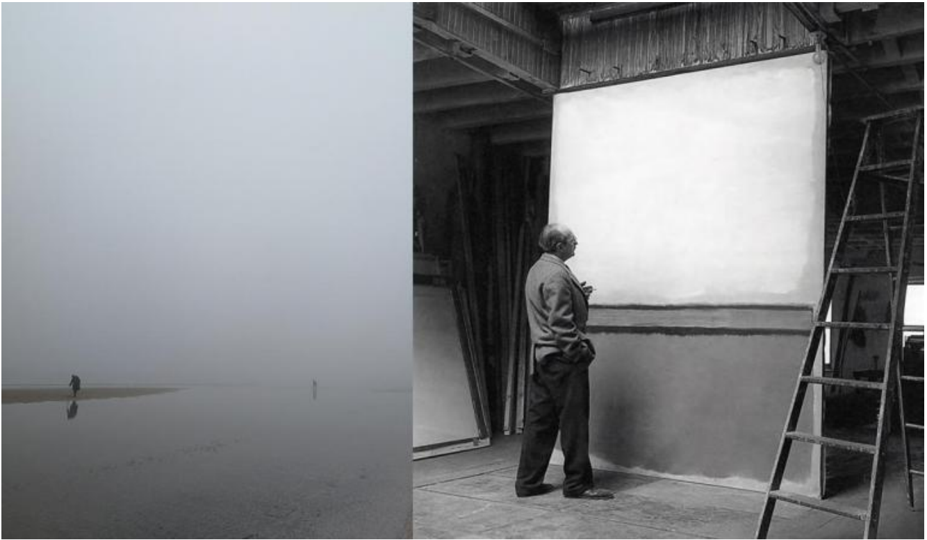
Lido di Ravenna nella nebbia, 31 dicembre 2021 / Rothko nel suo studio sulla 53a strada, davanti a No. 25, 1951. Foto di Kay Bell Reynal, 1952.

La tinta o tonalità è invece la sensazione visiva prodotta in noi da ciascuna lunghezza d'onda della luce dello spettro visibile. Per esempio vediamo il blu se la lunghezza d'onda è tra i 465 e i 482 nm, il rosso se la frequenza è tra i 620 e i 680 nm. Il passaggio da una tonalità all'altra corrisponde a una variazione della lunghezza d'onda della luce, che è repentina nella regione centrale dello spettro visivo e lenta ai suoi lati (sopra i 600 nm: arancione rossastro, rosso, rosso profondo; sotto i 500 nm: verde bluastrò, blu verdastro, blu, indaco, violetto). In queste regioni periferiche dello spettro visivo la tonalità del colore cambia lentamente mentre diminuisce rapidamente la sua luminosità o brillanza , come i colori cupi dei 14 dipinti site-specific della Rothko Chapel , commissionati da John e Dominique de Mènil. La lentezza con la quale un tono trascorre nell'altro induce un atteggiamento meditativo.