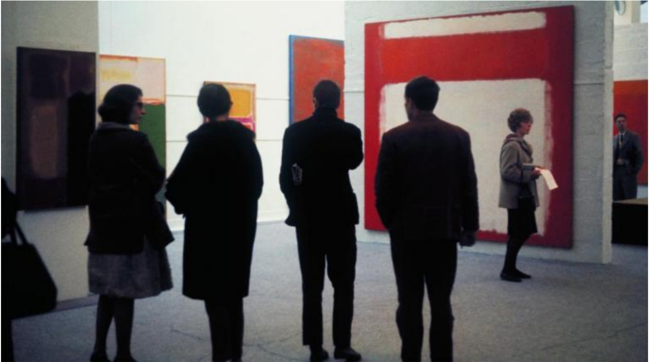
Veduta della mostra personale di Mark Rothko alla Whitechapel Gallery di Londra, 1961.