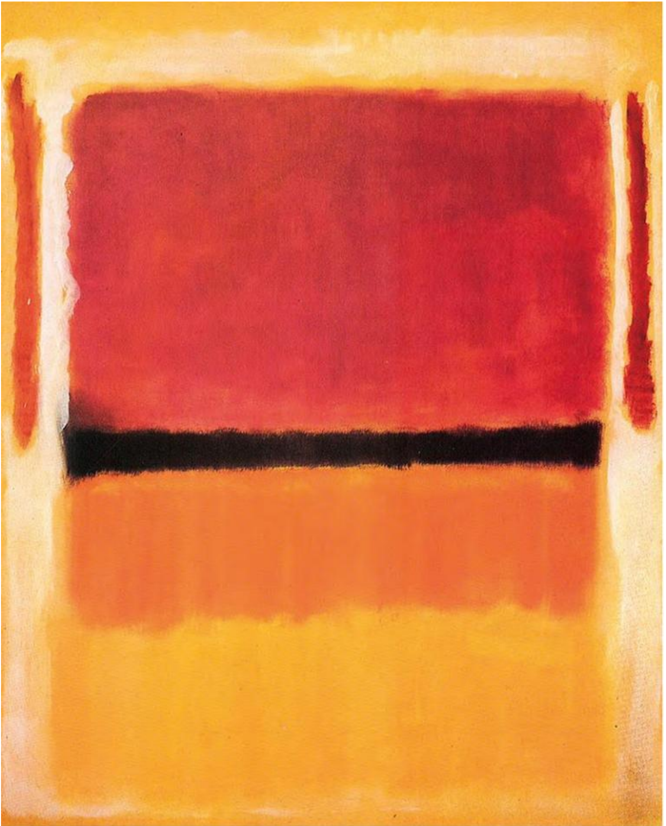
Mark Rothko, Untitled (Violet, Black, Orange, Yellow on White and Red), 1949, Solomon Guggenheim Museum, New York.