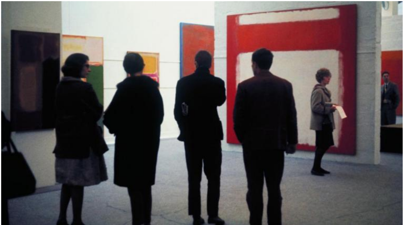
Veduta della mostra personale di Mark Rothko alla Whitechapel Gallery di Londra, 1961.

1961, era stata allestita una mostra dedicata all'artista americano. Spegndo le luci: il colore di Rothko si illuminava da solo: effetto, una volta adattata la retina, era indimenticabile, ardente, risplendente e raggiante delicatamente dal muro» (p. 170).